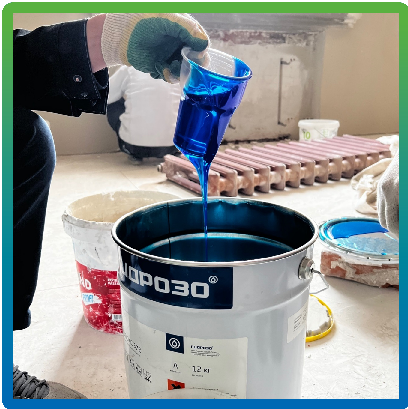
Клей Манокс 372