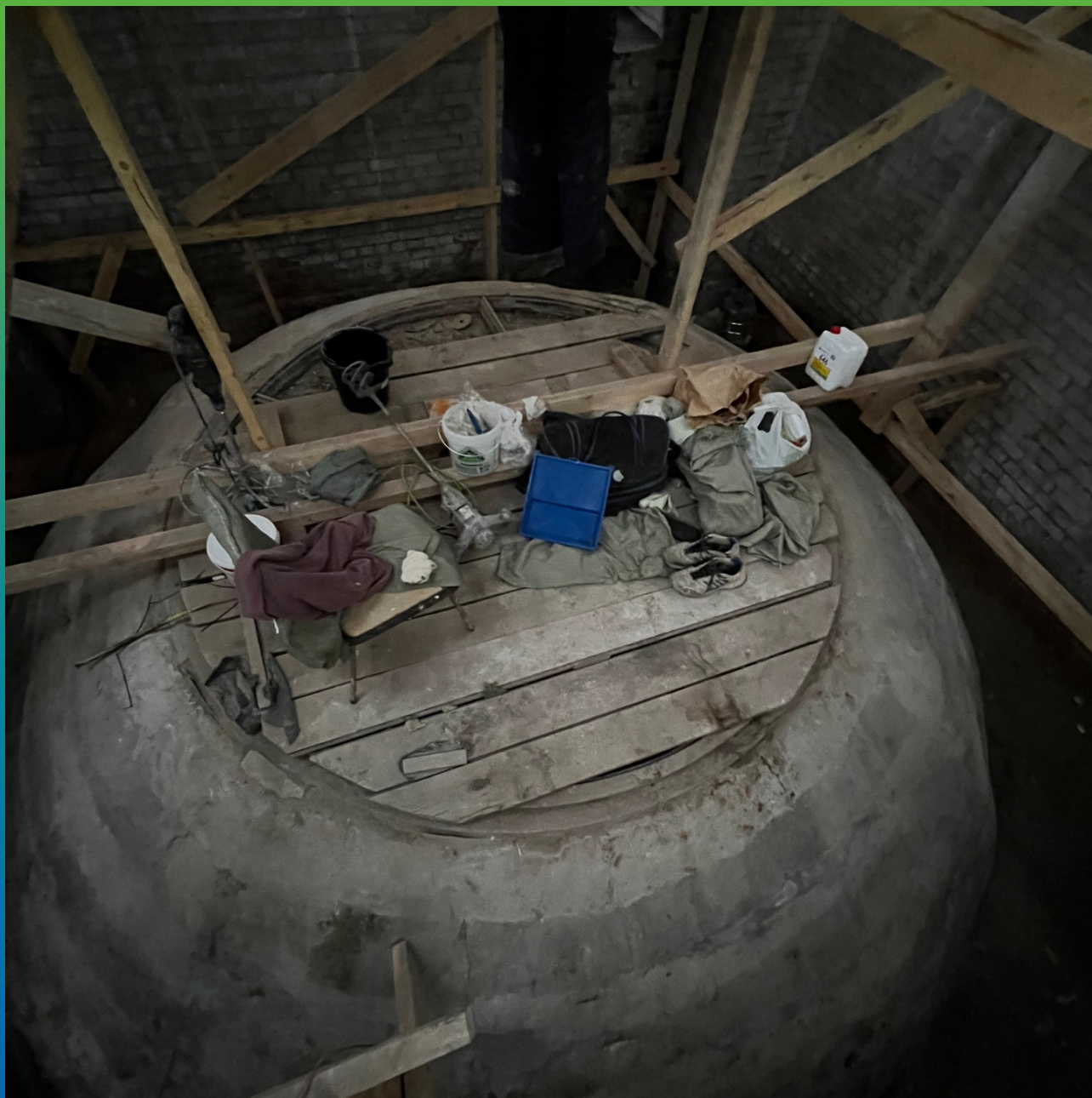
Внешняя часть купола, подготовленная для монтажа Армошел КВ 500