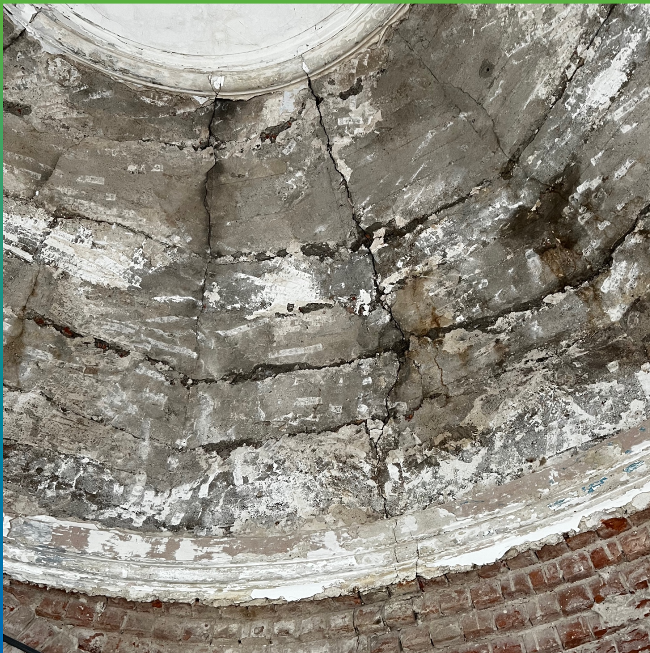
Вид купола до проведения ремонтных работ