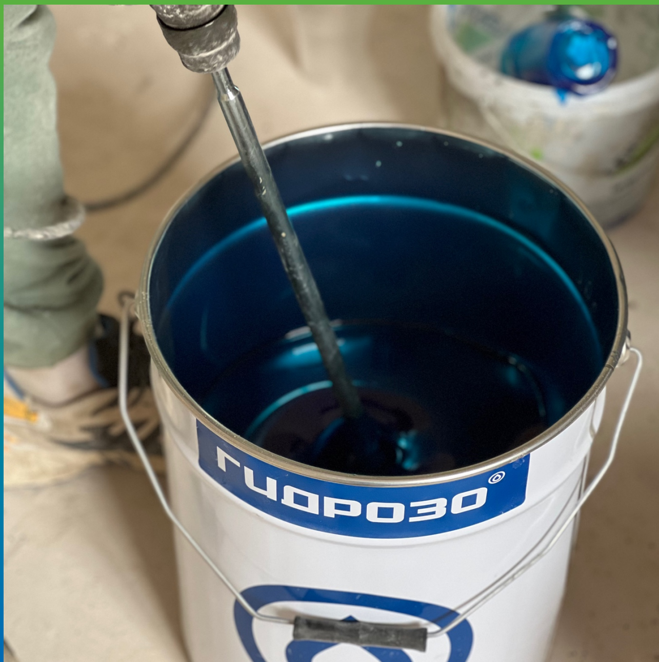
Перемешивание двух компонентов Манопокс 372