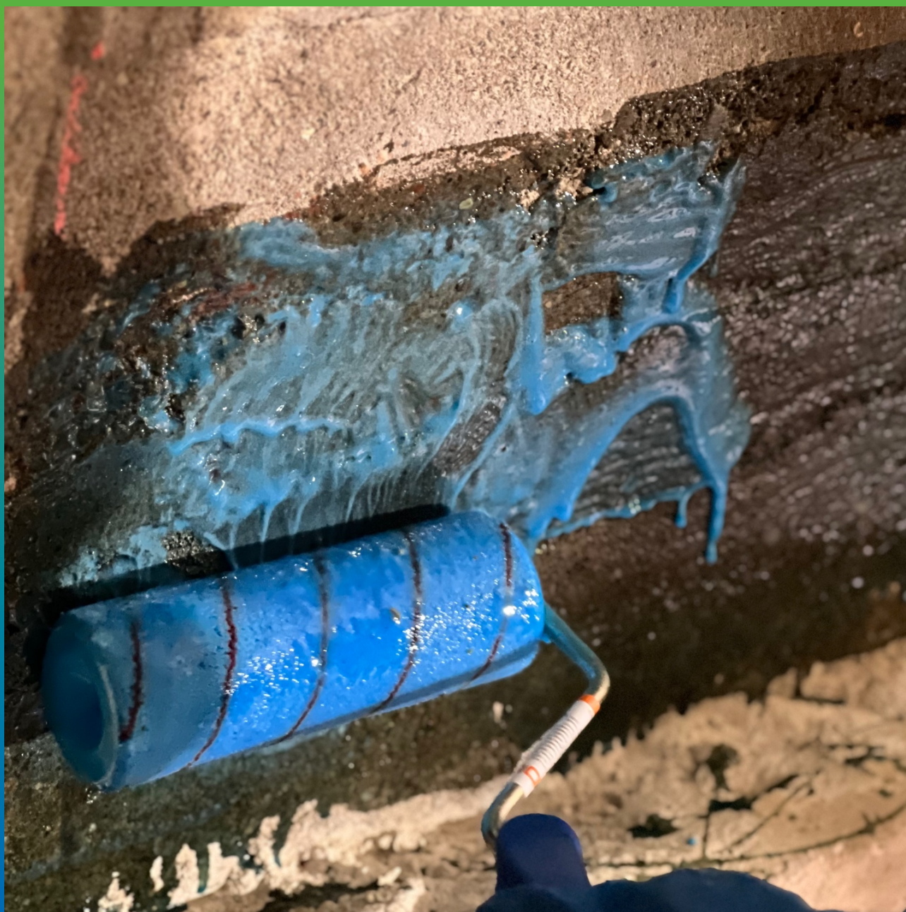
Нанесение шпаклевочно-грунтовочного слоя манопкс 372+ Манопкс Тикс