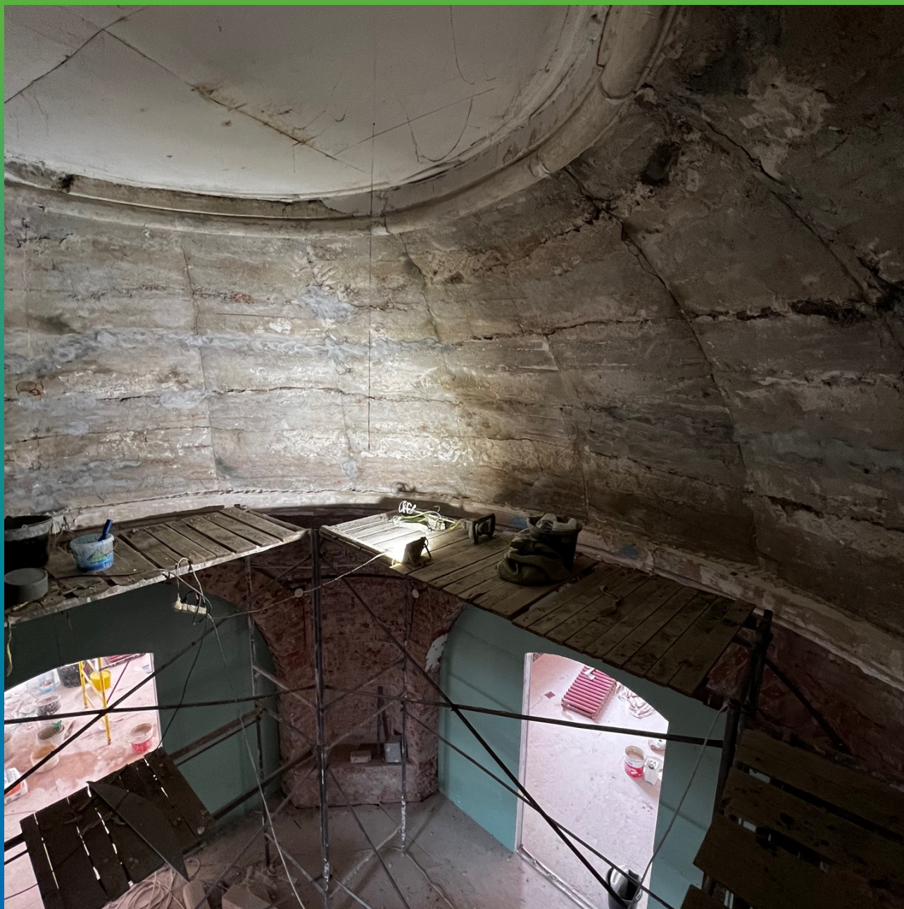
Вид купола после проведения локального ремонта поверхности, попадающей под монтаж Армошел КВ 500