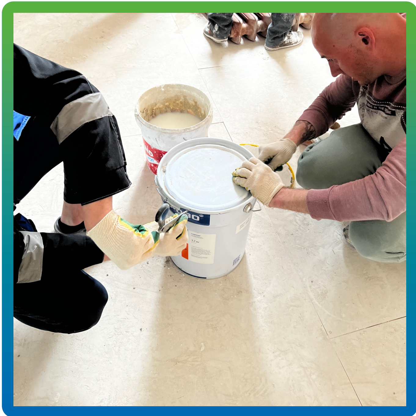
Подготовка клея Манопокс 372