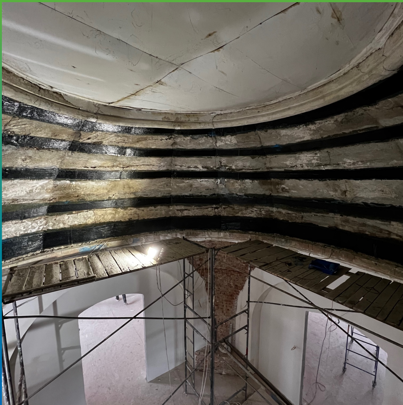
Вид внутренней части купола с монтированной системой Армошел КВ 500