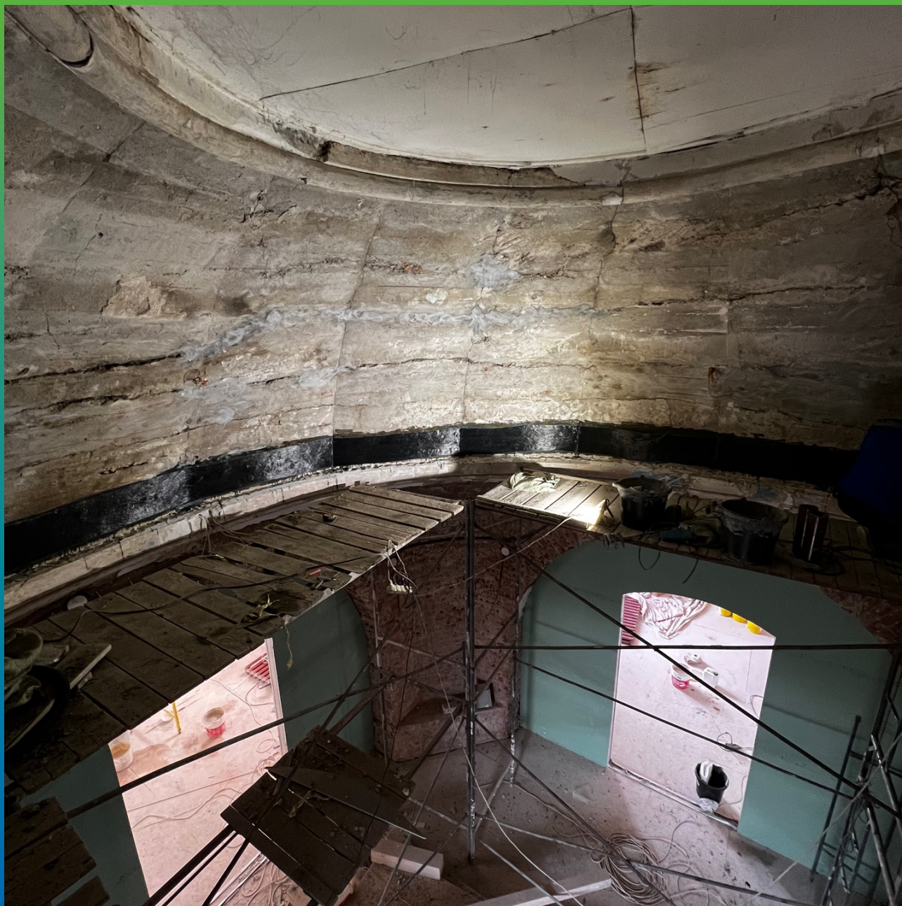
Монтаж системы усиления Армошел КВ 500