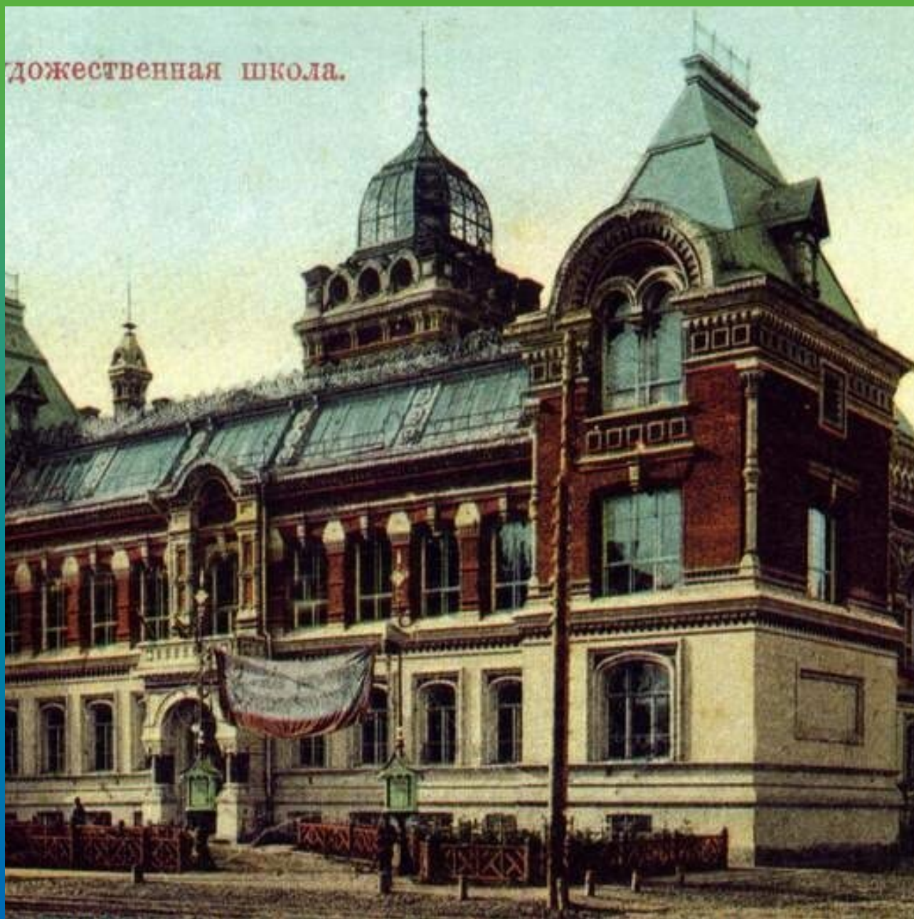
Здание училища 1905 г.