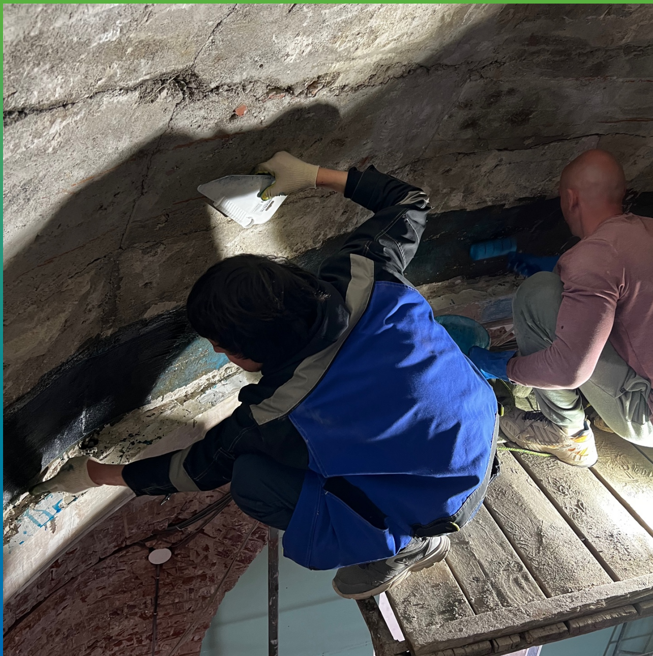
Монтаж системы усиления Армошел KB 500