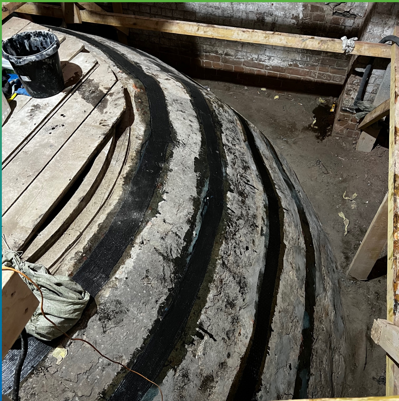
Нанесение продольных полос Армошел КВ 500