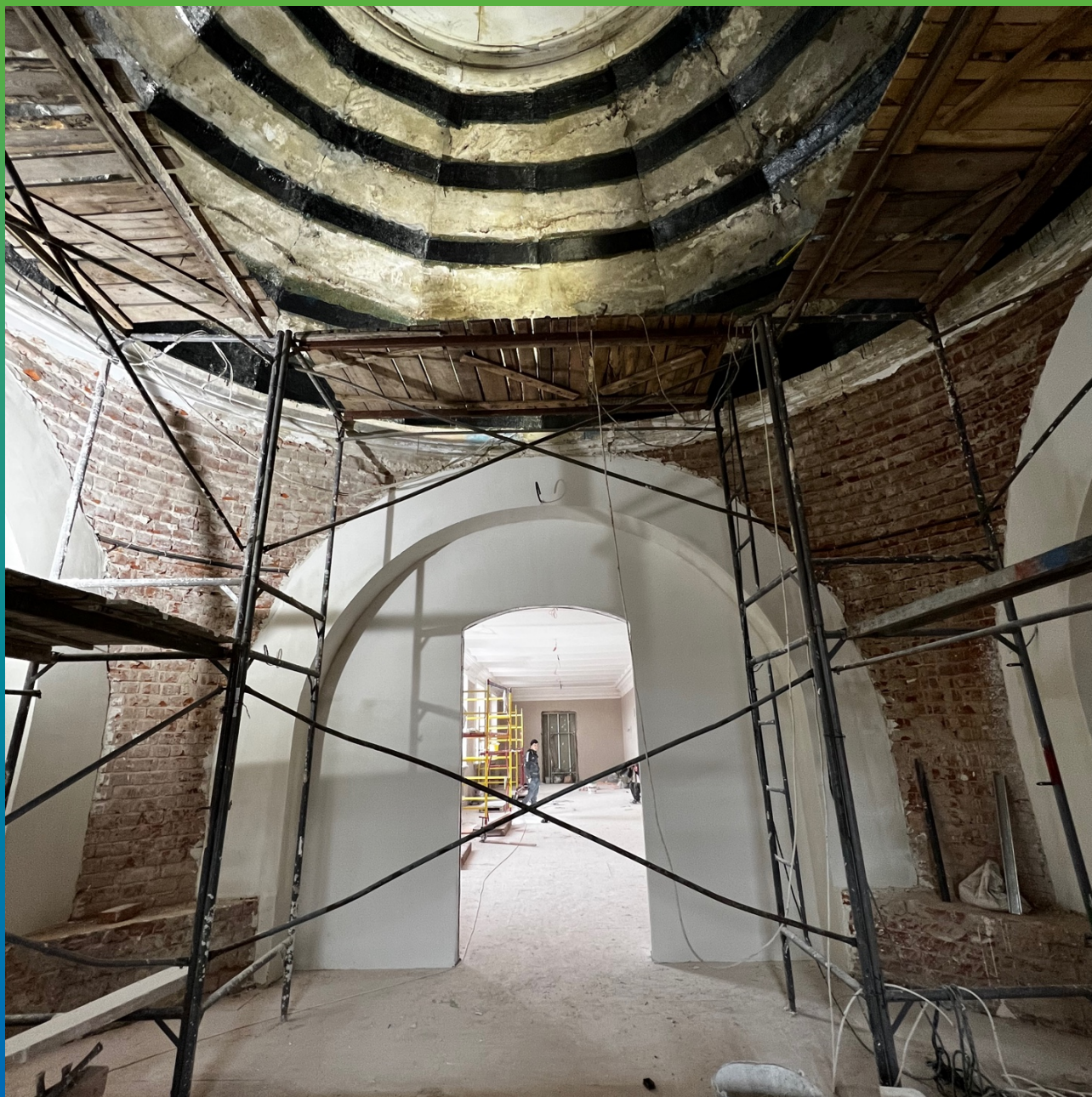
Вид внутренней части купола с монтированной системой Армошел КВ 500