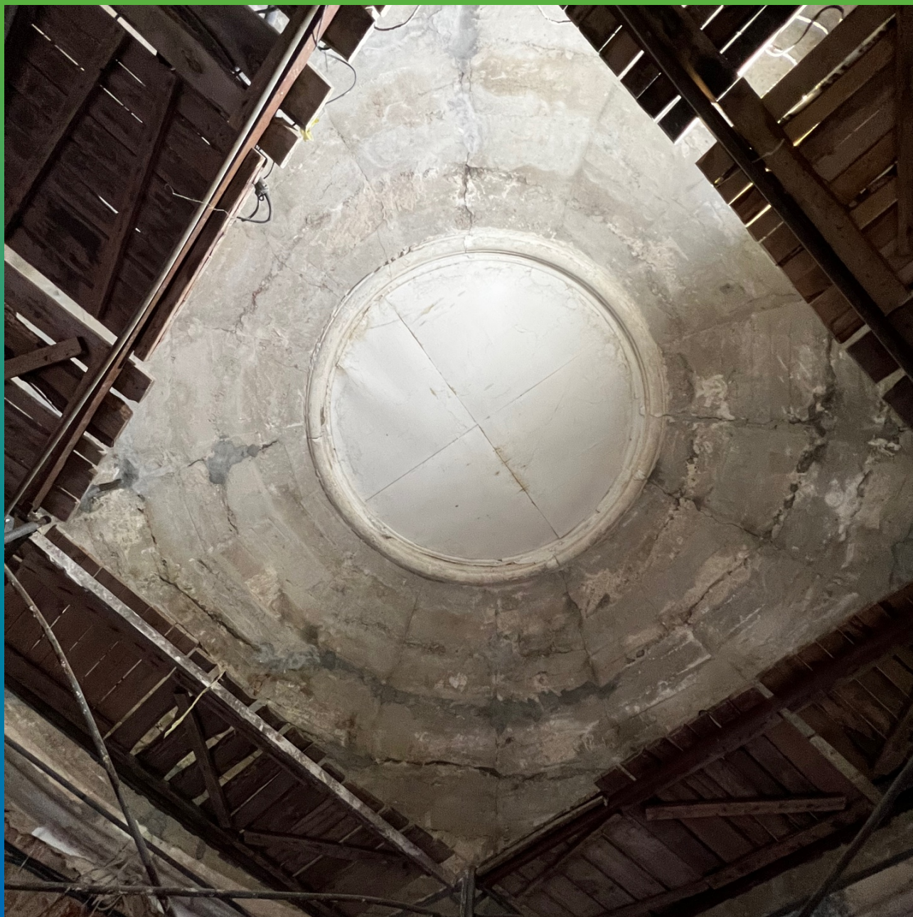
Вид купола после проведения локального ремонта поверхности, попадающей под монтаж Армошел КВ 500