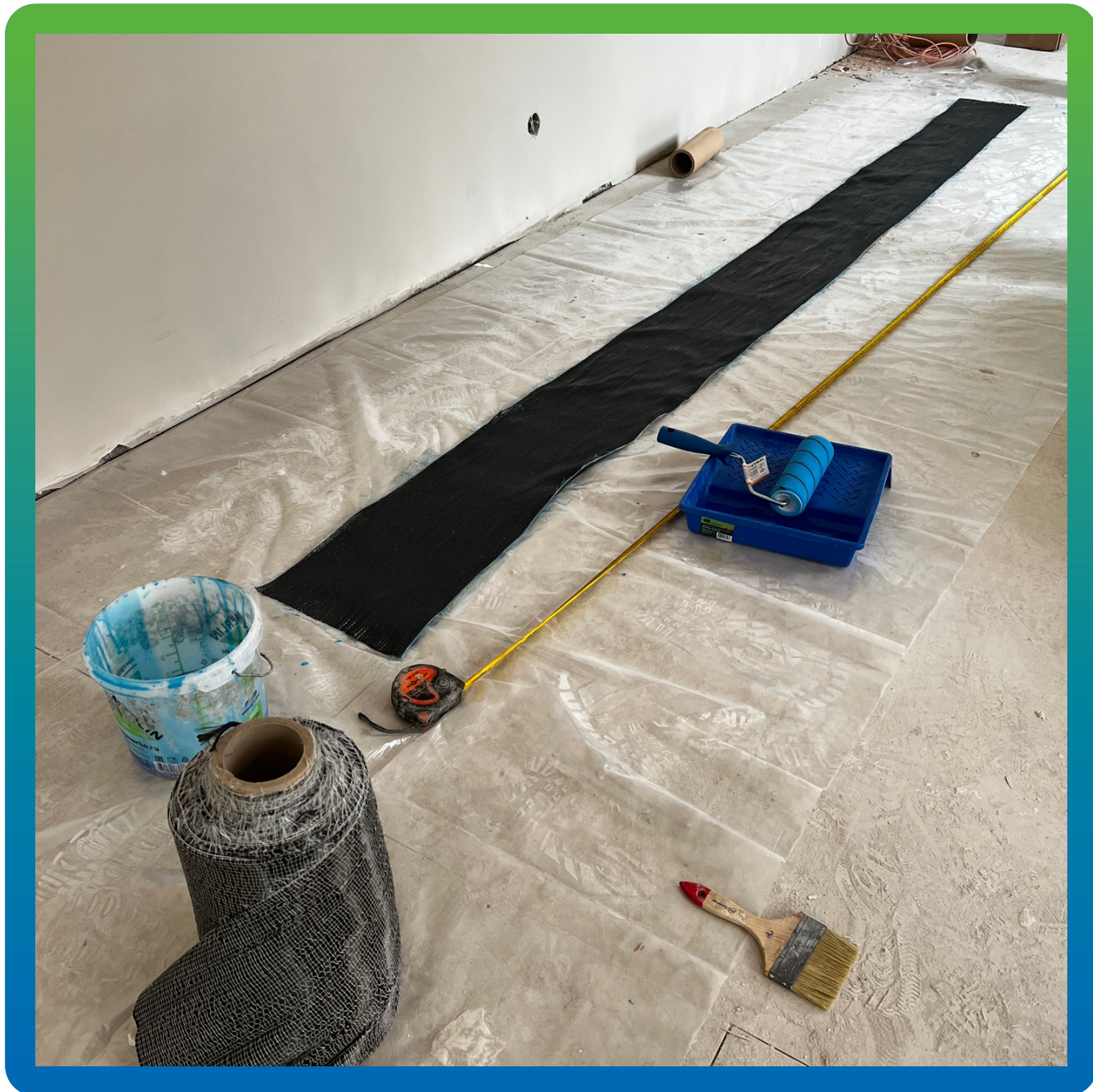
Нарезка холста Армошел КВ 500 на полосы необходимой длины