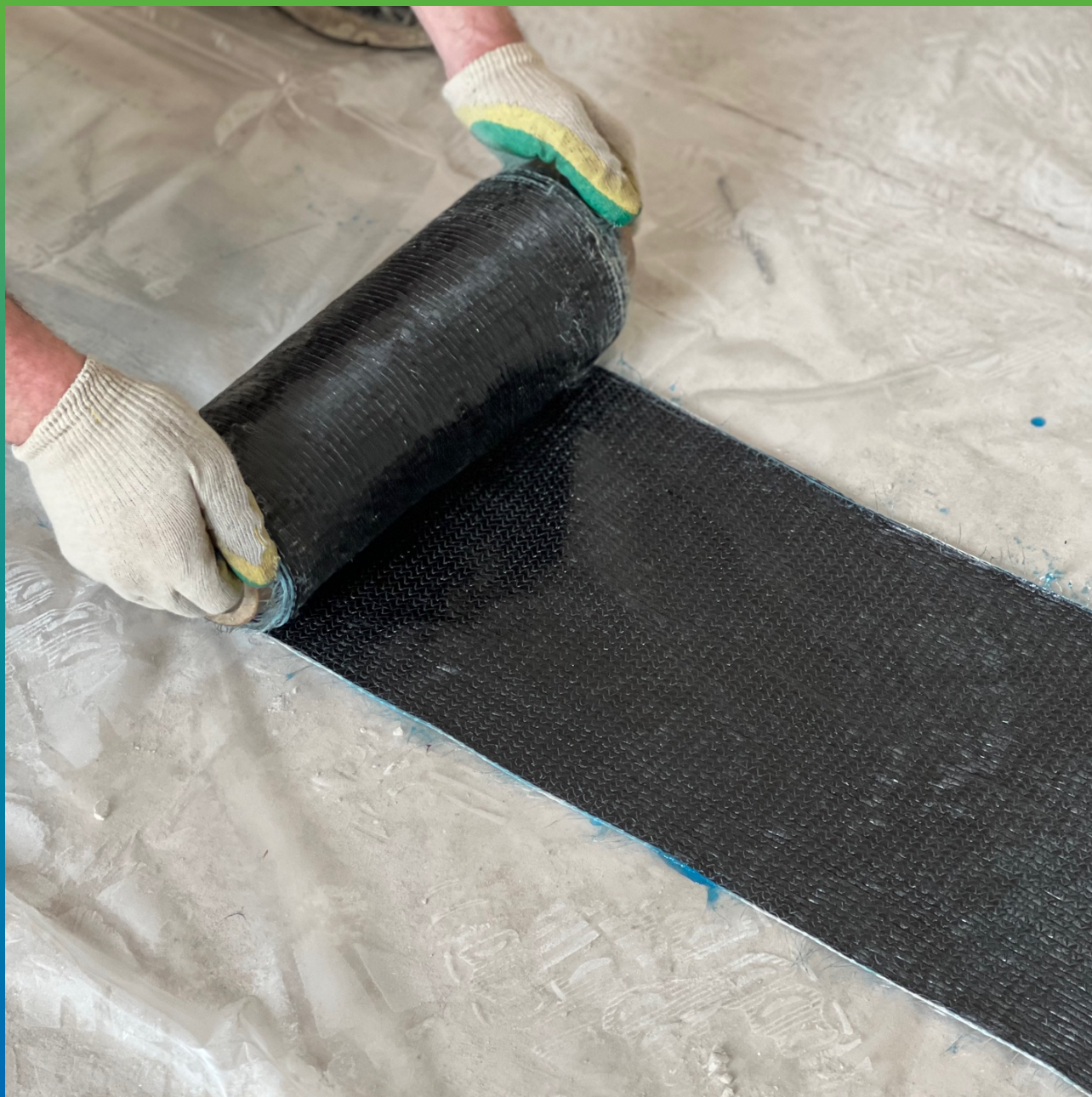
Подготовка пропитанного клеем холста к монтажу