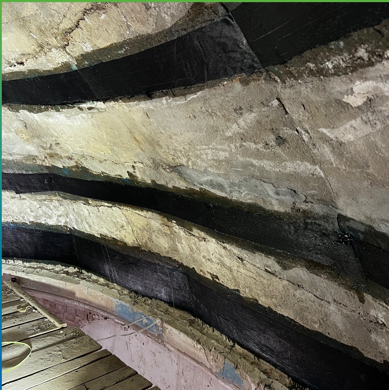
Монтаж системы усиления Армошел KB 500