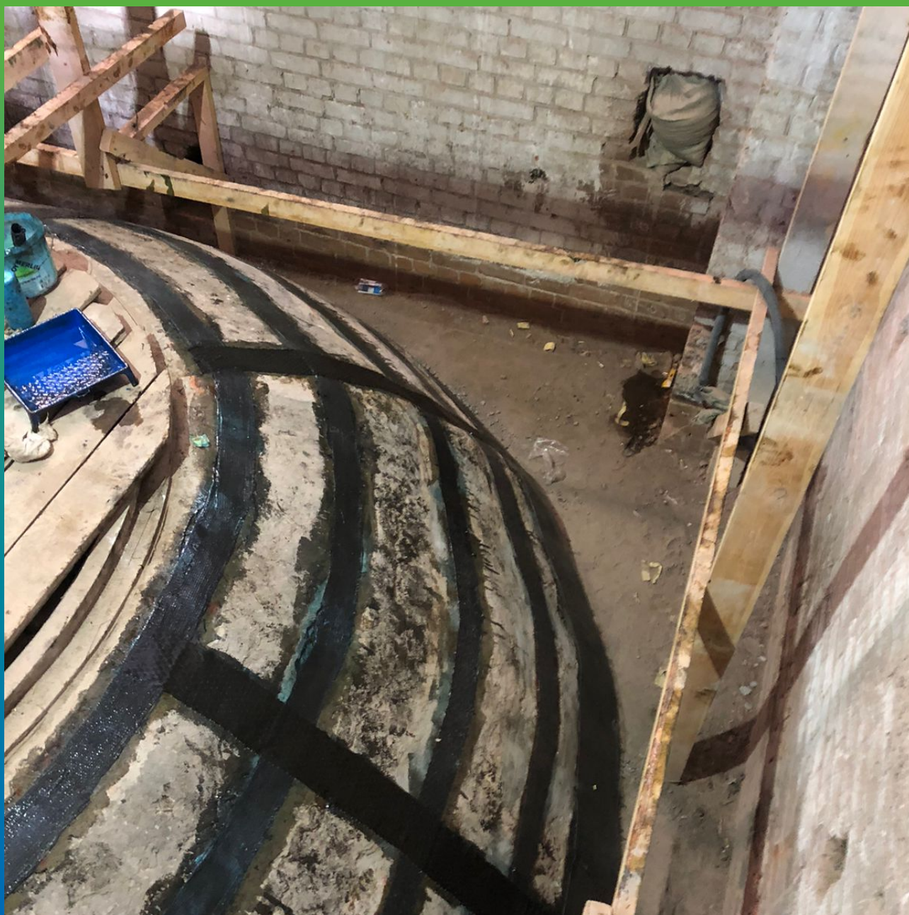
Нанесение поперечных полос Армошел КВ 500 (финишный вид)