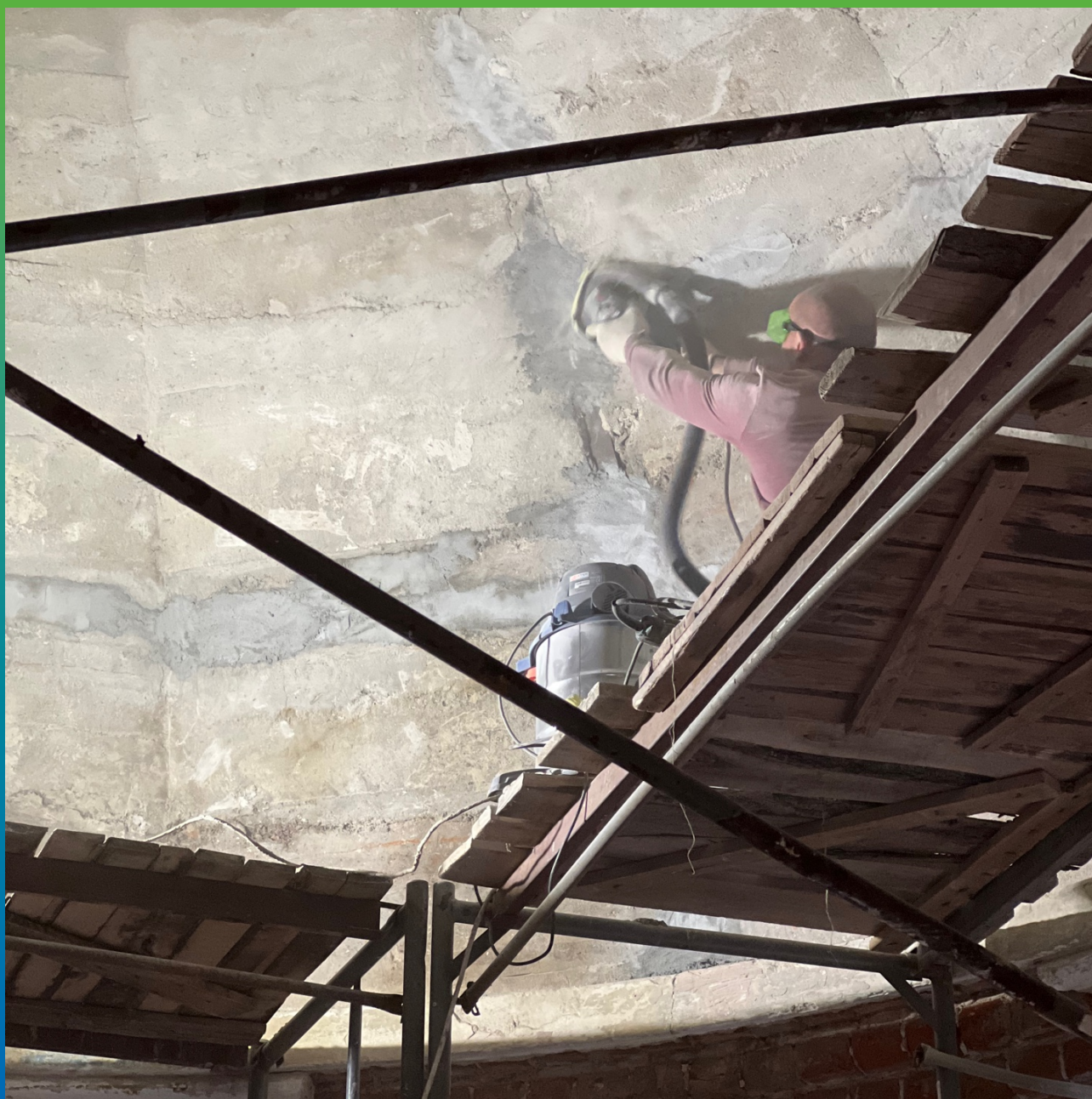
Шлифовка поверхности, попадающей под монтаж Армошел КВ 500