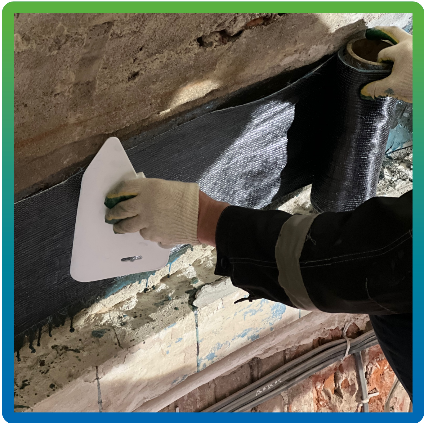
Монтаж системы усиления Армошел KB 500