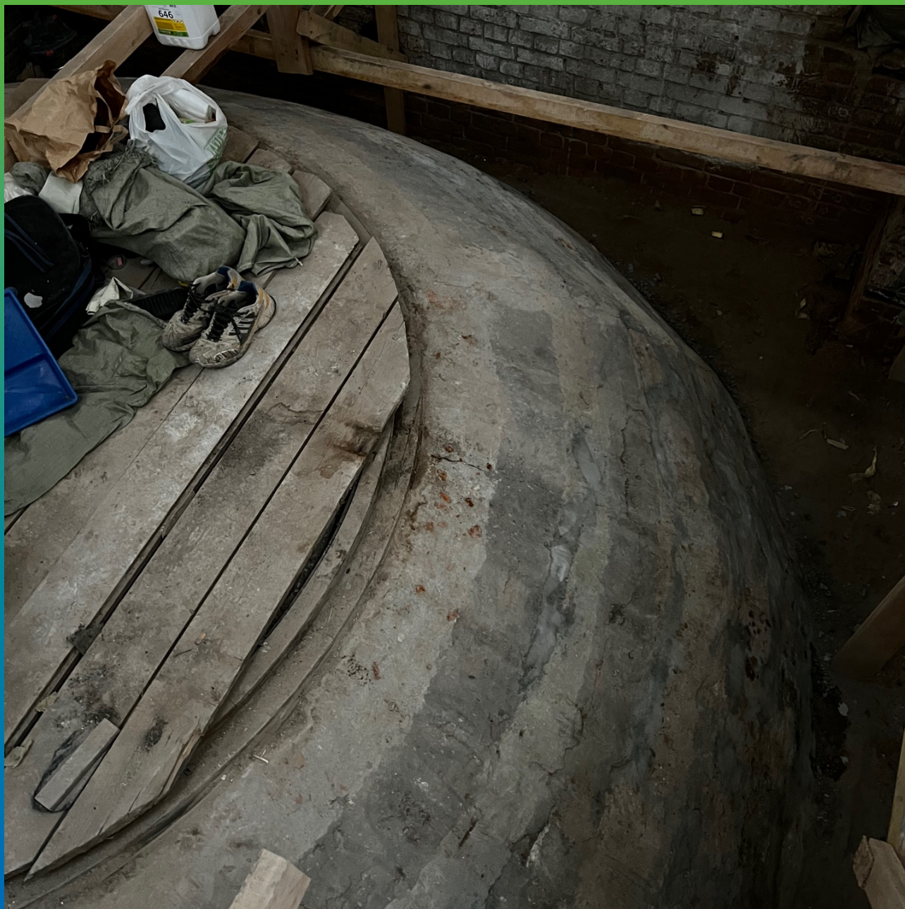
Внешняя часть купола, подготовленная для монтажа Армошел КВ 500