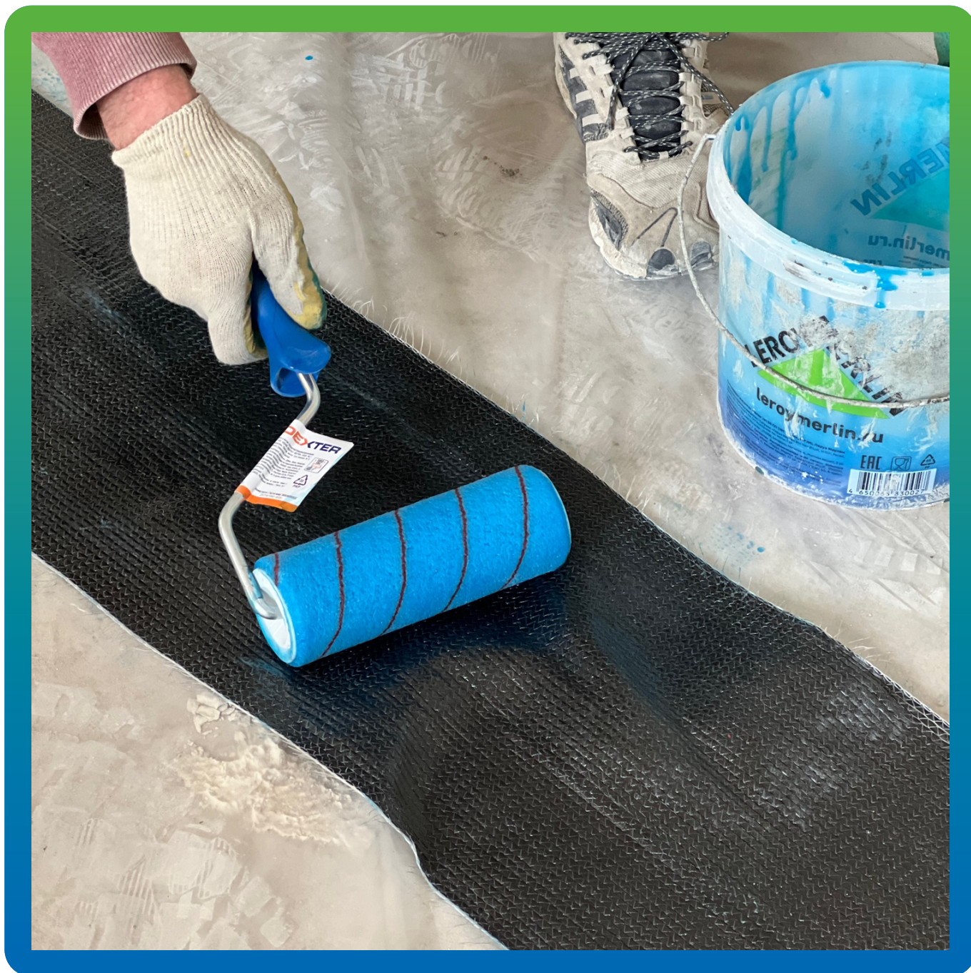
Пропитка холста Армошел КВ 500 клеем Манопокс 372