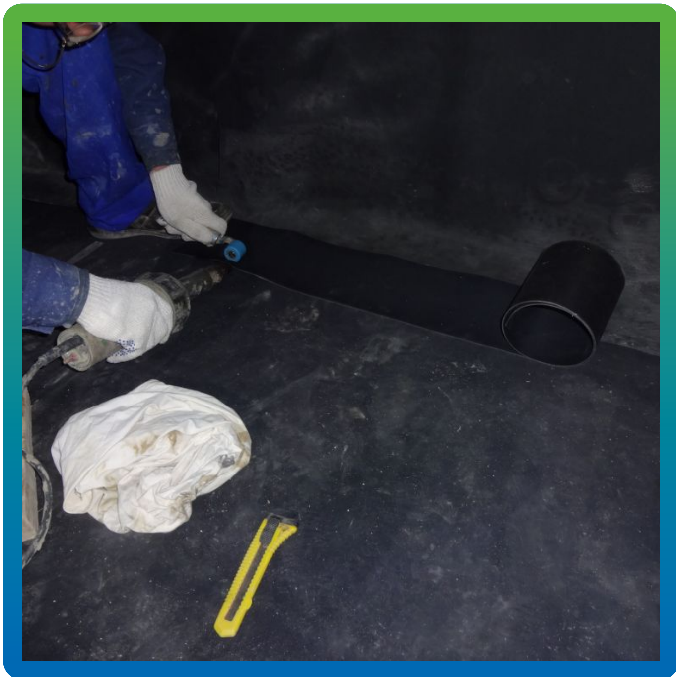
Стыковка карт между собой системой Термобонд