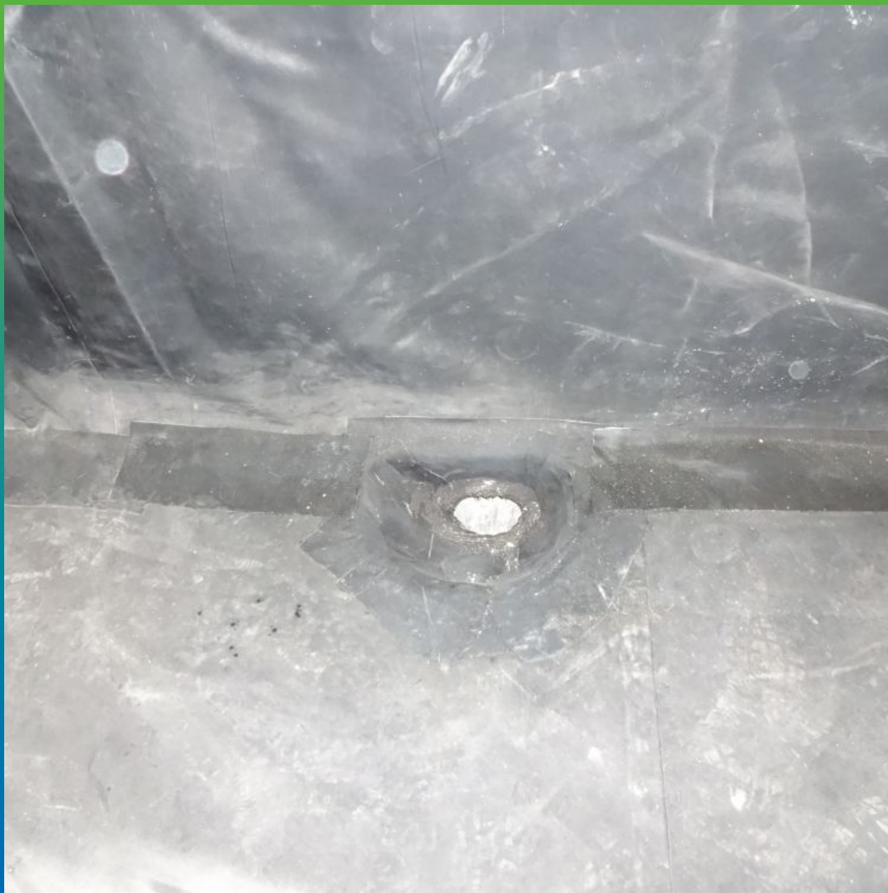
Швы сваренные по методу Термобонд