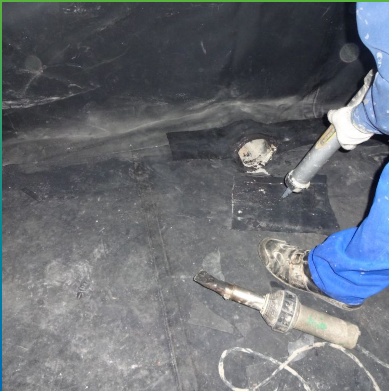
Герметизация сливной воронки герметиком Витрафин Бонд-Ф