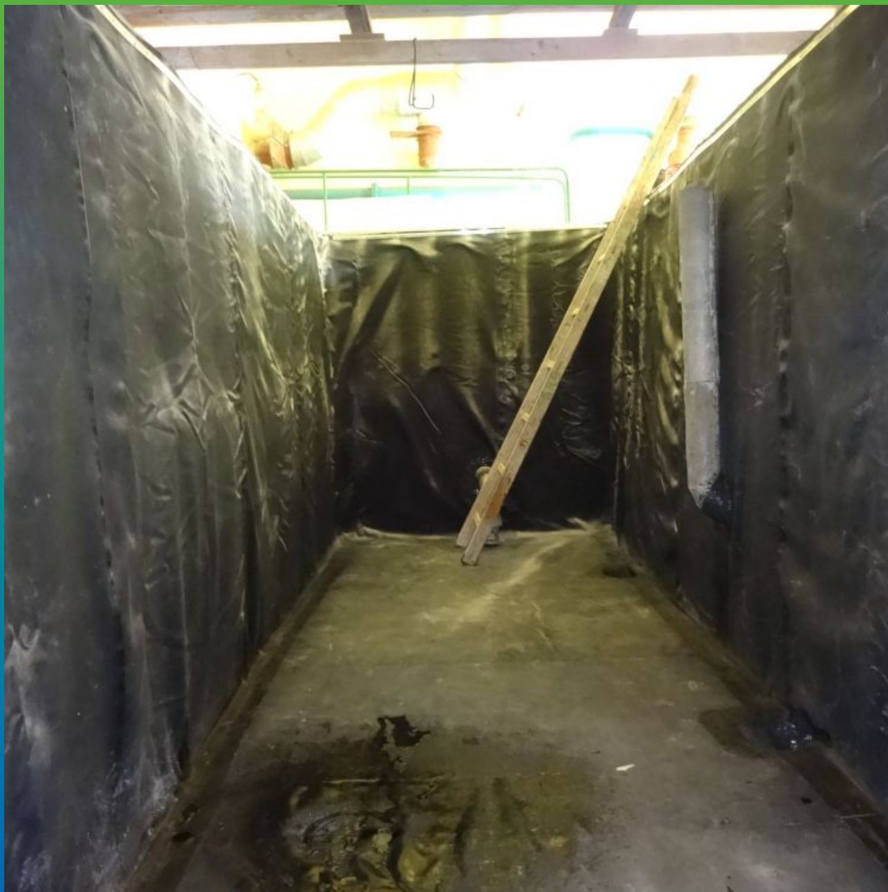
Объект после реконструкции