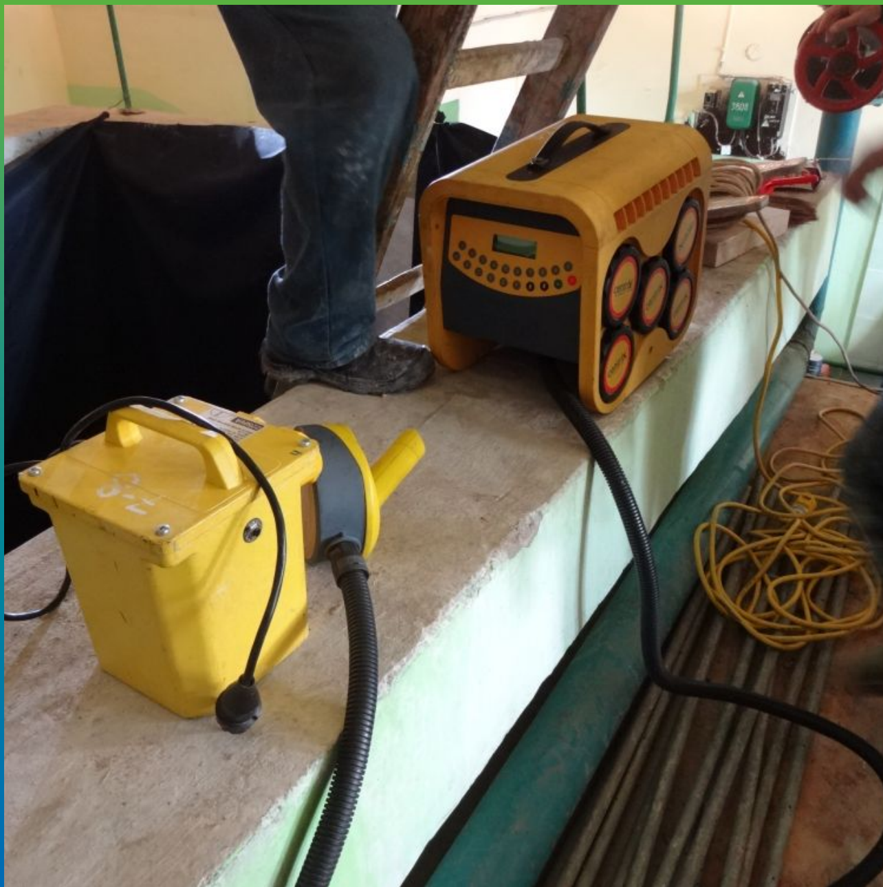
Подготовка и настройка машинки Центрикс