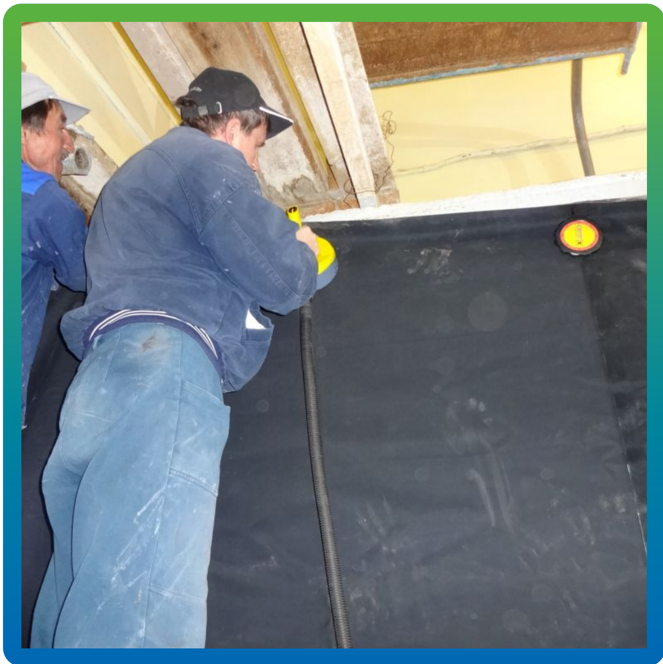
Крепление без проколов мембраны к основанию методом Центрикс