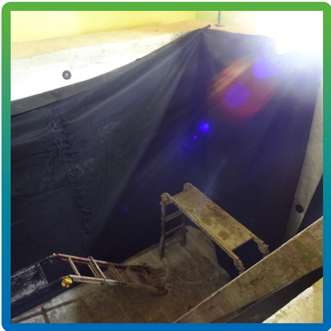
Укладка геотекстиля, монтаж шайб Центрикс