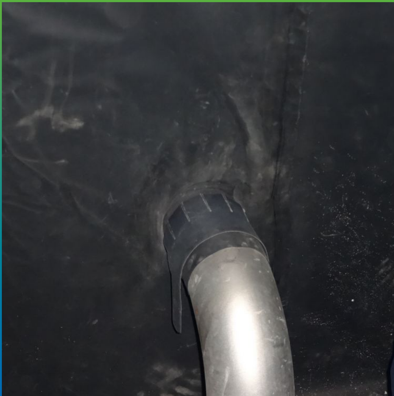
Герметизация системой Термобонд всасывающей магистрали