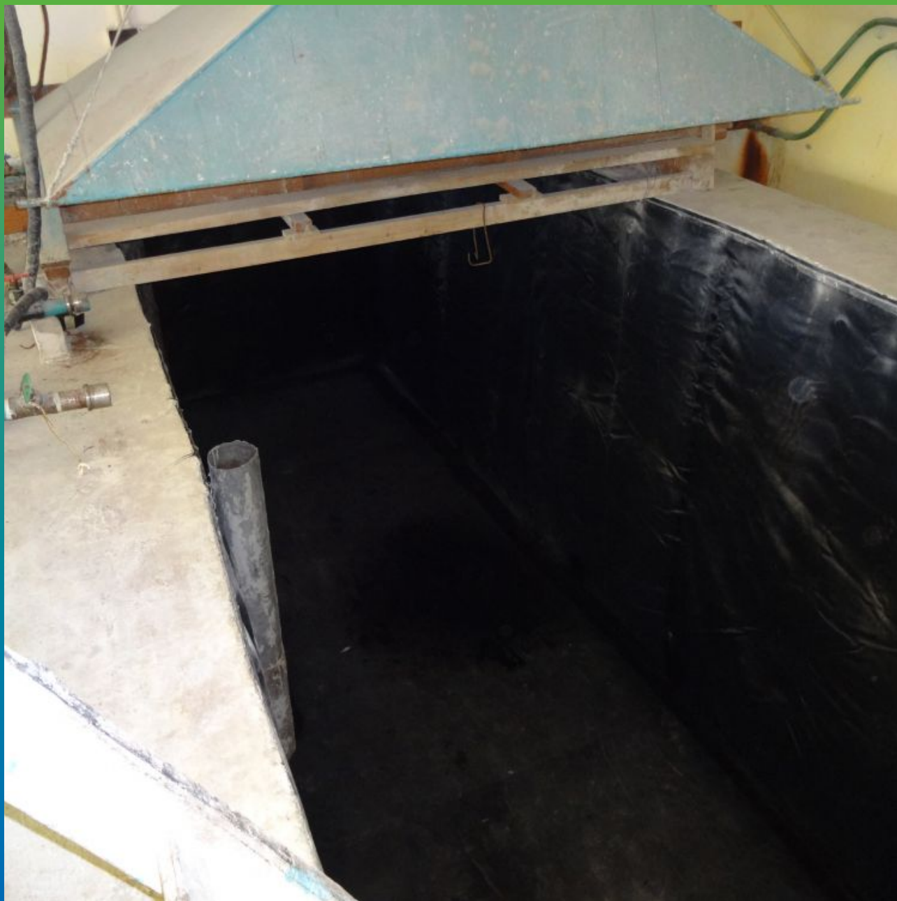
Объект после реконструкции