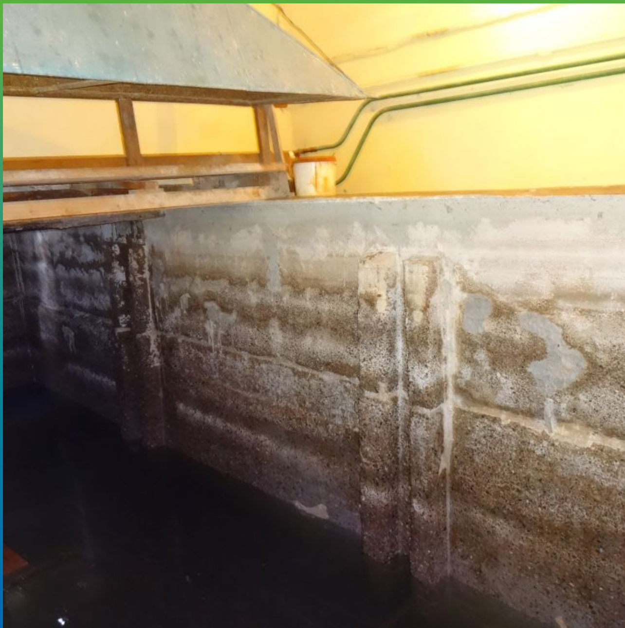
Вид объекта до реконструкции