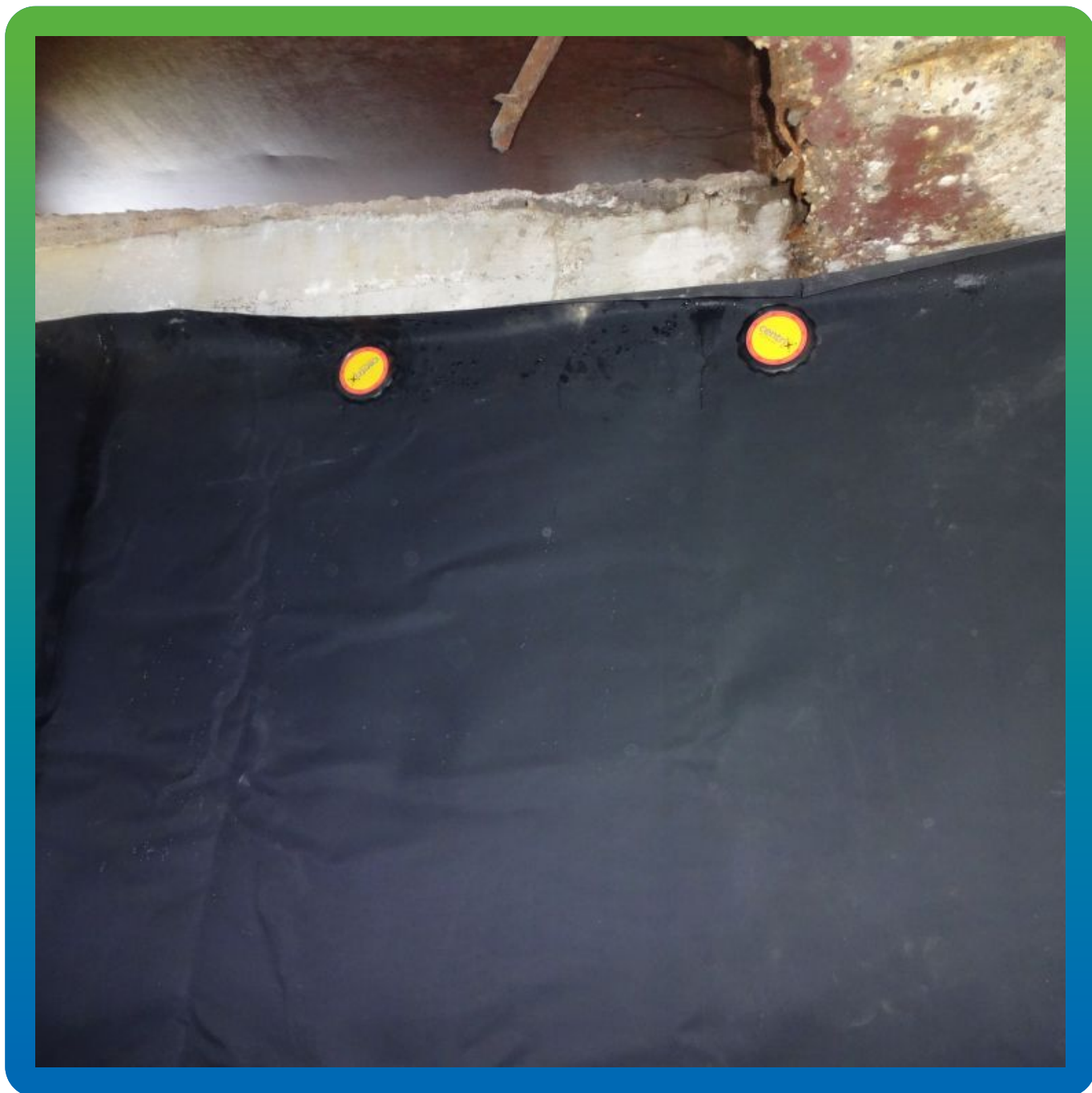
Крепление мембраны к основанию (без проколов) методом Центрикс