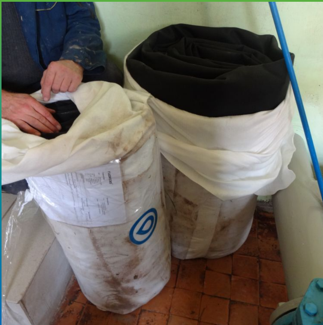
Две карты сваренные для данного объекта