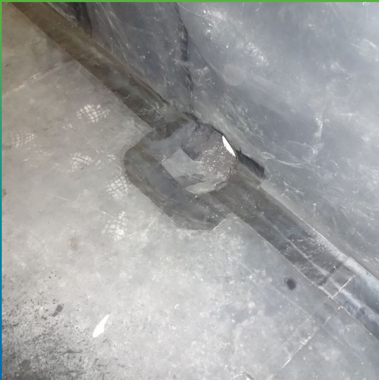
Сваренные между собой карты по системе Термобонд