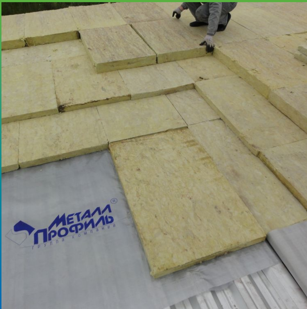
Монтаж базальтовых плит утеплителя