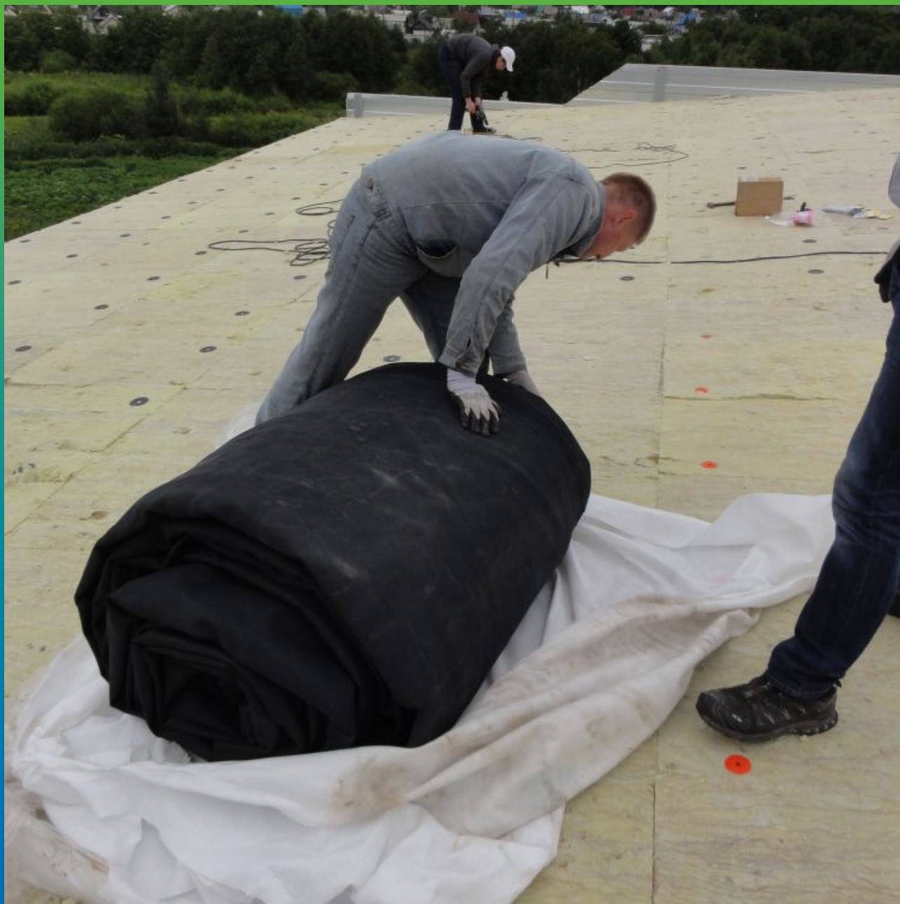
Карта из ЭПДМ мембраны Эластосил Т 1,2 мм под размеры кровли