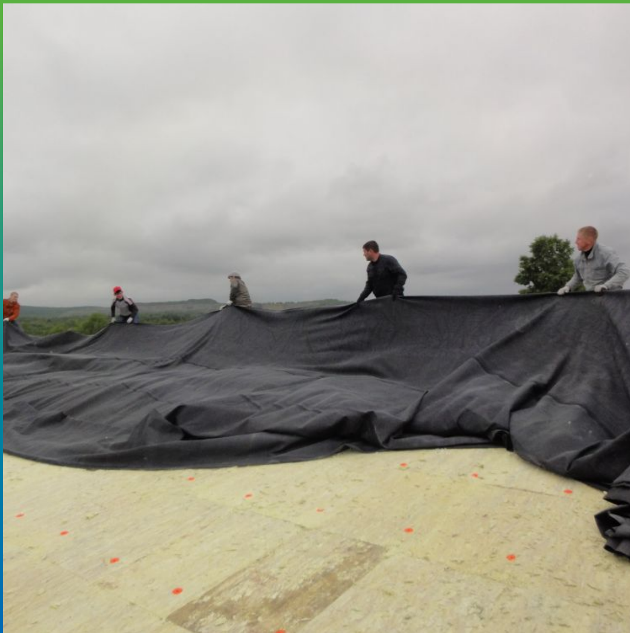
Укладка карты из ЭПДМ согласно схеме раскроя