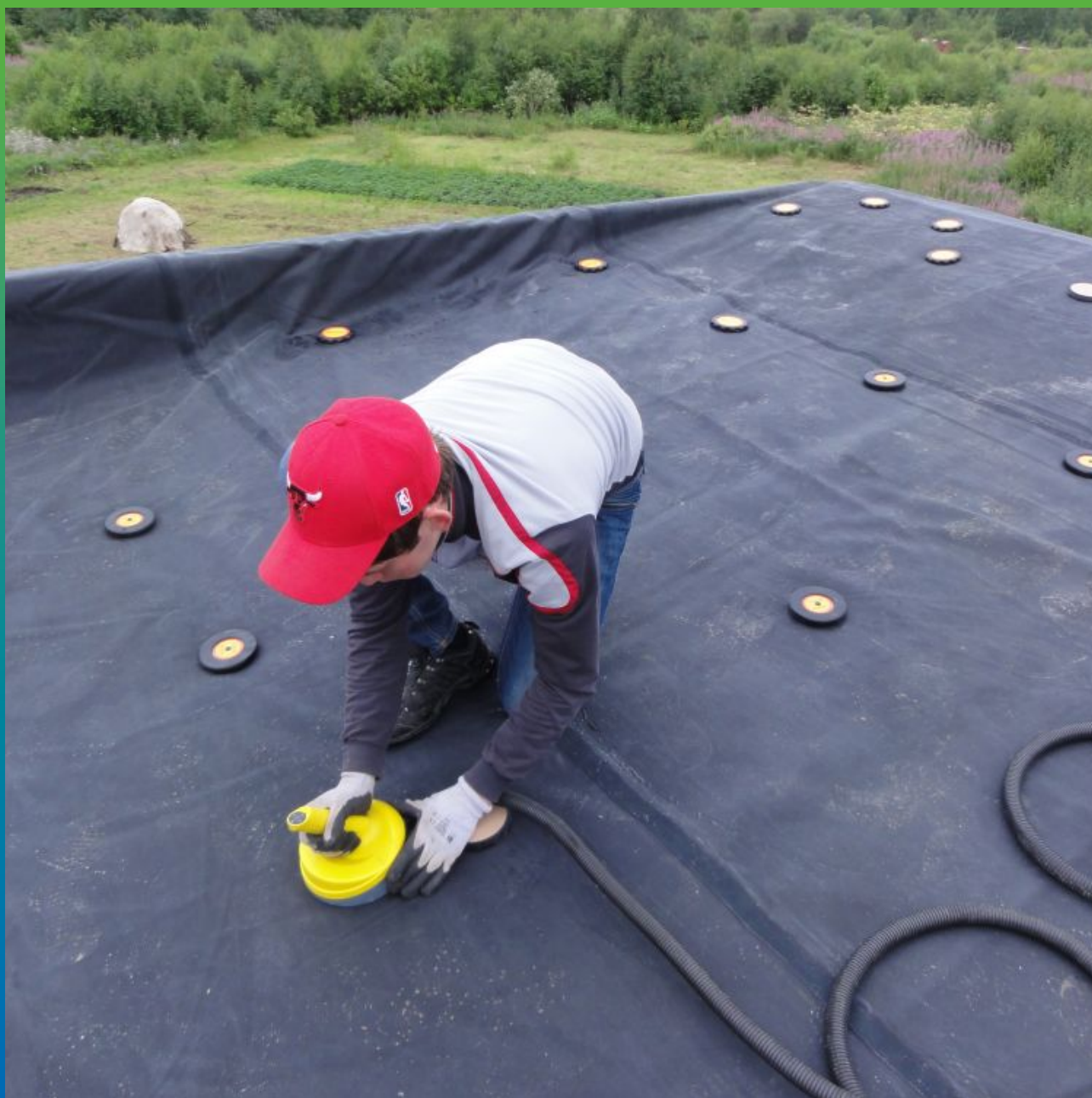
Механическое крепление ЭПДМ мембраны по системе Центрикс "без прокола"