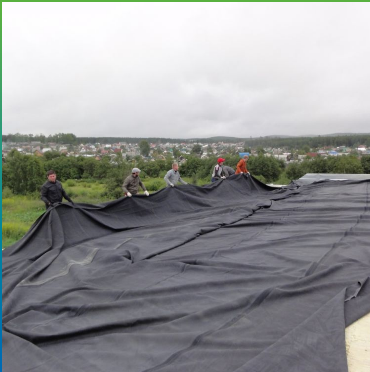
Укладка карты из ЭПДМ согласно схеме раскроя