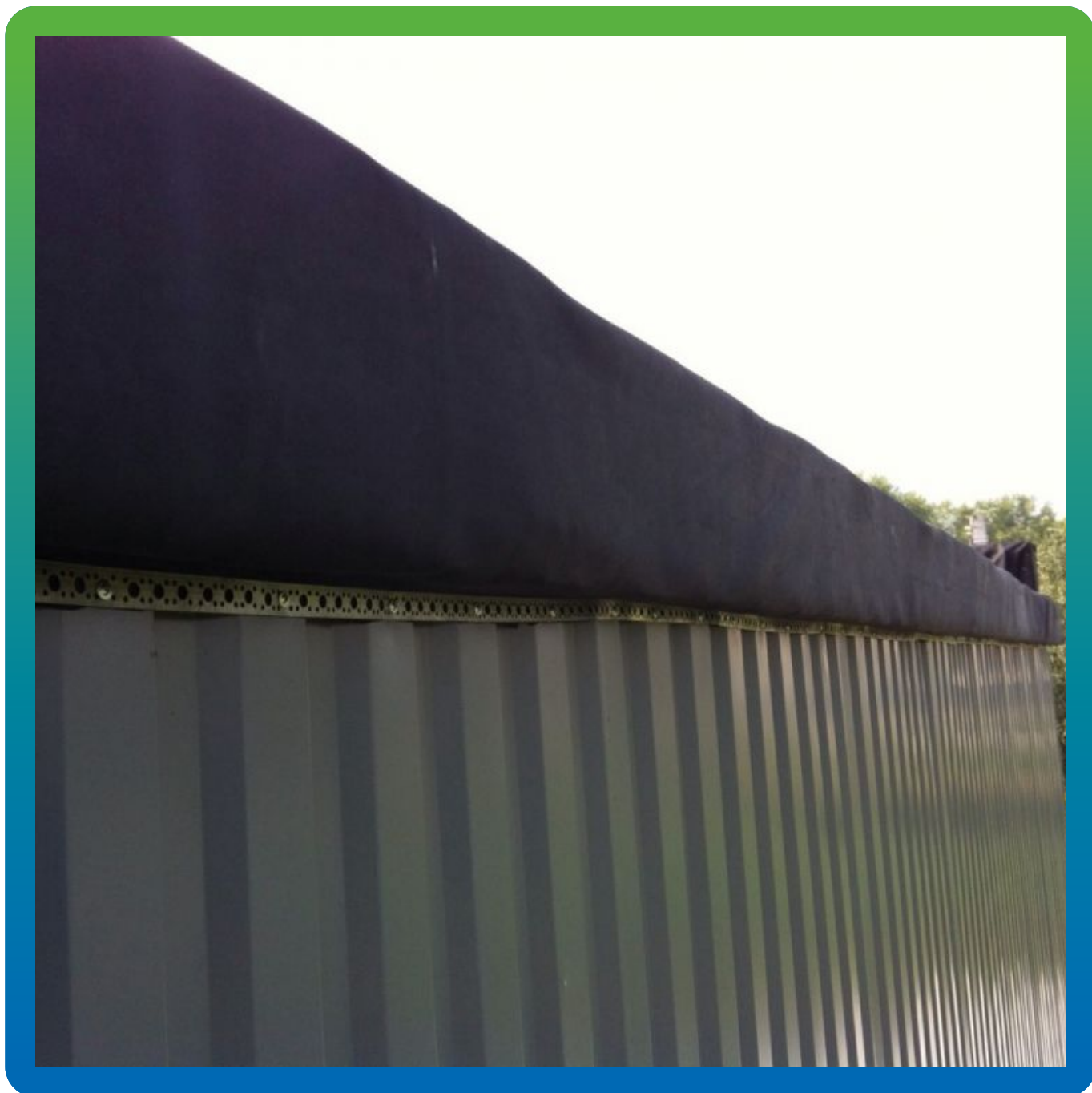
Крепление ЭПДМ мембраны к внешним торцевым частям кровли