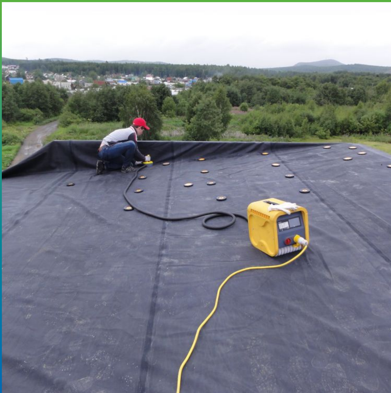
Механическое крепление ЭПДМ мембраны по системе Центрикс "без прокола"