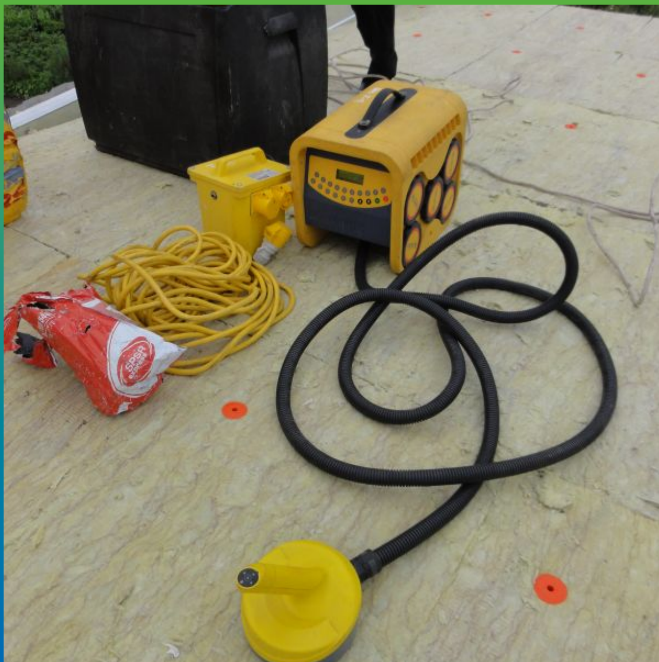
Аппарат Центрикс для механического крепления ЭПДМ мембраны "без прокола"