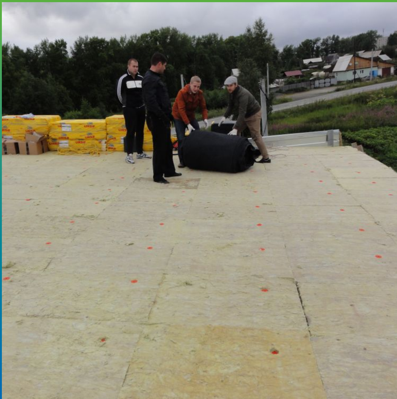
Укладка карты из ЭПДМ согласно схеме раскроя