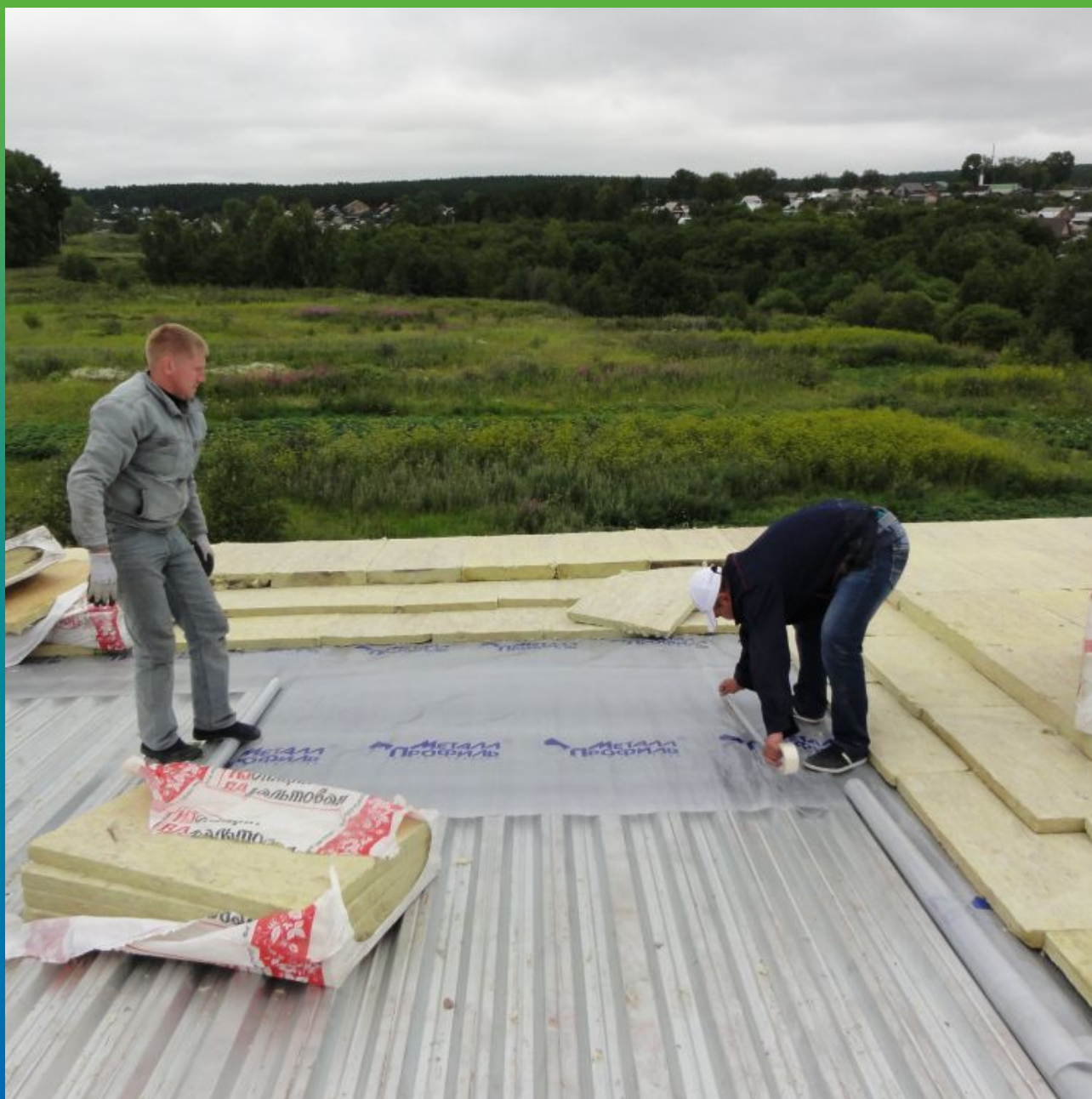
Укладка рулонной пароизоляции на основание кровли из профлиста