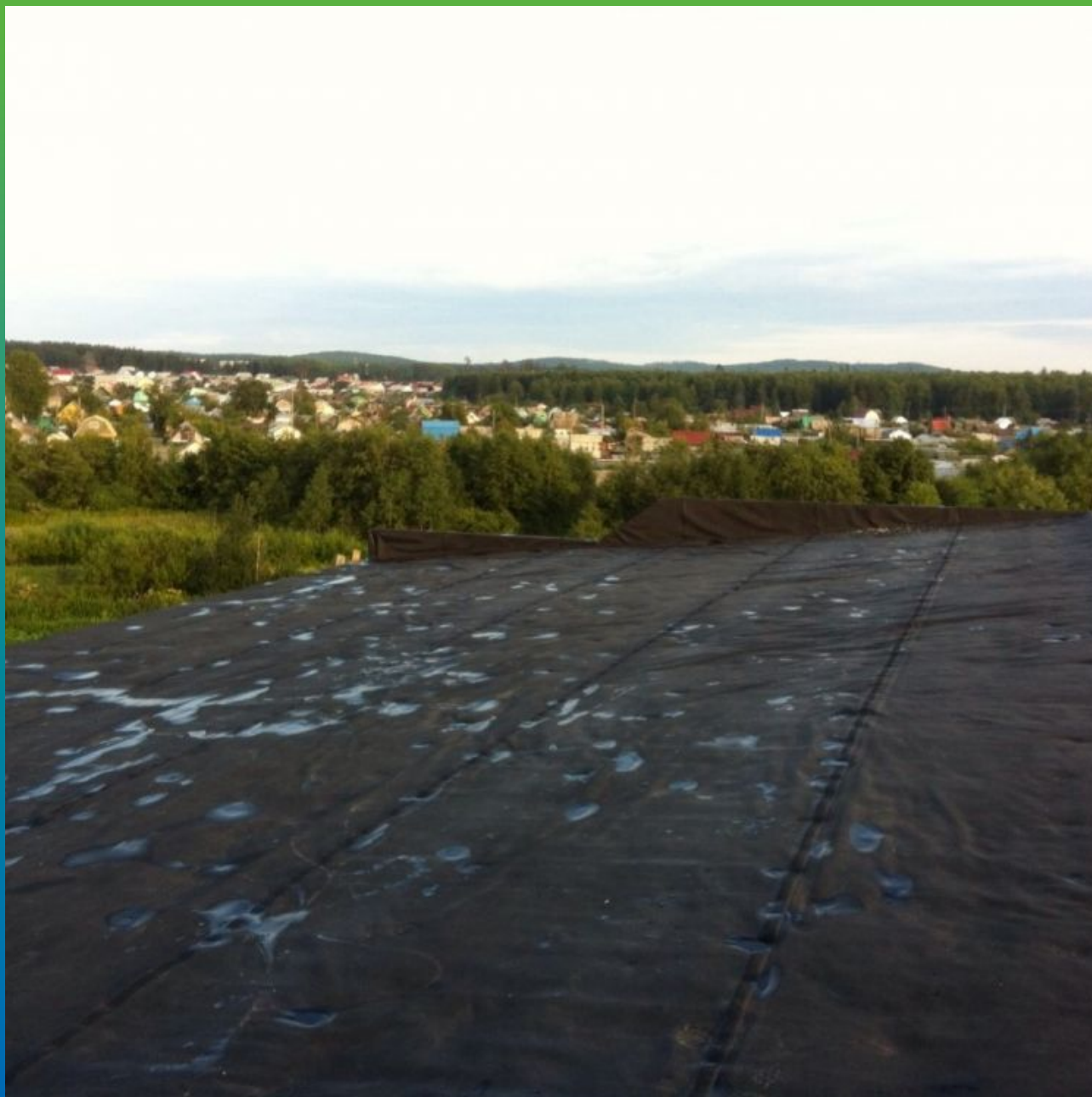
Финишный вид кровли после монтажа до установки фасонных элементов