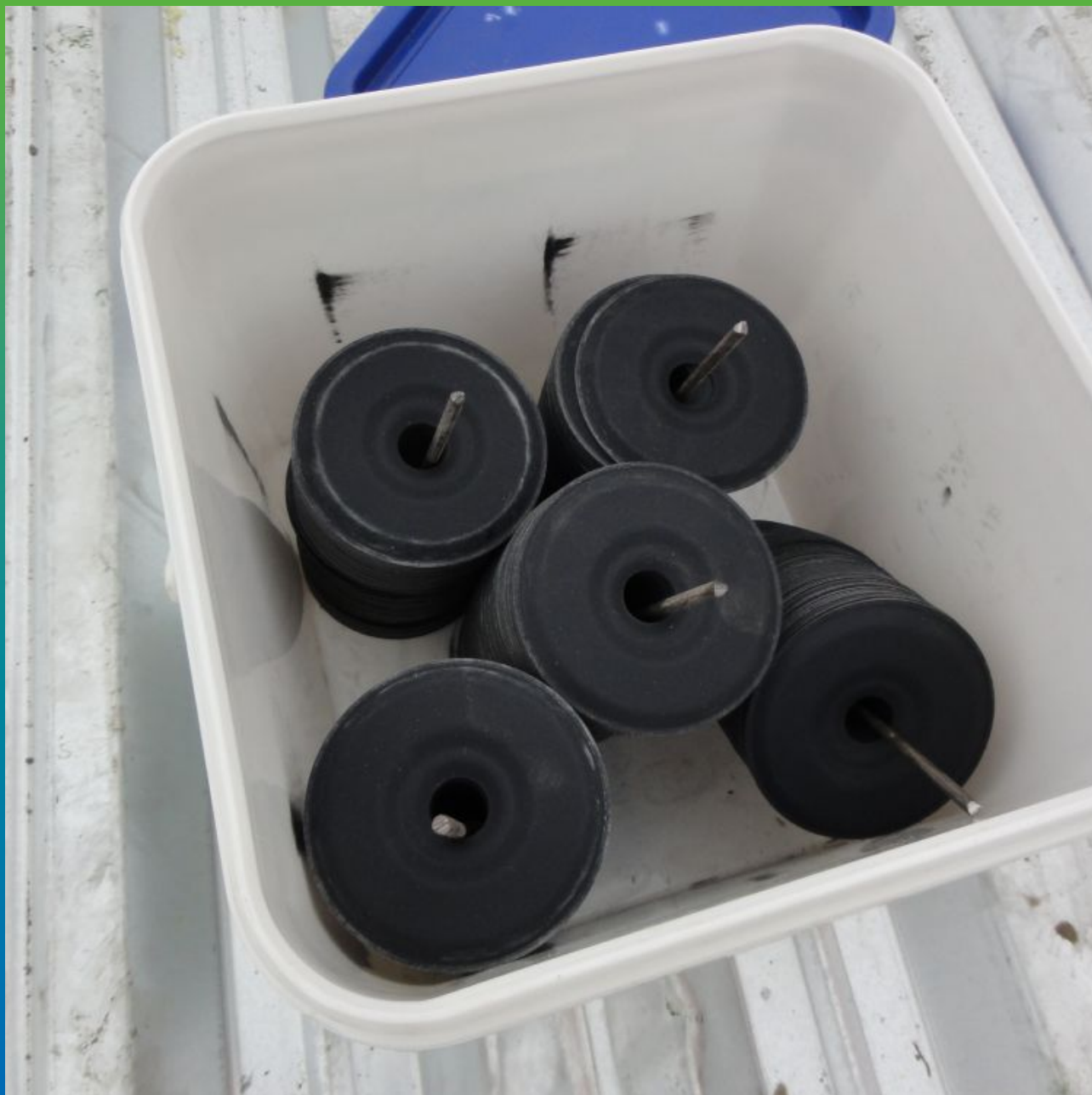
Шайбы Центрикс для механического крепления ЭПДМ мембраны "без прокола"