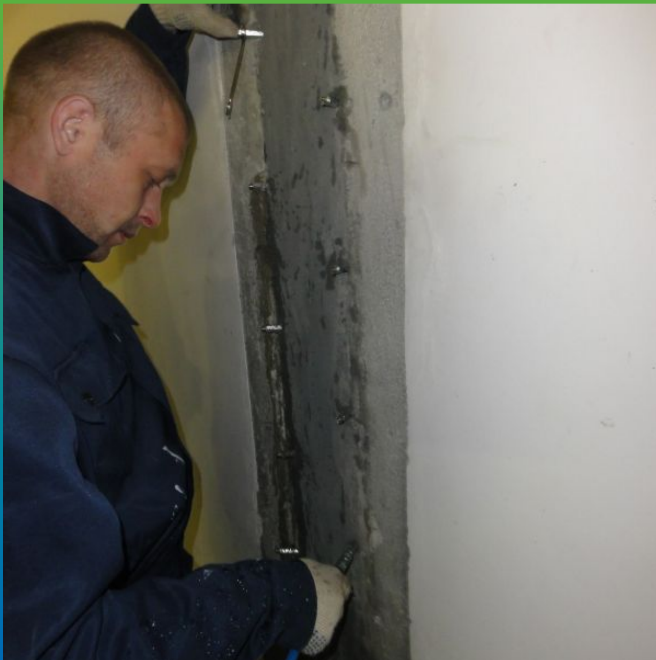
Инъектирование Витракрил Гель В