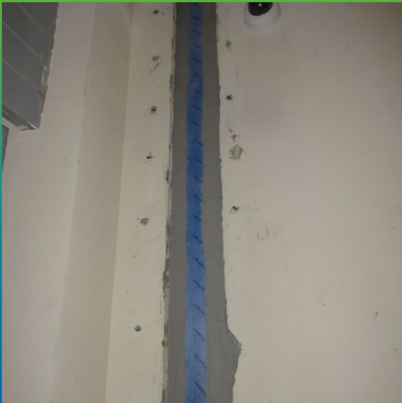
Монтаж ленты Максфлекс 180 на Манопокс 331