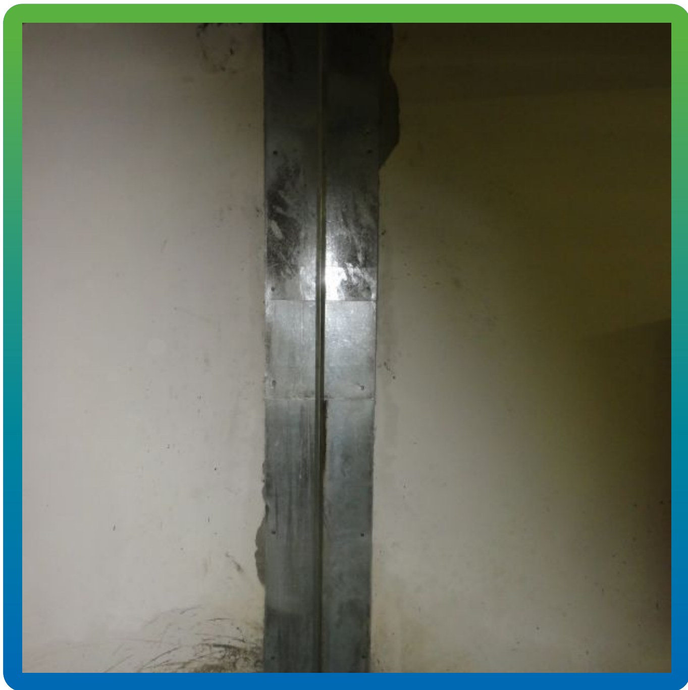
Финальный вид шва