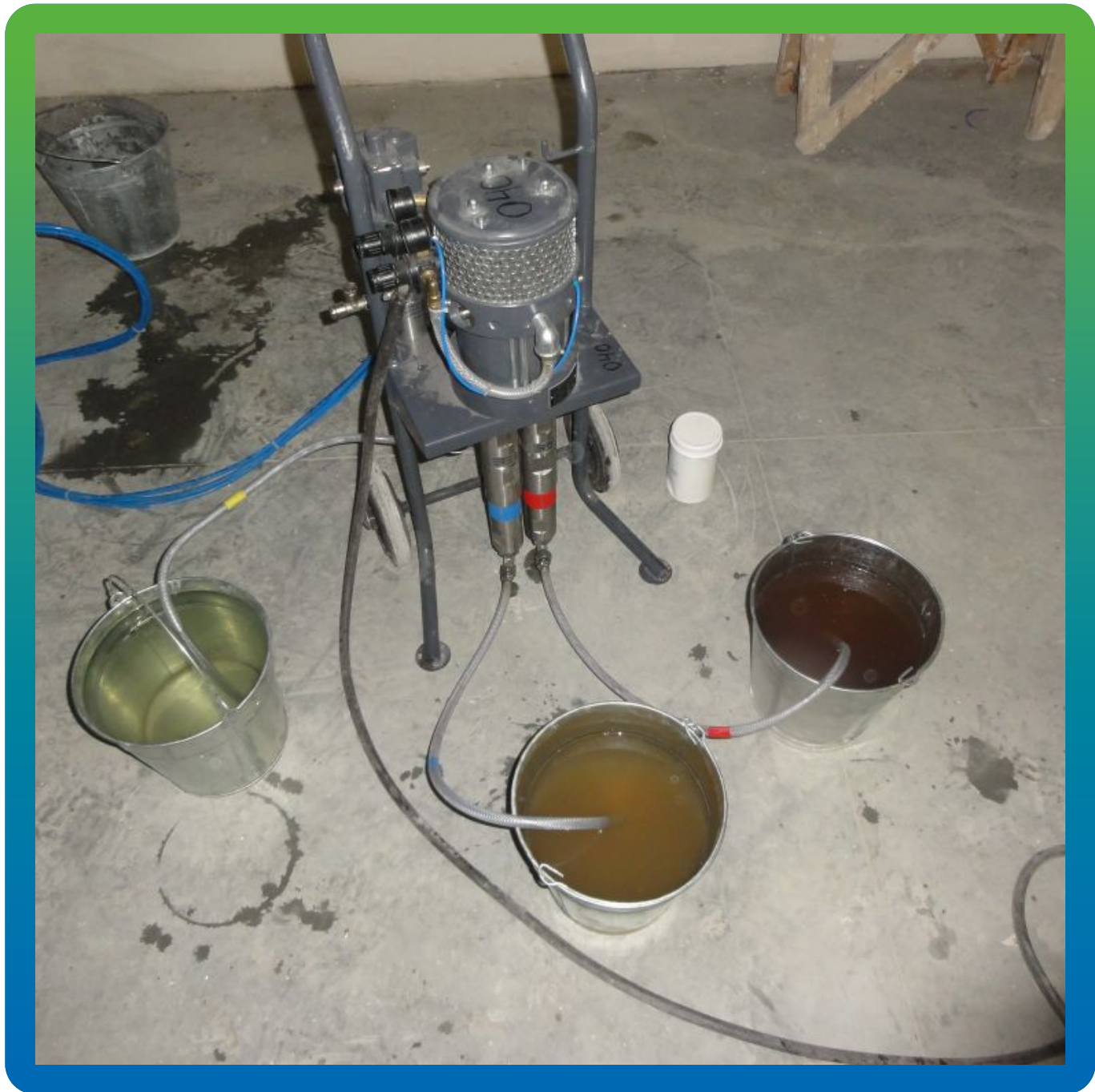
Витракрил Гель В и насос БМ 1425