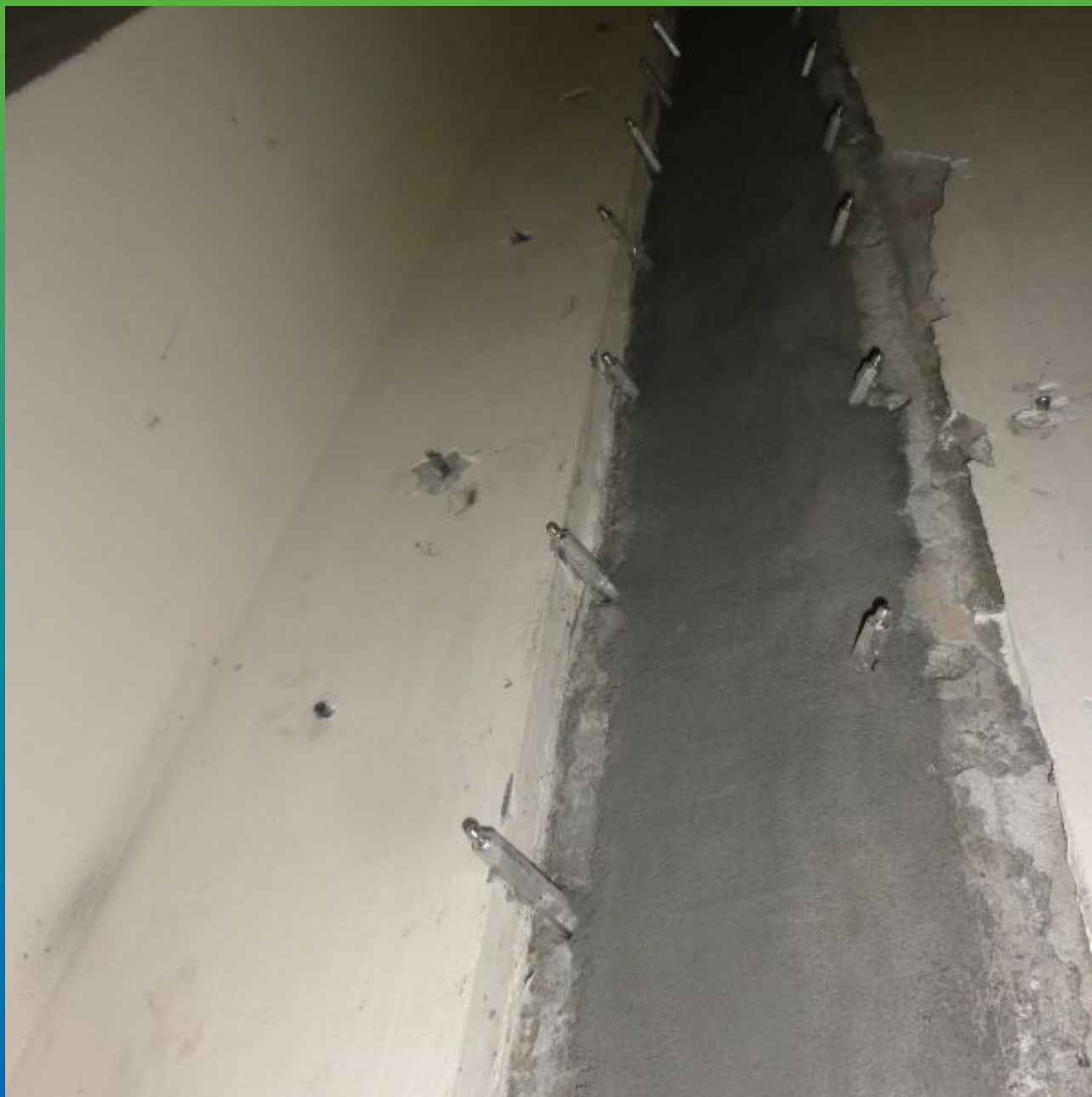
Зачеканка шва с помощью Макрест