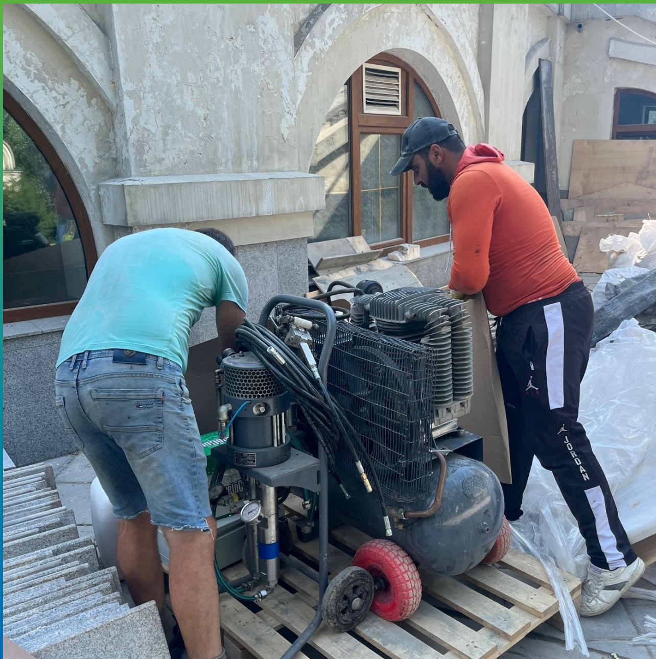
Подготовка оборудования насос БМ1425 и компрессор