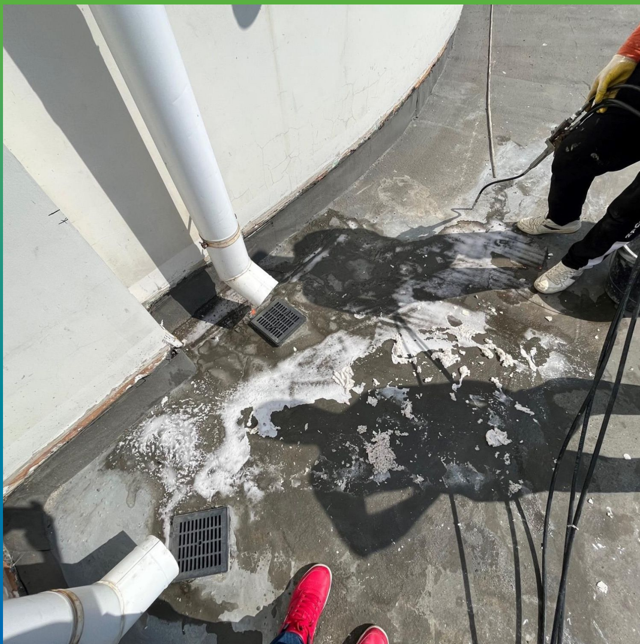
Итог по прокатке