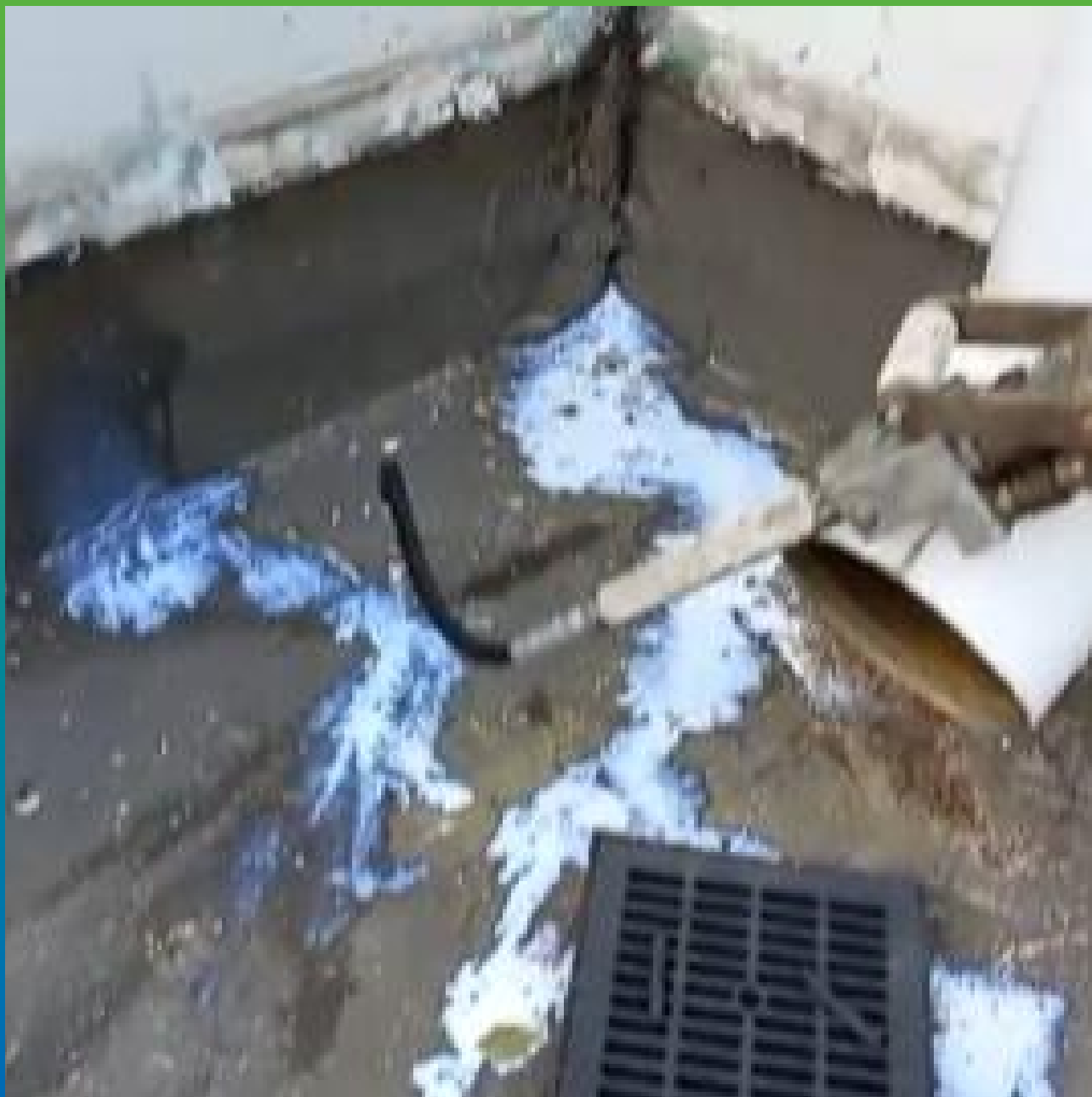
Насыщенный участок Манокрил Гель