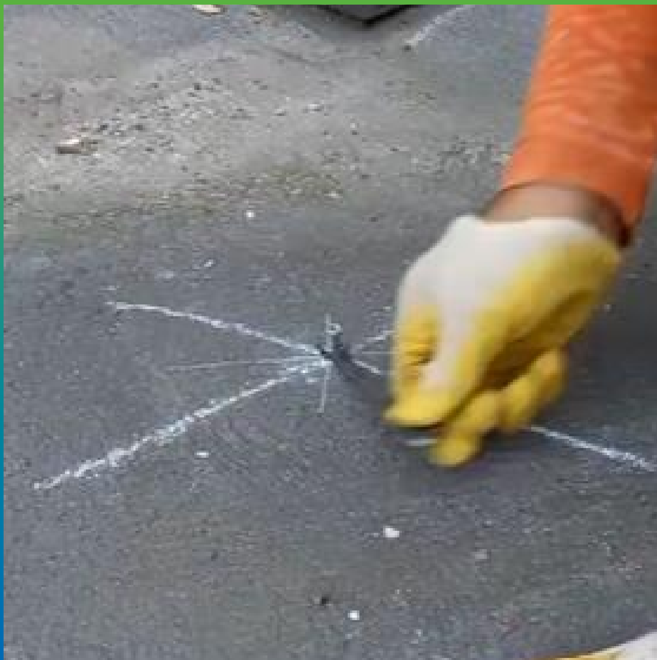
Установка пакеров БМ1099