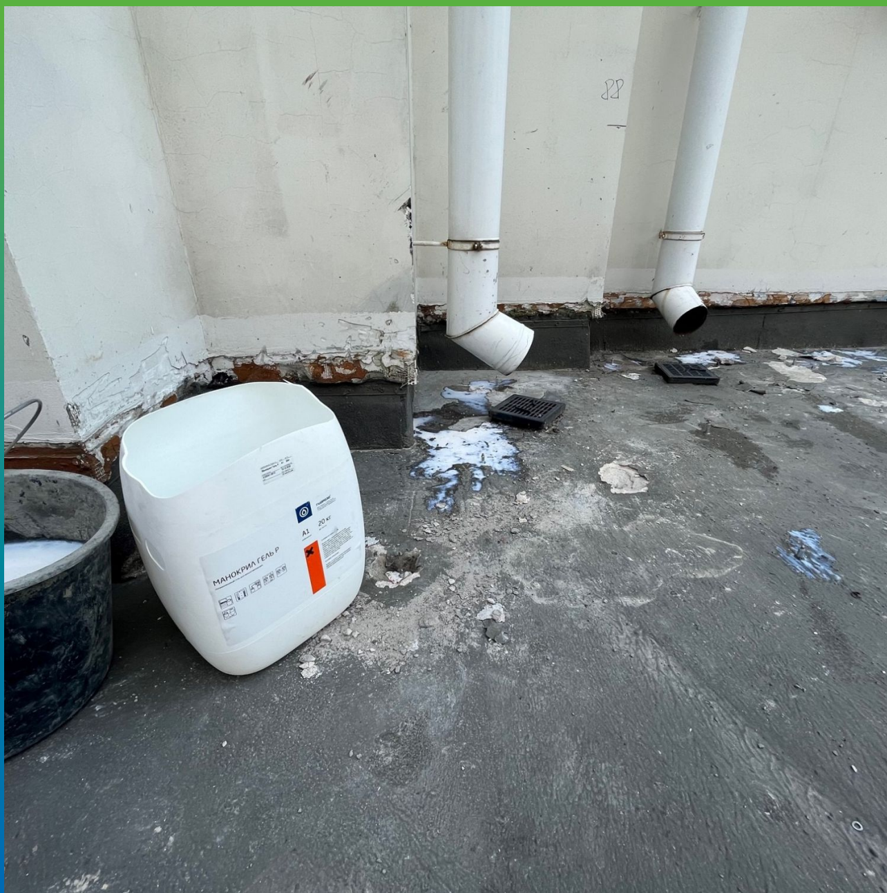
Манокрил Гель В/Р