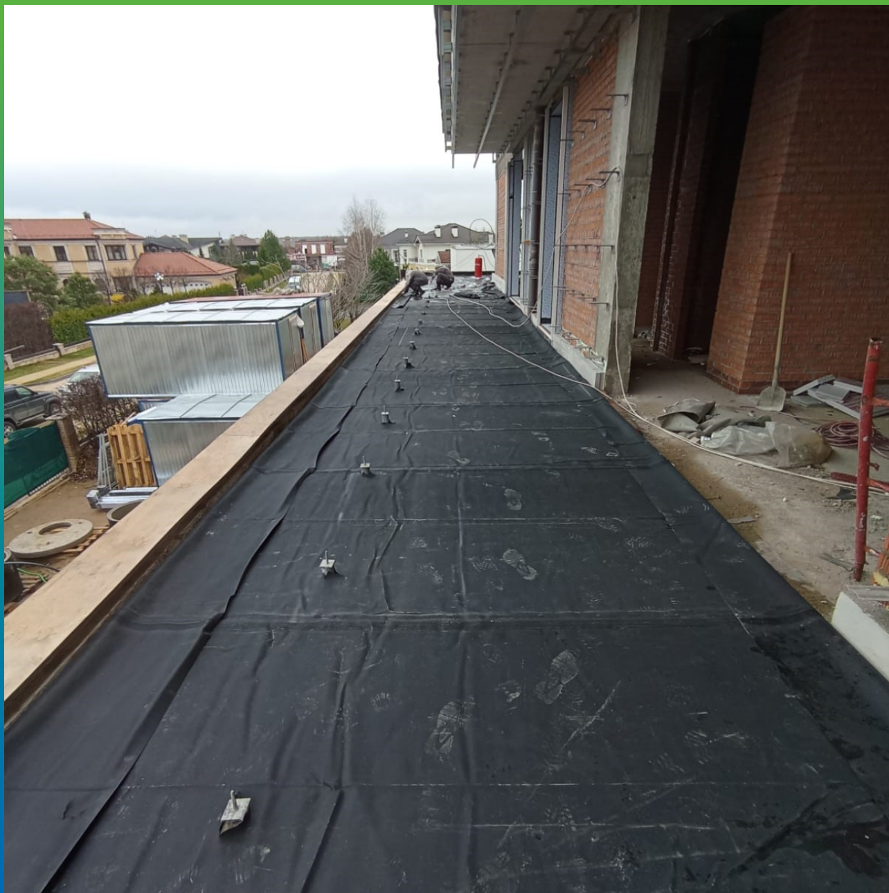
Укладка ЭПДМ мембраны Прелести СТ 1.2