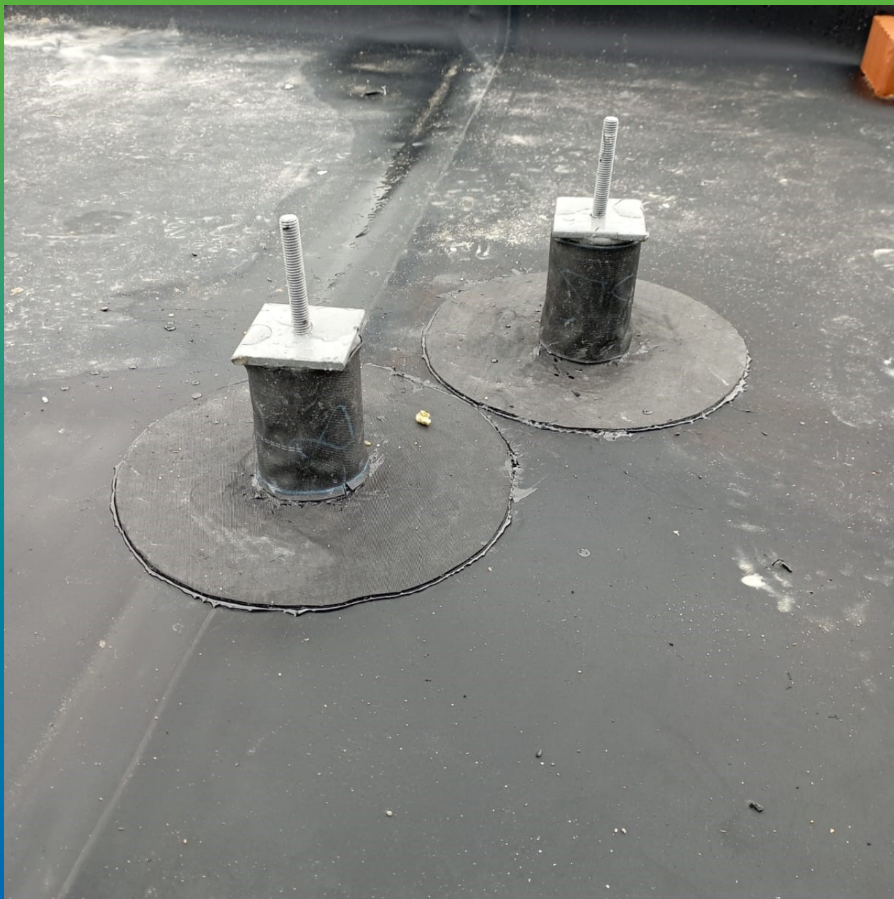
Обварка сложных геометрических форм с помощью материала Термобон 150/20, 300/10