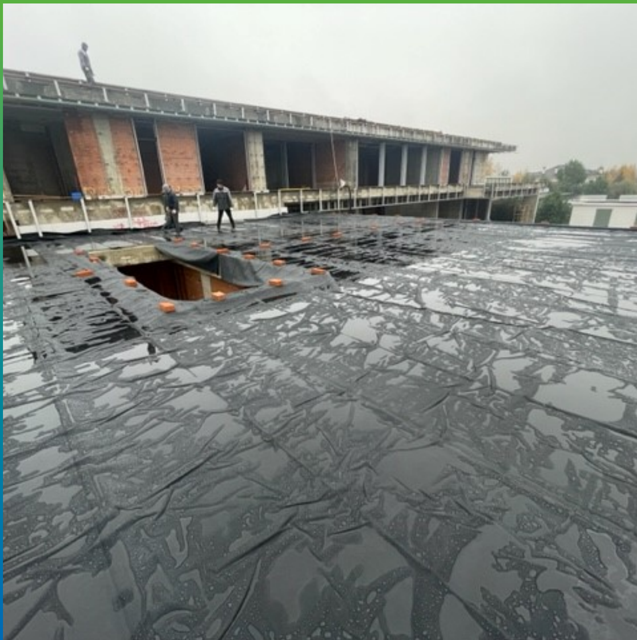
Раскатка кровельного ковра по плоскости