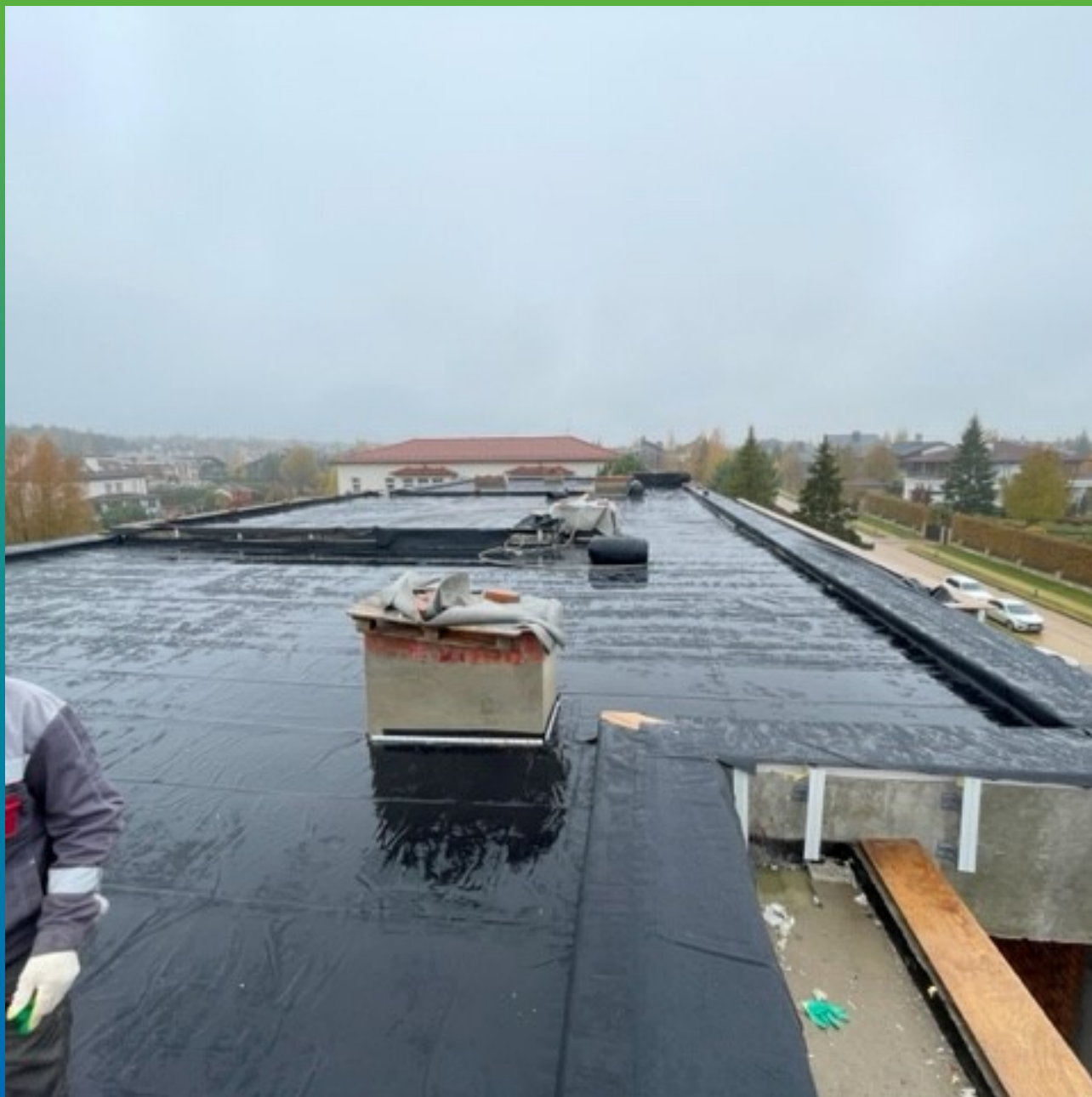
Устройство парапетов и примыканий с помощью клей-адгезив Преласты П400