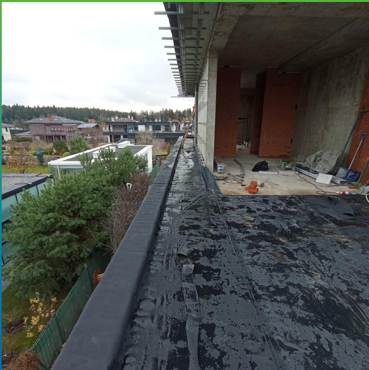
Устройство парапетов и примыканий клеевым методом, клей-адгезив Преласты П400