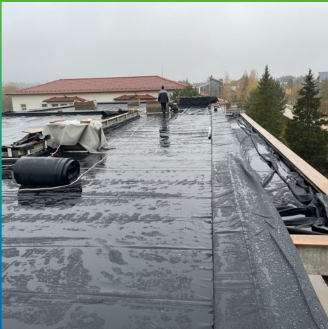
Устройство парапетов и примыканий клеевым методом, клей-адгезив Преласты П400