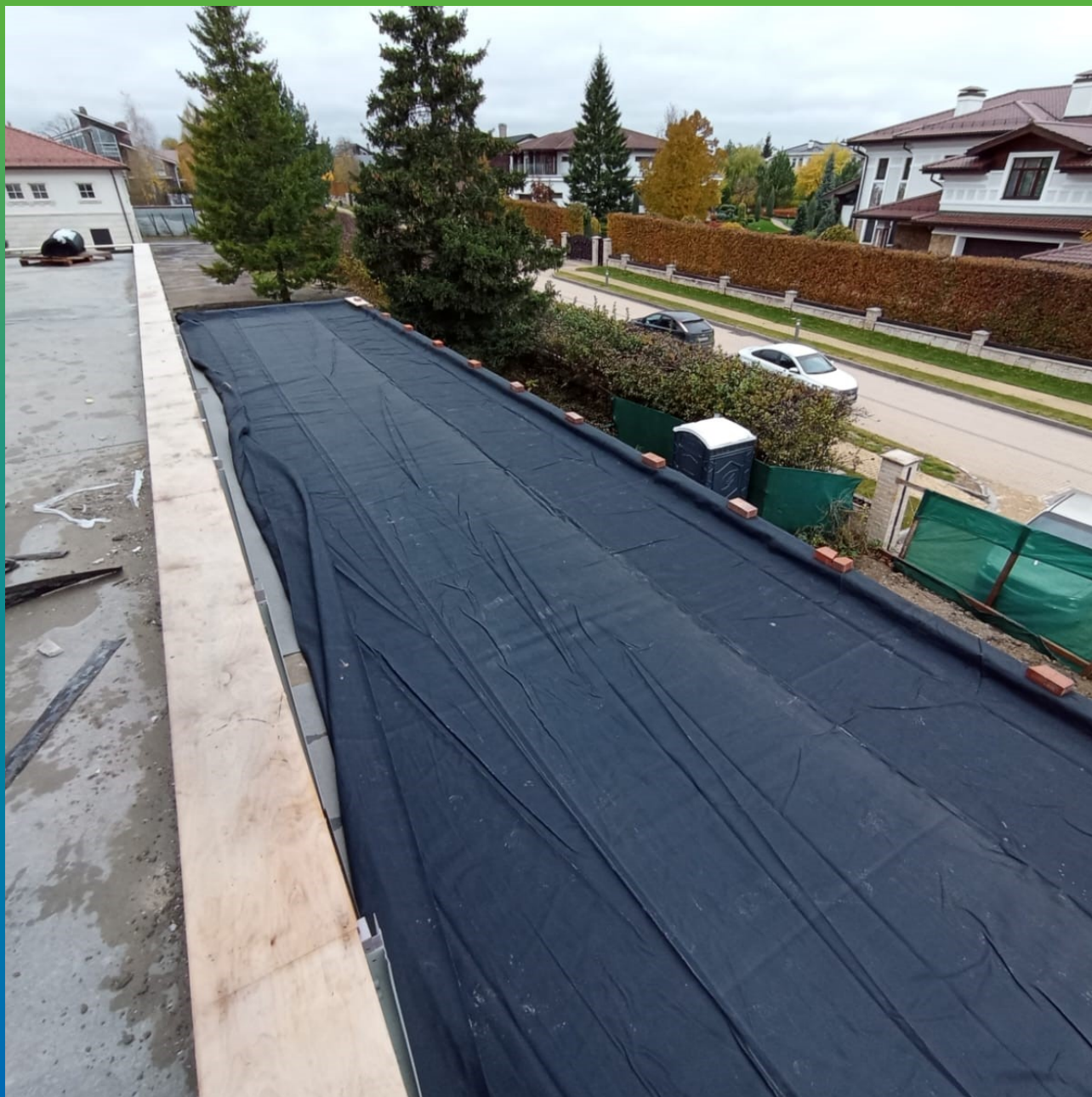
Раскатка мембраны ЭПДМ Пеласты СТ