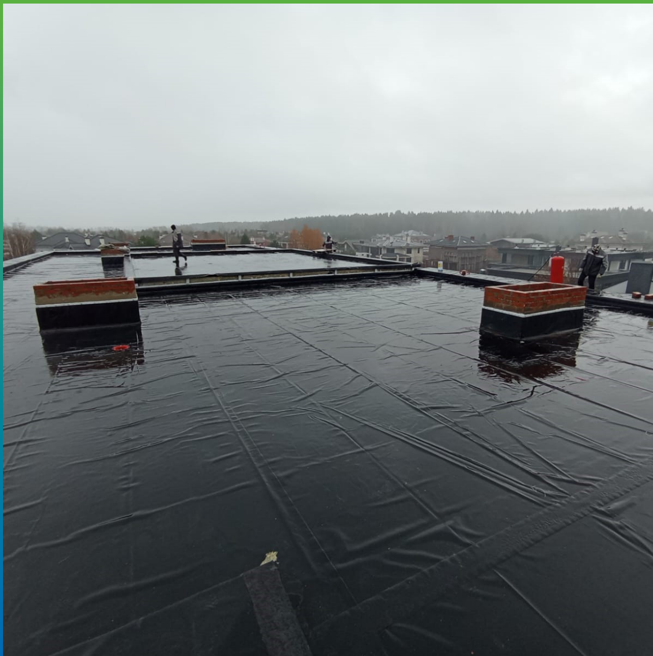
Финишный вид законченного монтажа Кровельных ковров ЭПДМ Прелести СТ 1,2