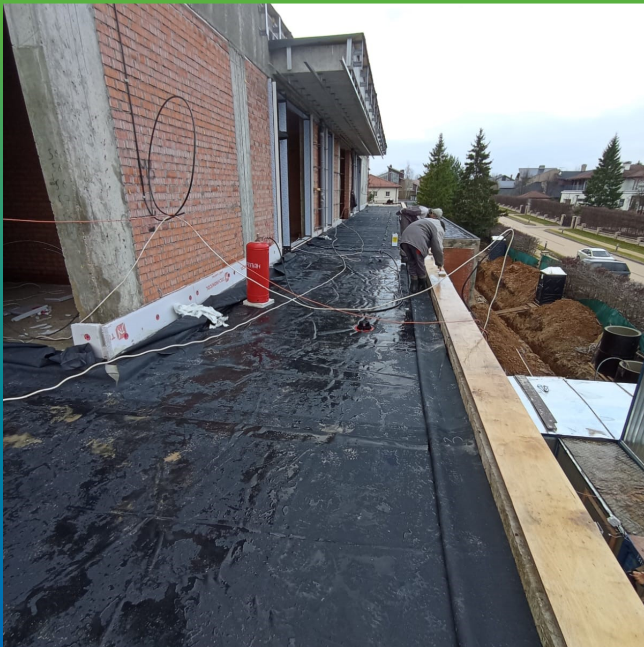
Устройство парапетов и примыканий клеевым методом, клей-адгезив Преласты П400