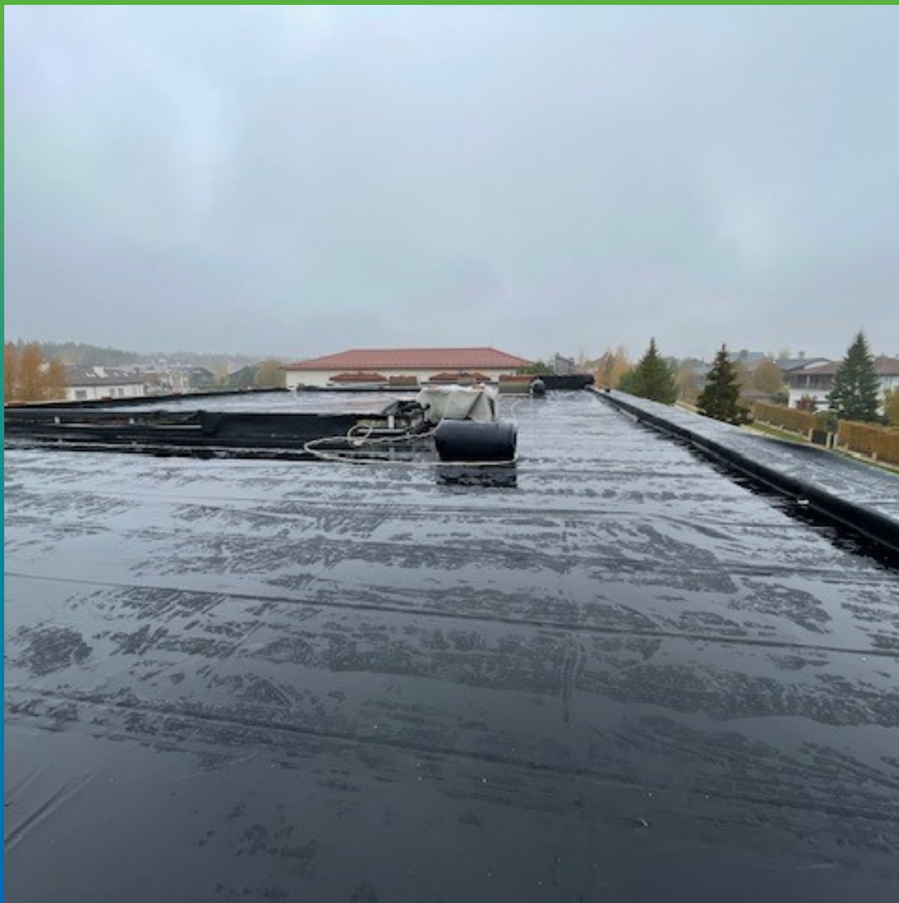
Устройство парапетов и примыканий с помощью клей-адгезив Преласт П400