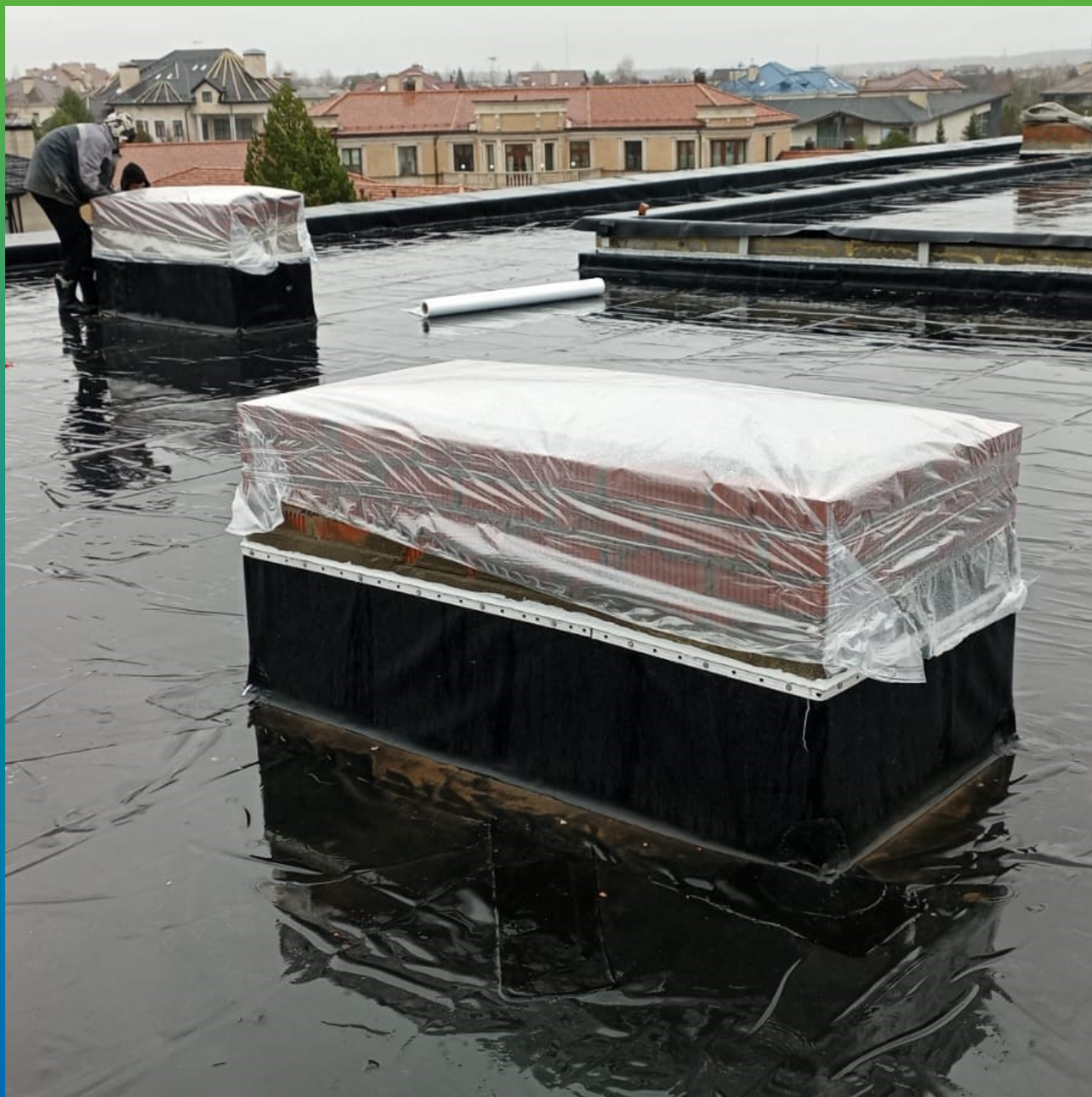
Финишный вид законченного монтажа Кровельных ковров ЭПДМ Прелести СТ 1,2