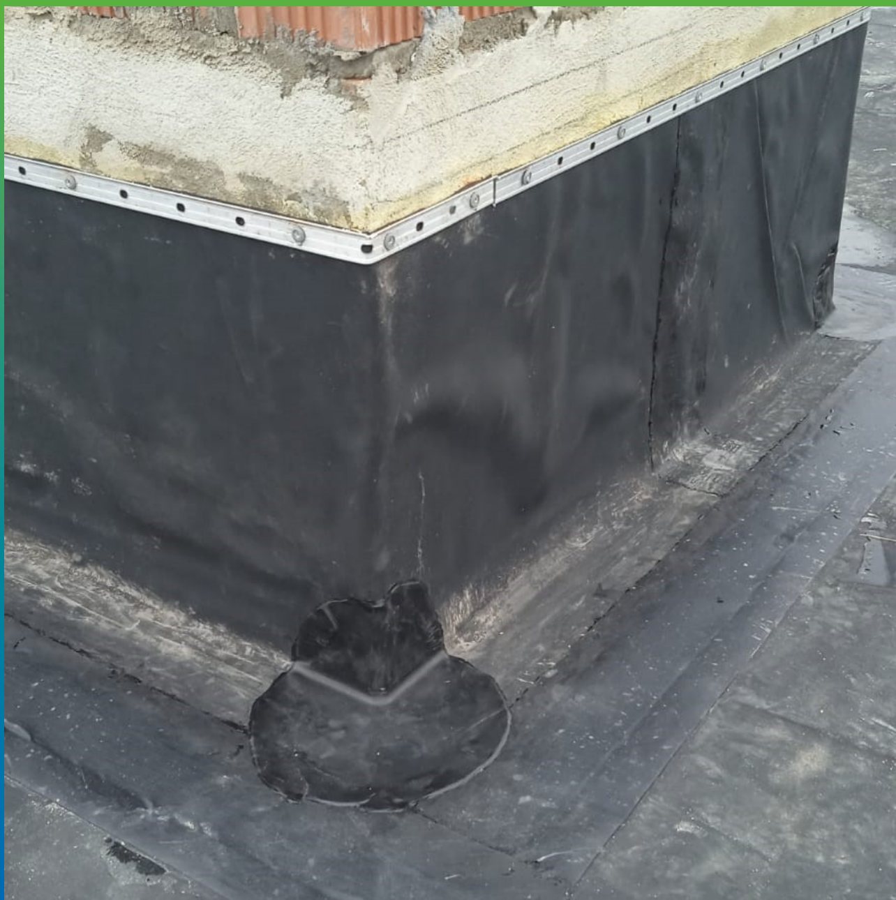
Обварка примыканий и парапетных зон с помощью материала Термобон 150/20, 300/10