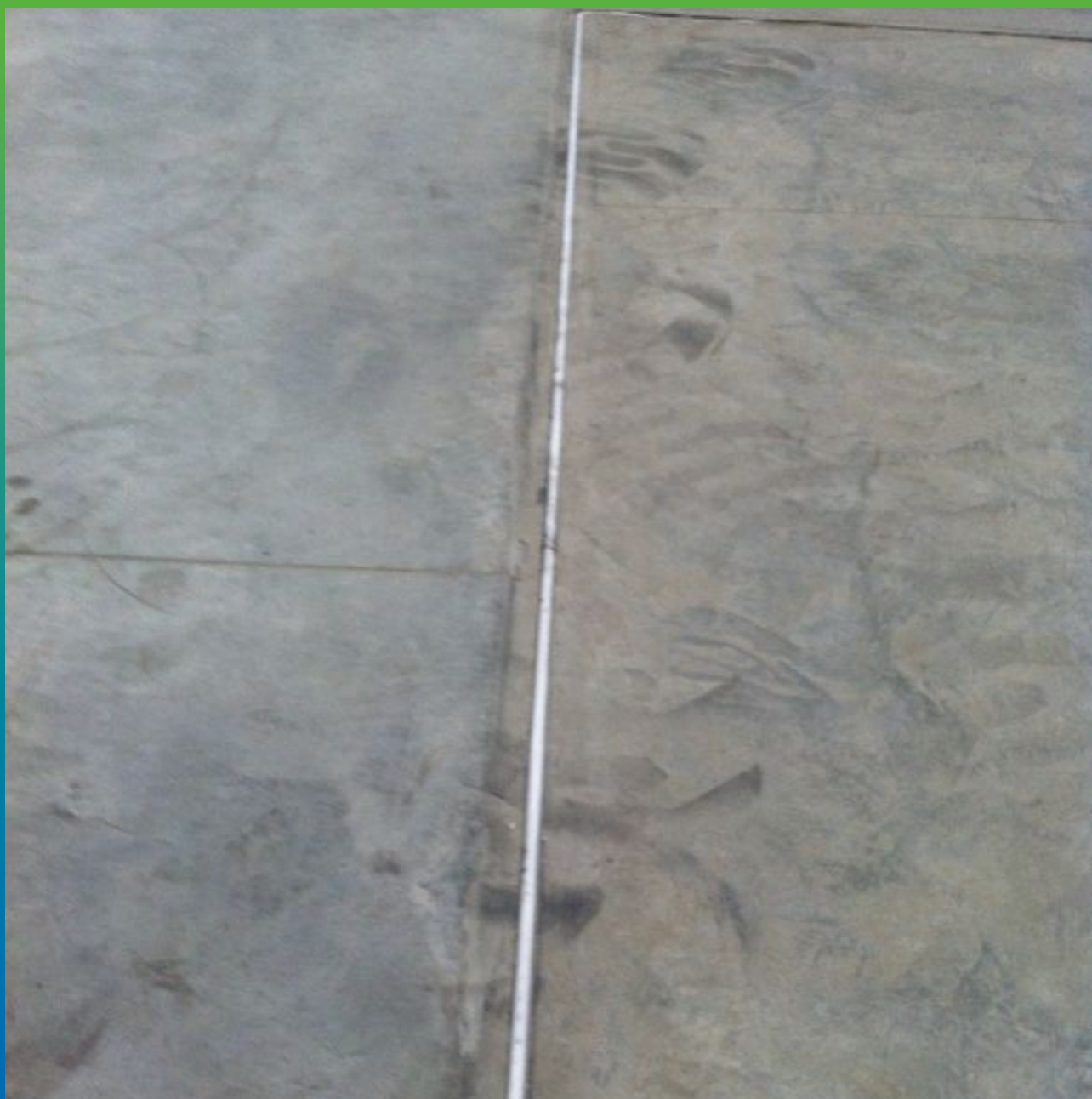
Укладка Вилотерм в шов