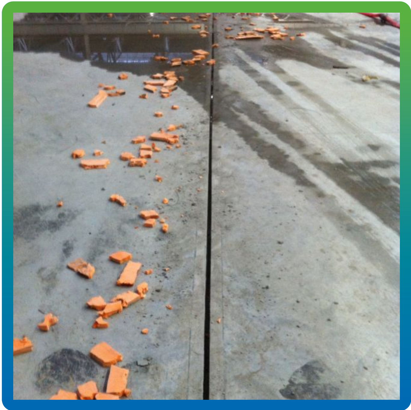
Вид прочищенного шва