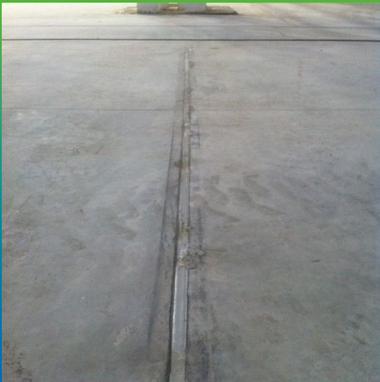
Финальный вид шва