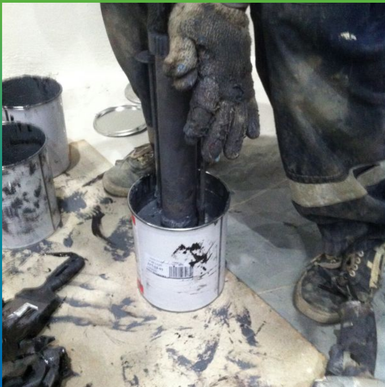
Заправка герметика Максфлекс 900 в пистолет