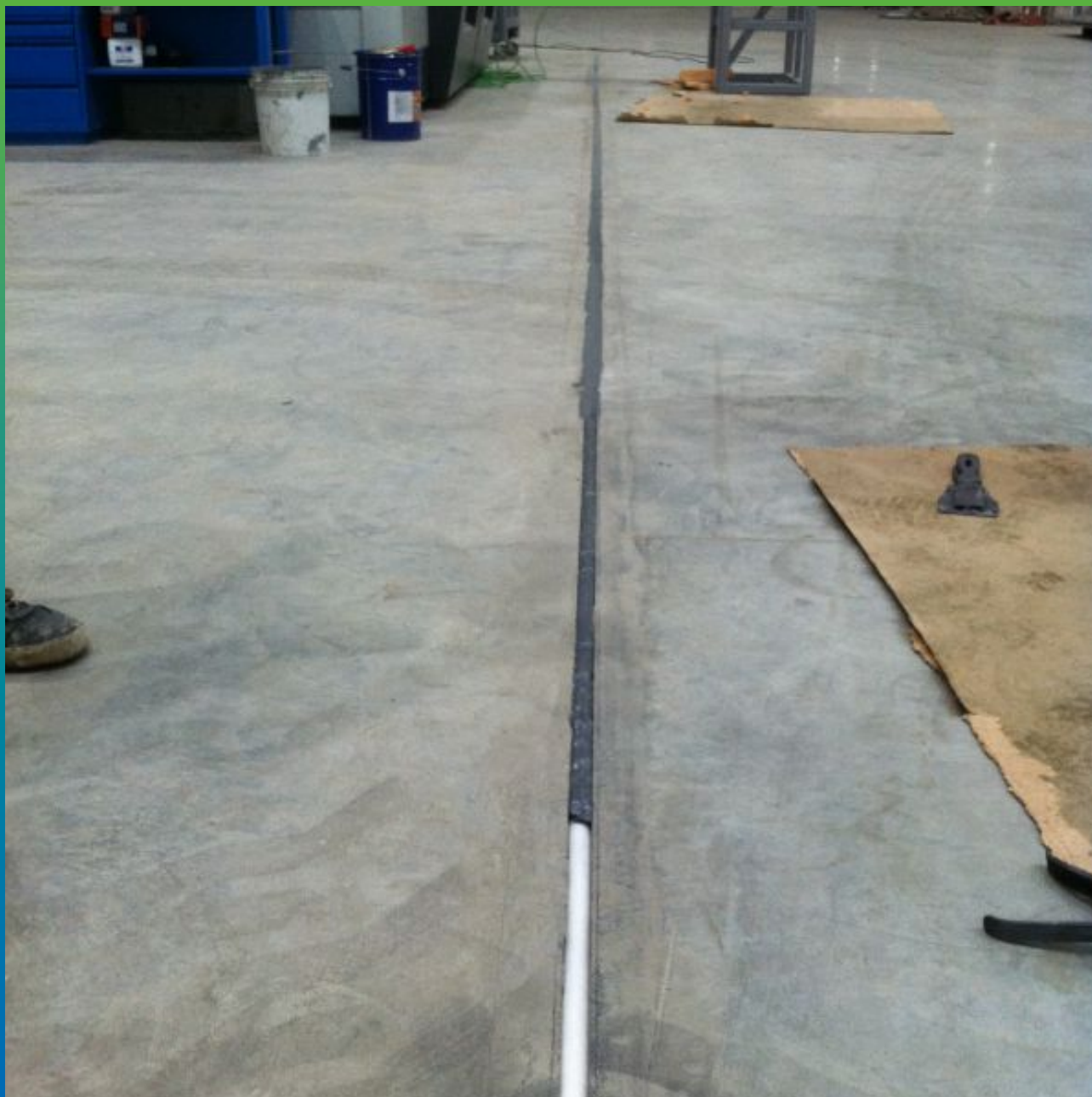
Укладка Максфлекс 900 в шов