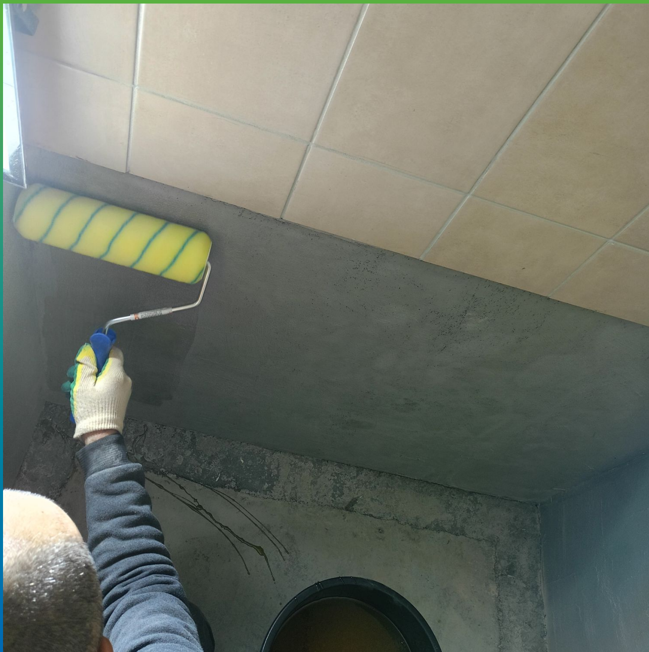
Процесс грунтования вертикальных и горизонтальных поверхностей