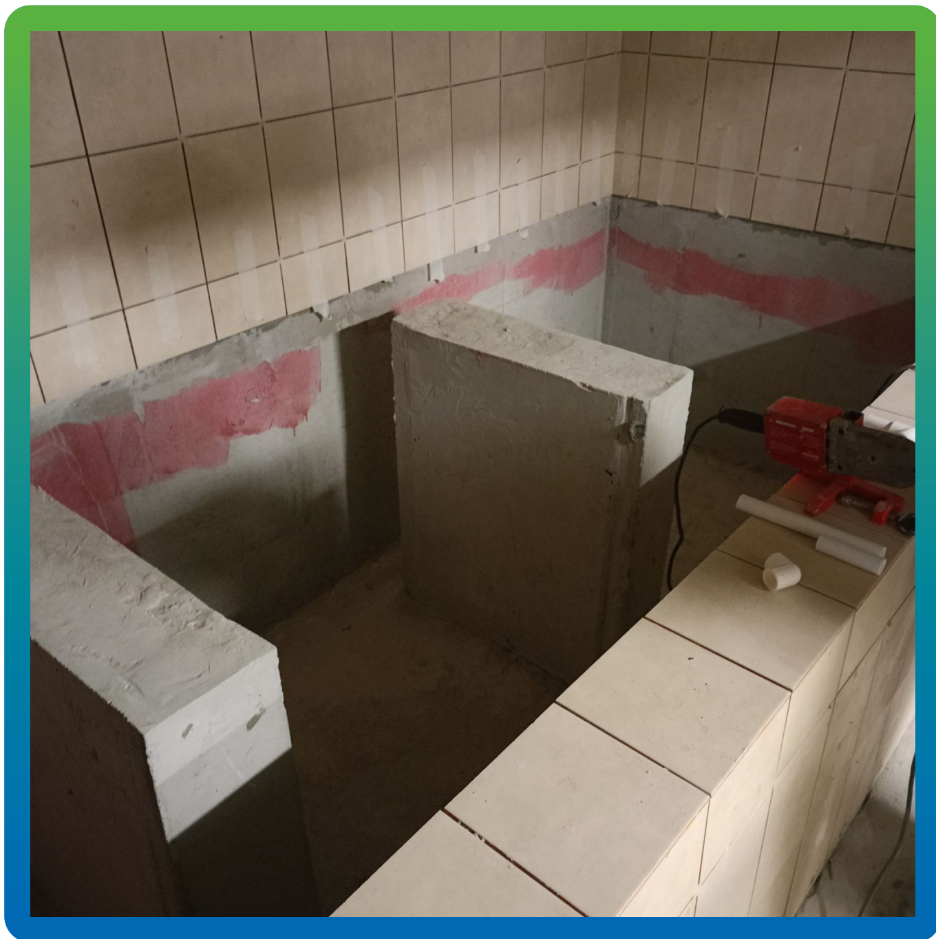
Внешний вид ванн для приготовления и дозирования гипохлорита натрия