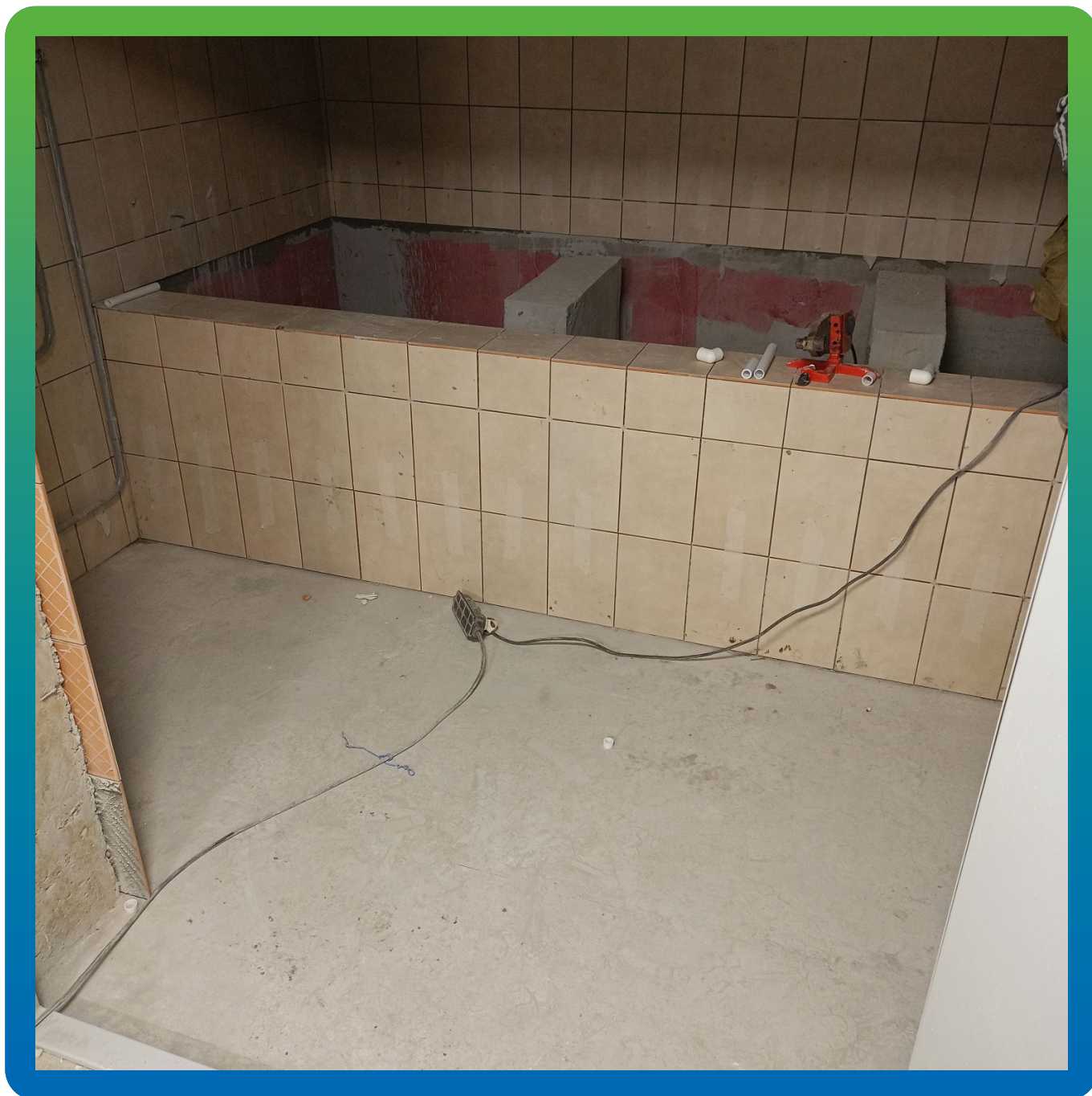
Внешний вид ванн для приготовления и дозирования гипохлорита натрия