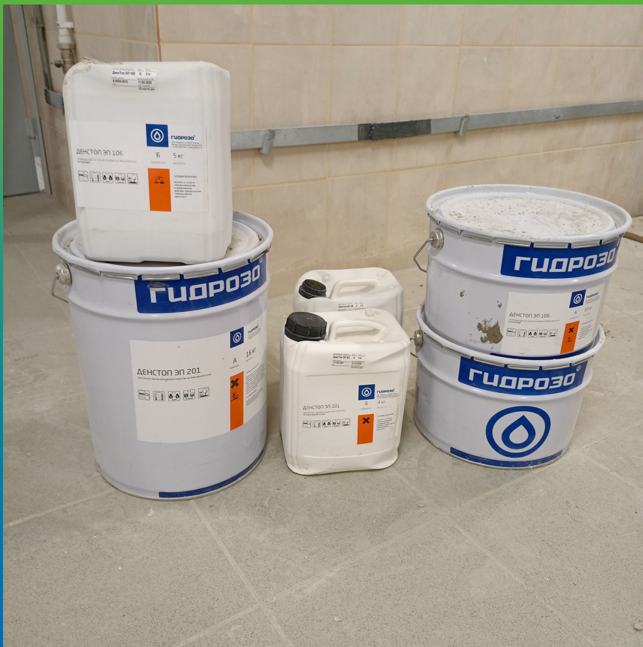
Материалы Гидрозо на объекте