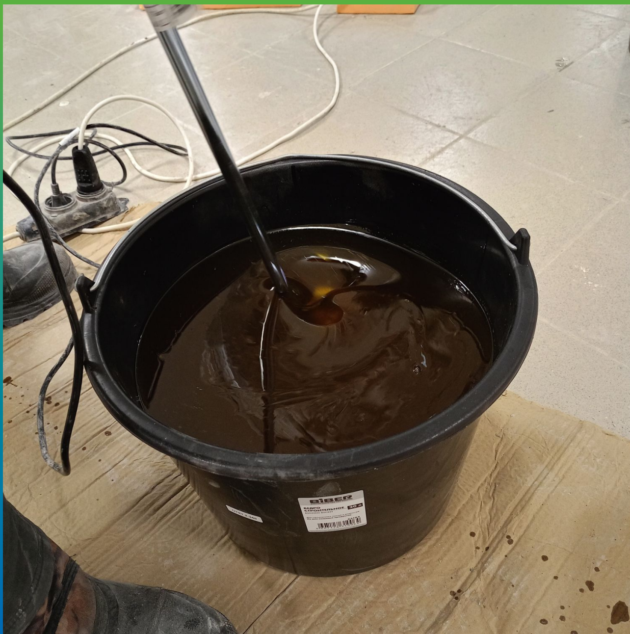
Приготовление эпоксидного грунтовочного состава ДенТоп ЭП 106