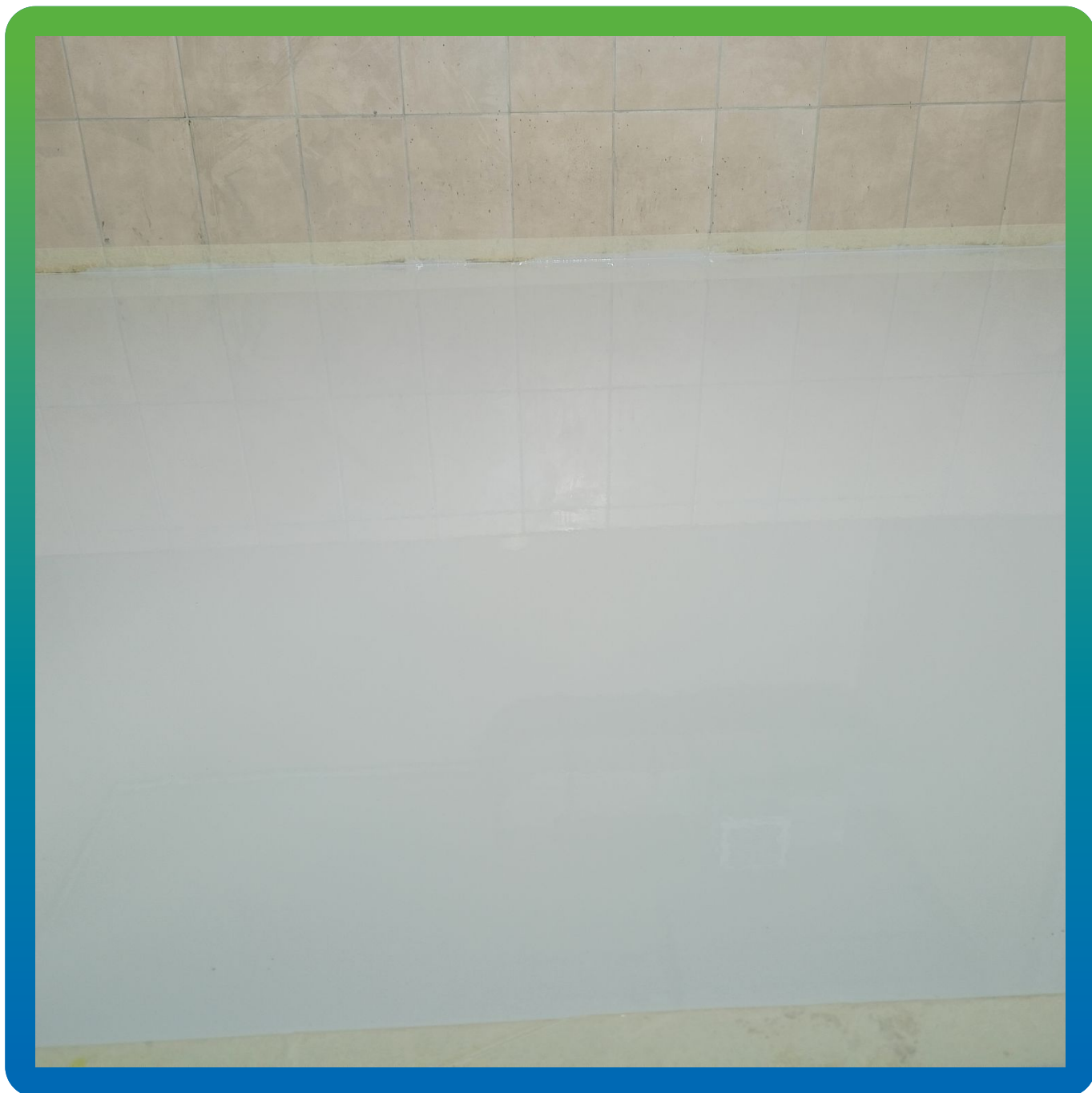
Финишный вид покрытия ДенсТоп ЭП 500