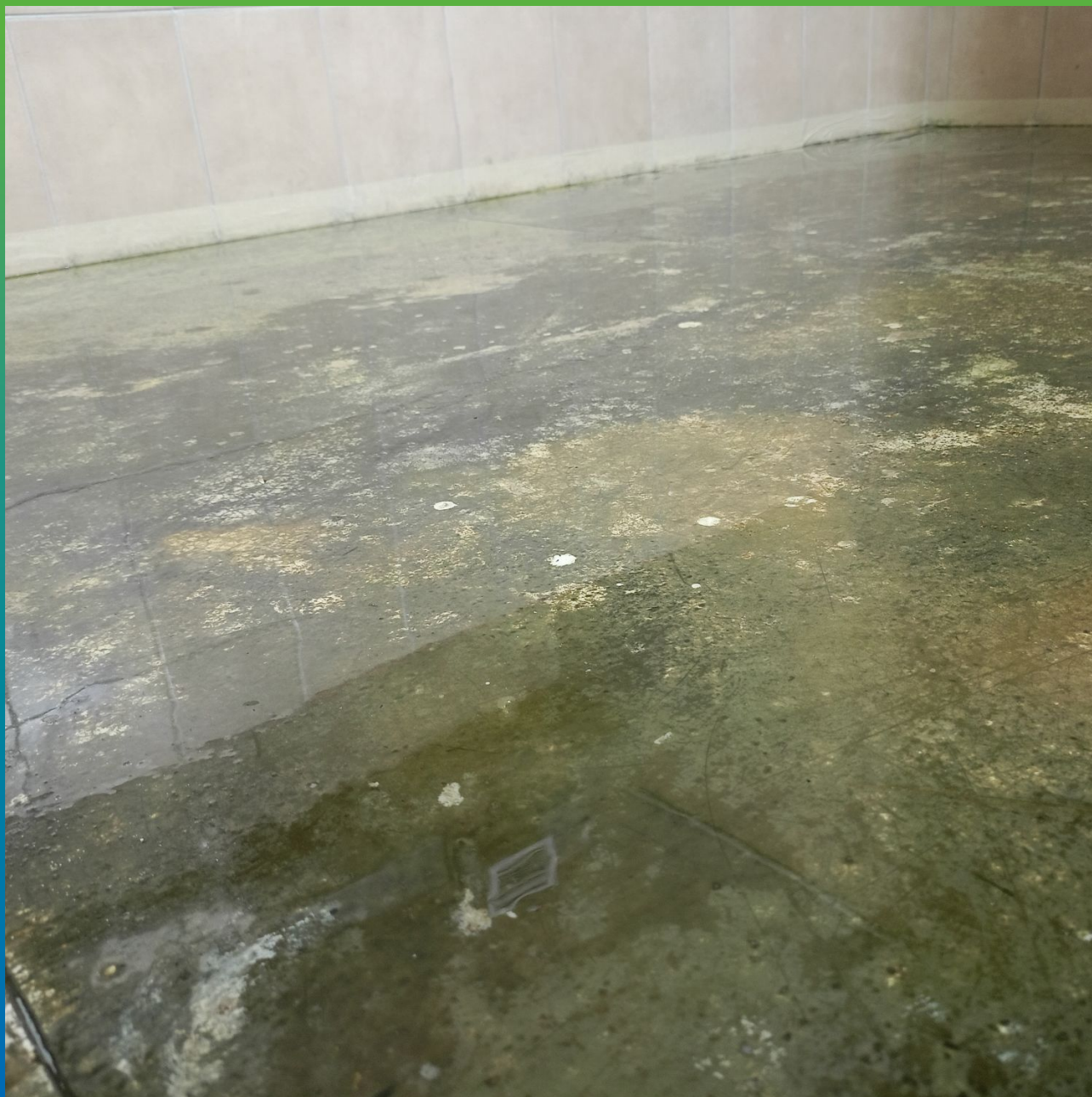
Внешний вид нанесенного грутовочного слоя в системе напольного покрытия ДенсТоп ЭП 106 + ДенсТоп ЭП 500