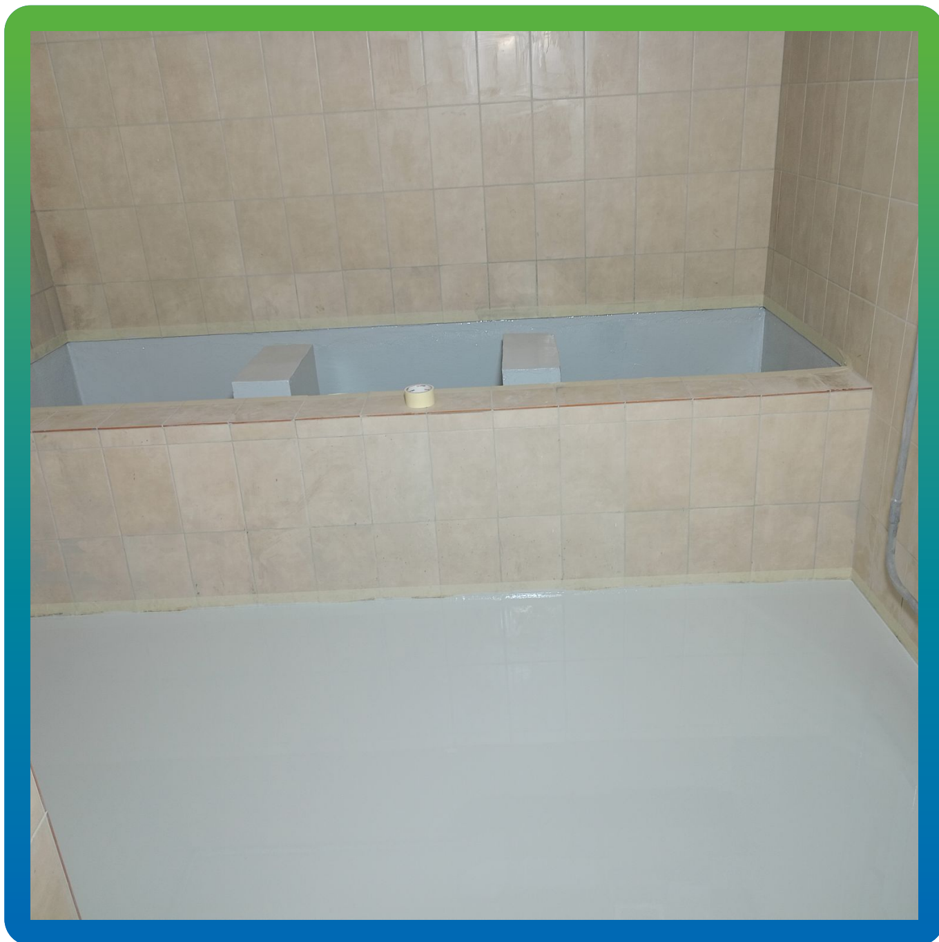
Внешний вид выполненных эпоксидных покрытий ДенсТоп ЭП 201 и ДенсТоп ЭП 500