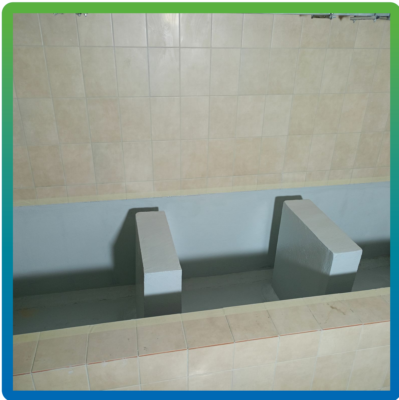
Внешний вид нанесенного покрытия ДенТоп ЭП 201