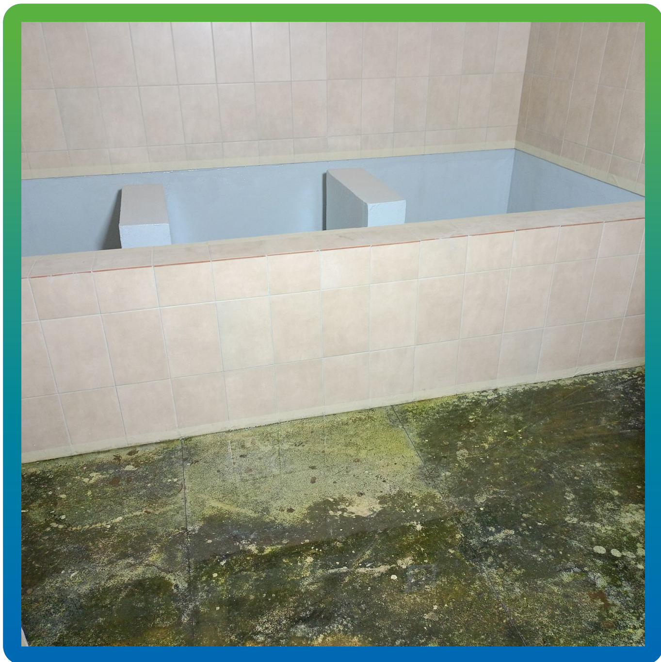
Внешний вид нанесенного грутовочного слоя в системе напольного покрытия ДенсТоп ЭП 106 + ДенсТоп ЭП 500