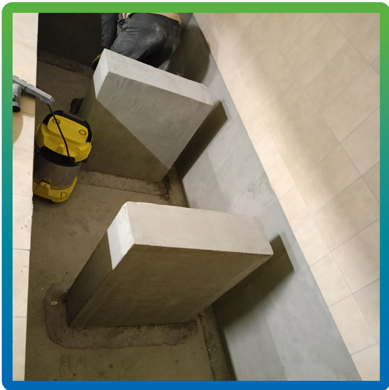
Процесс подготовки основания, шлифование и обеспыливание