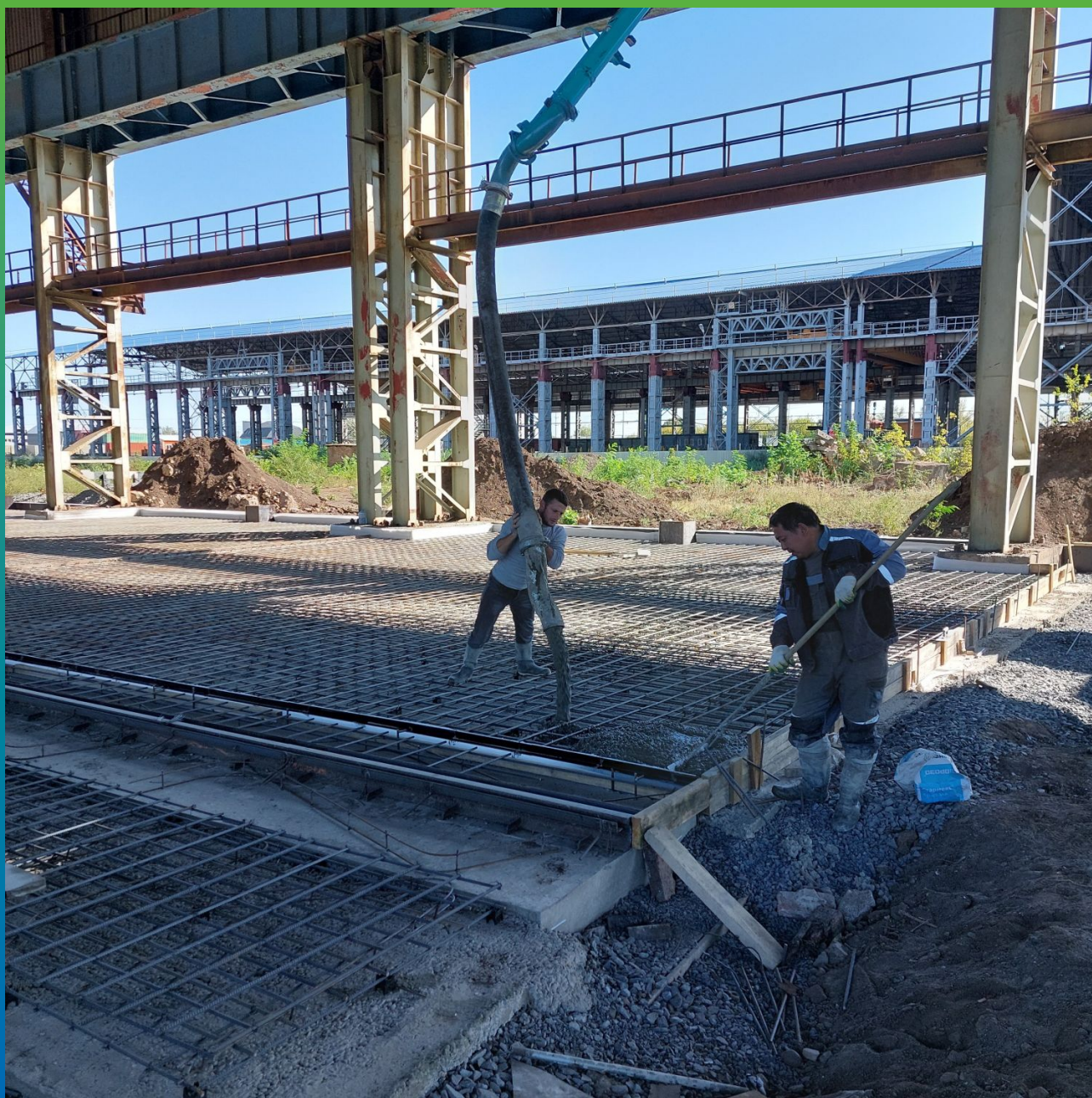
Заливка плиты через час после просыпки Стармекс Кристалл