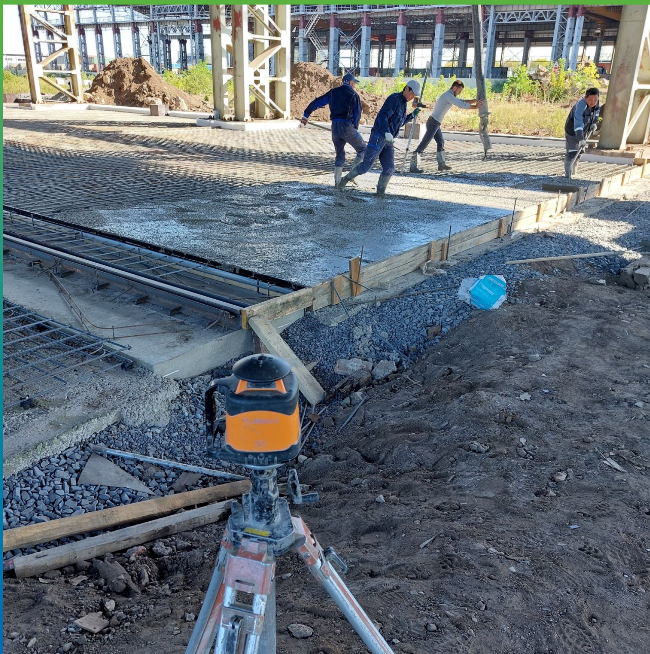
Устройство бетонной плиты