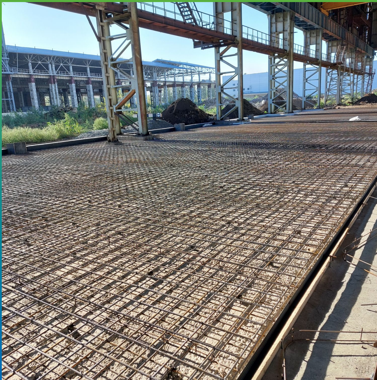
Общий вид объекта