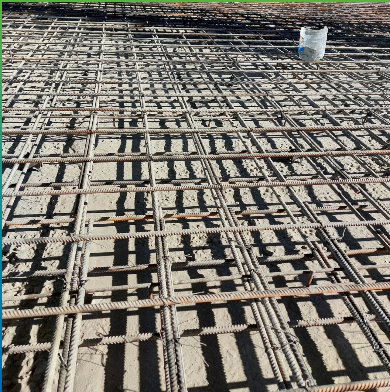
Армокаркас и подбетонка после просыпки