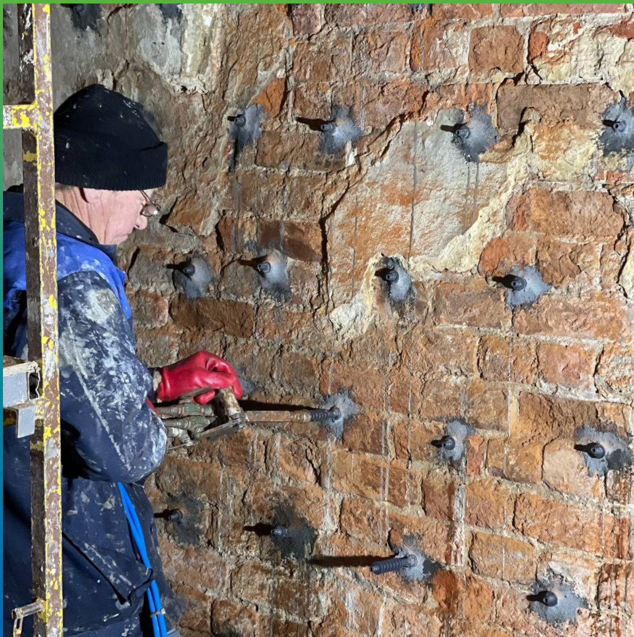
Инъектирование внешних кирпичных стен составом Манокрил Гель Р