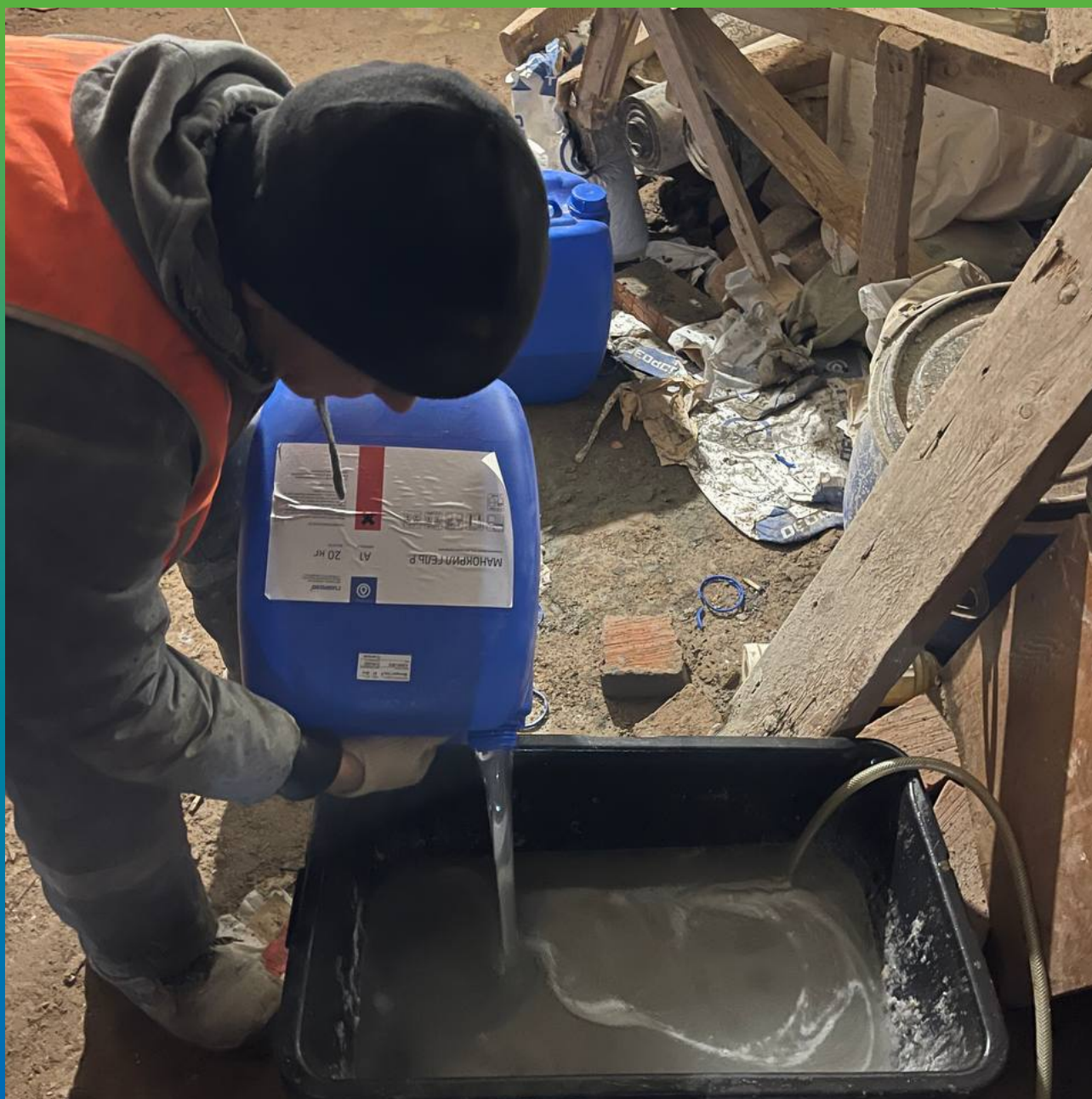
Подготовка состава Манокрил Гель Р для инъектирования