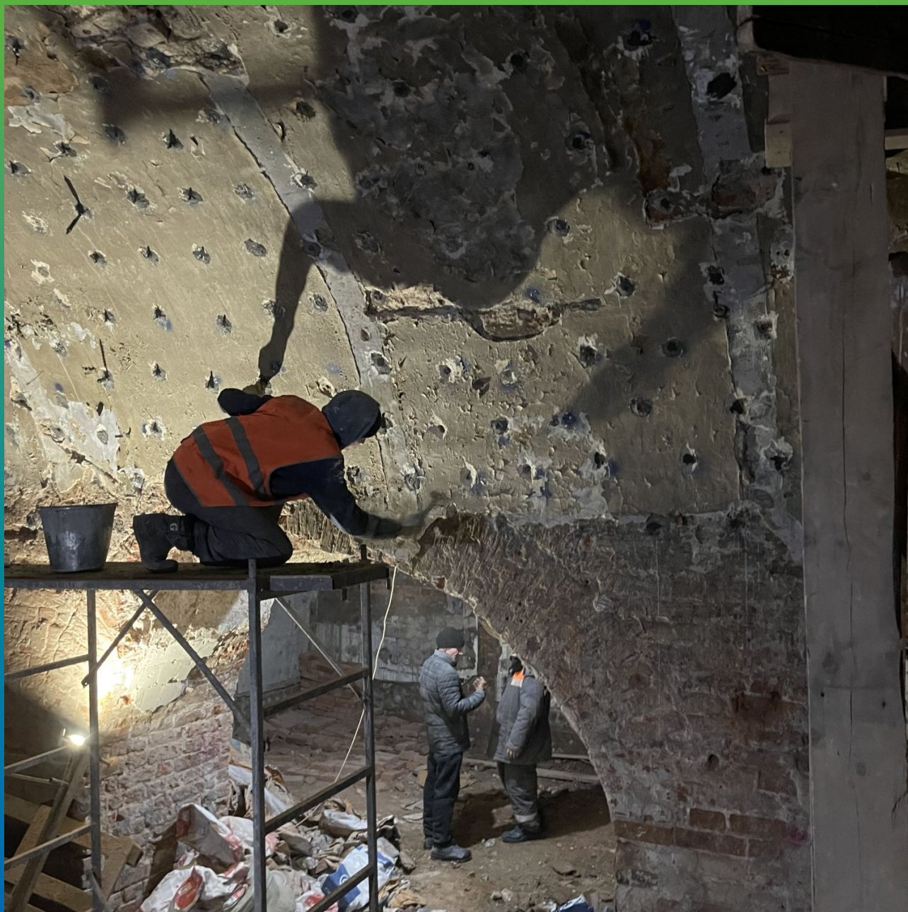
Демонтаж пакеров после инъецирования Маноцем Фил