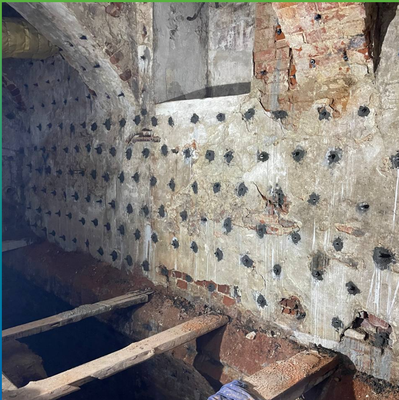
Стена, инъецированная составом Манокрил Гель Р