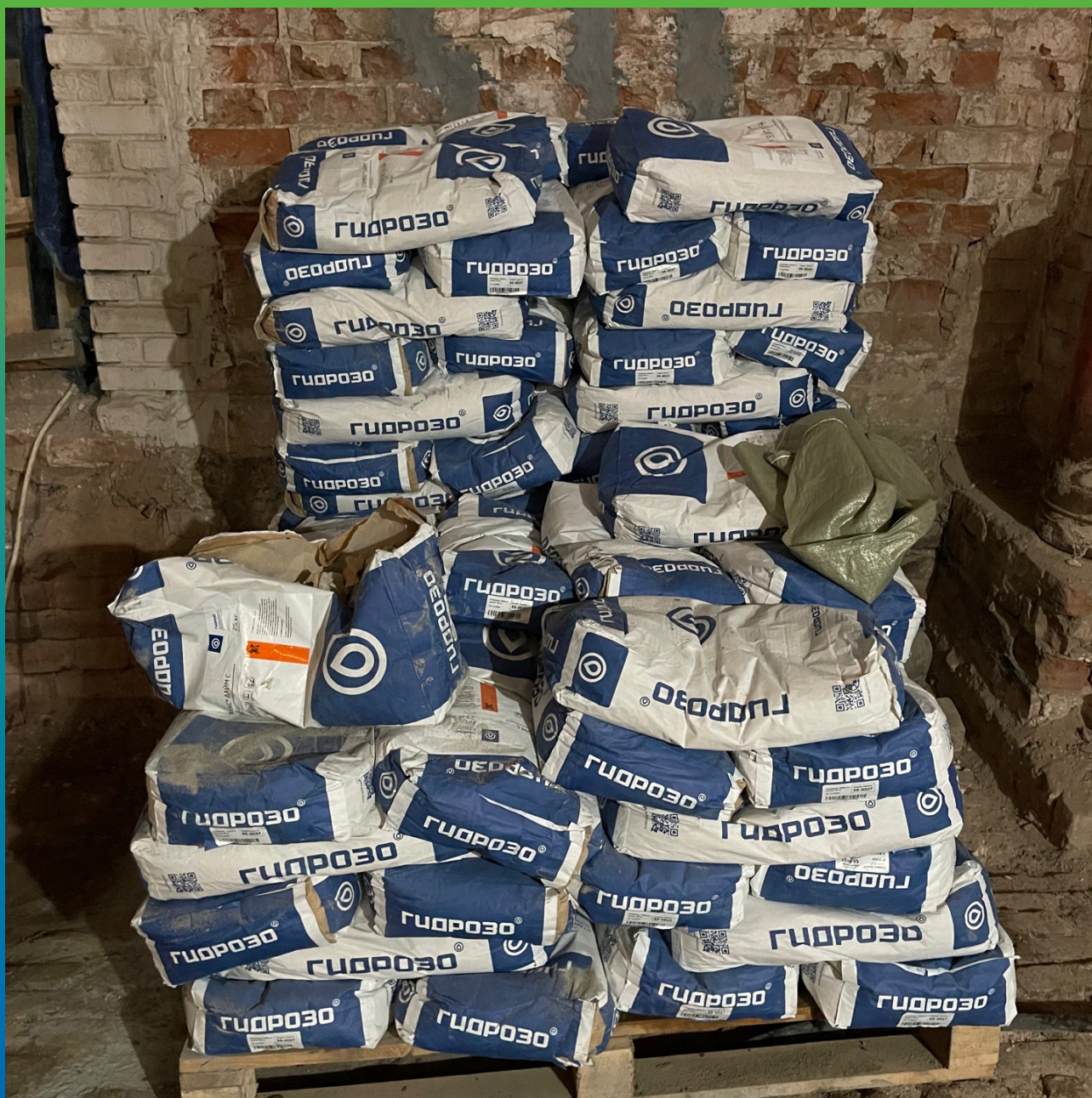
Материал на объекте. Стармекс Лайм С