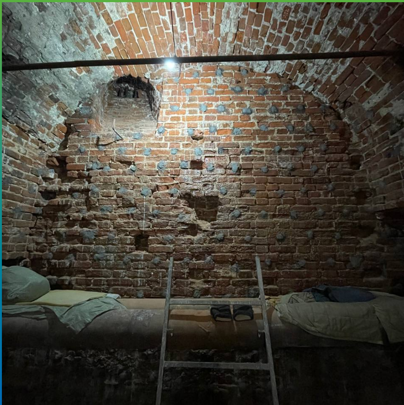
Вид сводов и стен после инъектирования Маноцем Фил и демонтажа пакеров. Заделка отверстий производится составом Стармекс Лайм С