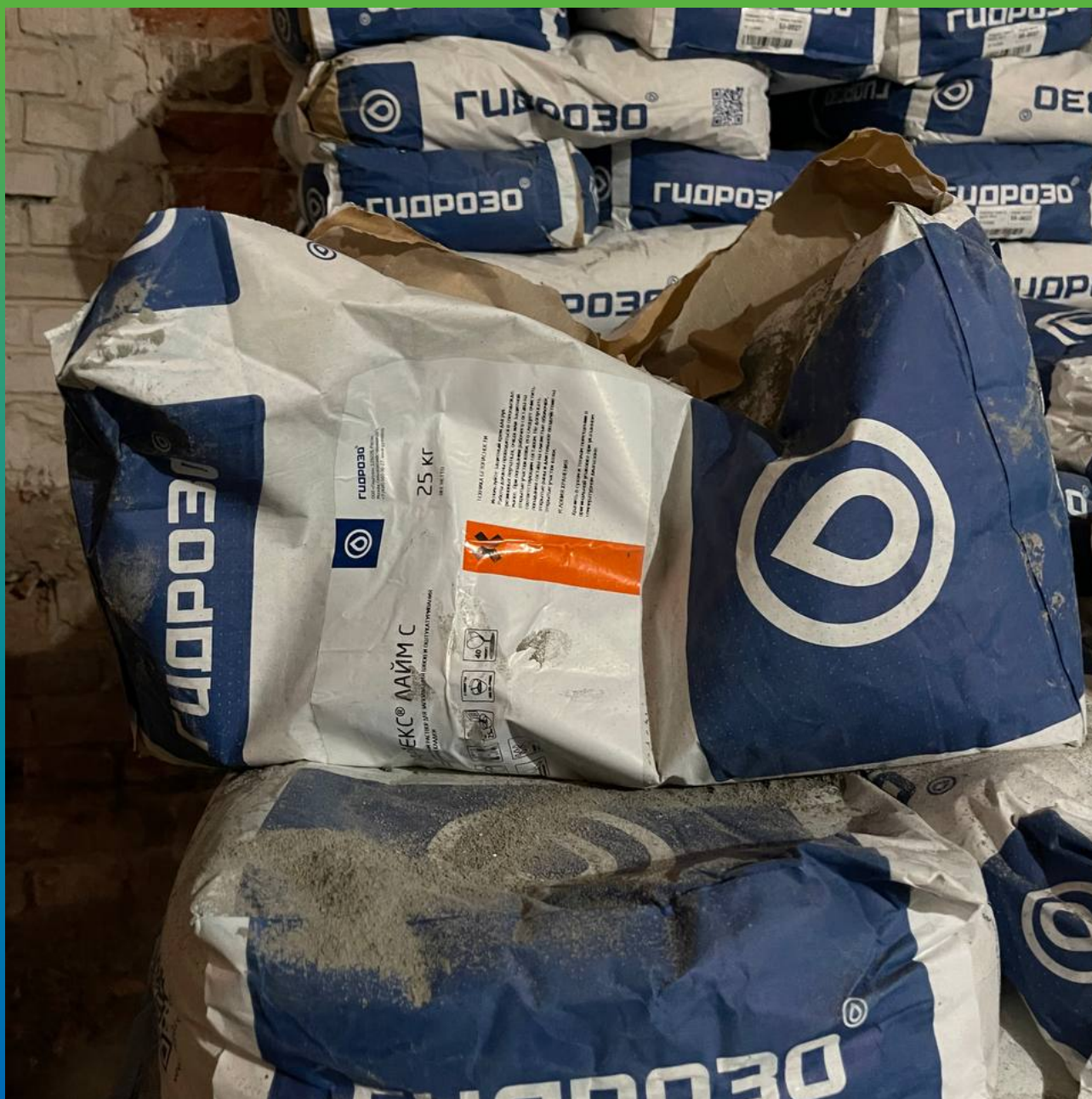
Материал на объекте. Стармекс Лайм С