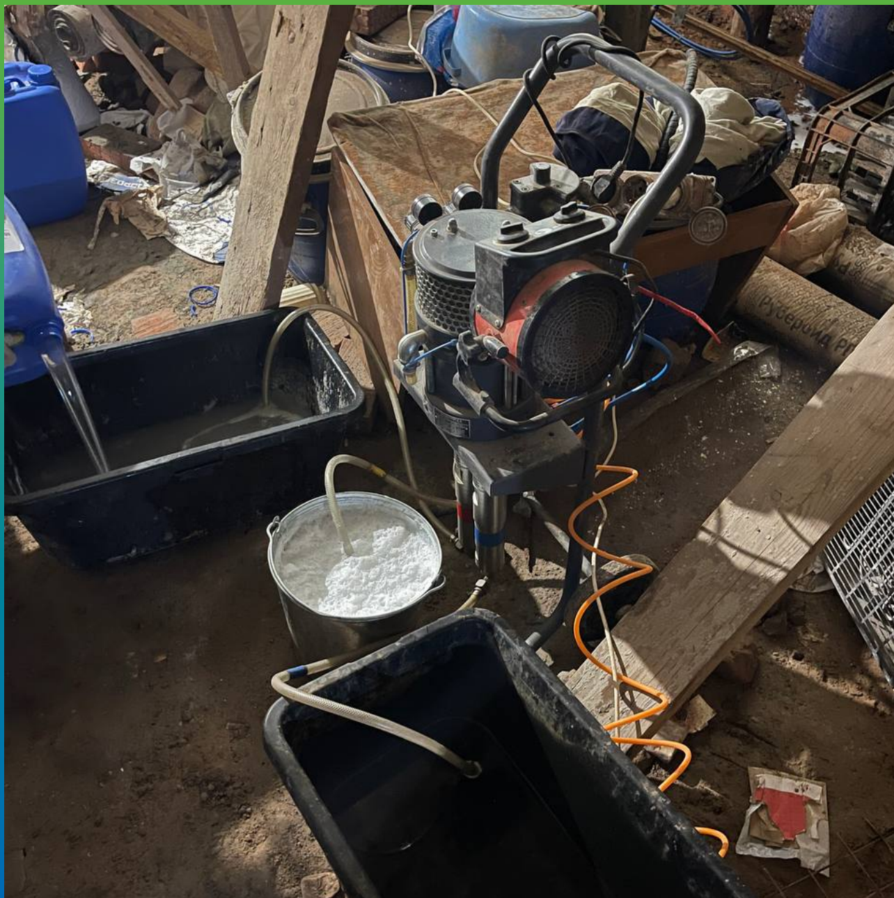
Подготовка состава Манокрил Гель Р для инъектирования