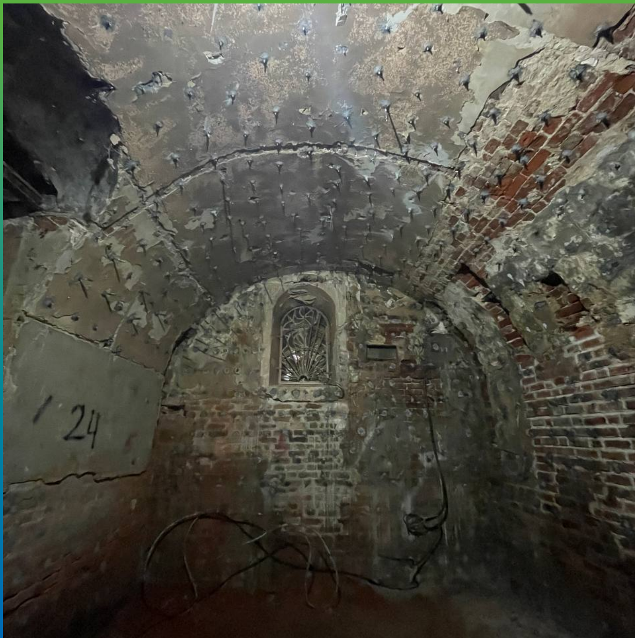
Вид сводов перед инъектированием