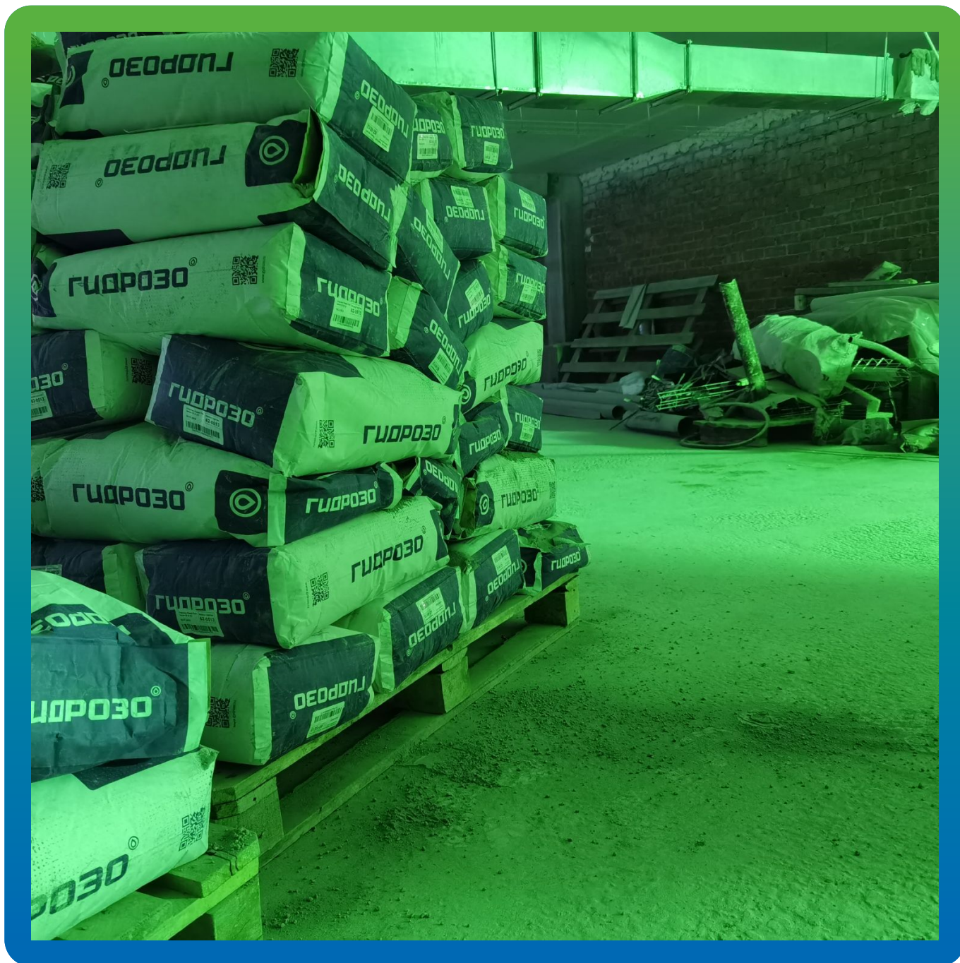
Материалы производства "Гидрозо" на объекте