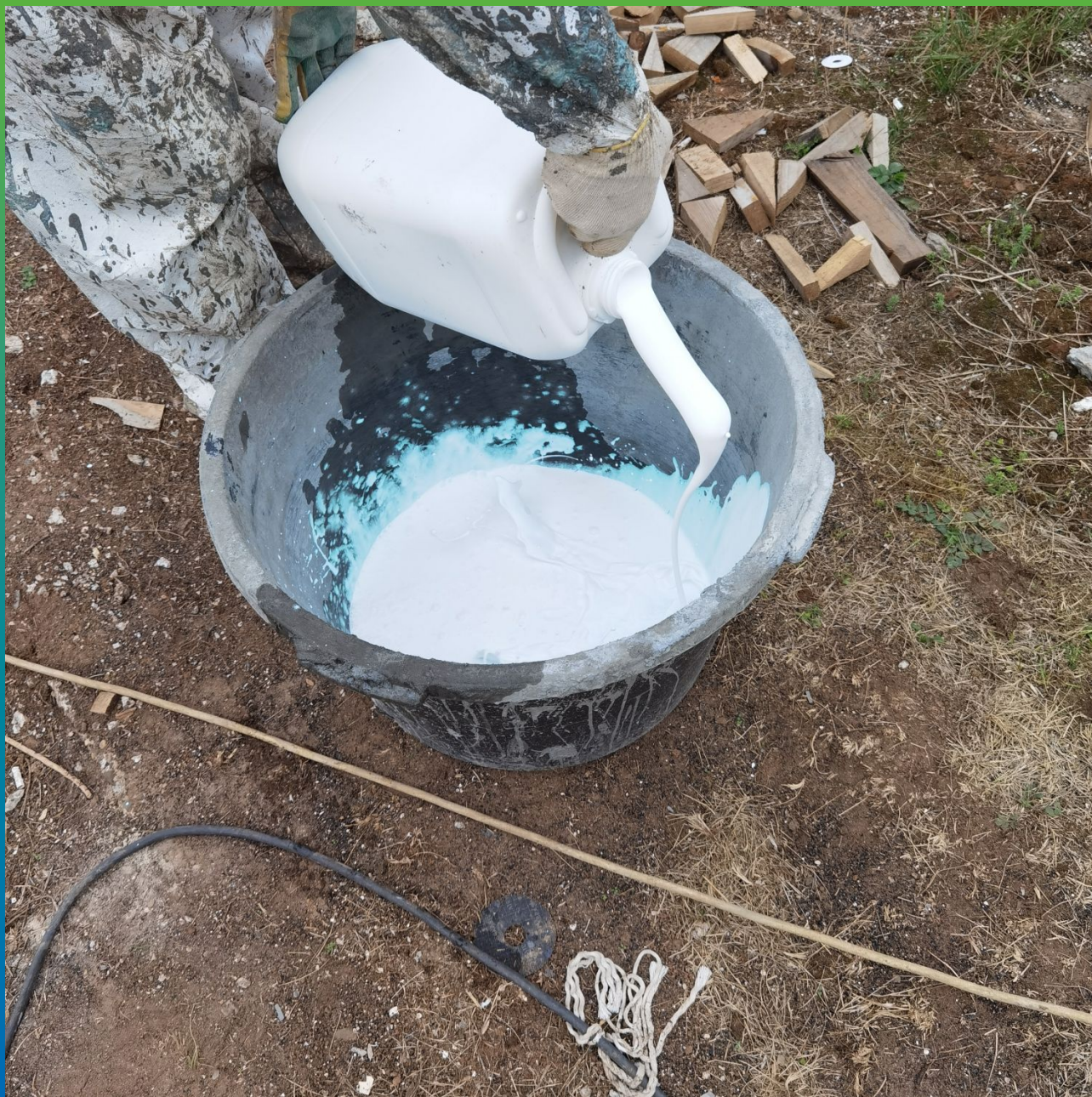
Затворение 2К Материала Стармекс Флекс Экспресс