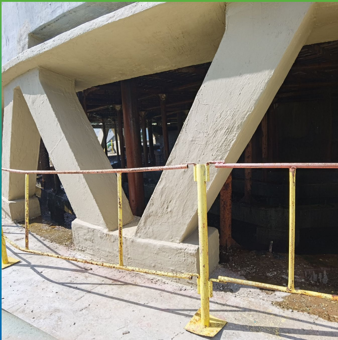
Нанесение Стармекс Флекс Экспресс на внешне элементы конструкции