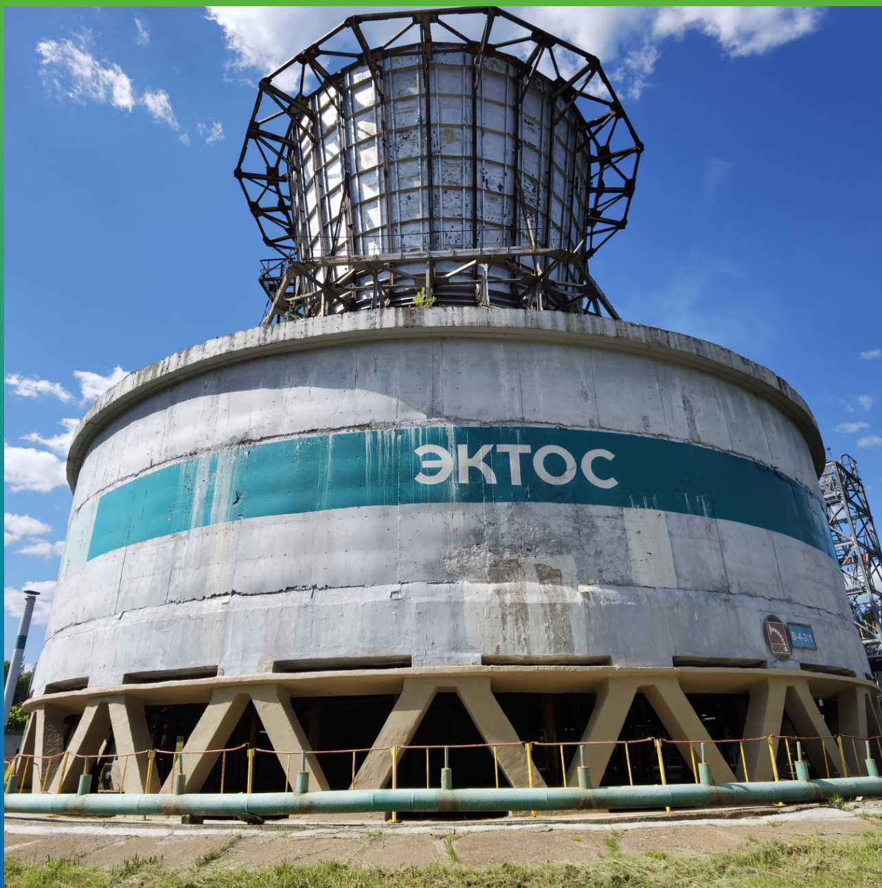
Объект после завершения работ по ремонту и гидроизоляции