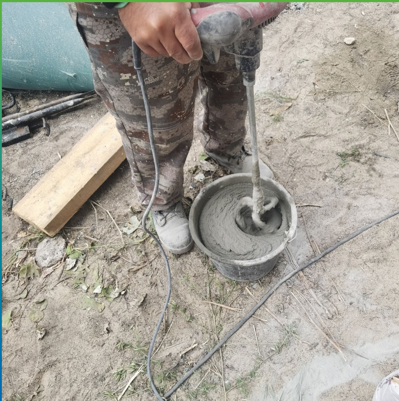
Перемешивание состава до однородной консистенции