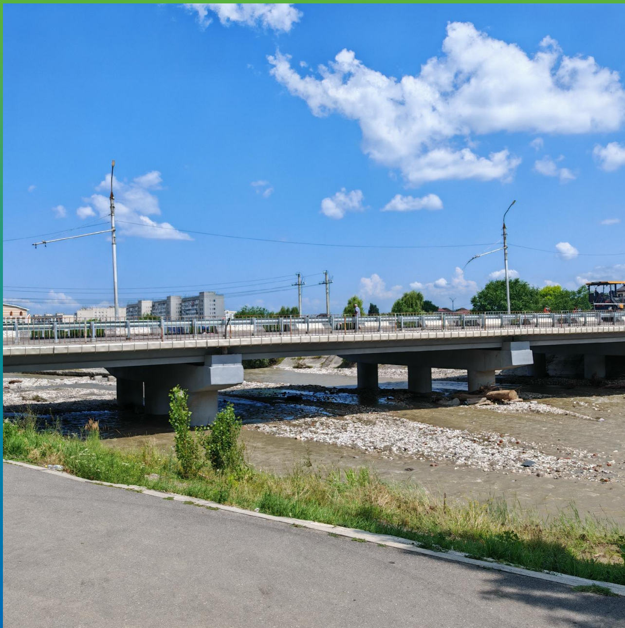
МОСТ ЧЕРЕЗ Р. НАЛЬЧИК ПО УЛ. ОСЕТИНСКАЯ

Гидроизоляция проезжего полотна перед укладкой асфальта