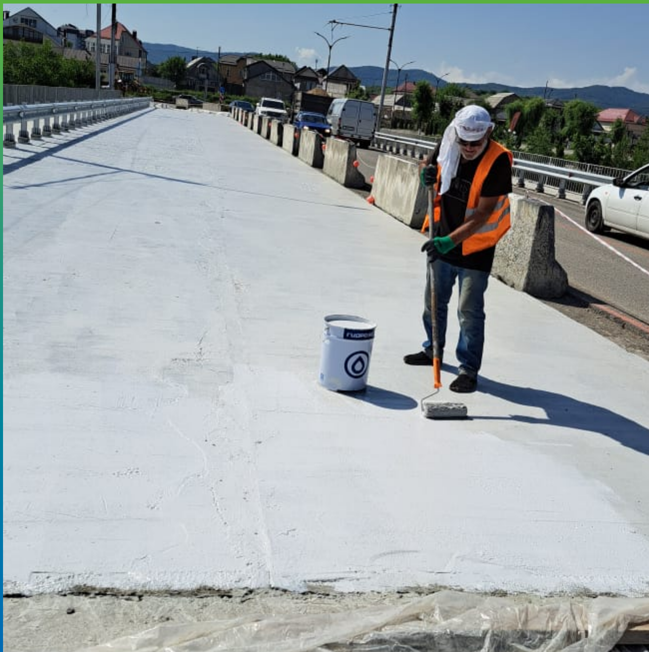
Процесс нанесения второго слоя гидроизоляции ДенТоп ПУ 228