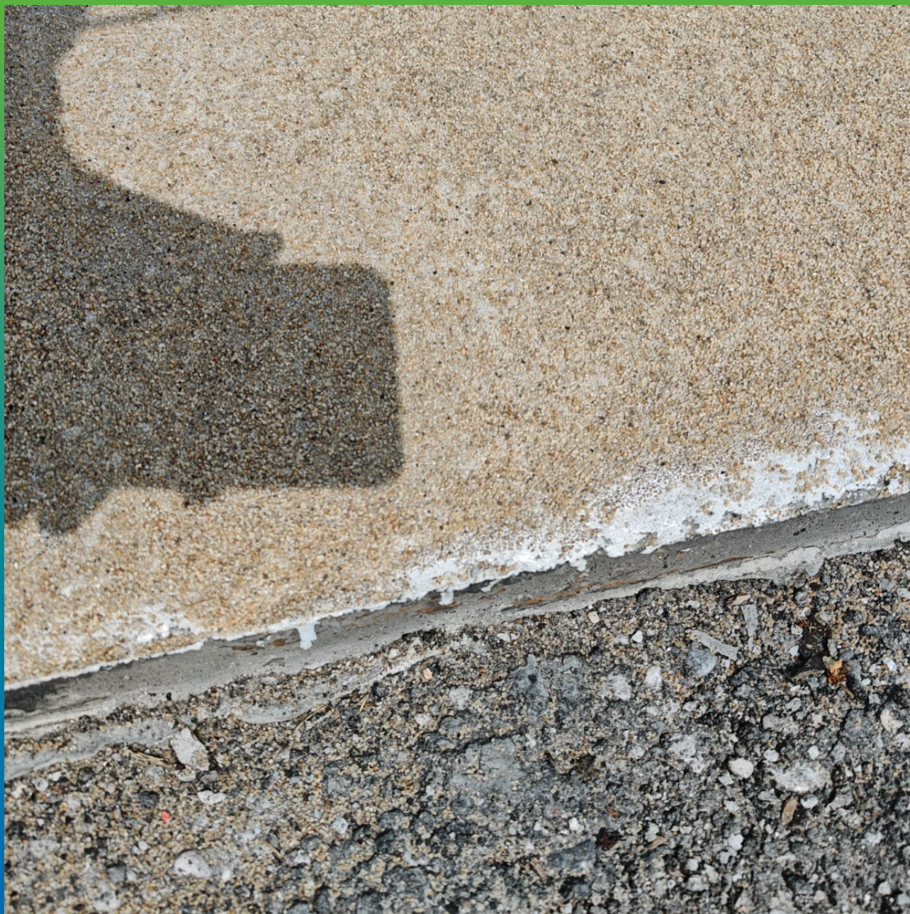
Финишный вид покрытия крупным планом