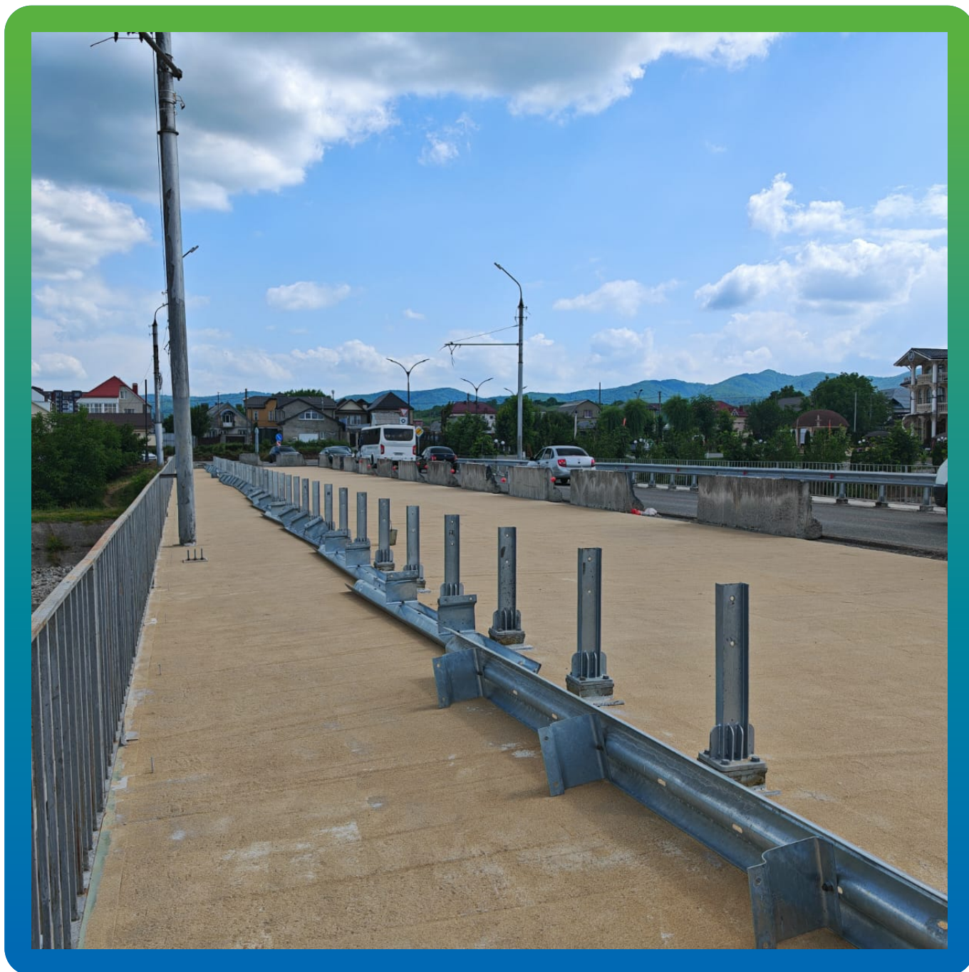
Общий вид половины моста с выполненной гидроизоляцией и засыпкой