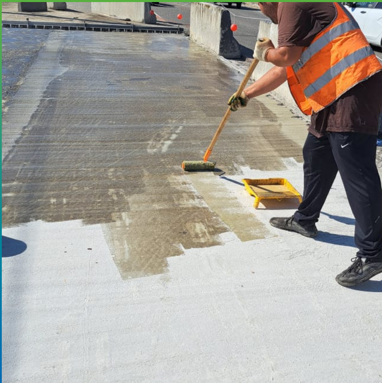
Нанесение двухкомпонентного праймера Манодил ПУ 90