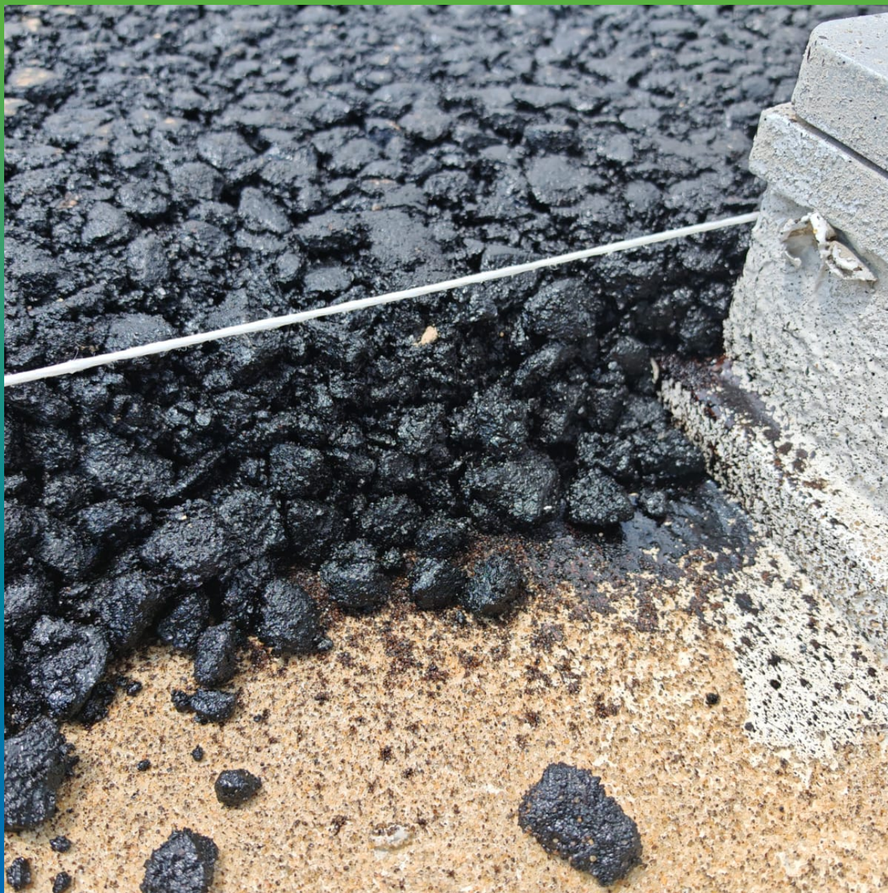
Крупный план асфальта поверх гидроизоляции