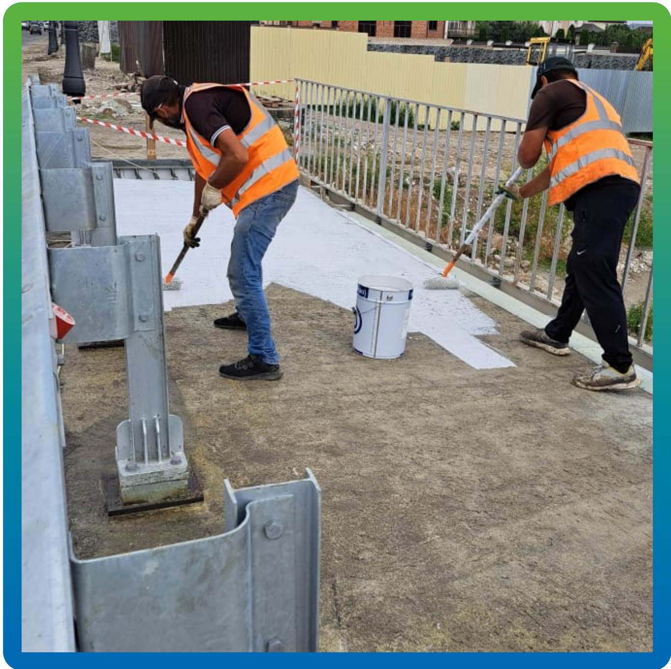
Процесс нанесения первого слоя гидроизоляции ДенТоп ПУ 228 (2)