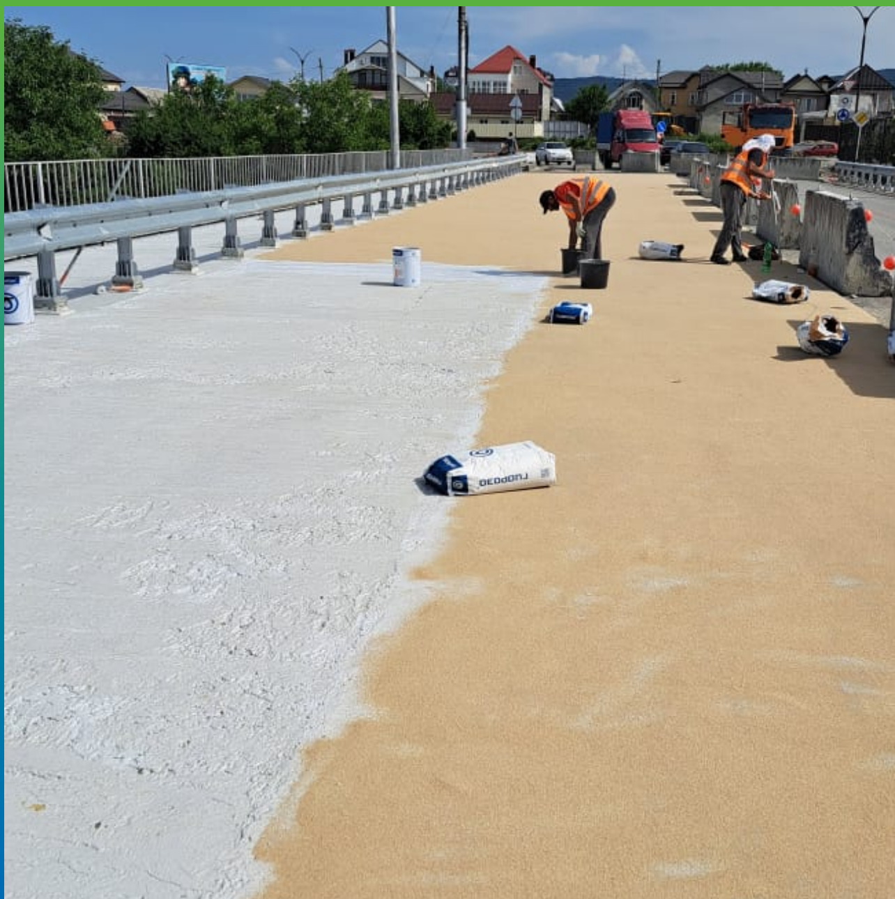
Процесс просыпки ДенТоп Филлера 01 поверх свежеложенного третьего слоя гидроизоляции