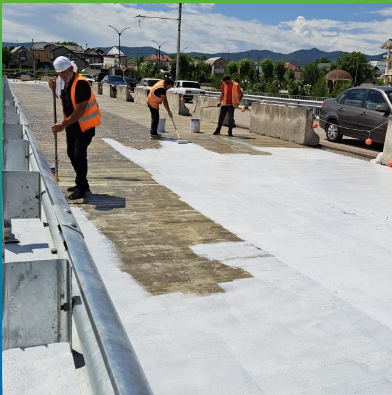
Процесс нанесения первого слоя гидроизоляции ДенТоп ПУ 228