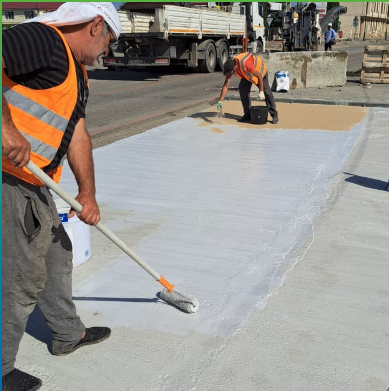
Процесс нанесения третьего слоя гидроизоляции ДенСтол ПУ 228 с параллельной засыпкой ДенСтол Филлером 01