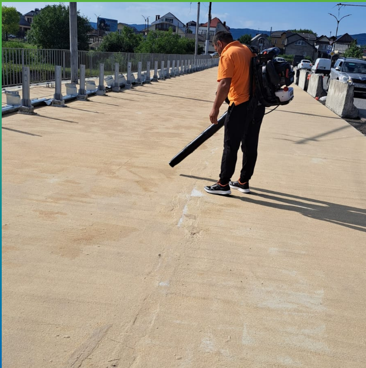
Процесс удаление оставшего ДенТоп Филлера, который не прилип к гидроизоляции