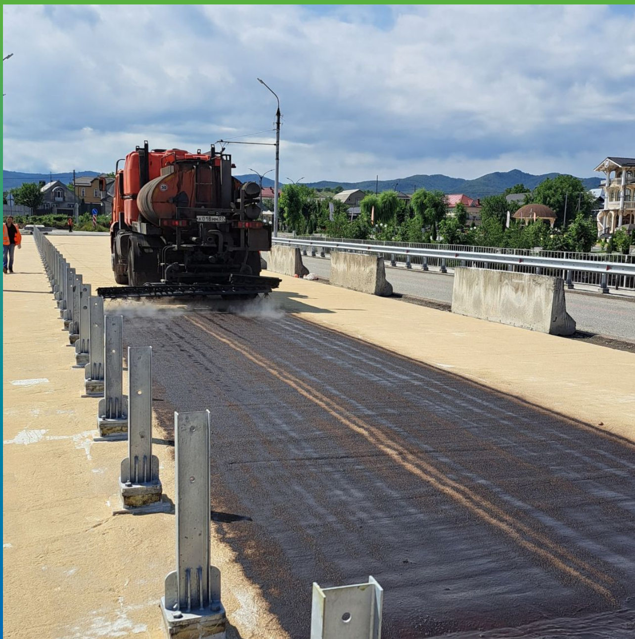
Нанесение битумного праймера перед укладкой асфальта