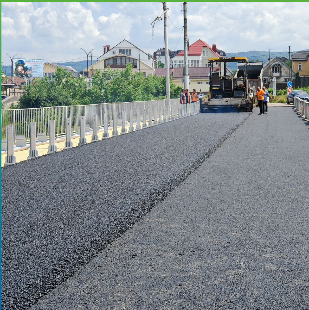
Процесс укладки асфальта