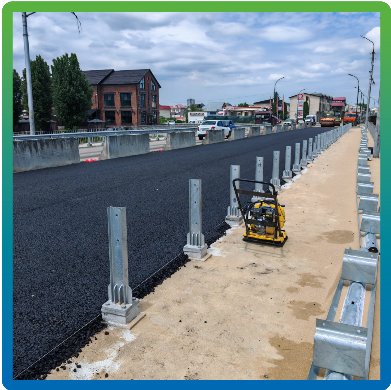
Уложенный асфальт на проезжей части моста