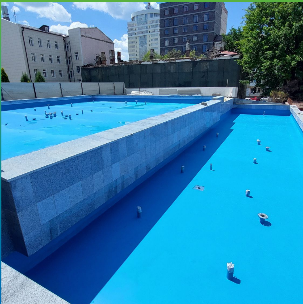
Финишный вид основания фонтана после гидроизоляции ДенсТоп ПУ 245 Пул