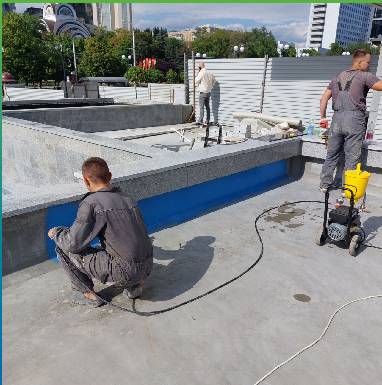
Начало нанесения краски на бортики