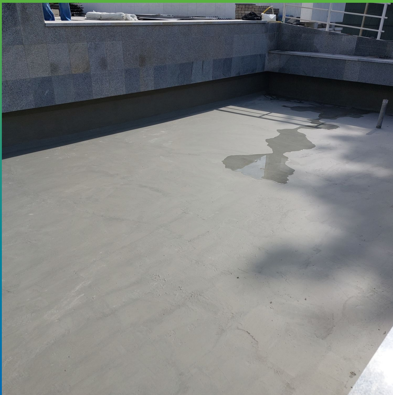
Фонтан, предварительно покрытый гидроизоляцией Стармекс Сил Флекс гладкий