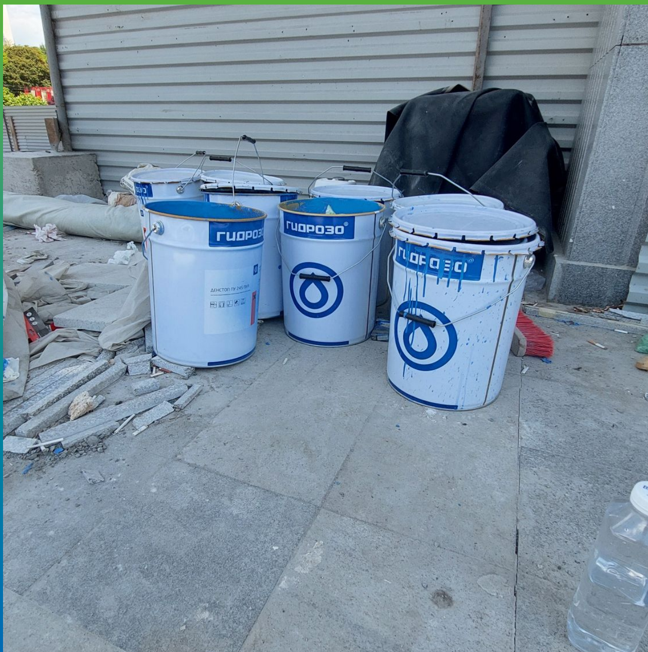
Краска для бассейнов и фонтанов ДенСтол ПУ 245 Пул