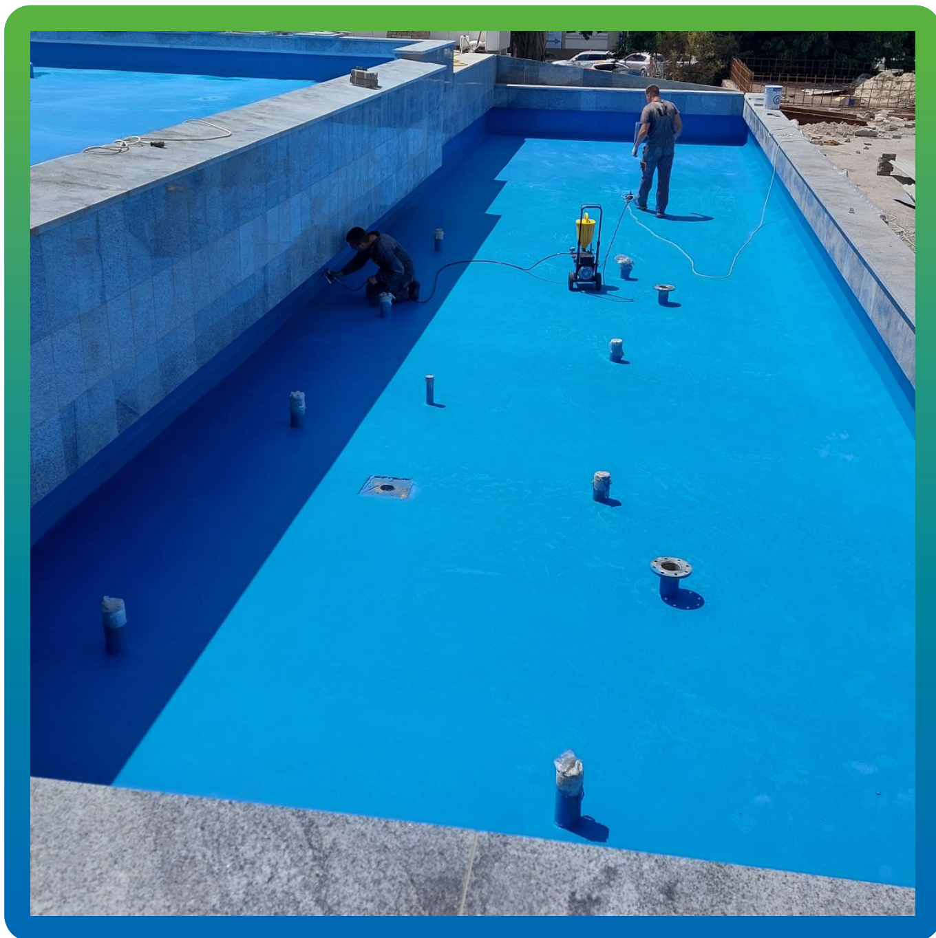
Нанесение второго слоя краски