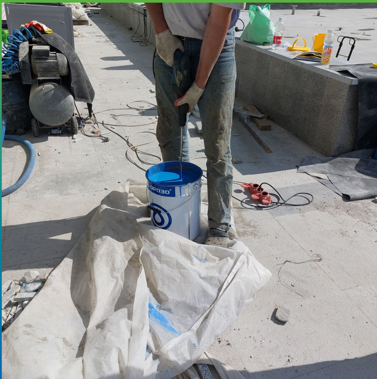
Подготовка 1К краски ДенсТоп ПУ 245 Пул перед нанесением