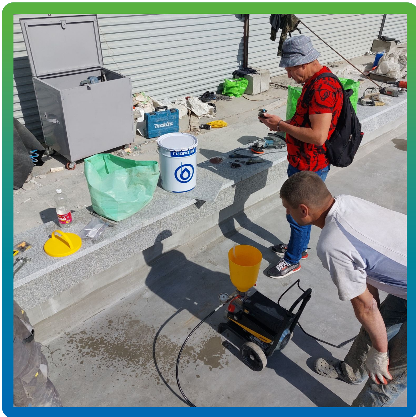
Подготовка оборудования перед покраской