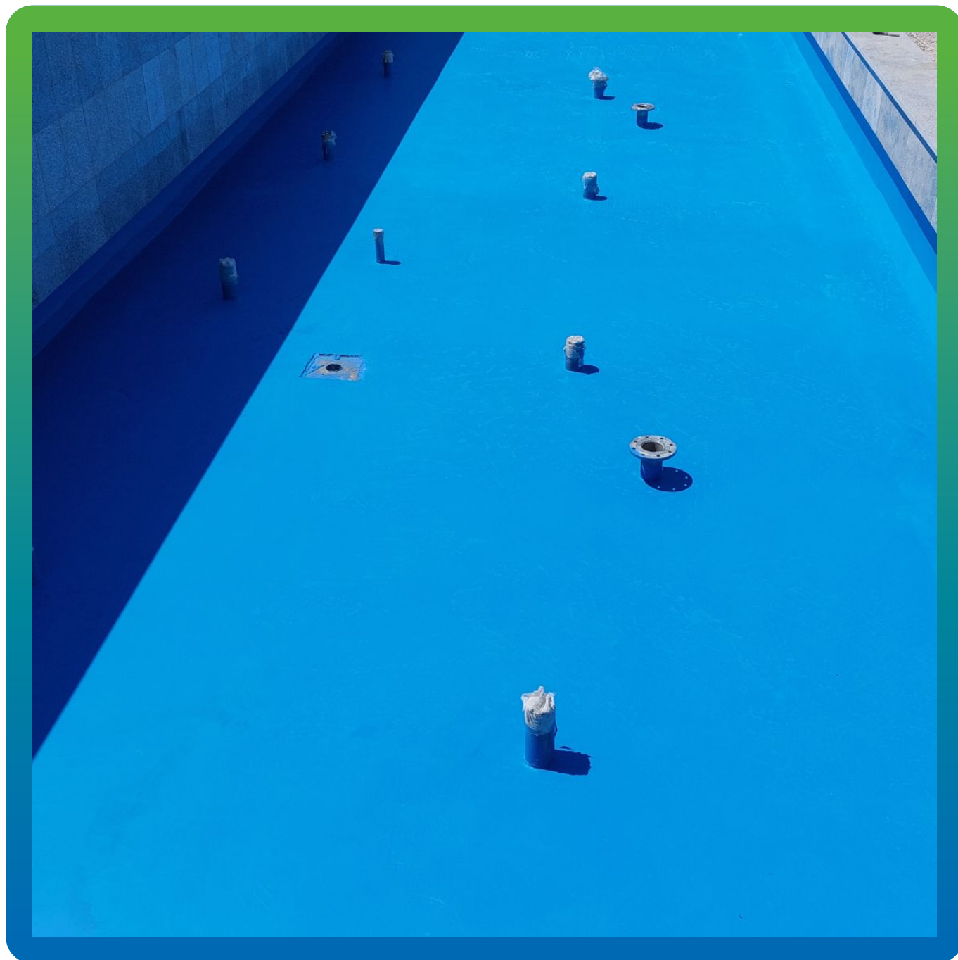
Финишный вид фонтана