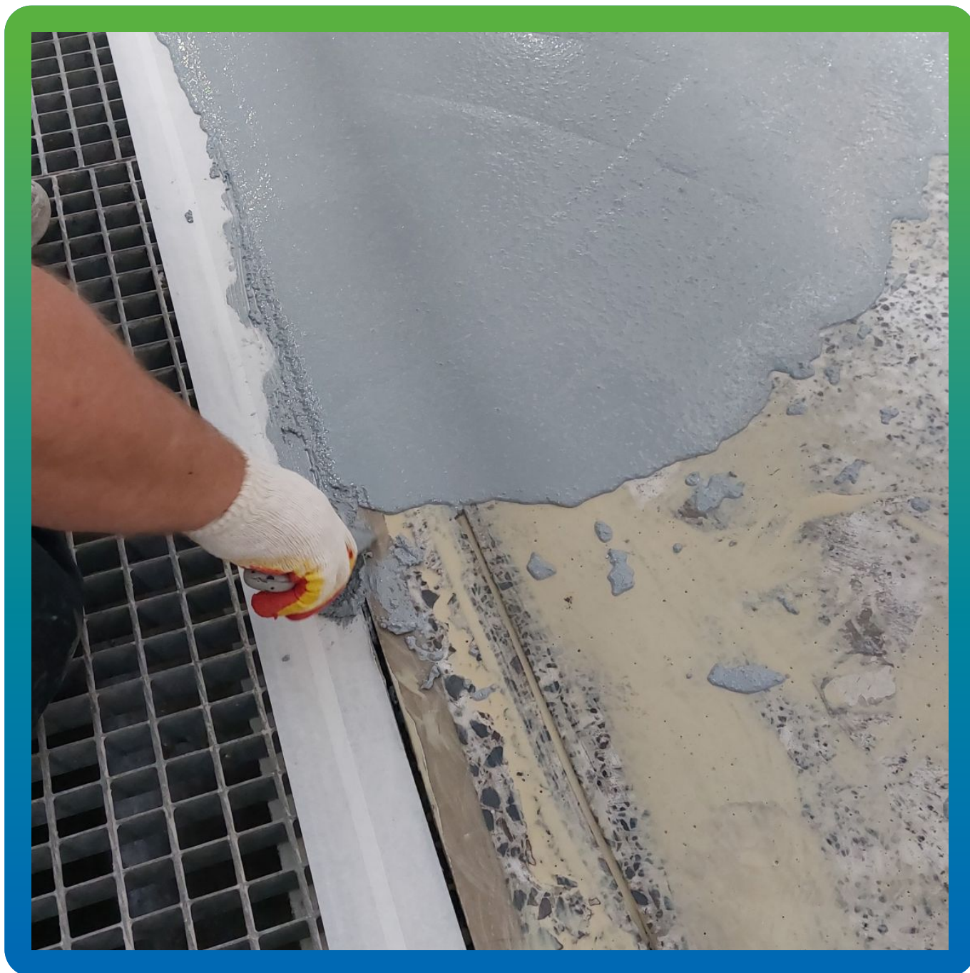
Заполнение штроб вдоль лотков