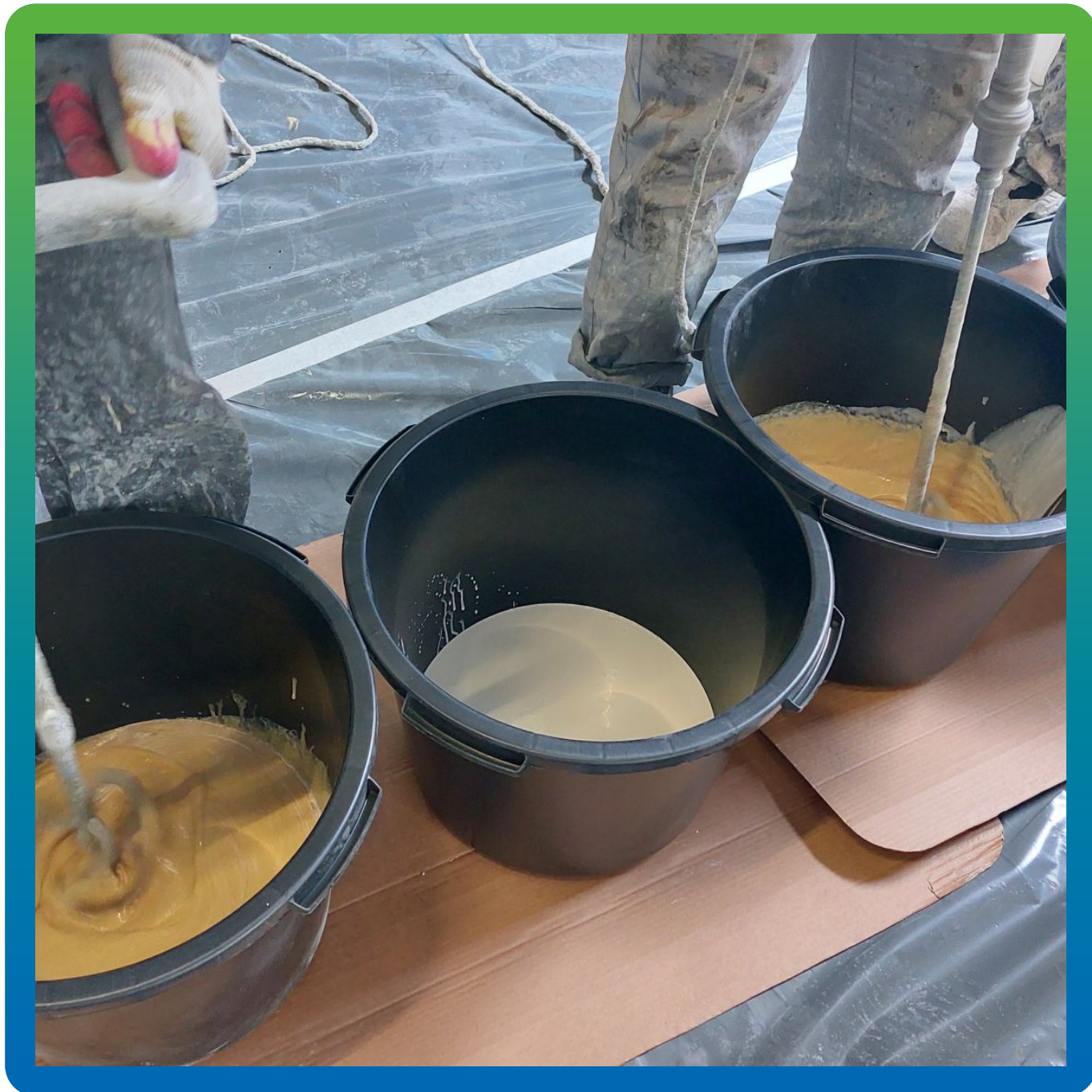
Смешивание жидких компонентов полиуретанцемента ДенсТоп ПМ 605 Тровел