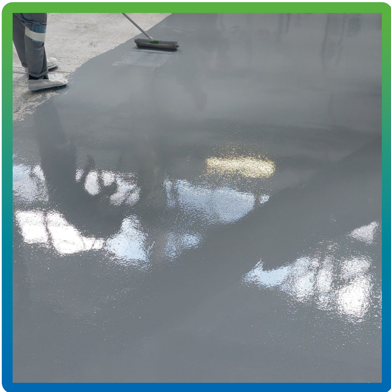
Рабочий процесс по укладке полиуретанцементного покрытия