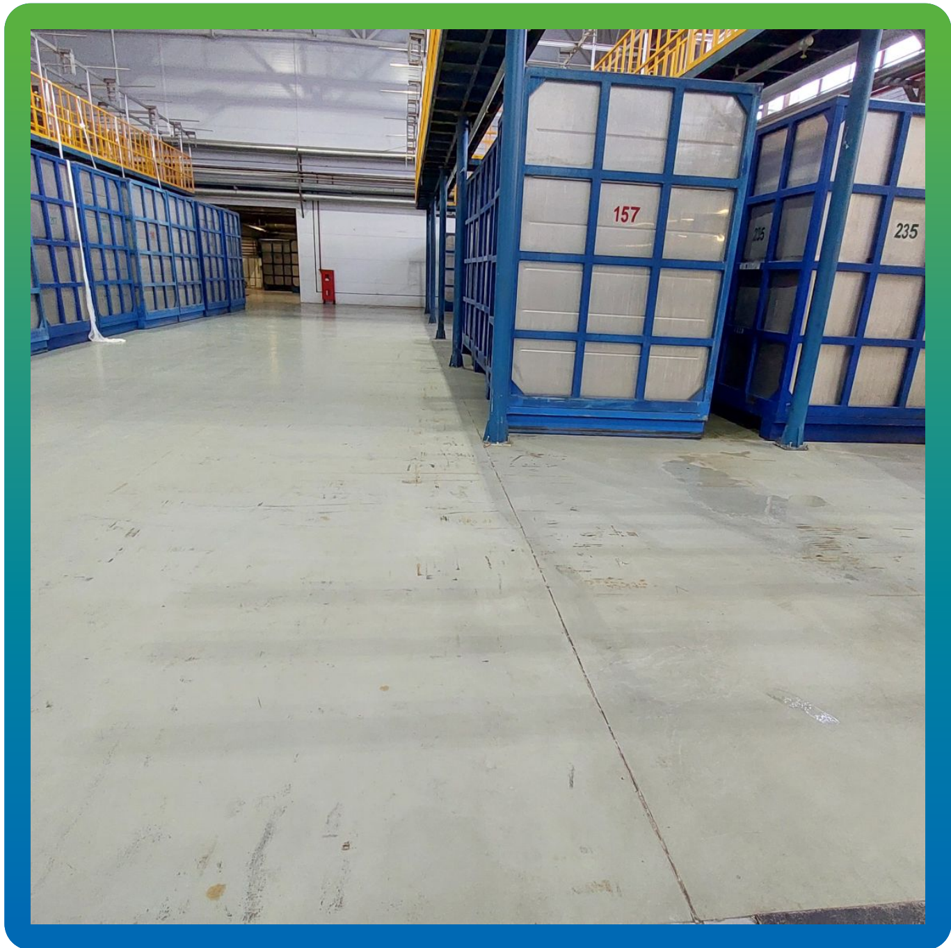
Внешний вид в процессе активной эксплуатации