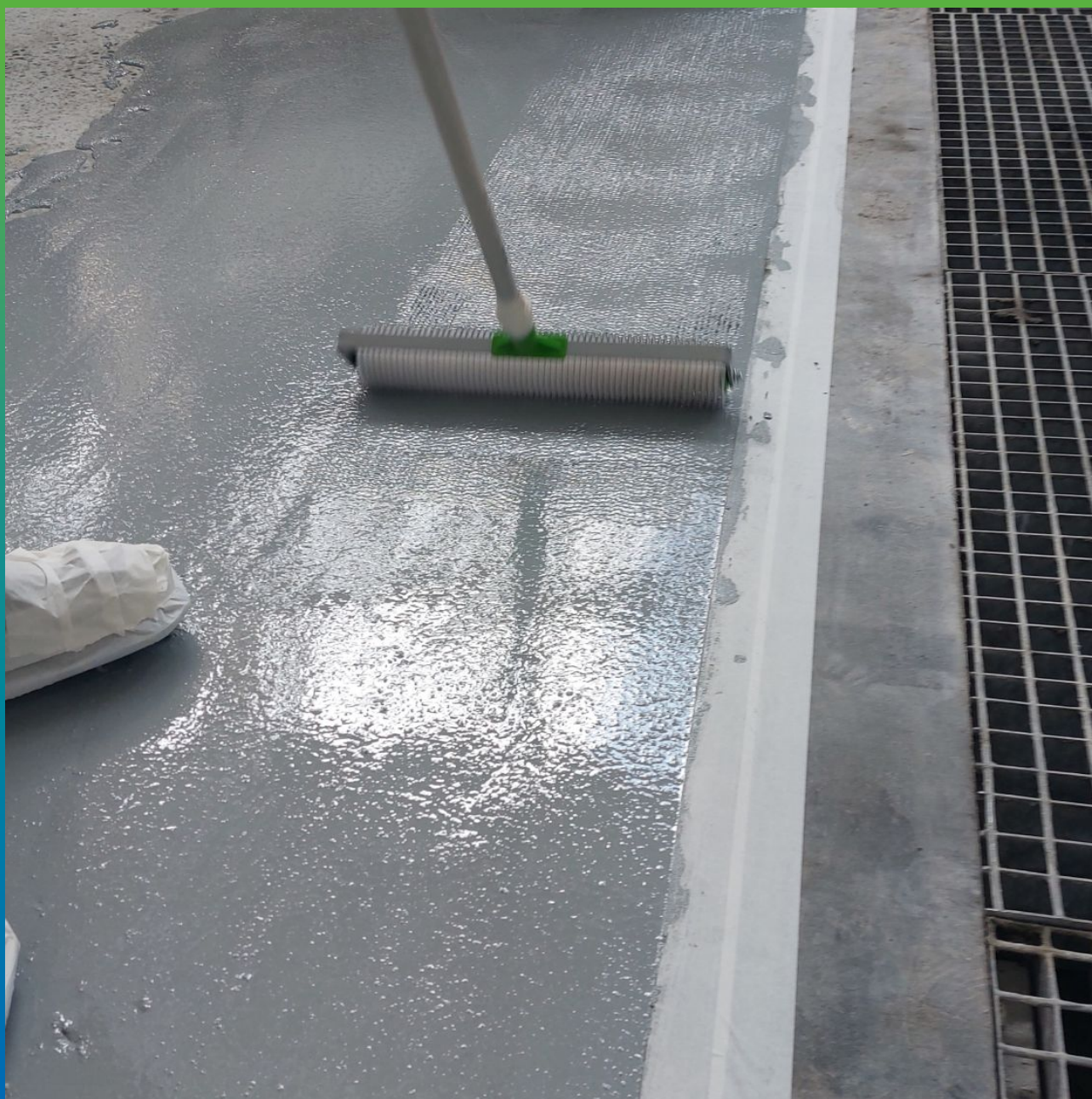
Прокатка игольчатым валиком покрытия ДенТоп ПМ 605 Тровел