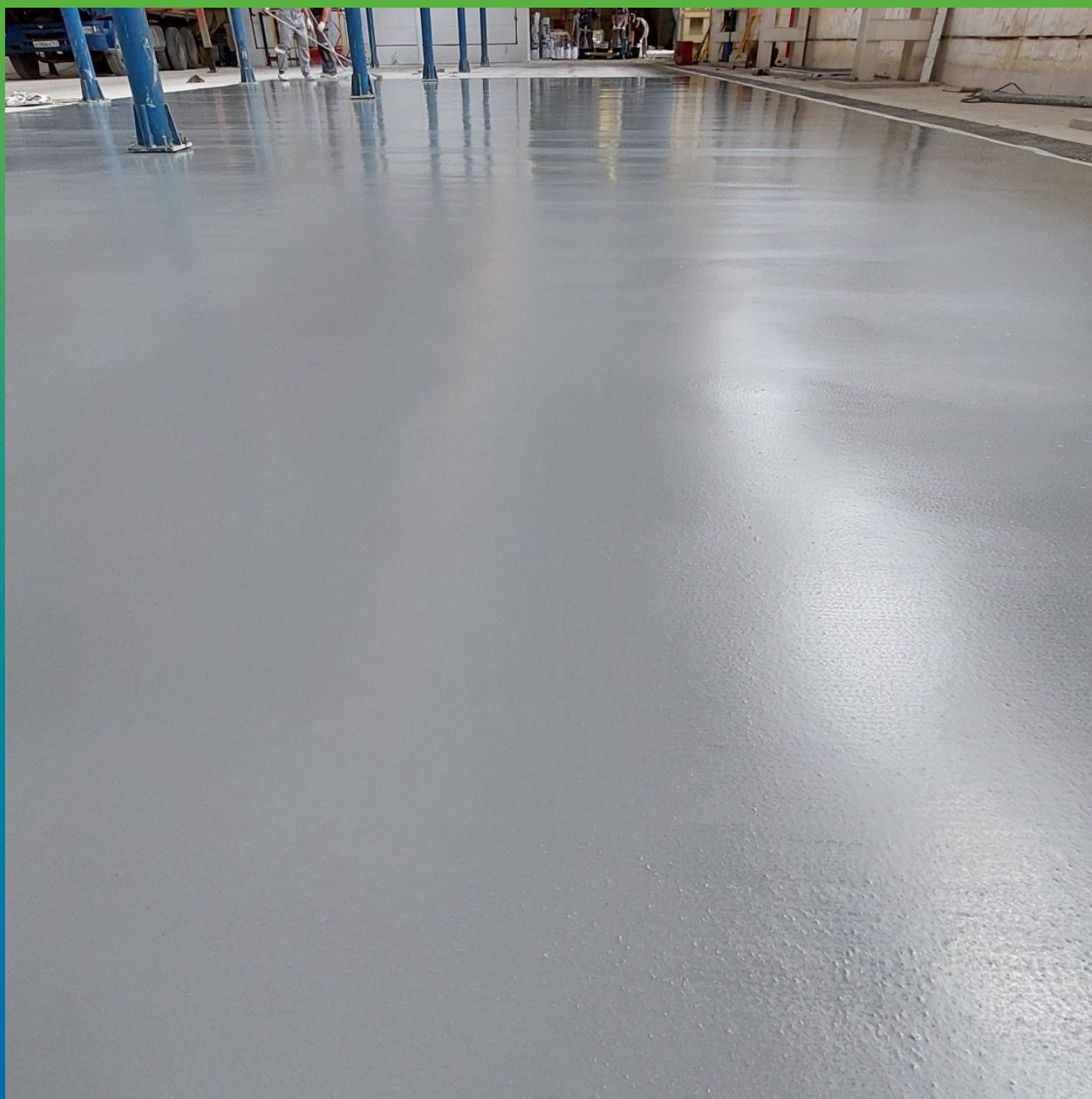
Монтаж защитного покрытия пола в завершающей стадии