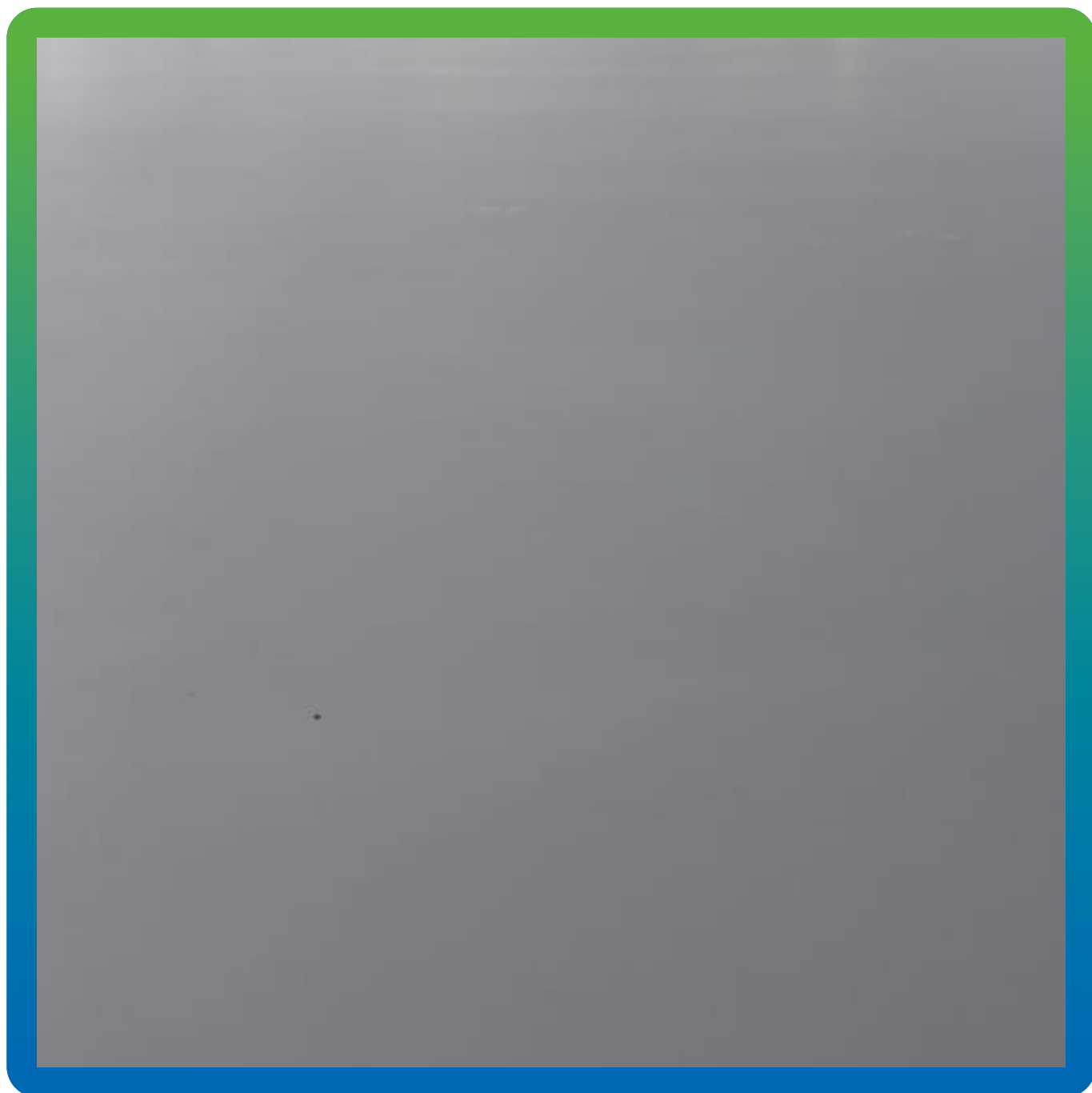
Финишный вид химстойкого ударопрочного покрытия ДенсТоп ПМ 605 Тровел