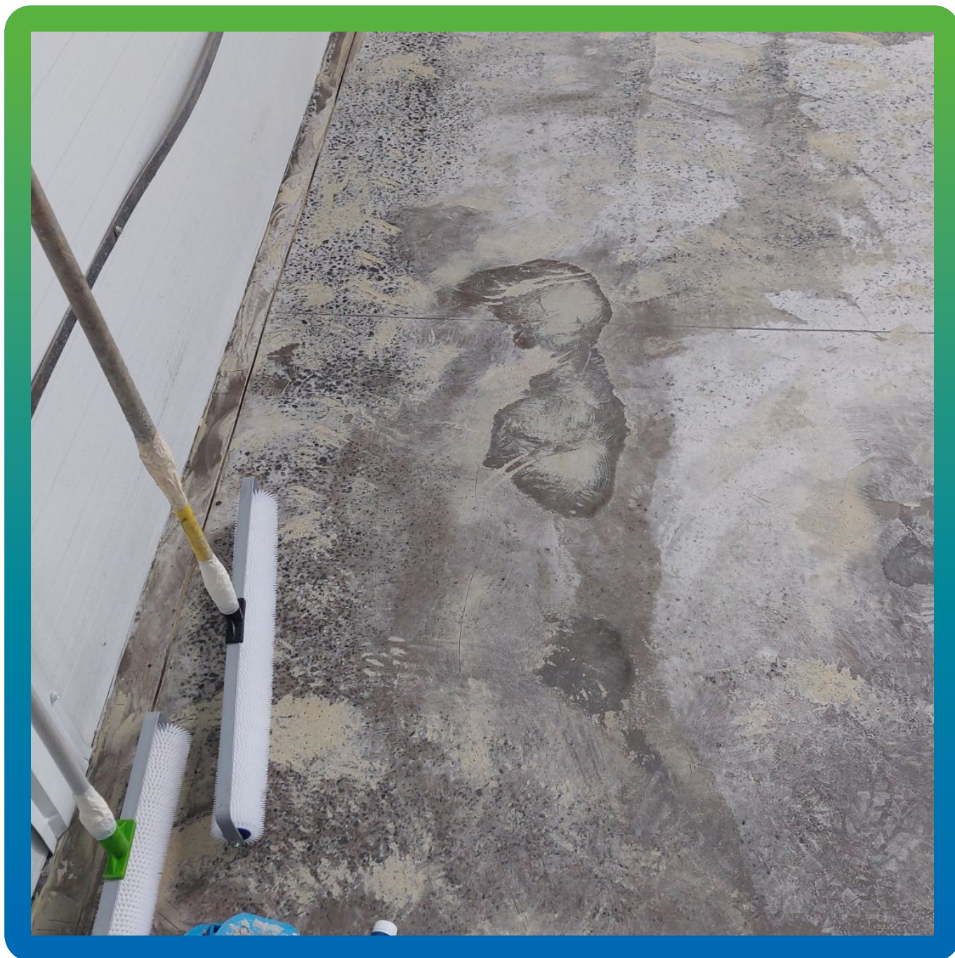
Игольчатые валики для прокатки покрытия