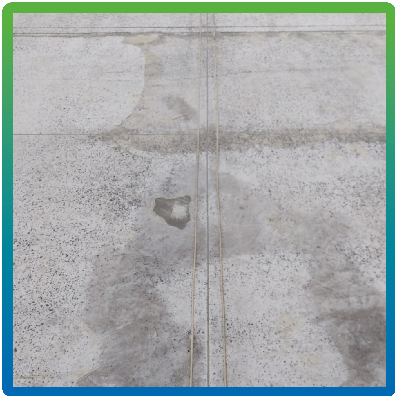
Нарезанные анкерные пропилы