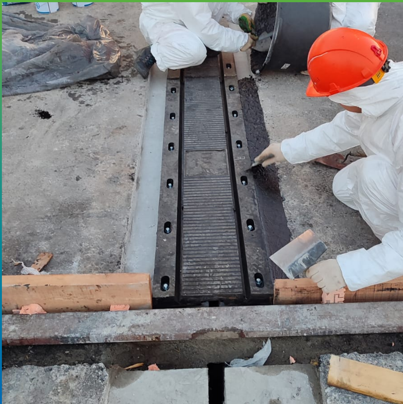
Процесс укладки Манопура 336