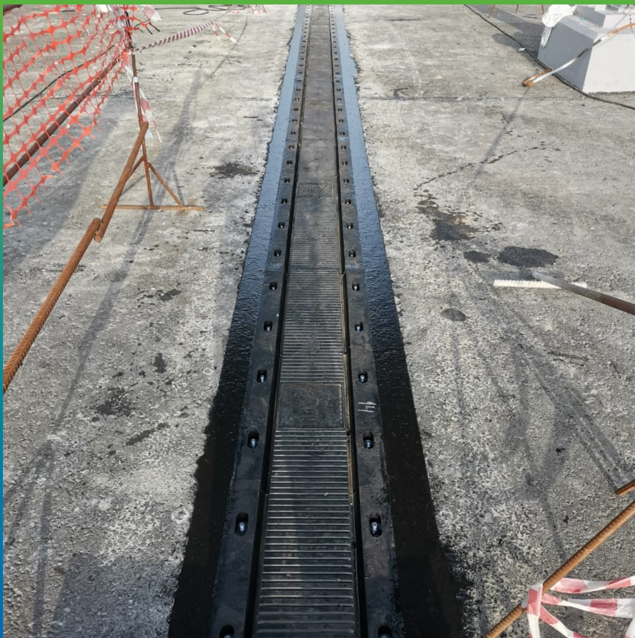
Финишный вид уложенного Манопура 336