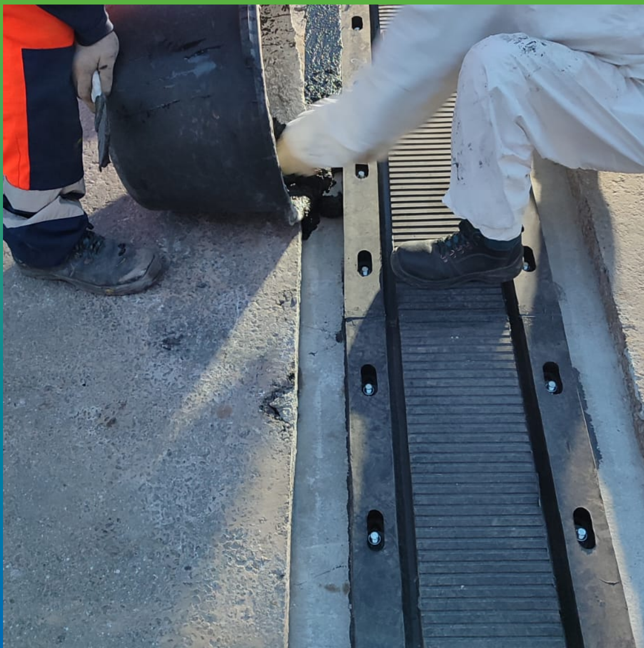
Процесс укладки Манопура 336