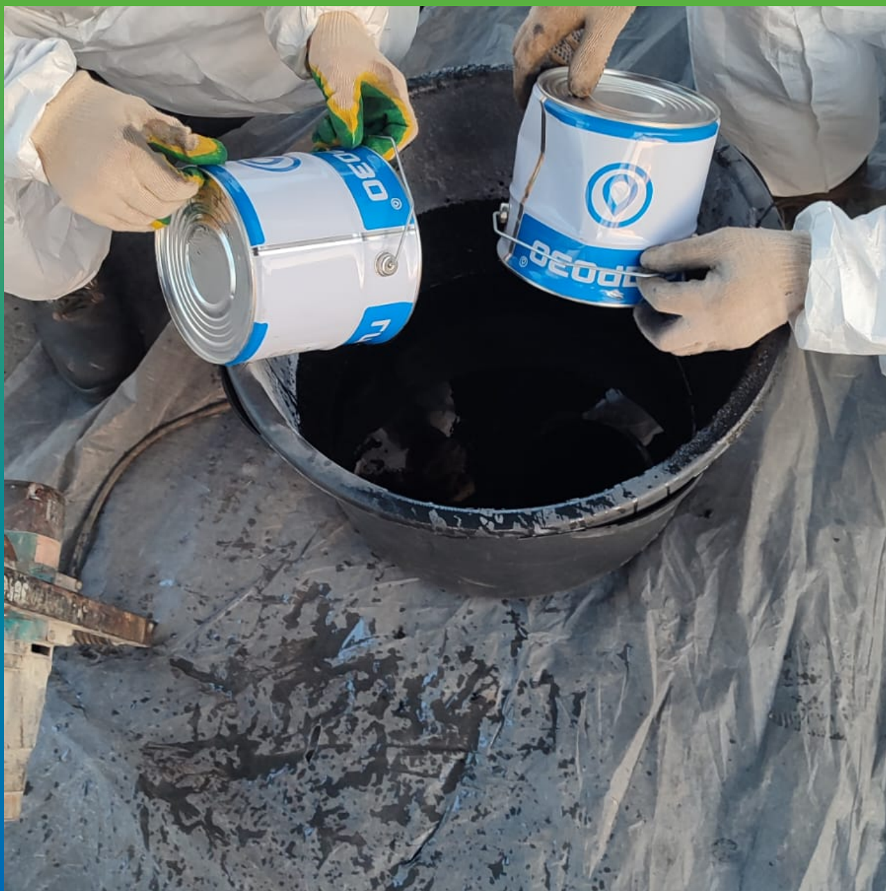
Процесс предварительного смешивания компонентов Б1 и Б2