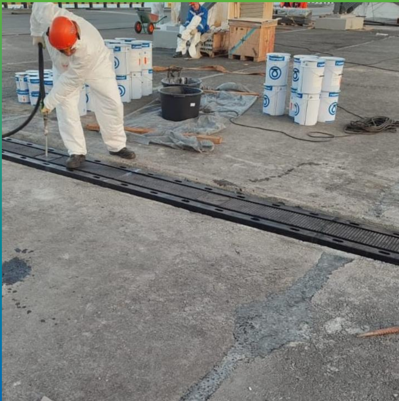
Продувка сжатым воздухом пришовной зоны