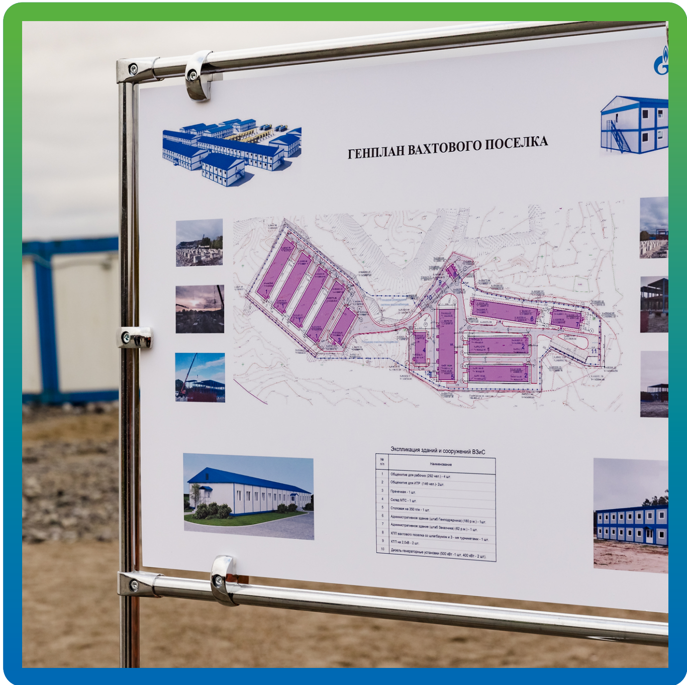
Генплан Порт Лавна