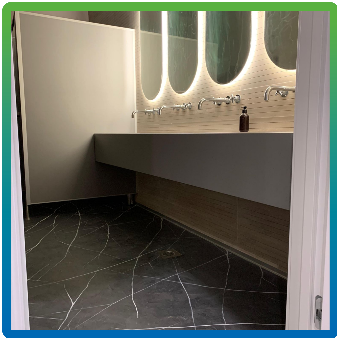
Финишный вид напольного покрытия зала