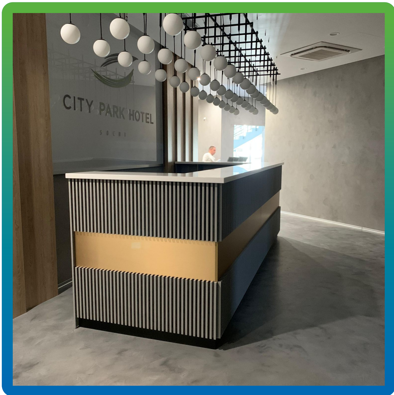
Финишный вид напольного покрытия холла