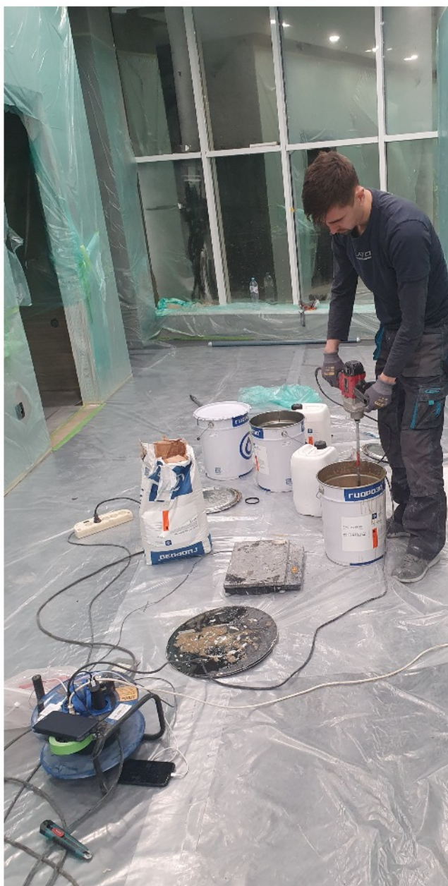
Подготовка состава ДенсТоп ЭП 106+ДенсТоп Филлер 004