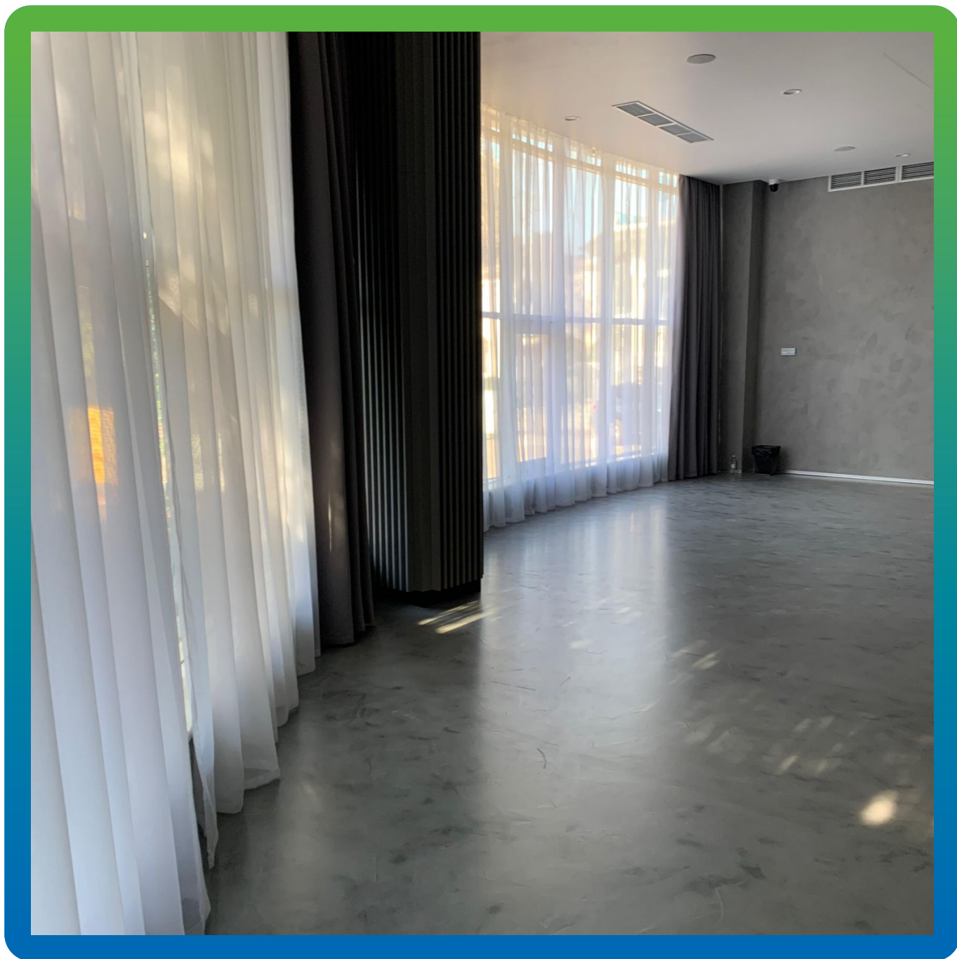
Финишный вид напольного покрытия зала