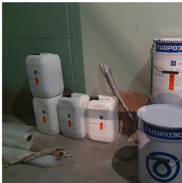
Материалы на объекте