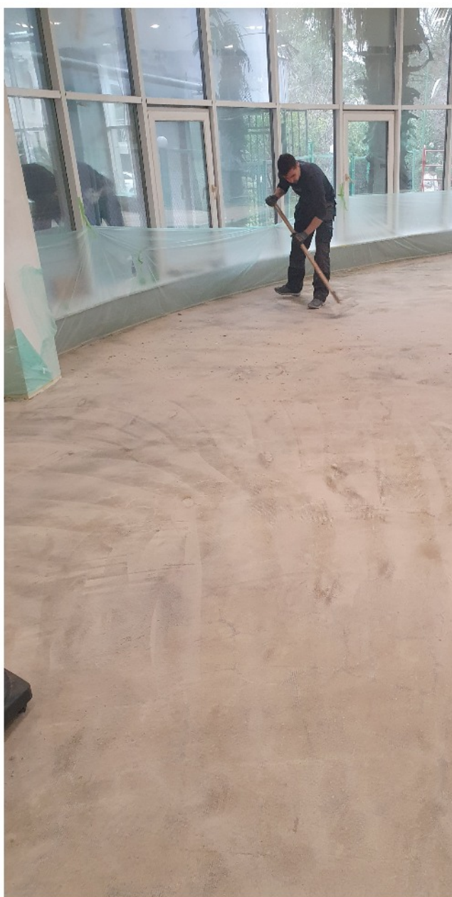
Шлифование и обеспыливание загрунтованной поверхности