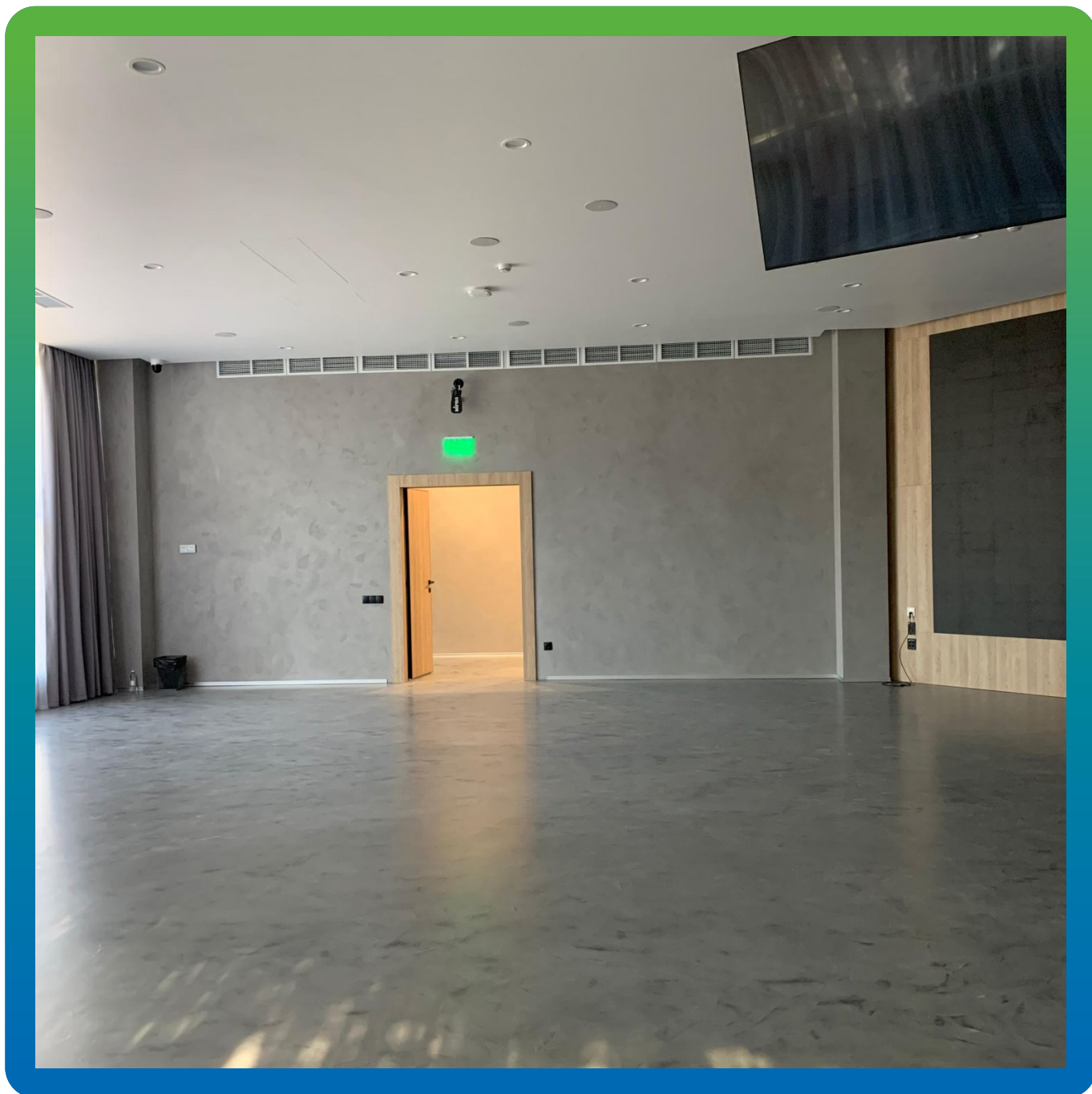
Финишный вид напольного покрытия зала