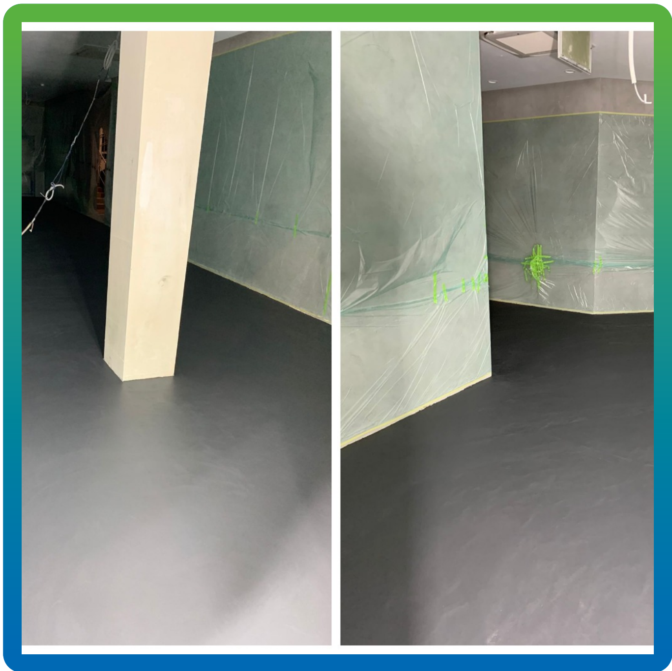
Микротоп База в два слоя перед нанесением Микротоп Финиш