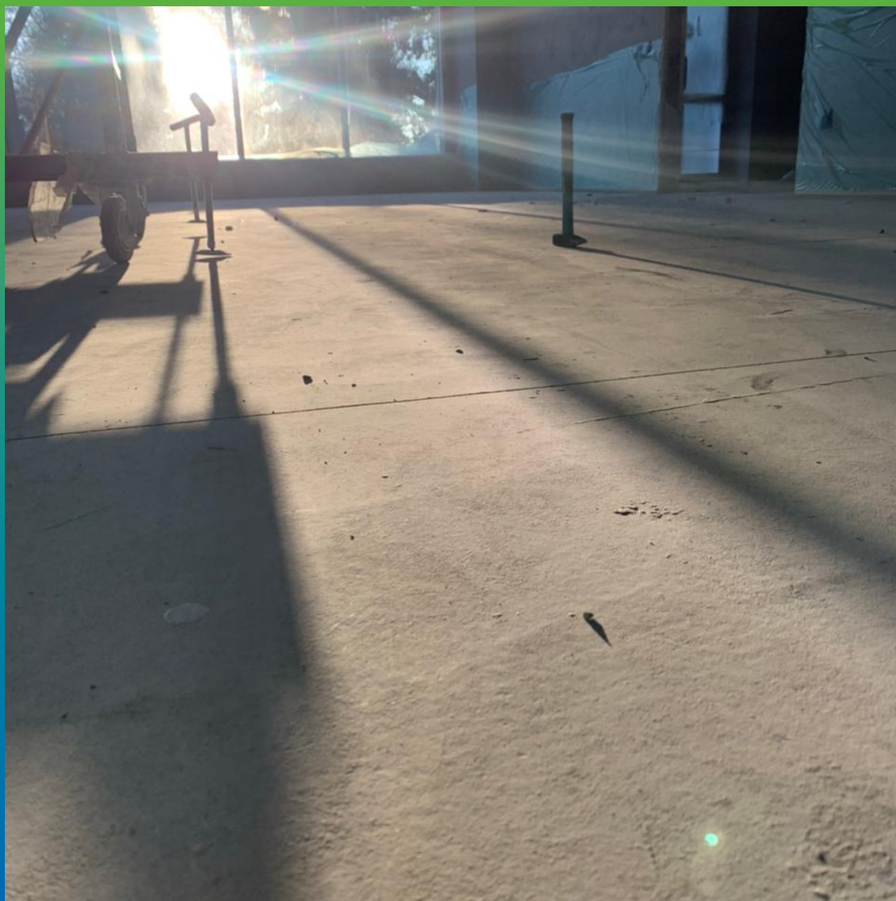
Выровненное основание с помощью наливного состава Стармекс Левел