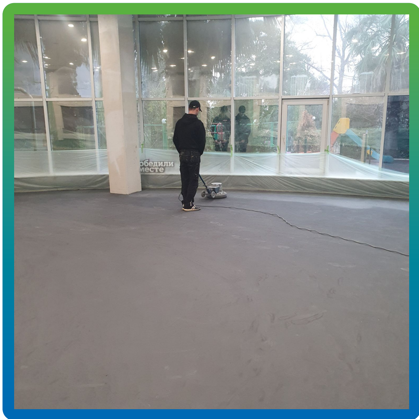
Шлифование первого слоя Микротоп База