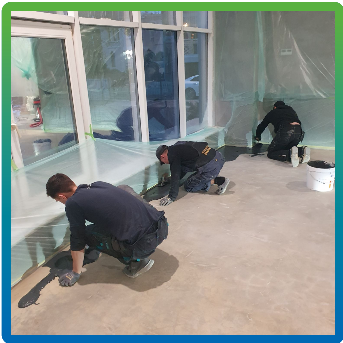
Нанесение первого слоя состава Микротоп База