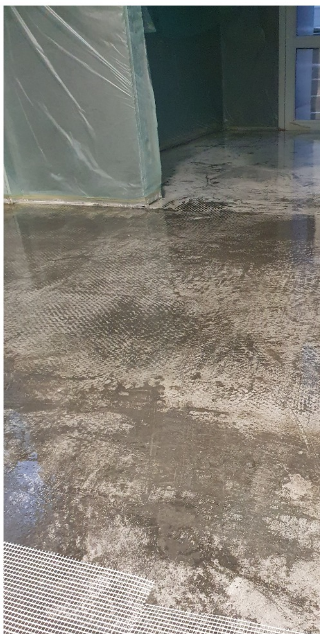
Загрунтованная поверхность составом Маногард ПСМ