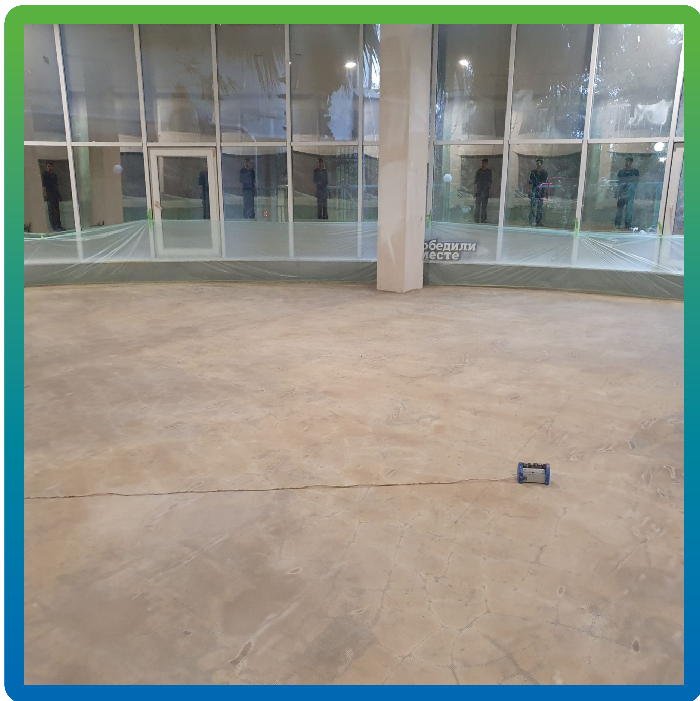
Подготовленное основание перед нанесением Микротоп База