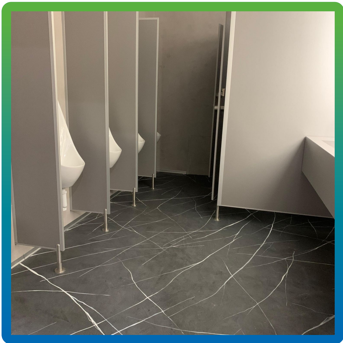
Микротоп Финиш с защитным полиуретановым лаком ДенТоп ПУ 310