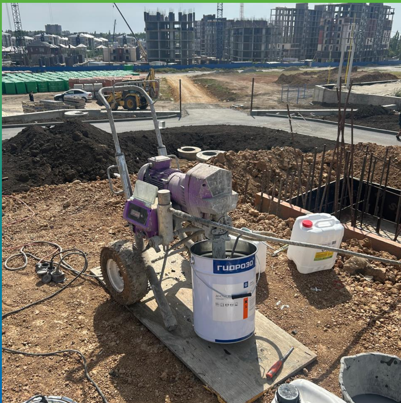
Нанесения грунтовочного слоя ДенсТоп ЭП 100 на стены механизированным способом