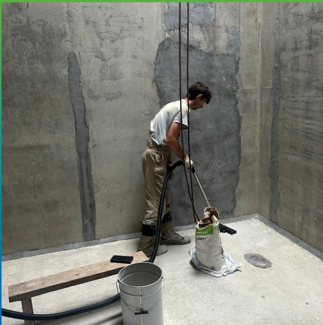
Обеспыливание поверхности после шлифования