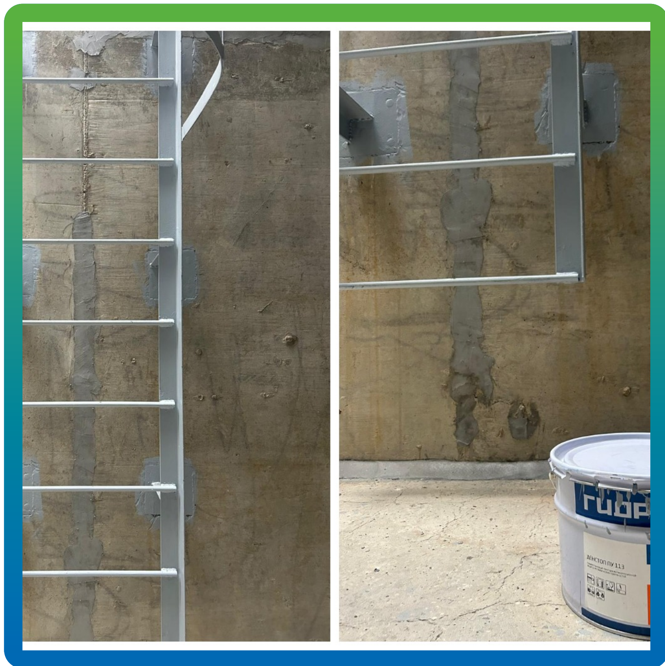
Нанесение антикоррозионного покрытия лестниц составом ДенСтон ПУ 113