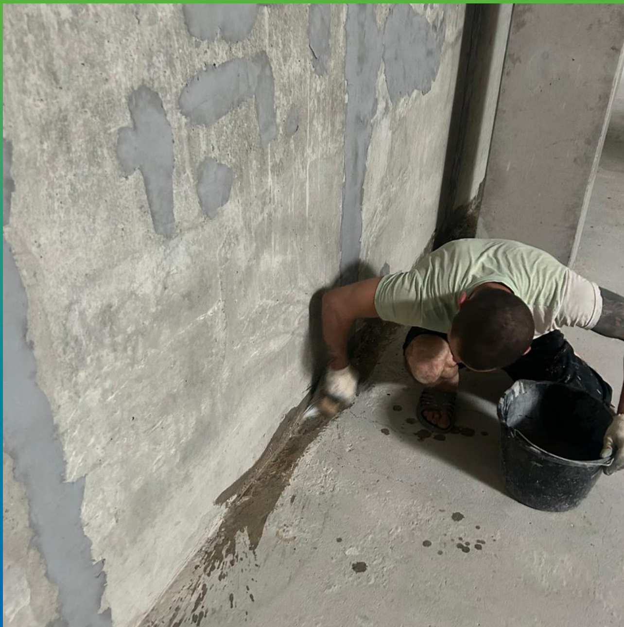
Подготовка поверхности под нанесение галтели