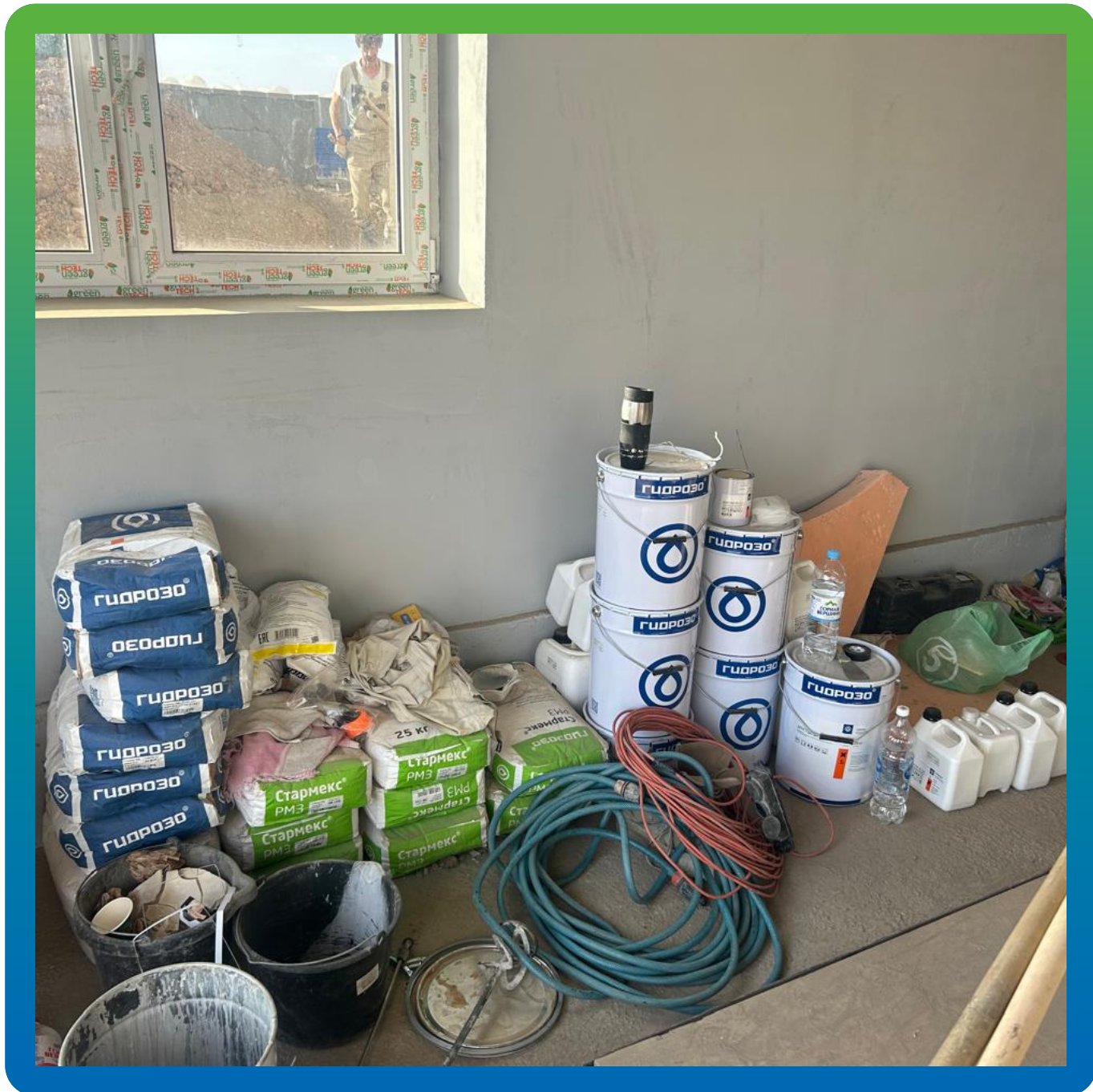
Материалы на объекте