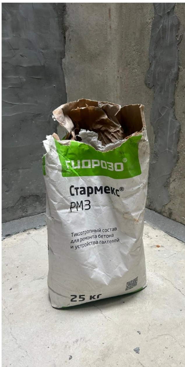
Устройство галтели из ремонтного состава Стармекс РМЗ