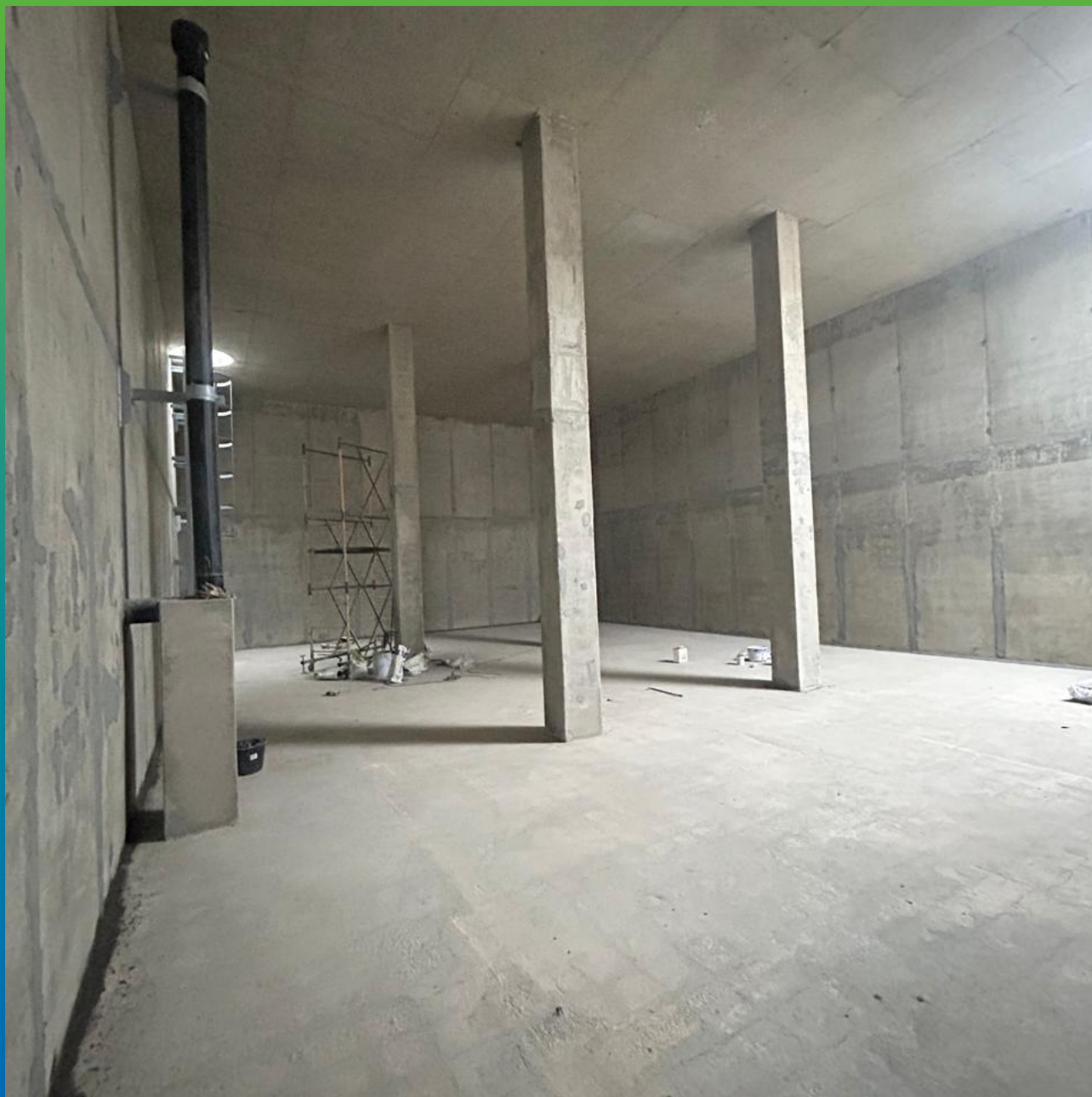
Внутренний вид резервуаров