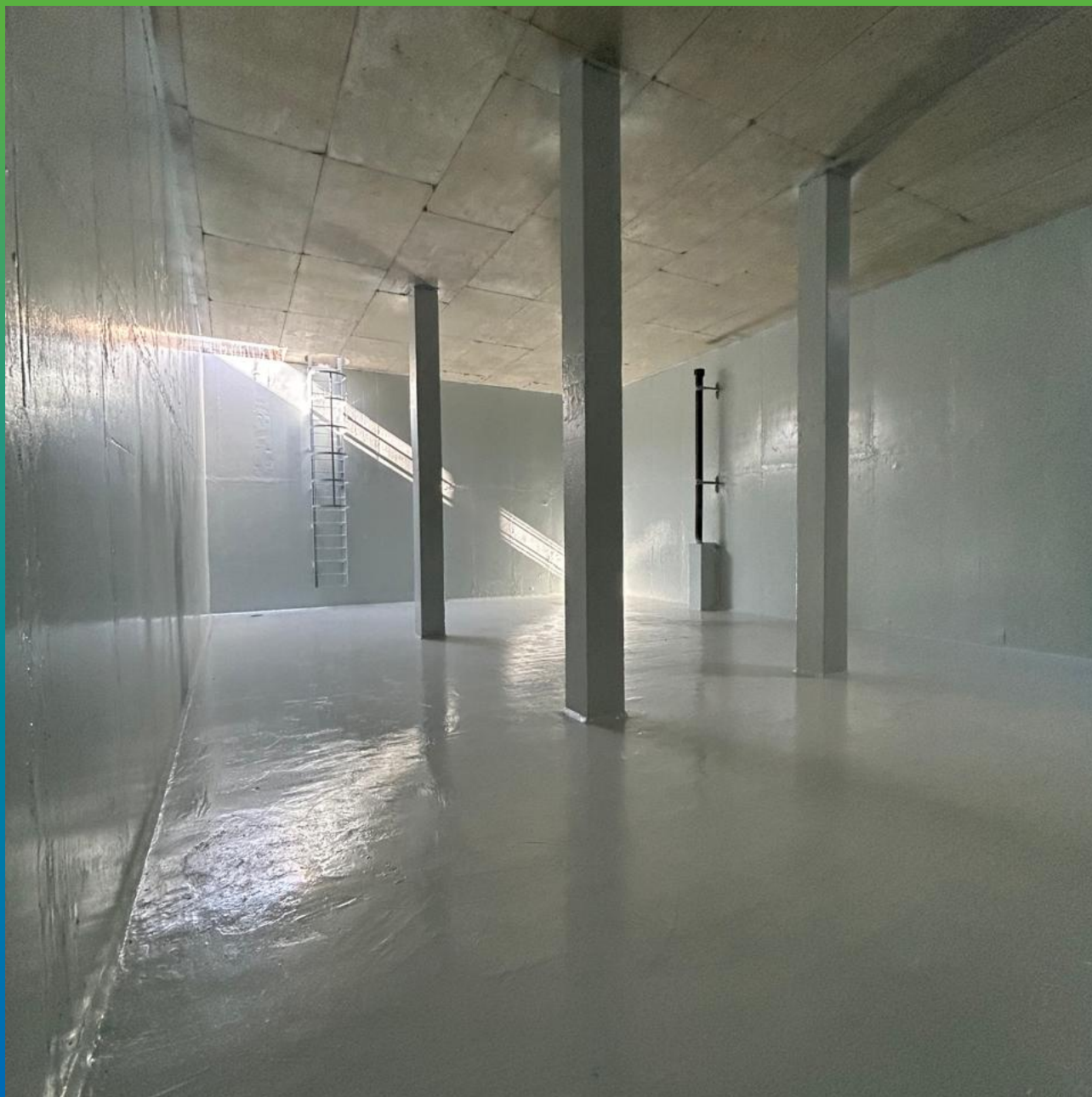
Общий вид после нанесения финишного покрытия ДенТоп ЭП 202 механизированным способом