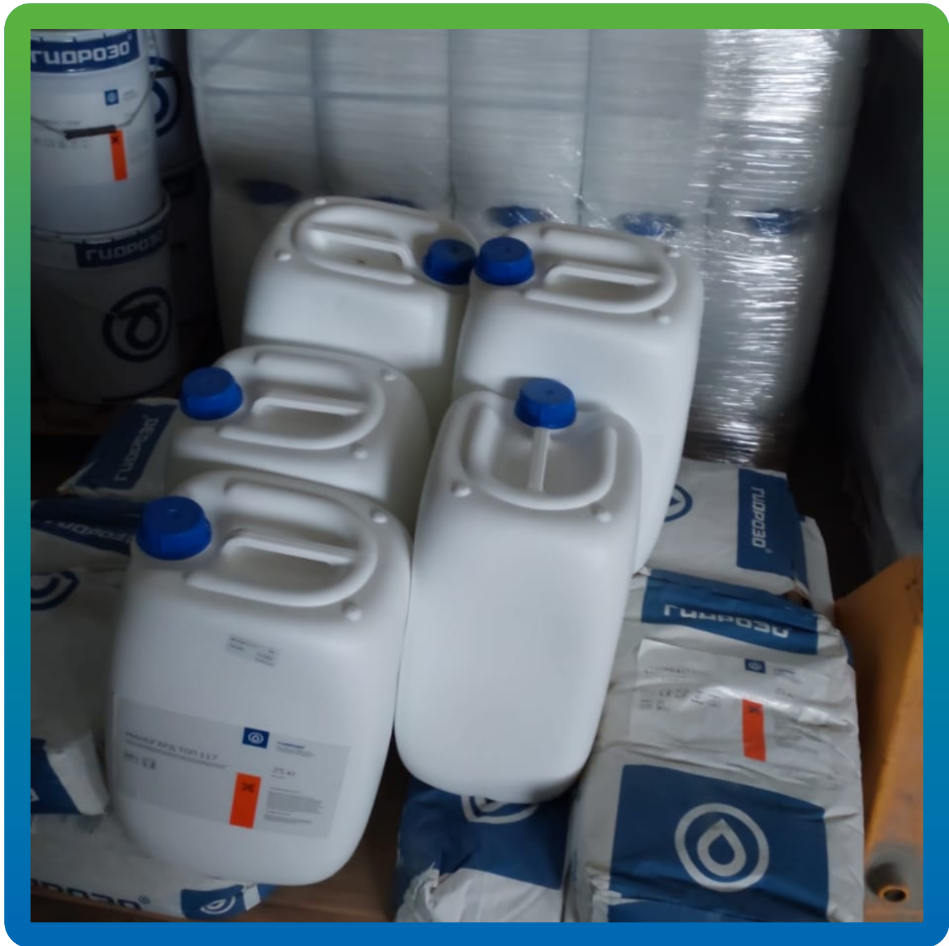
Материалы на объекте