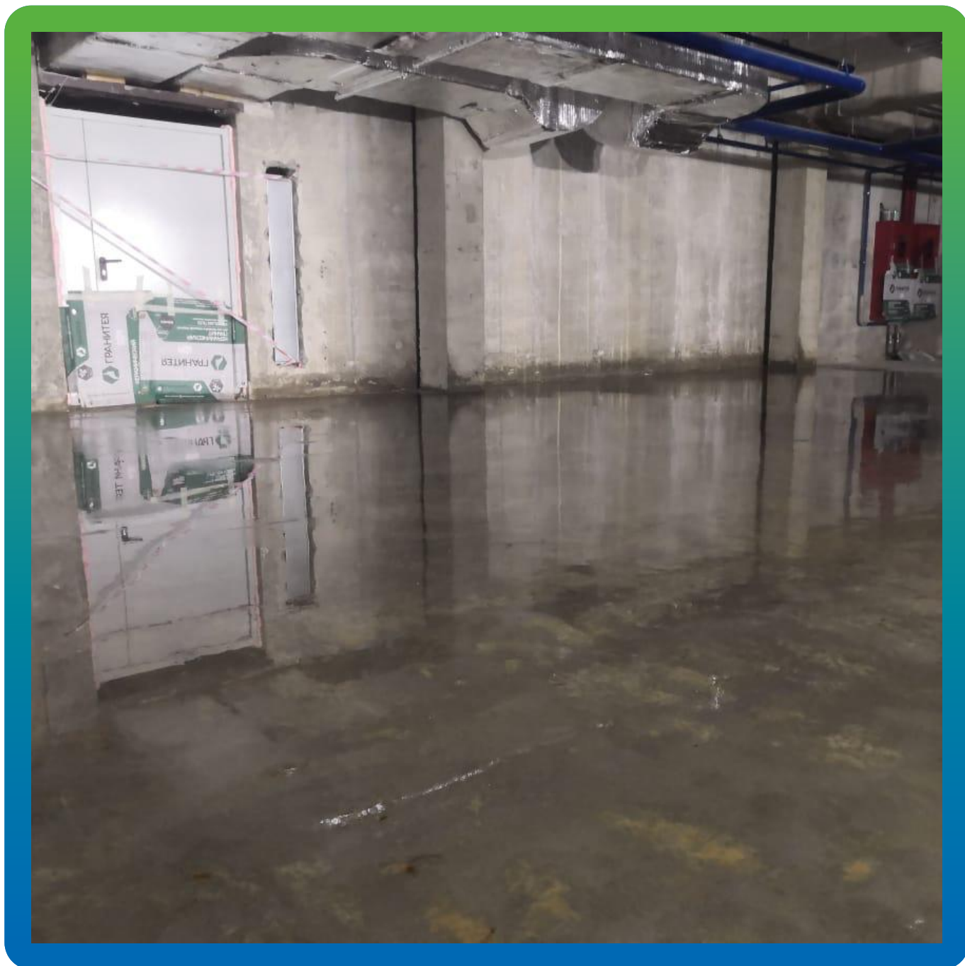
Вид свеженанесенного состава Маногард Топ 117