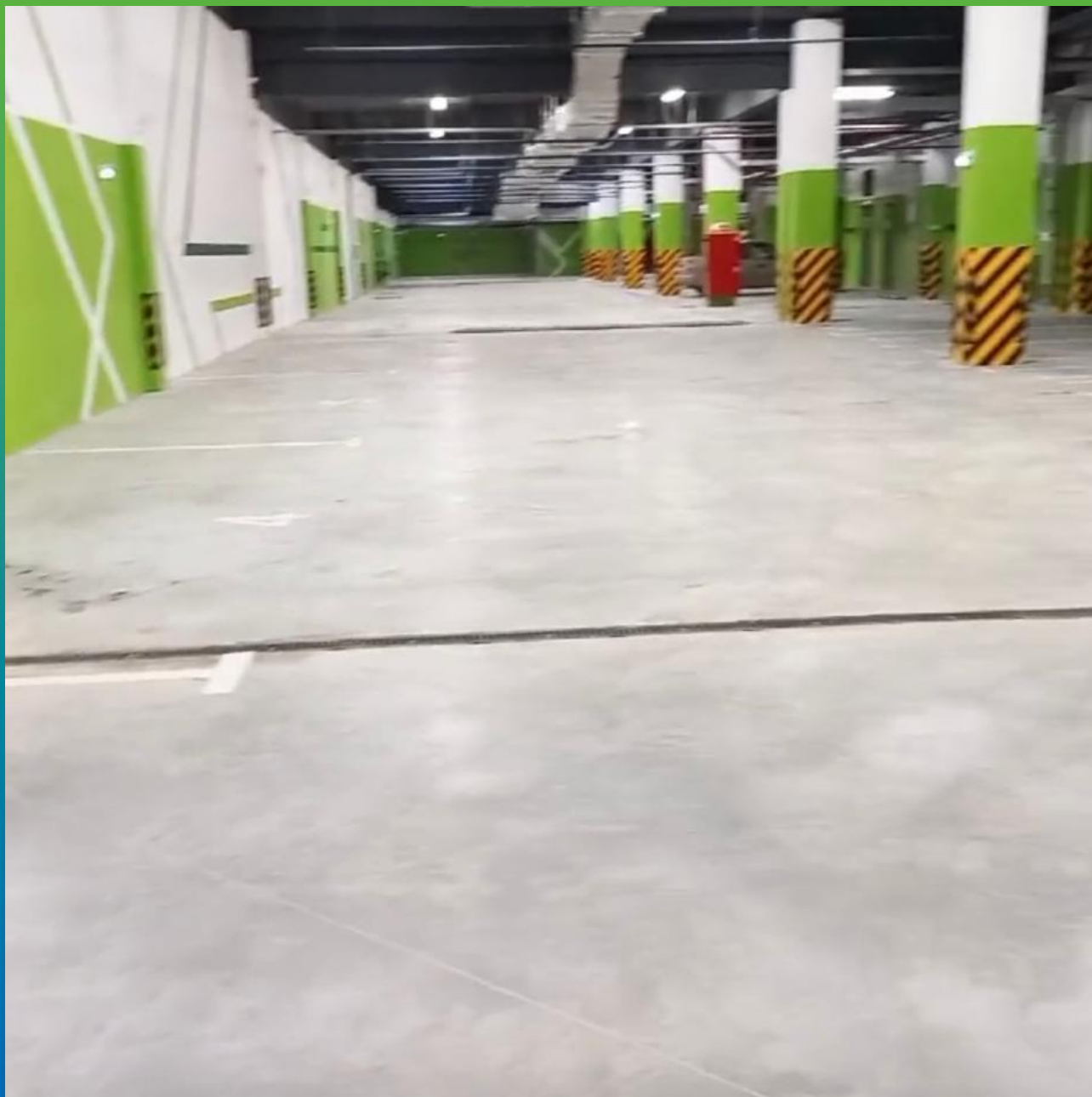
Финишный вид объекта