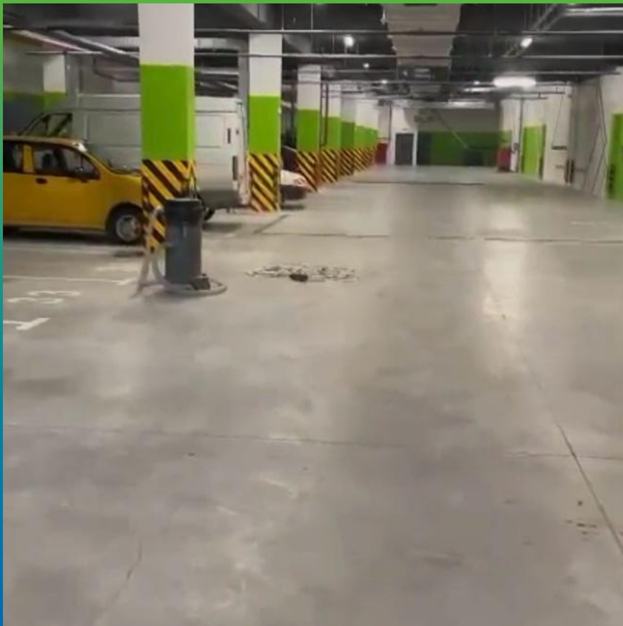
Финишный вид объекта