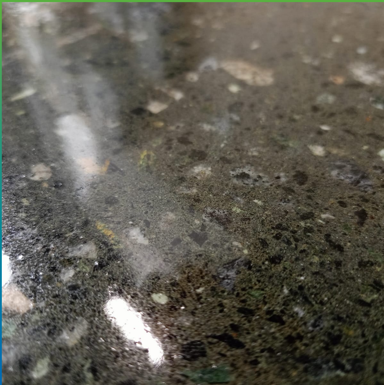
Загрунтованное основание - близкий ракурс