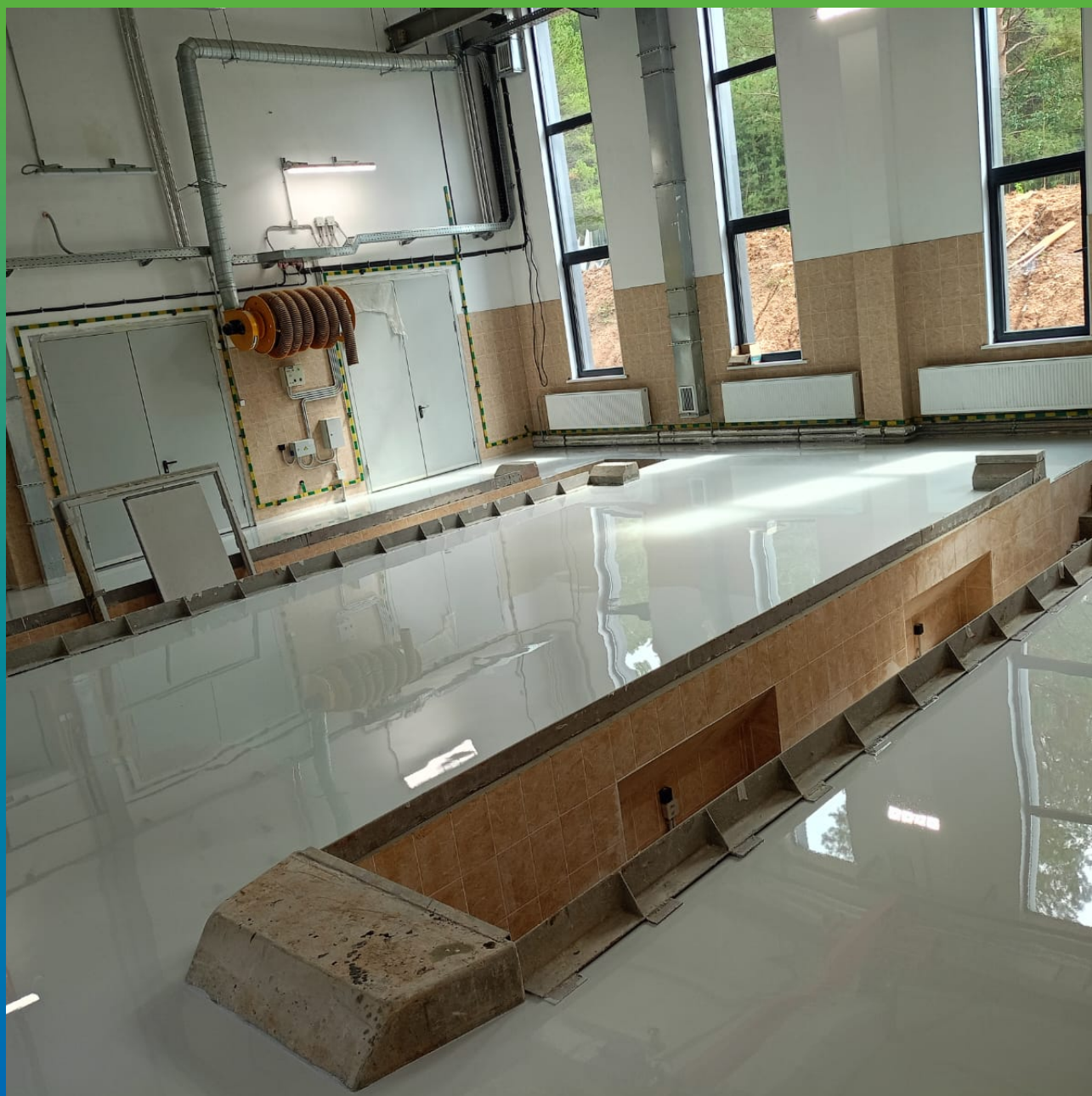
Общий вид участка после нанесения ДенТоп ЭП 500