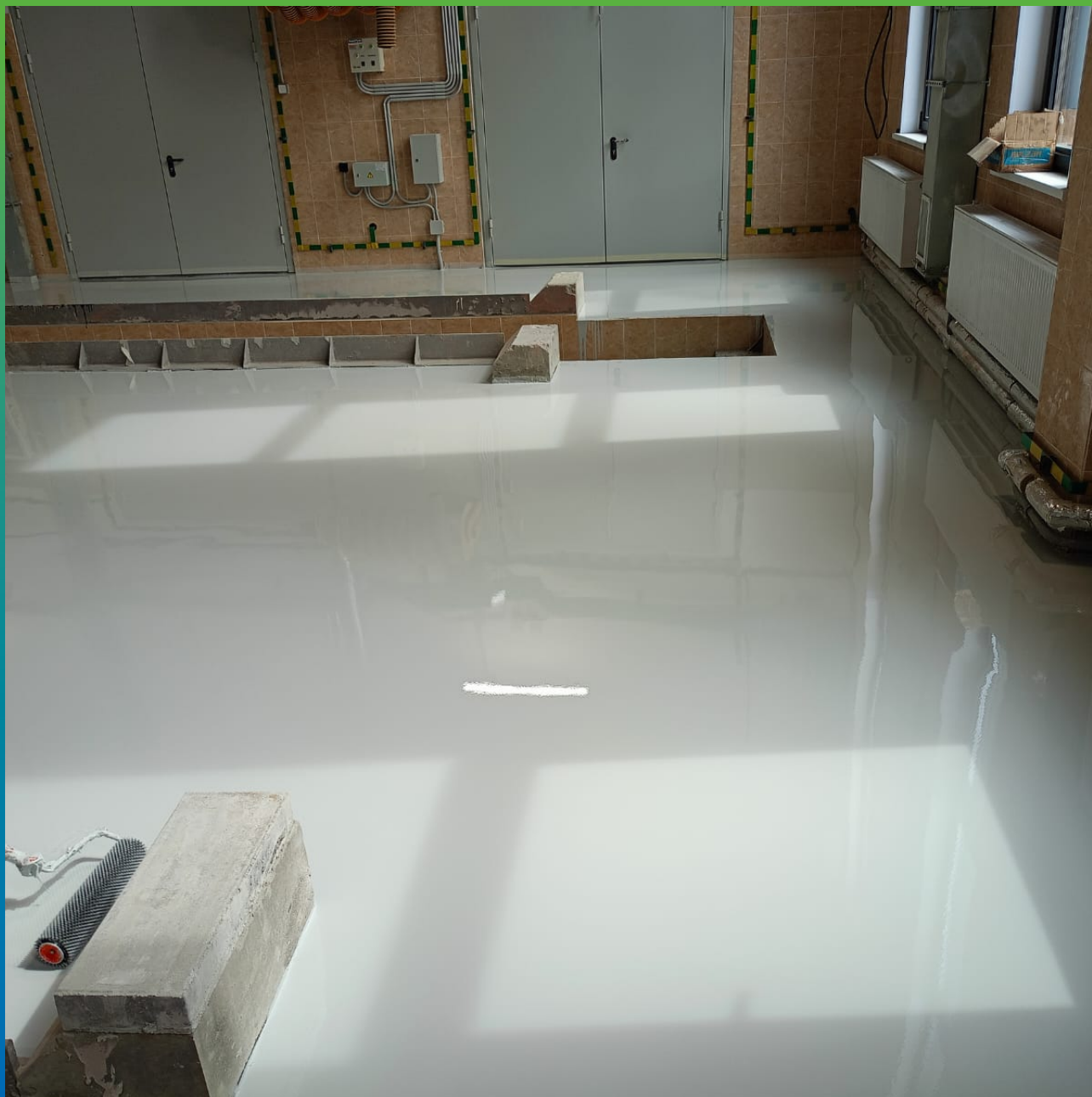
Прокатка игольчатым валиком