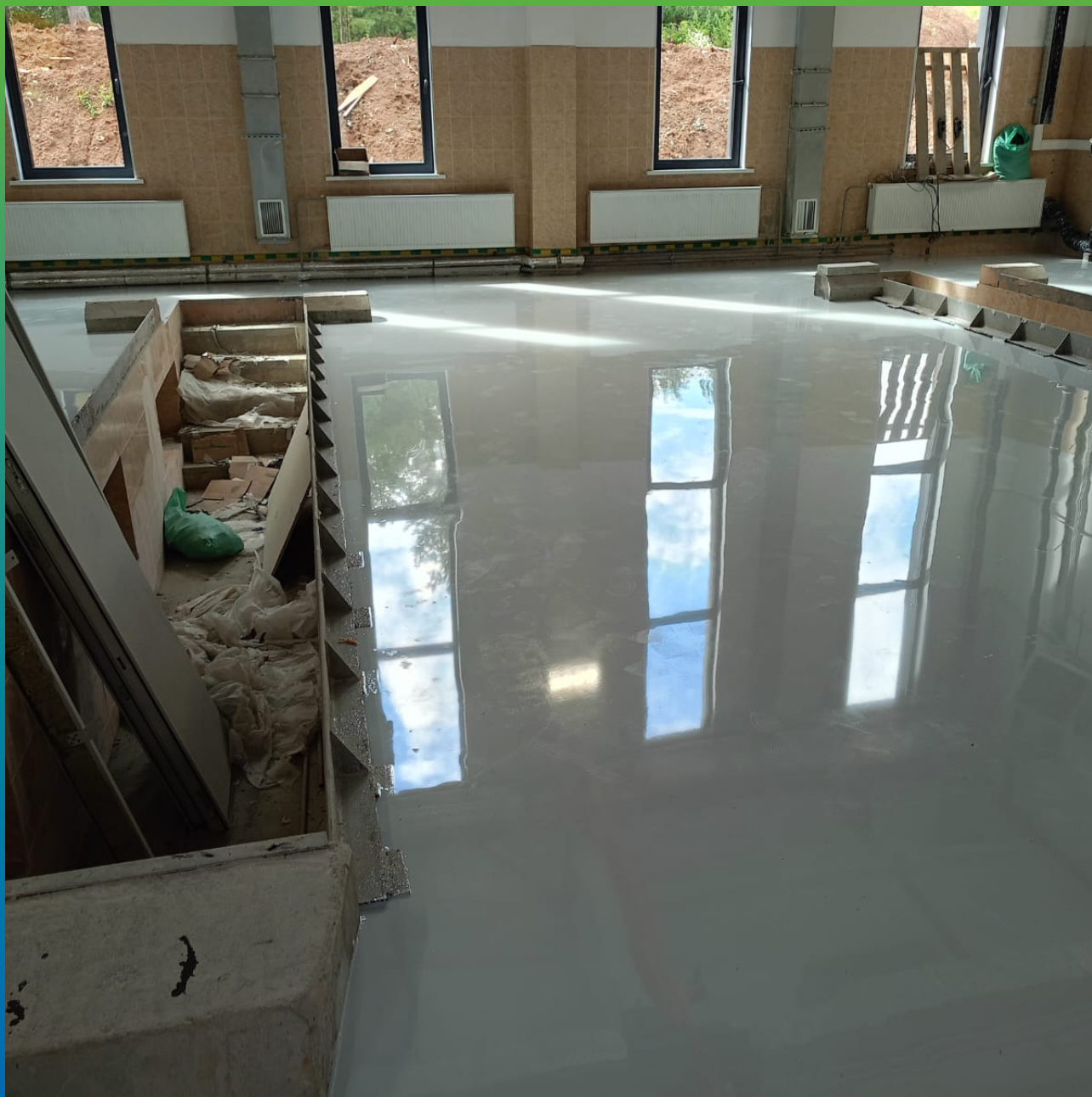
Участок после полимеризации ДенсТоп ЭП 500