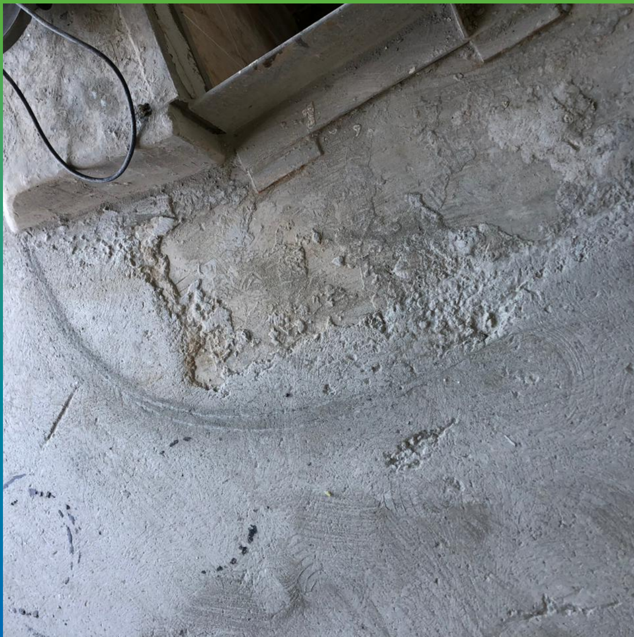
Участок, требующий ремонта. Вид перед нанесением покрытия