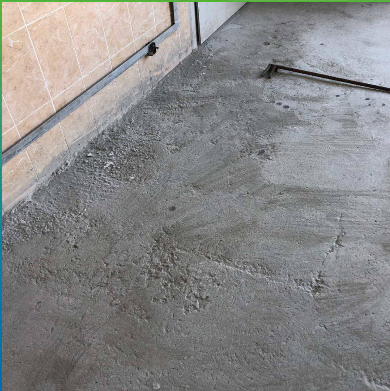
Участок, требующий ремонта. Вид перед нанесением покрытия