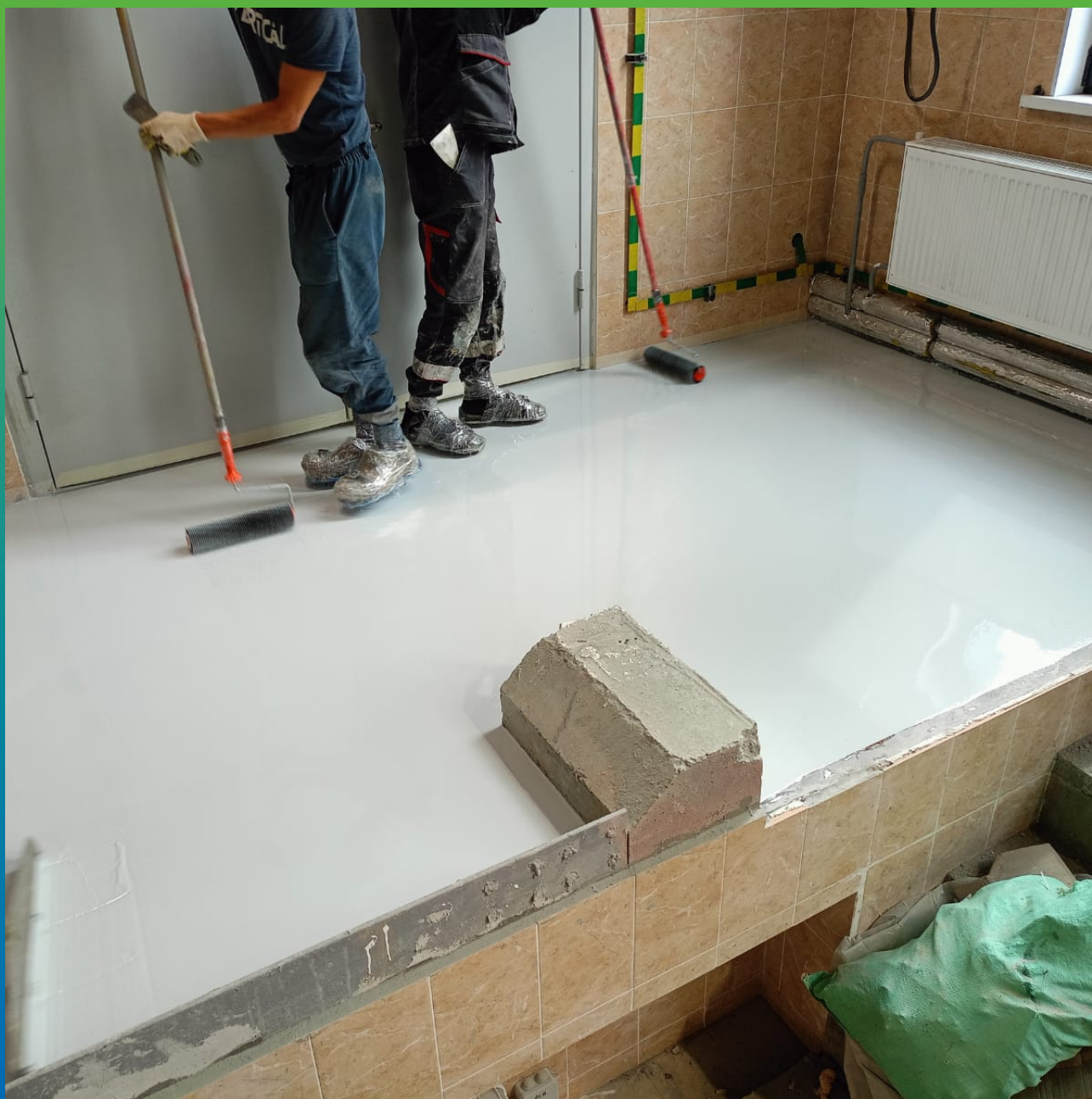
Распределение ДенТоп ЭП 500 раклей и прокатка игольчатым валиком