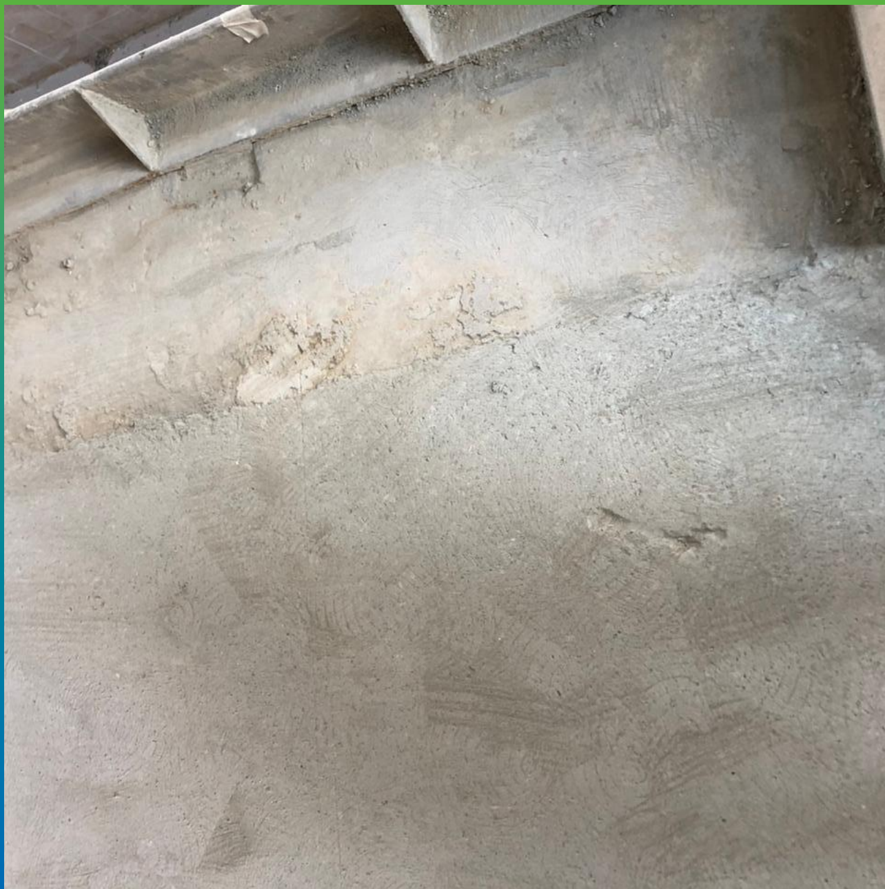
Участок, требующий ремонта. Вид перед нанесением покрытия