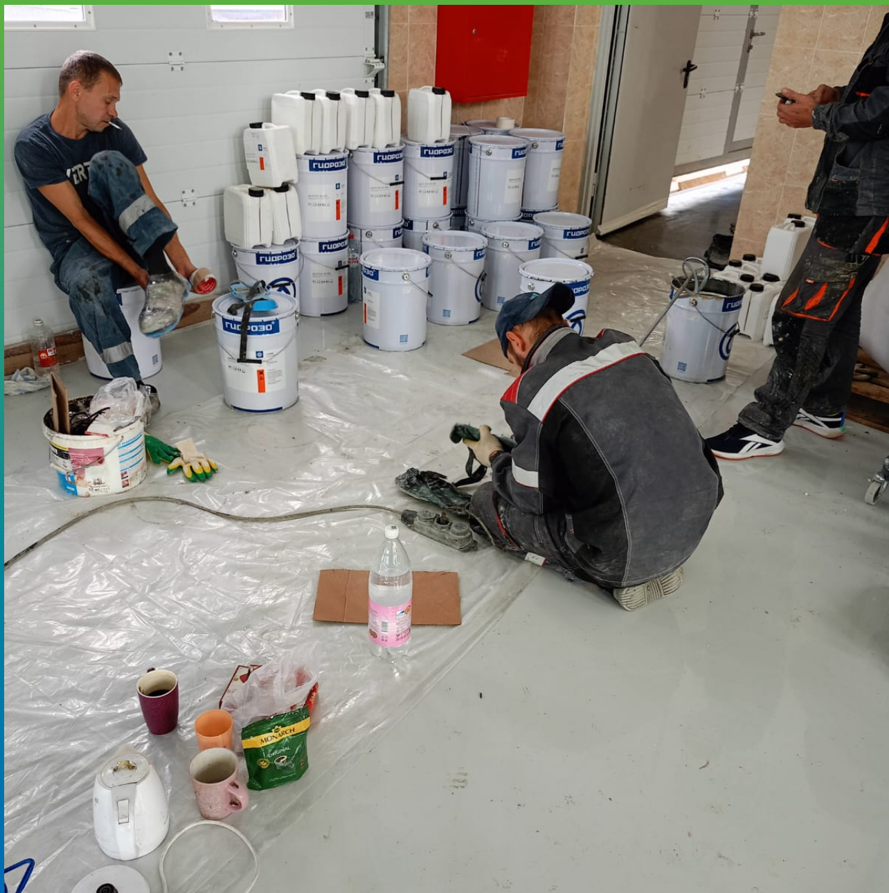
Подготовка персонала для нанесения финишного покрытия ДенТоп ЭП 500