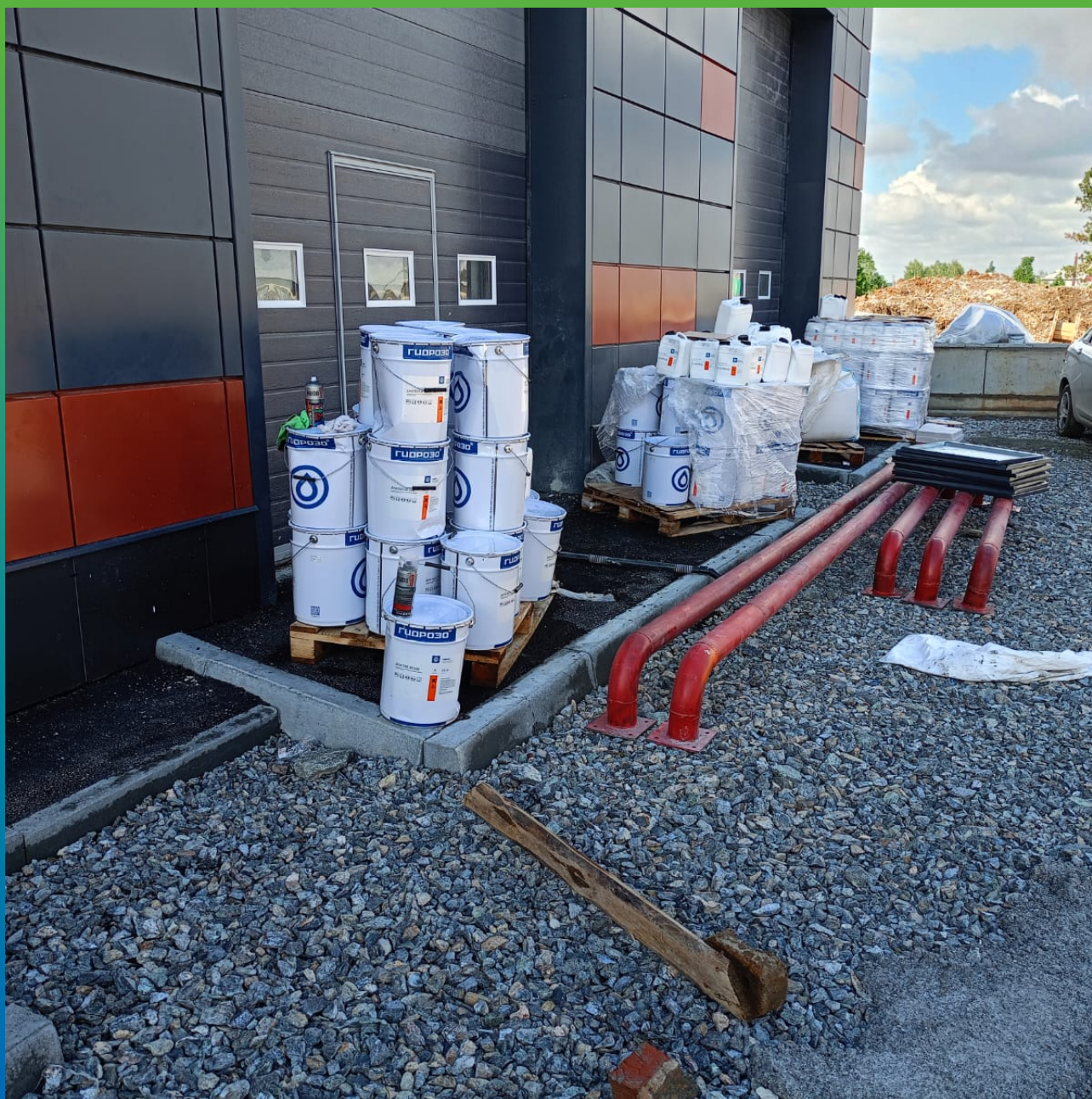
Материалы ООО "Гидрозо" на объекте