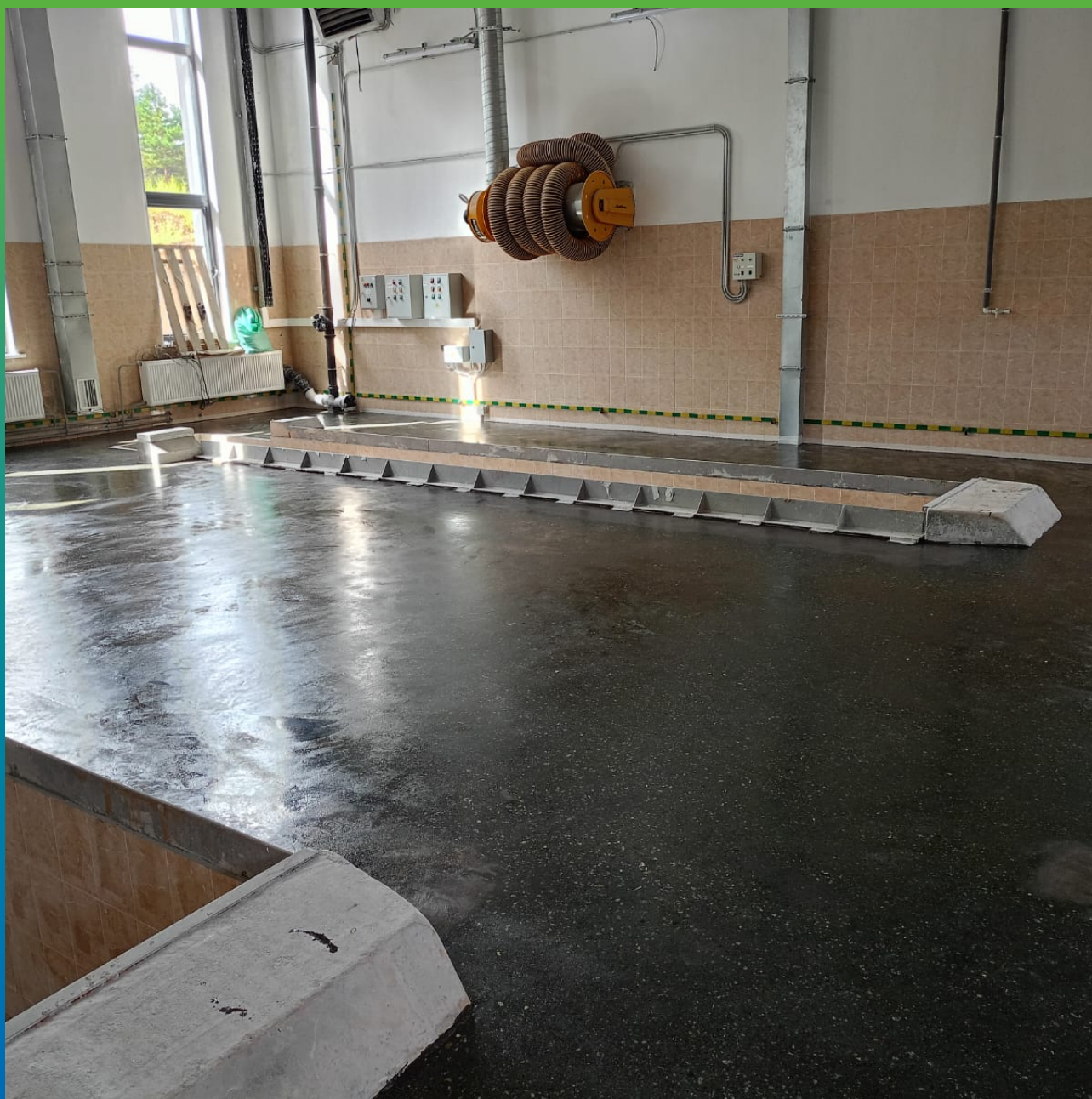
Загрунтовоное основание материалом ДенТоп ЭП 100. Общий вид