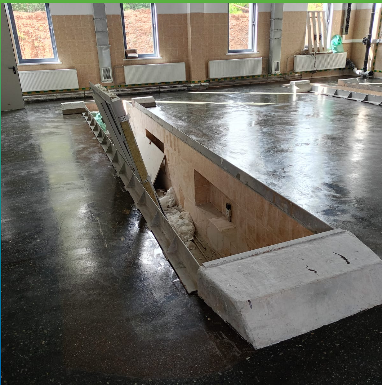
Загрунтованное основание материалом ДенсТоп ЭП 100. Общий вид