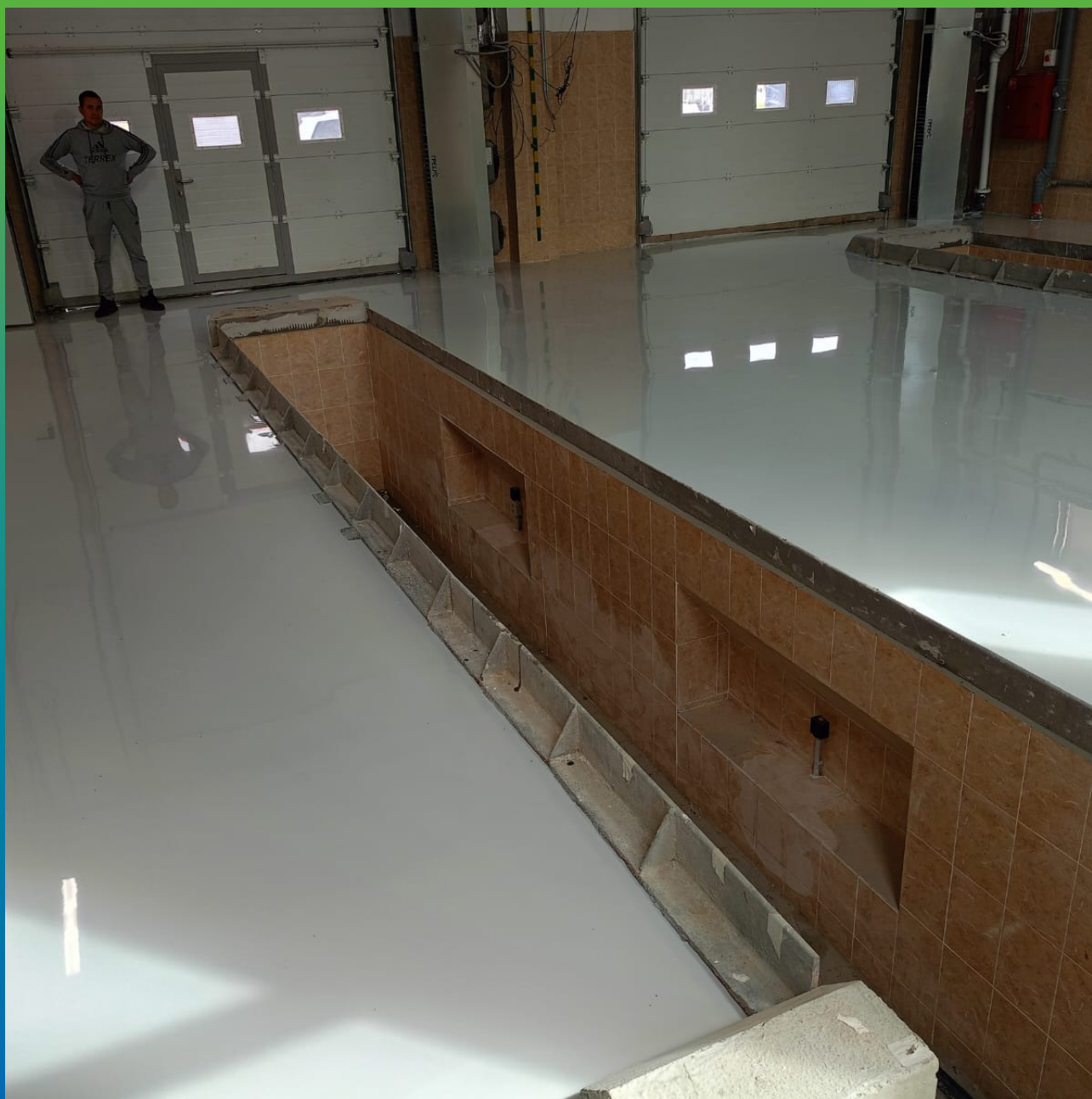
Приемка эпоксидного покрытия ДенТоп ЭП 500 4мм заказчиком