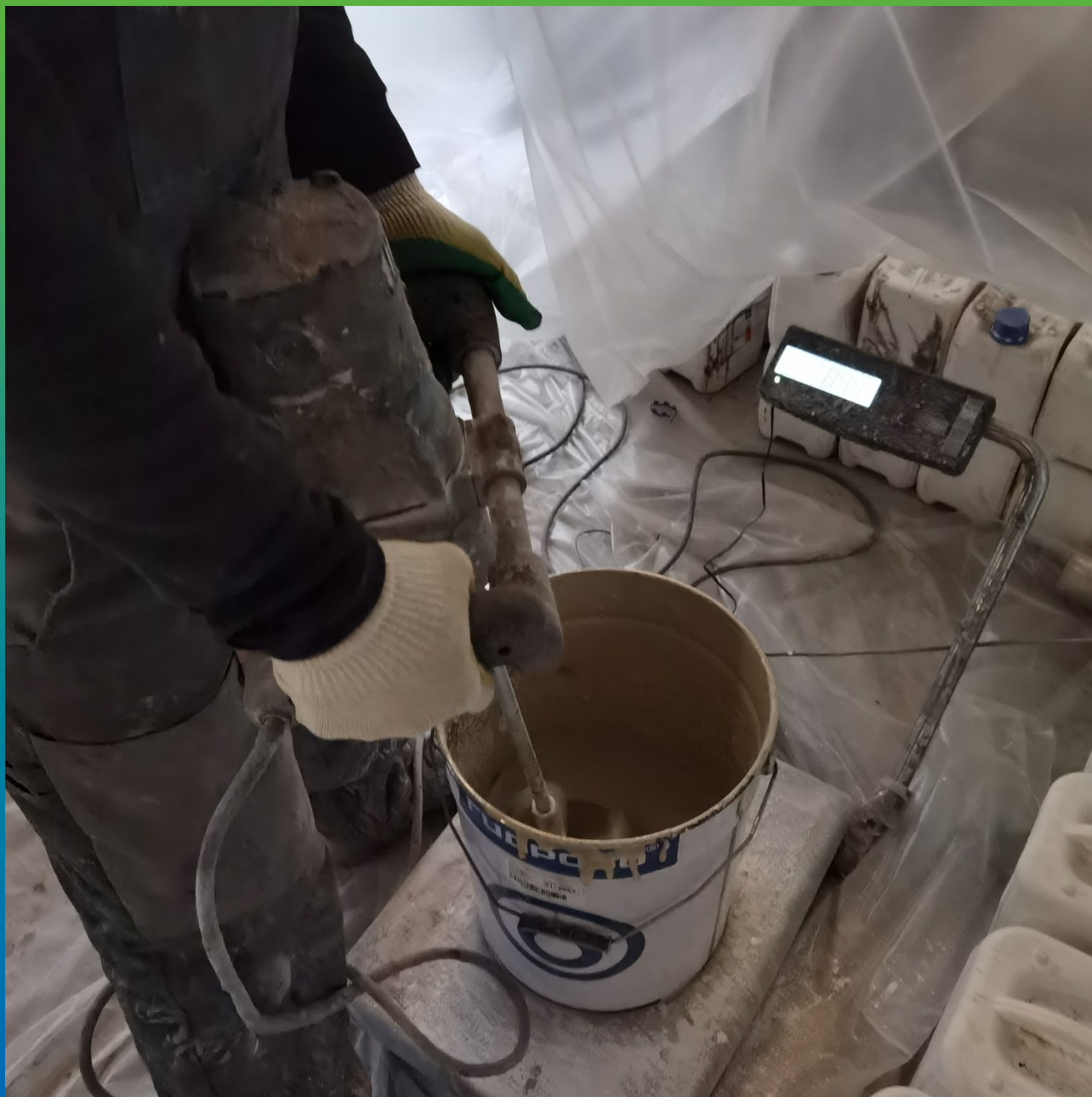
Процесс перемешивания трехкомпонентной грунтовки ДенТоп ПМ 600 на объекте