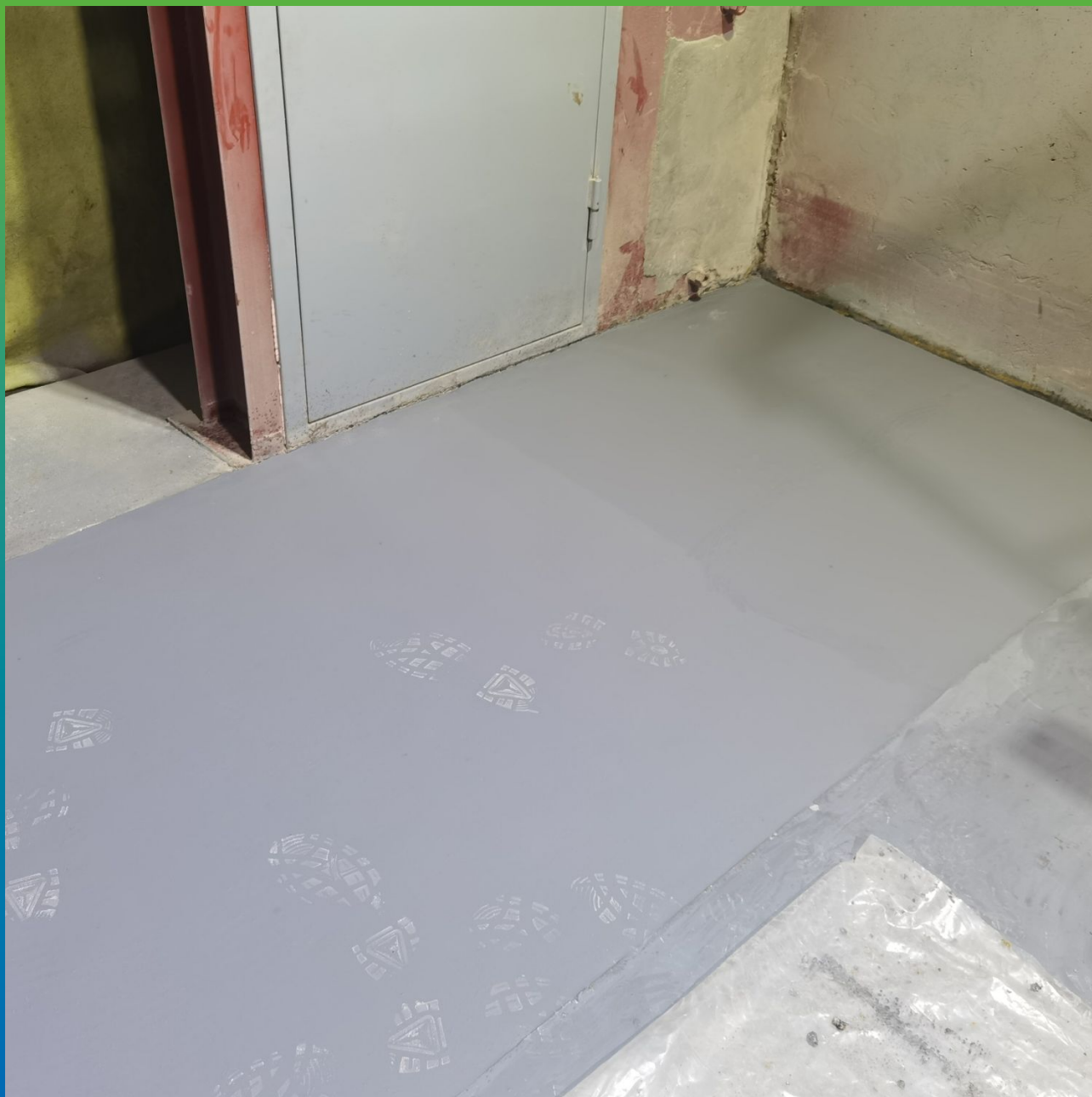
Участки уложенного покрытия