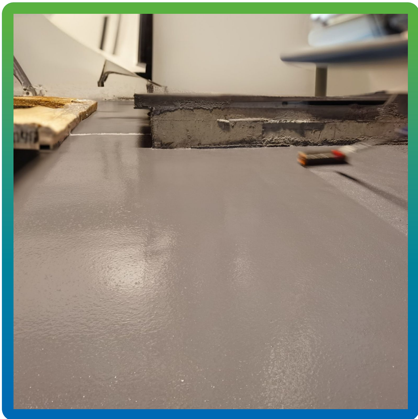
Прокатывание игольчатым валиком уложенного покрытия