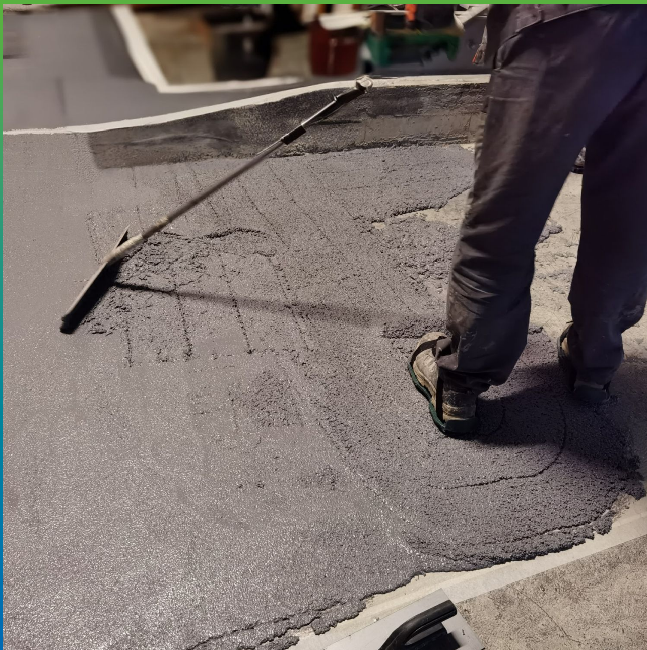
Нанесение цемент-полиуретанового покрытия ДенсТоп ПМ 605 Тровел толщиной 9 мм.