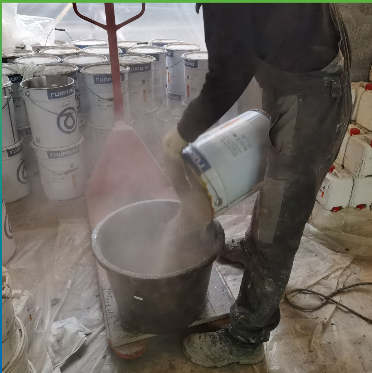
Процесс перемешивания трёх компонентов ДенТоп ПМ 605 Тровел