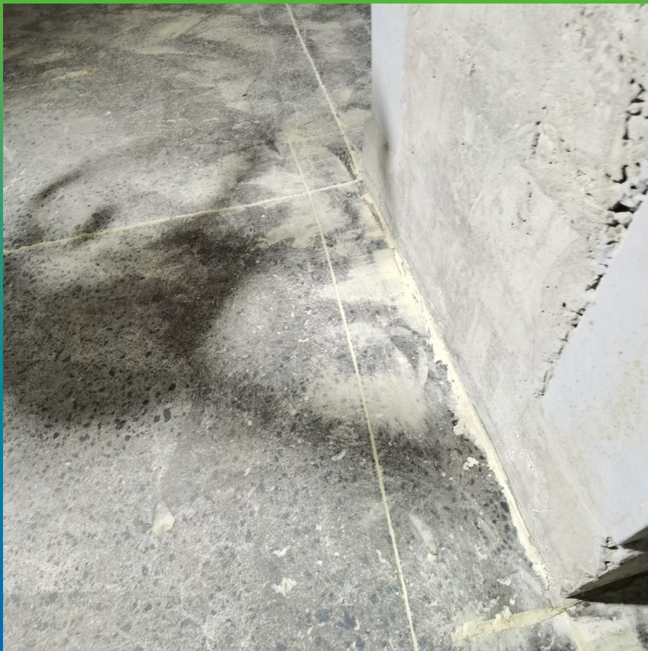
Загрунтованная поверхность перед нанесением финишного покрытия ДенсТоп ПМ 605 Тровел