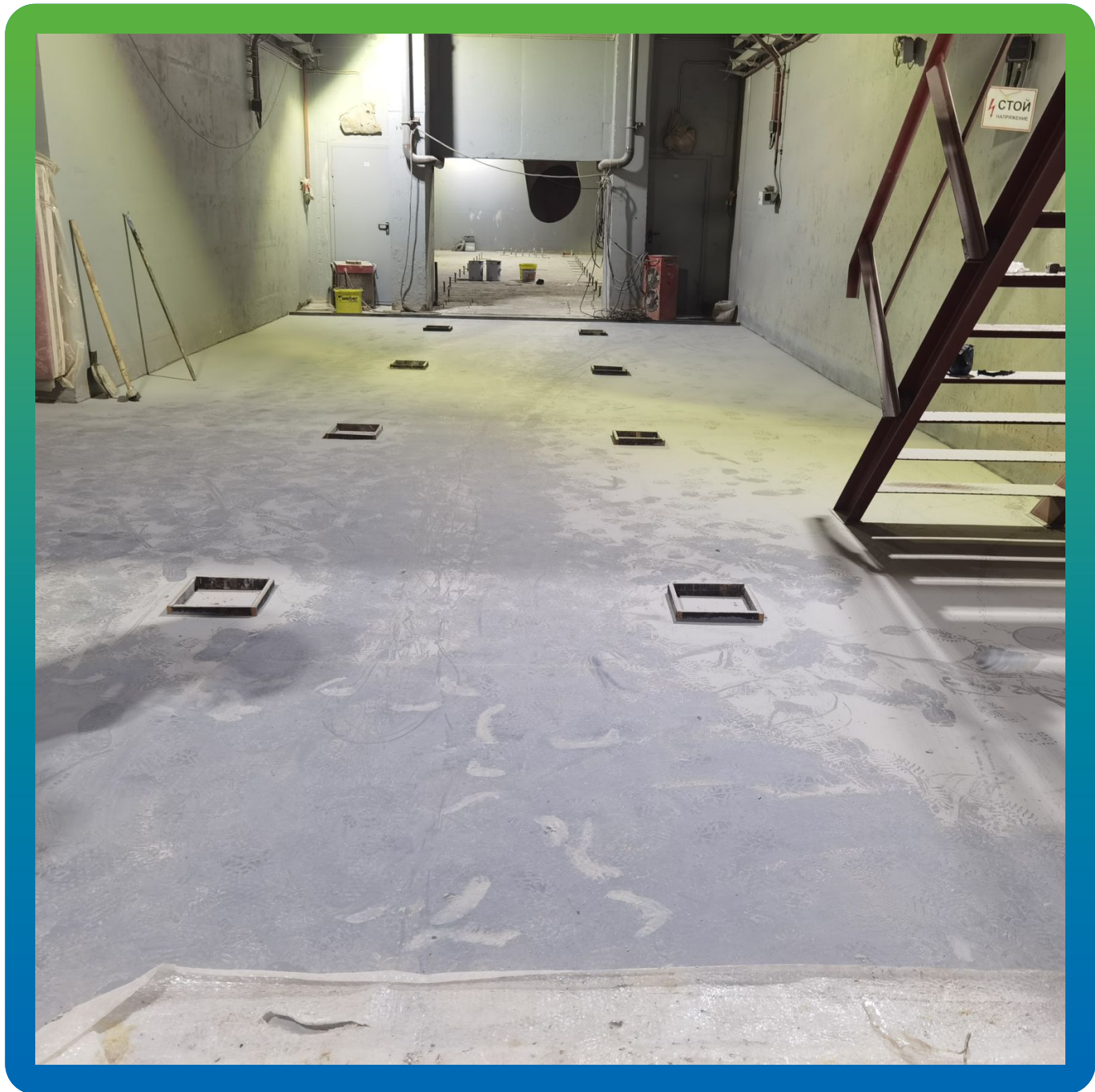
Уложенное покрытие на площади