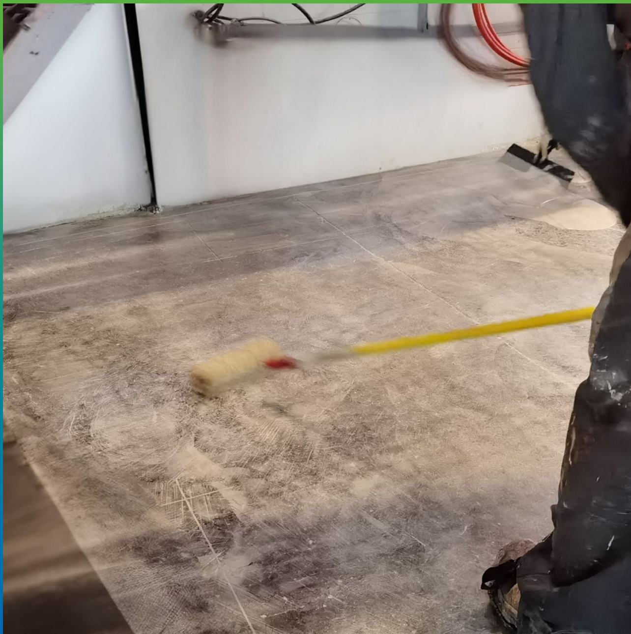
Процесс нанесения грунтовки на подготовленное основание