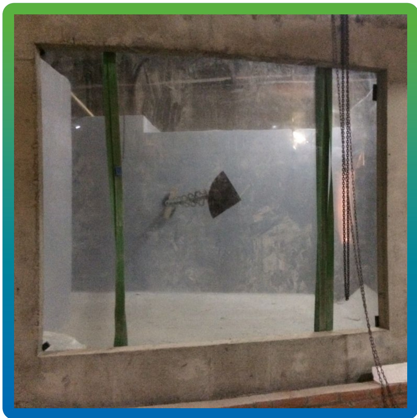
Установленное акриловое стекло