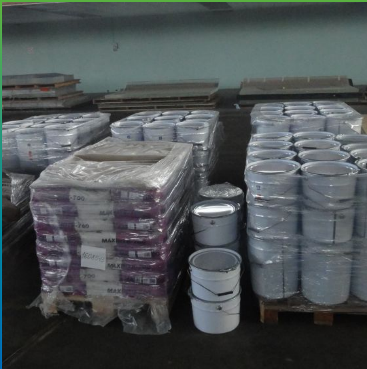
Материалы на объекте