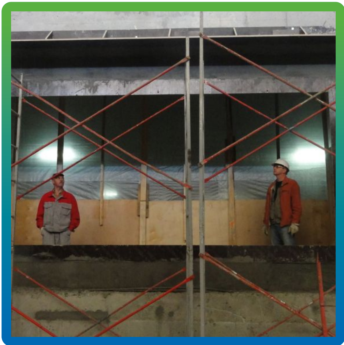
Четверть с выравненной геометрией Максрайтом 700