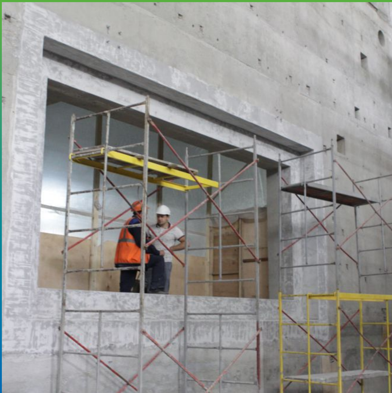
Отшлифованная поверхность Манопокса 331