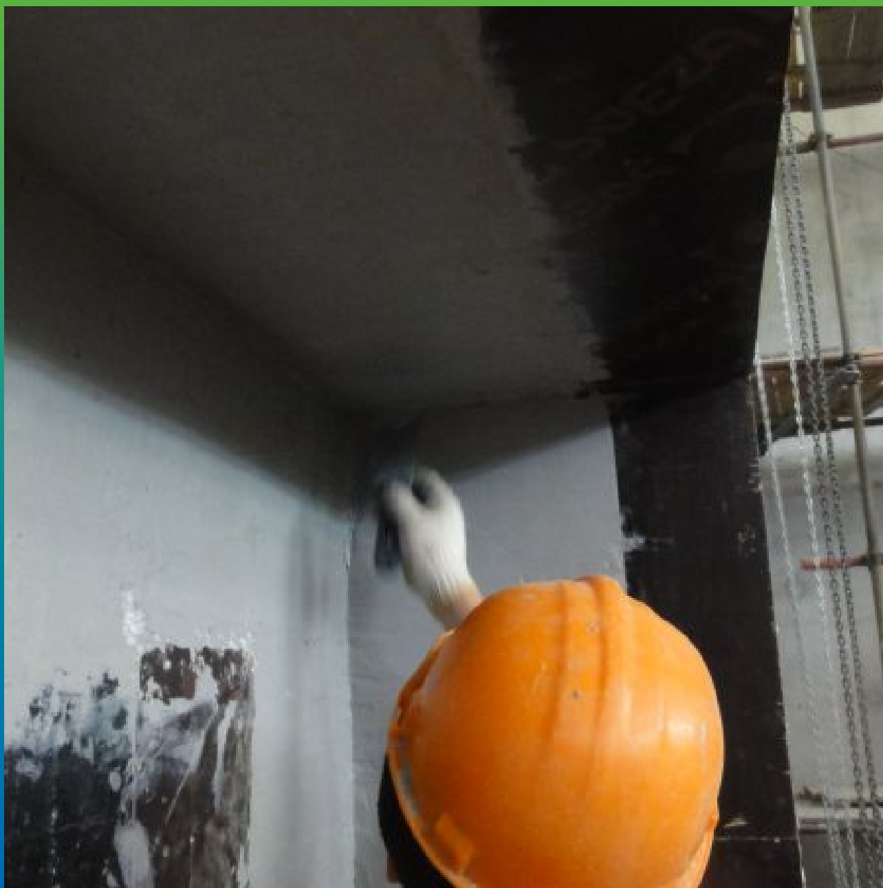
Выравнивание и ремонт поверхностей четвертей Манопоксом 331