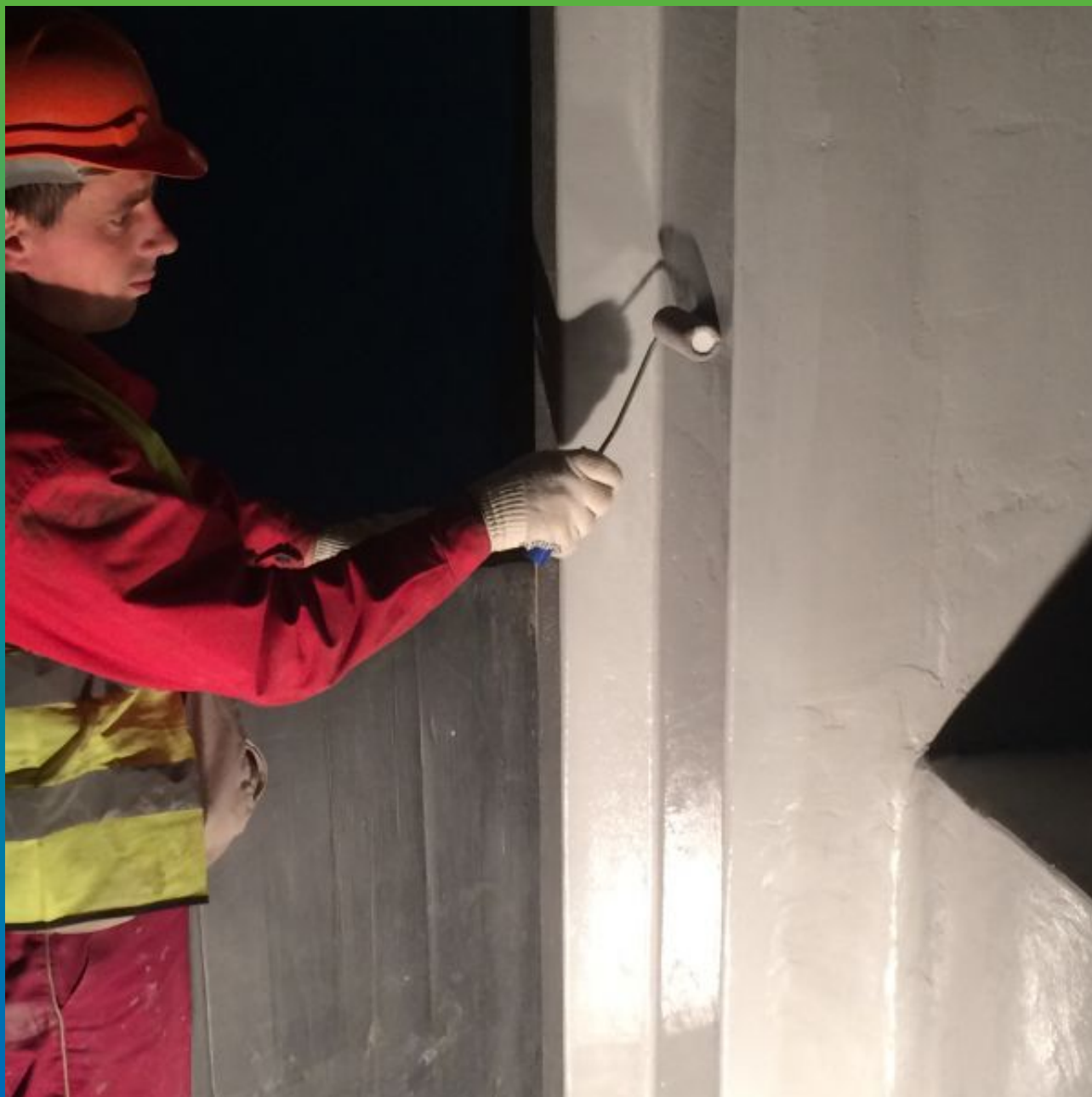
Нанесение Максэпокс Флекса (финишная гидроизоляция)