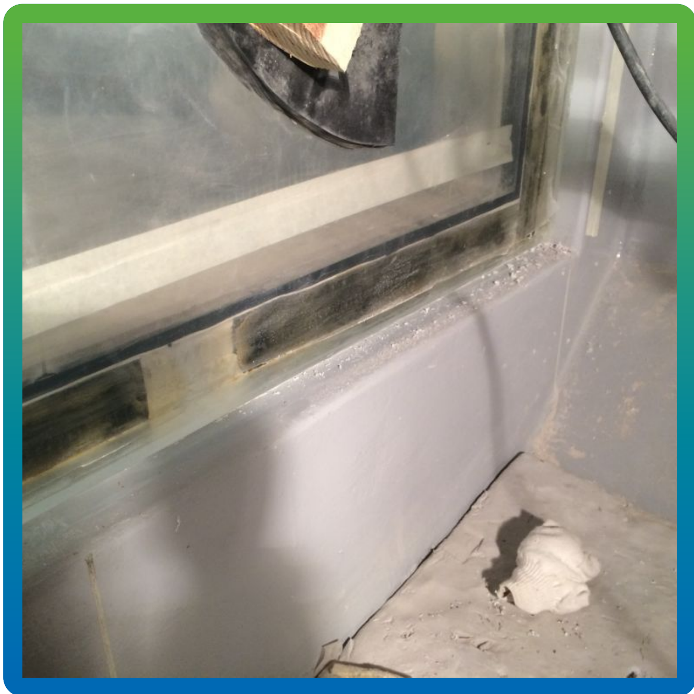
Установленное акриловое стекло (вид изнутри)