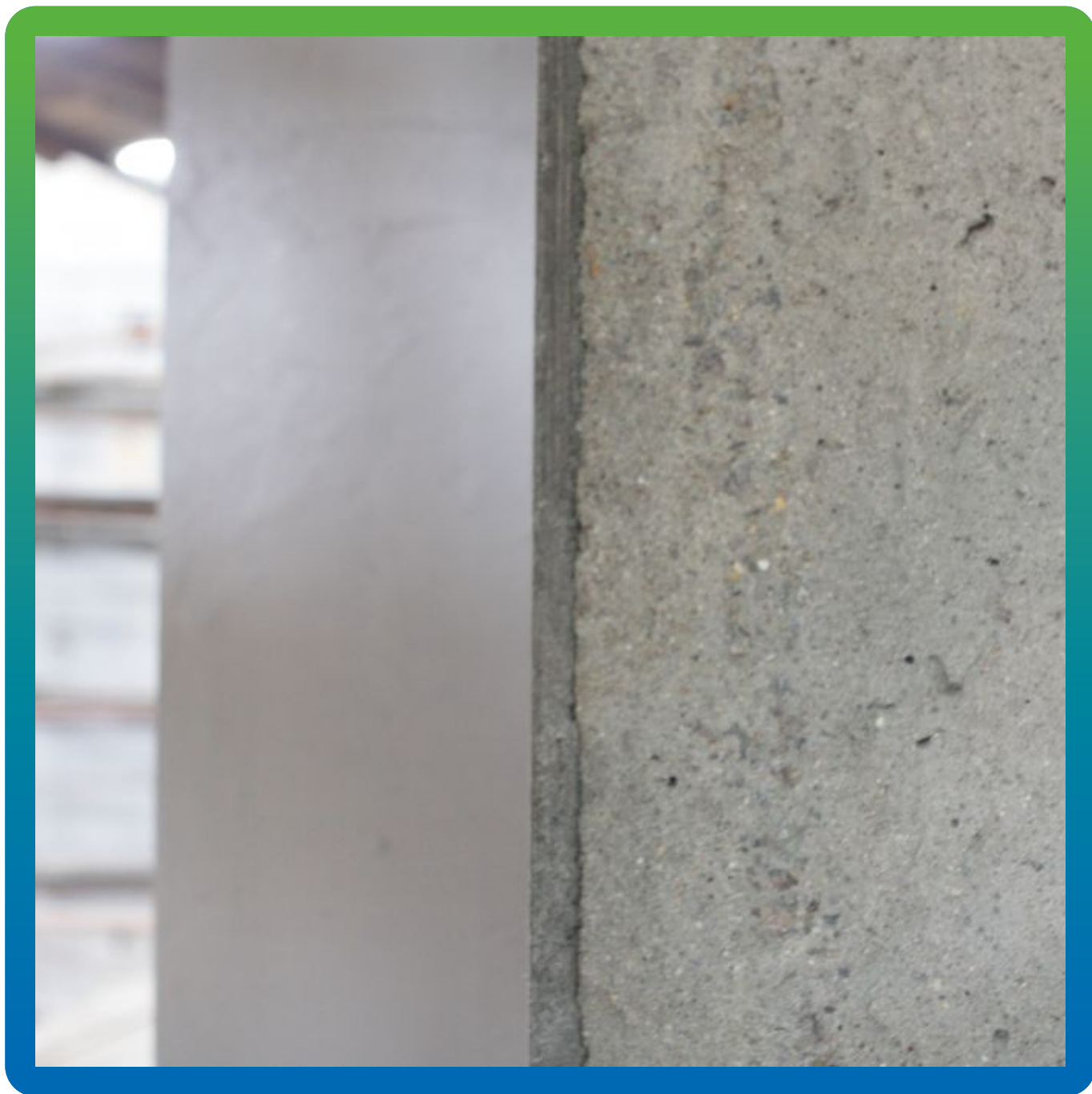
Поверхность четверти, выравненная Манопоксом 331