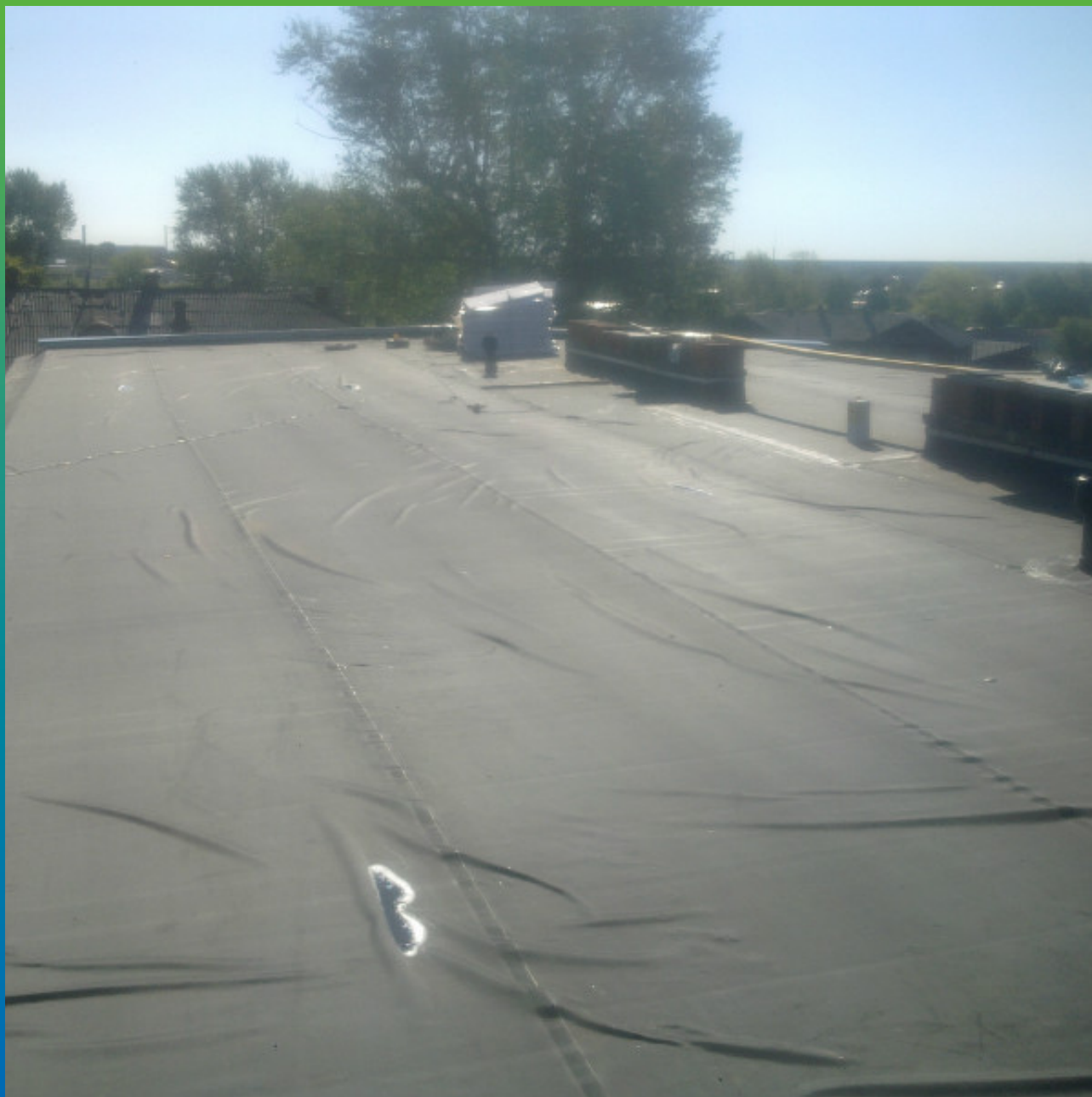
Вид расстеленной мембраны