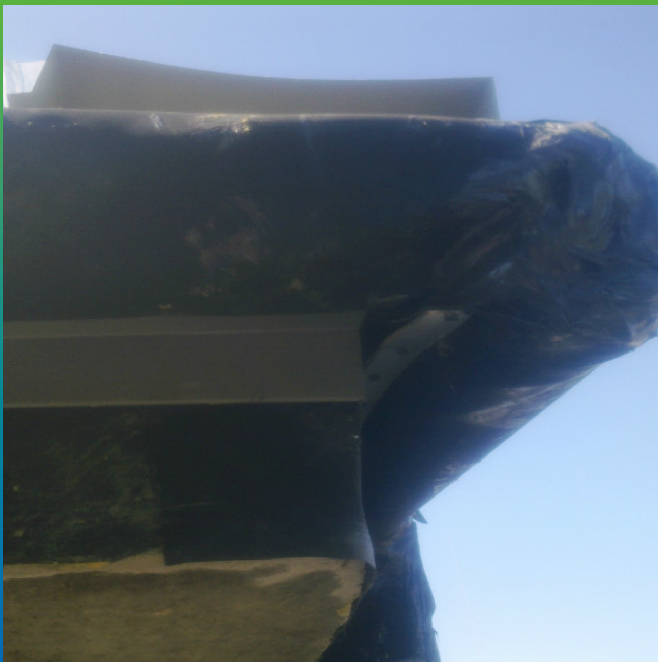
Финальный вид крепления ЭПДМ мембраны по клеевой системе без парапета