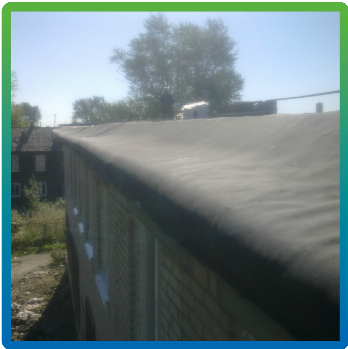
Вид крепления ЭПДМ мембраны по клеевой системе без парапета