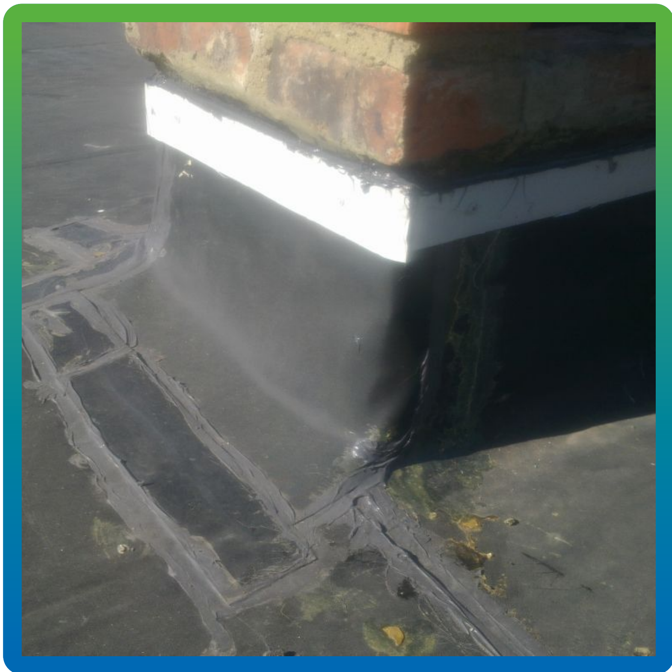
Вид примыкания ЭПДМ