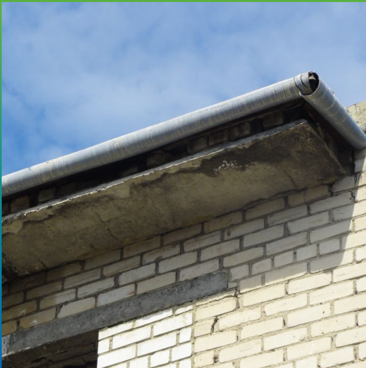
Крепление ЭПДМ мембраны по клеевой системе без парапета