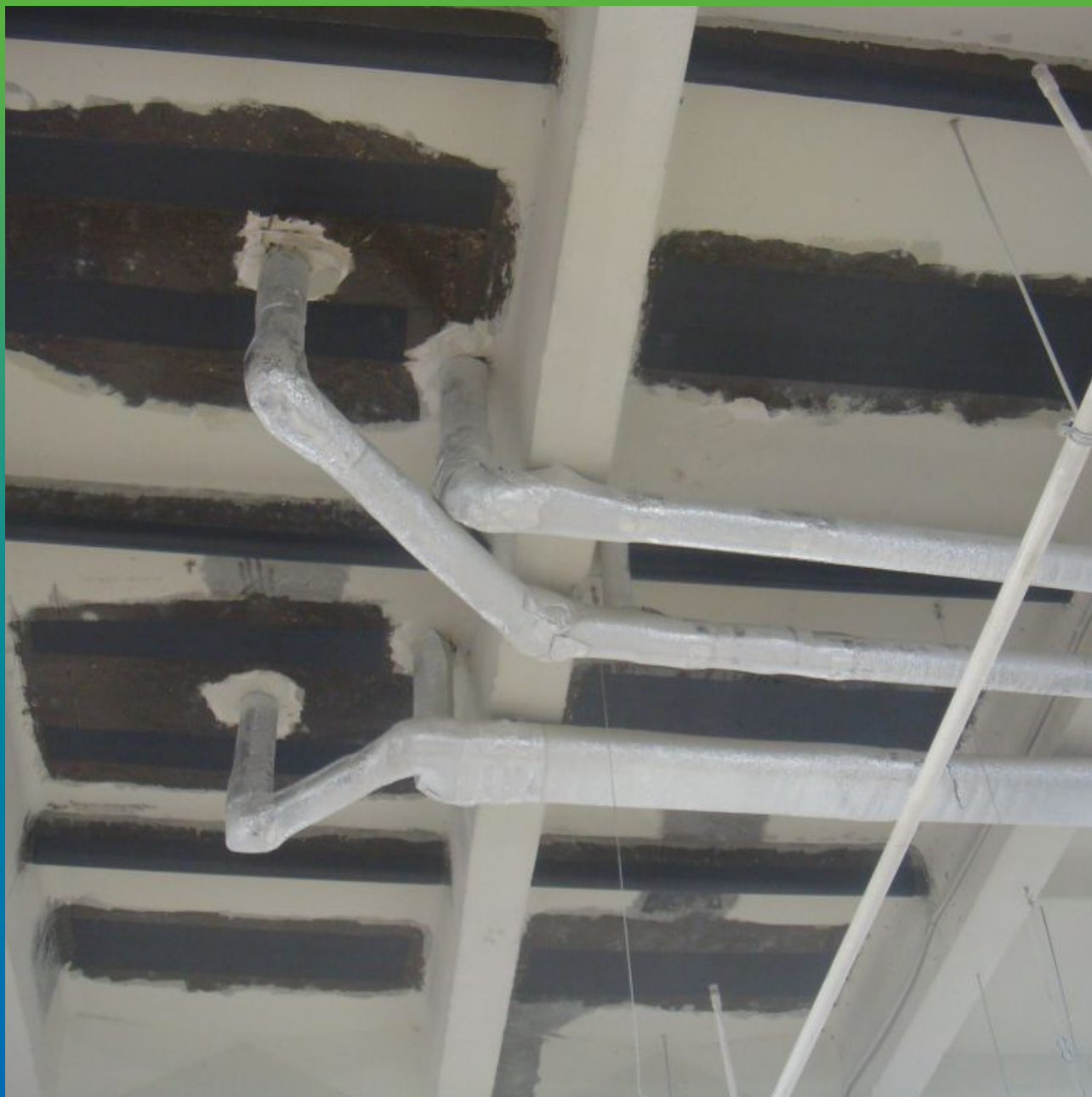
Монтаж Тайфо СЦХ 7АП-Н