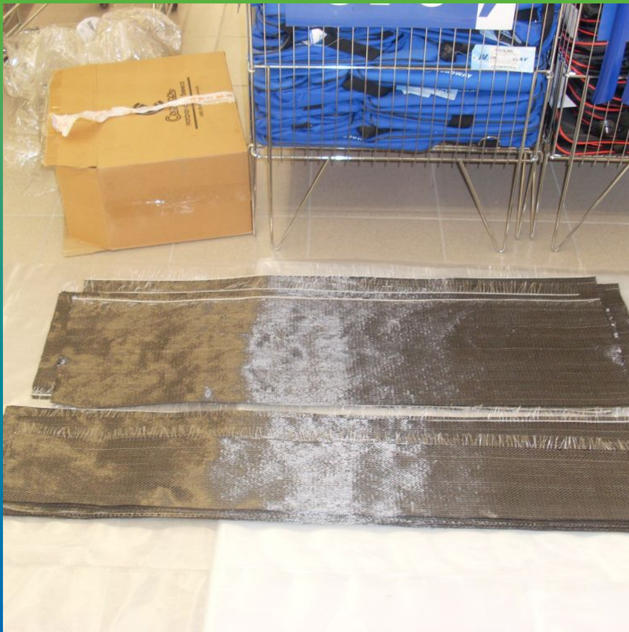
Нарезанные полосы системы усиления