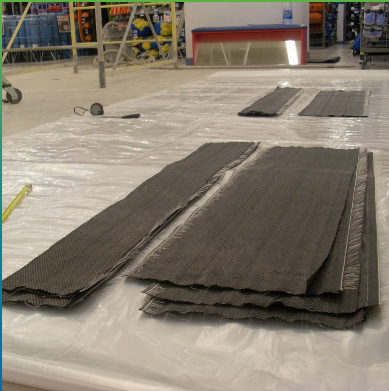
Нарезанные полосы системы усиления