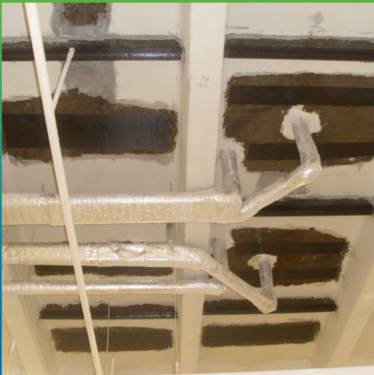
Монтаж Тайфо СЦХ 7АП-Н