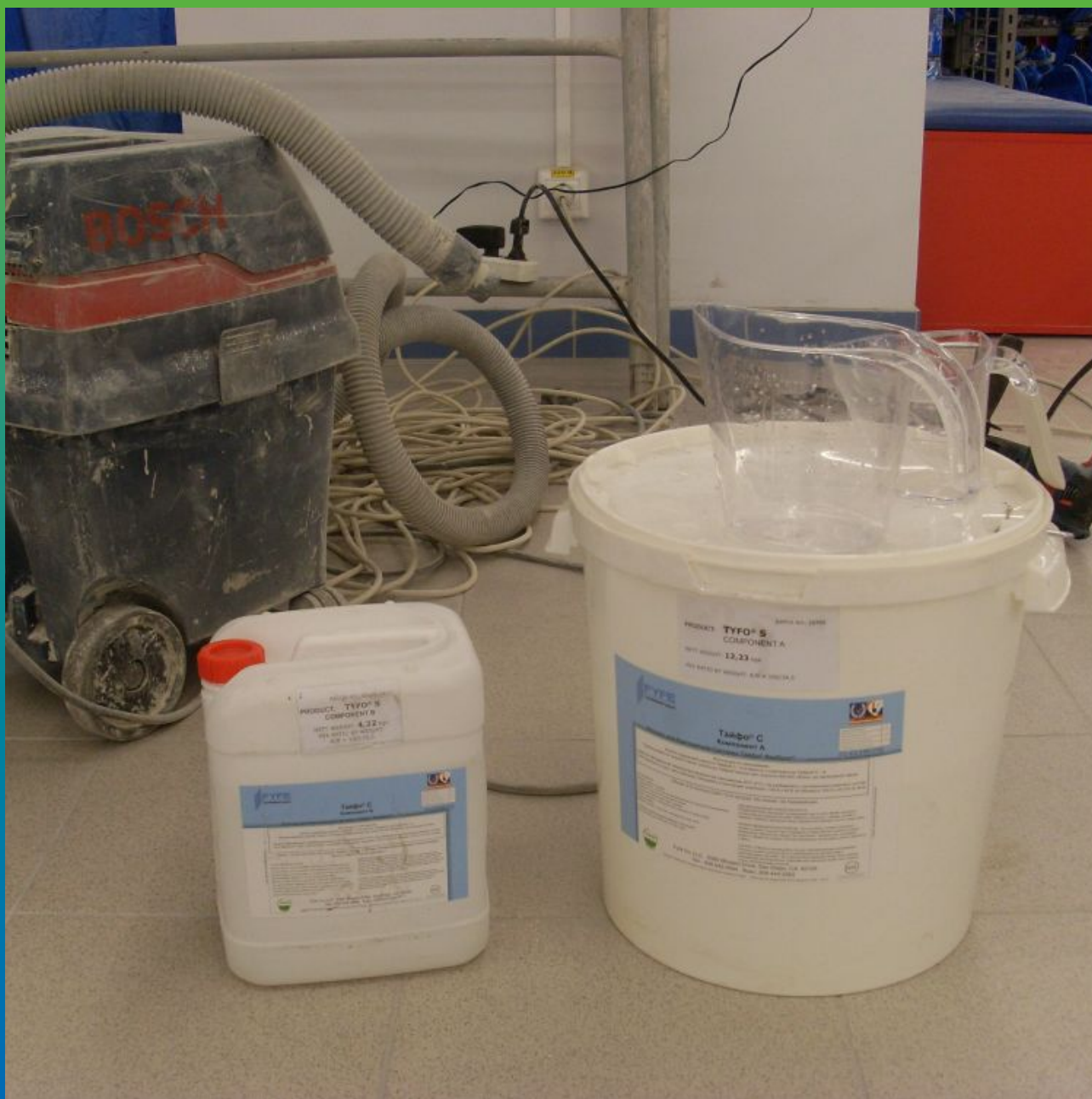
Клеевой состав Тайфо С Эпокси