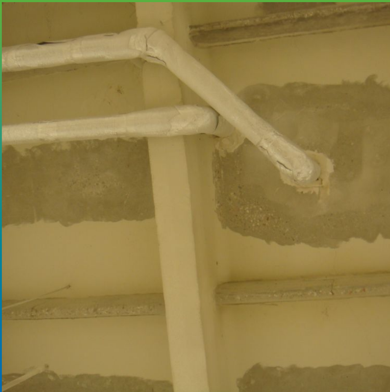
Подготовленная поверхность ребристых плит