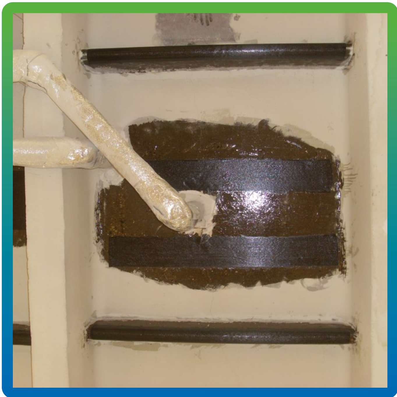
Монтаж Тайфо СЦХ 7АП-Н