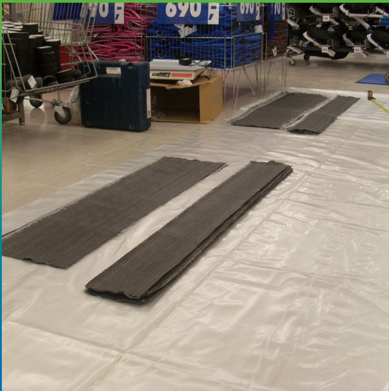
Нарезанные полосы системы усиления