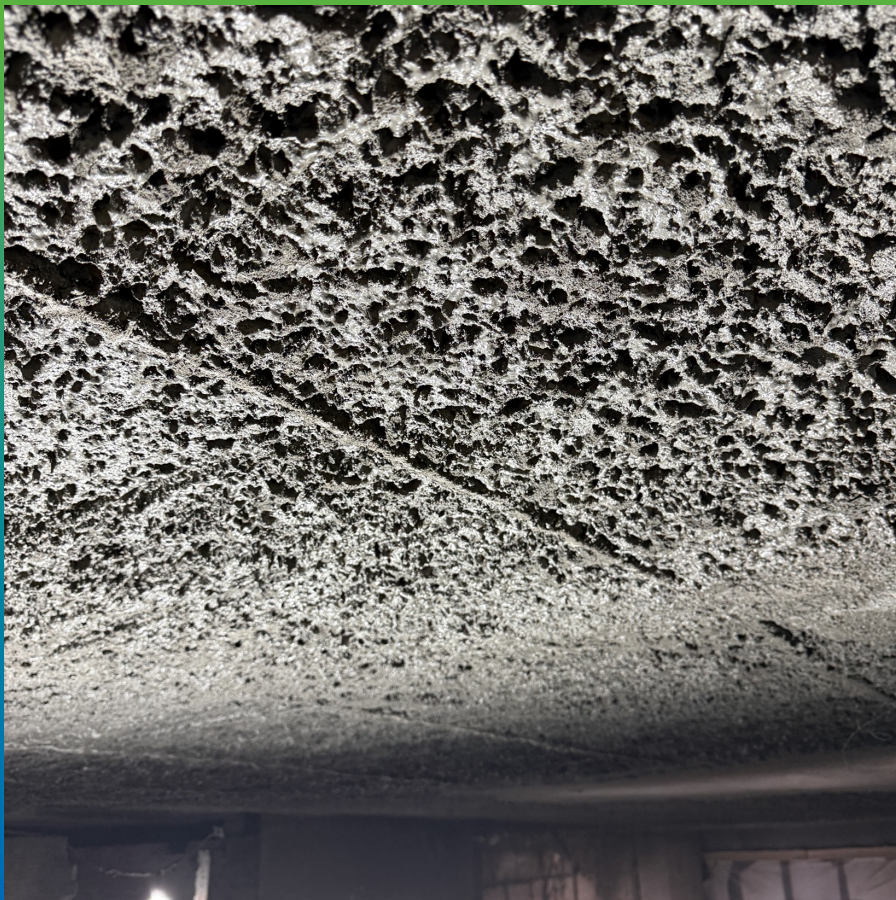
Послойное нанесение Стармекс ТМ6