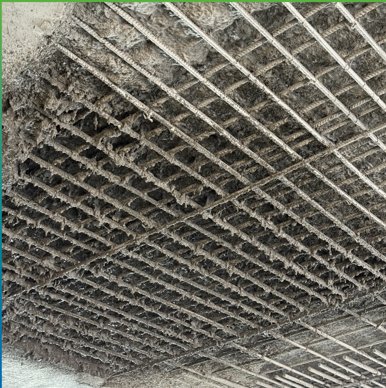
Послойное нанесение Стармекс ТМ6