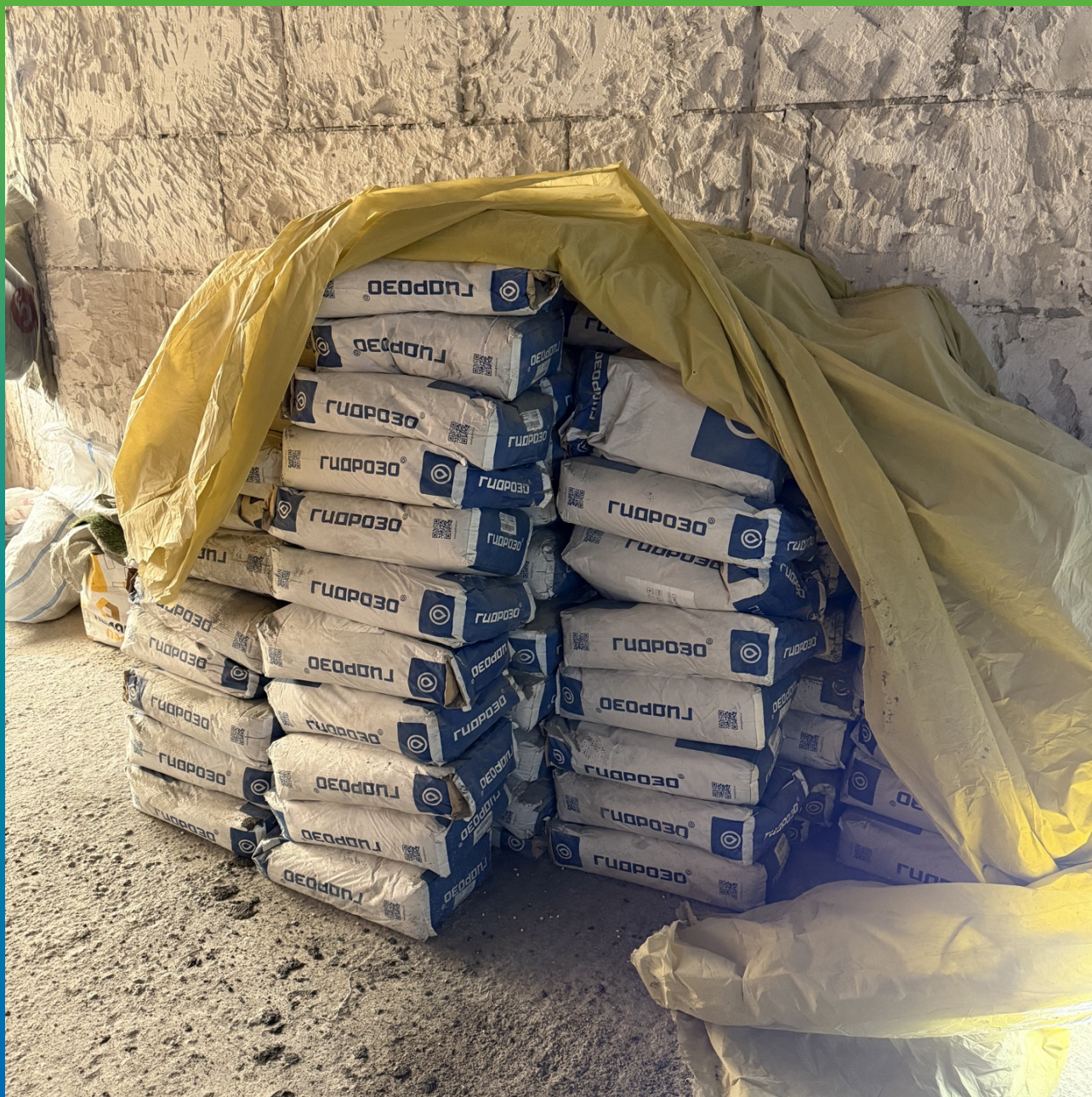
Стармекс ТМ6- ремонтный состав для нанесения методом торкретирования