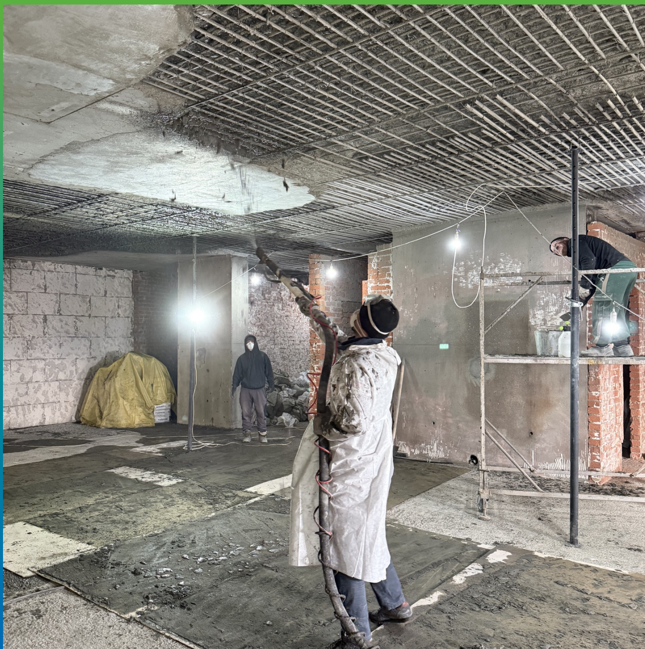
Нанесение Стармекс ТМ6