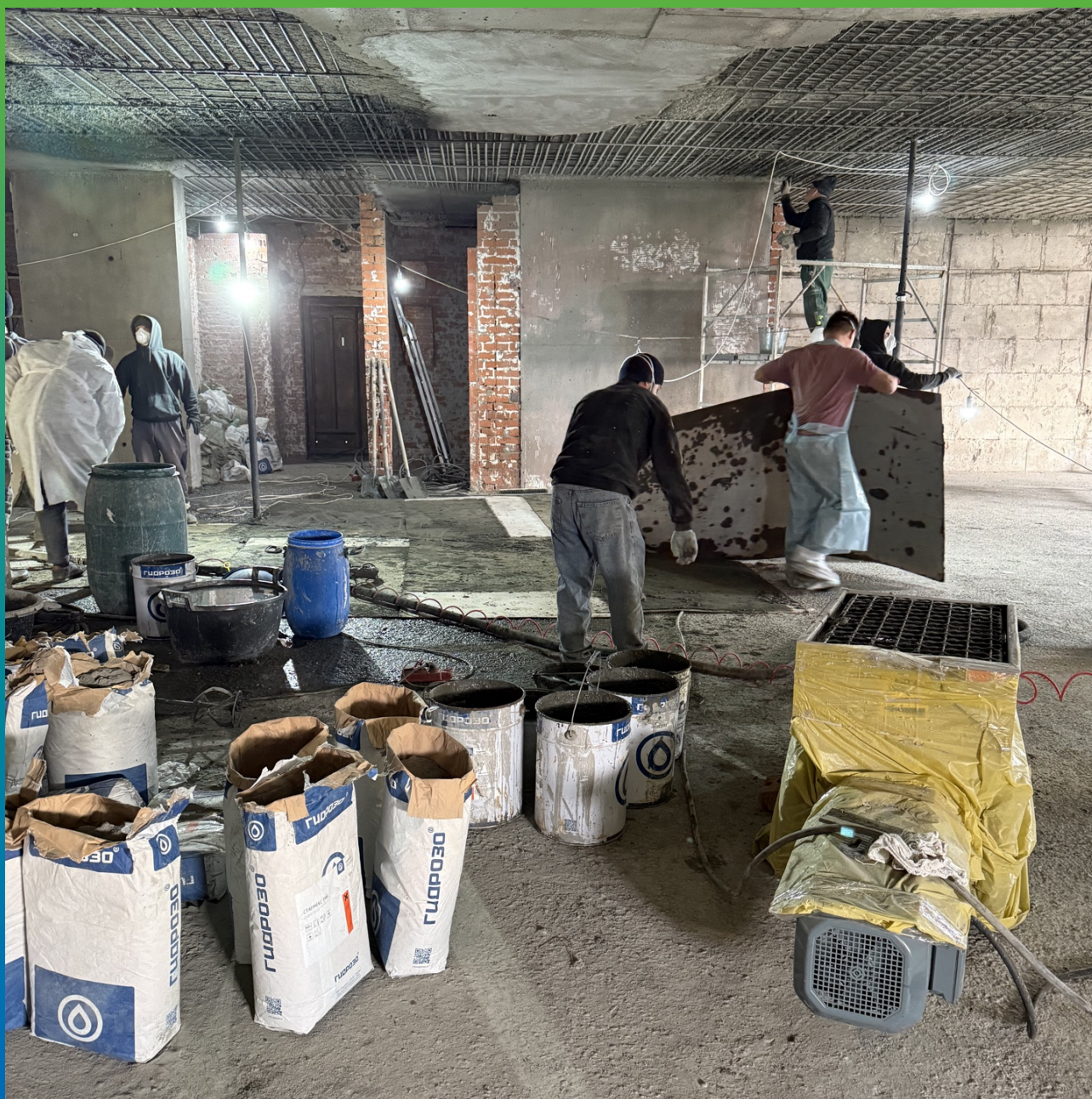
Подготовка оборудования и состава Стармекс ТМ6