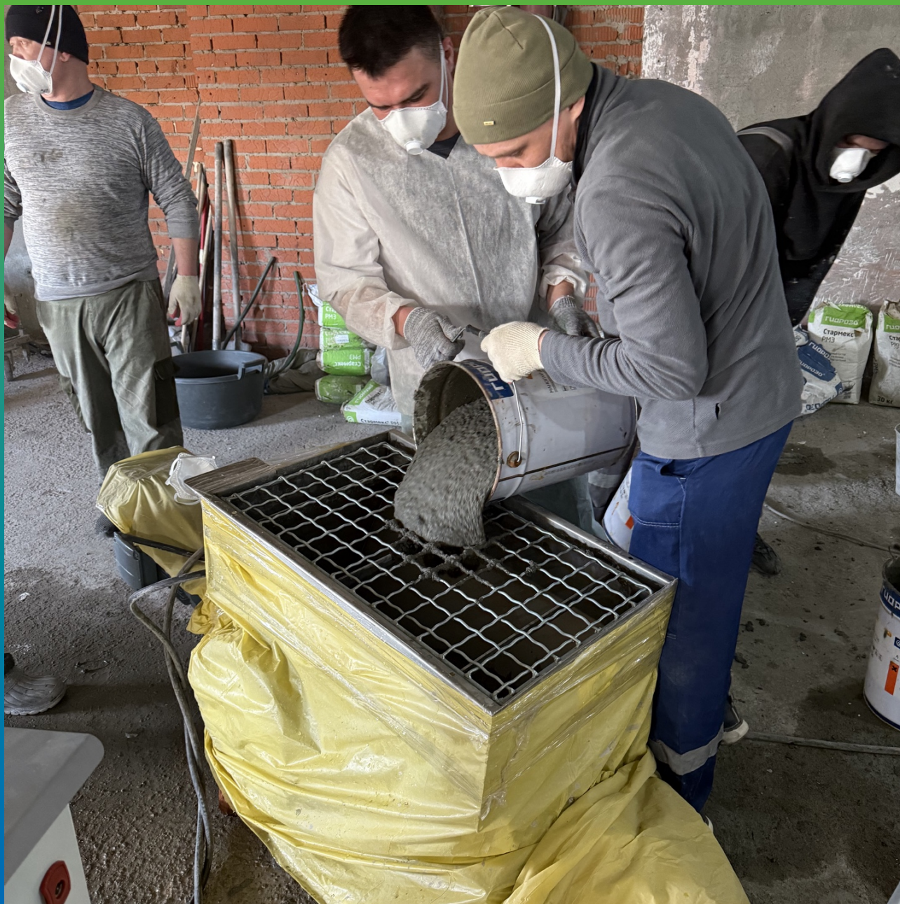
Загрузка состава Стармекс ТМ6 в оборудование для торкрета