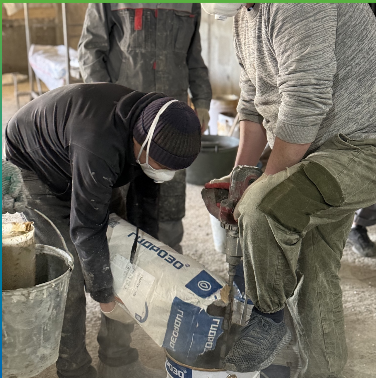
Смешивание состава Стармекс ТМ6