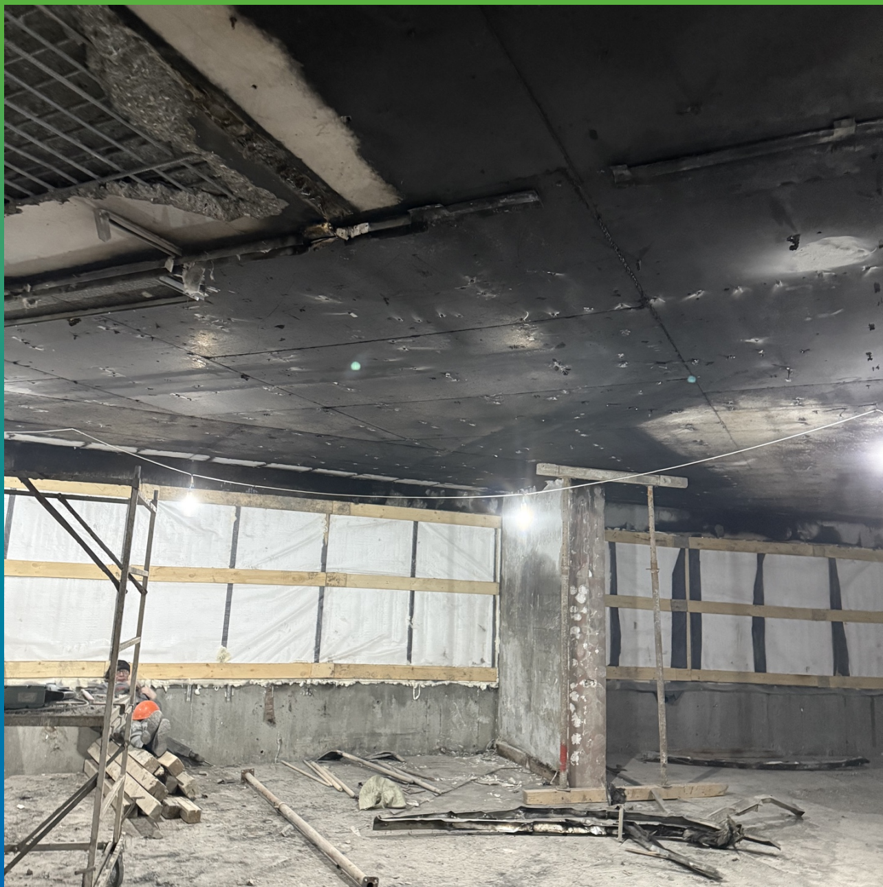
Общий вид разрушений