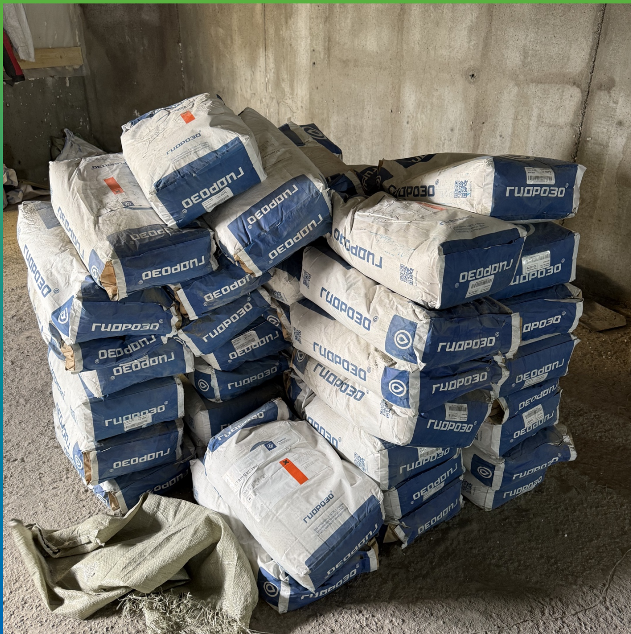
Стармекс ТМ6 - ремонтный состав для нанесения методом торкретирования