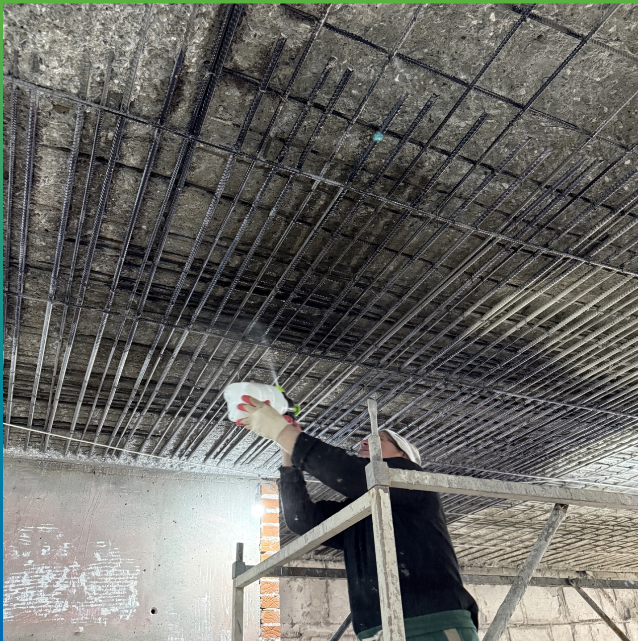
Увлажнение поверхности перед нанесением Стармекс ТМ6