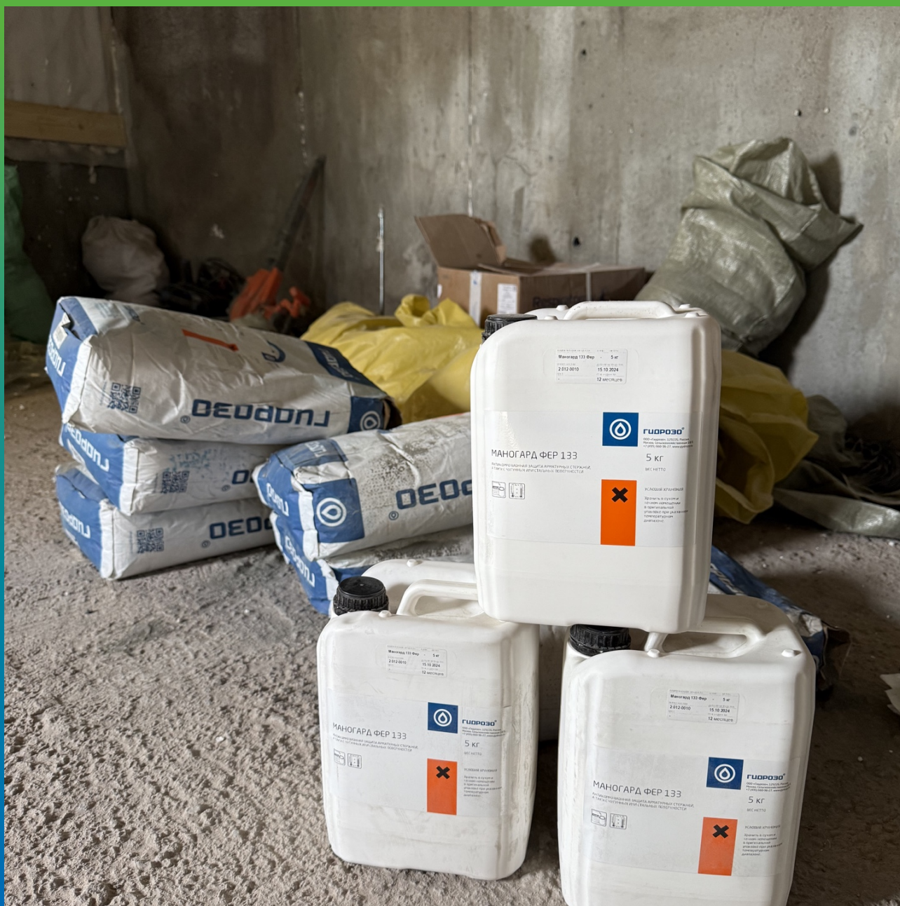
Состав для обработки арматуры- Маногард ФР