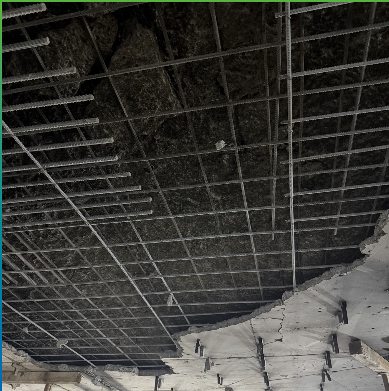
Отслоение бетонной плиты по арматуре