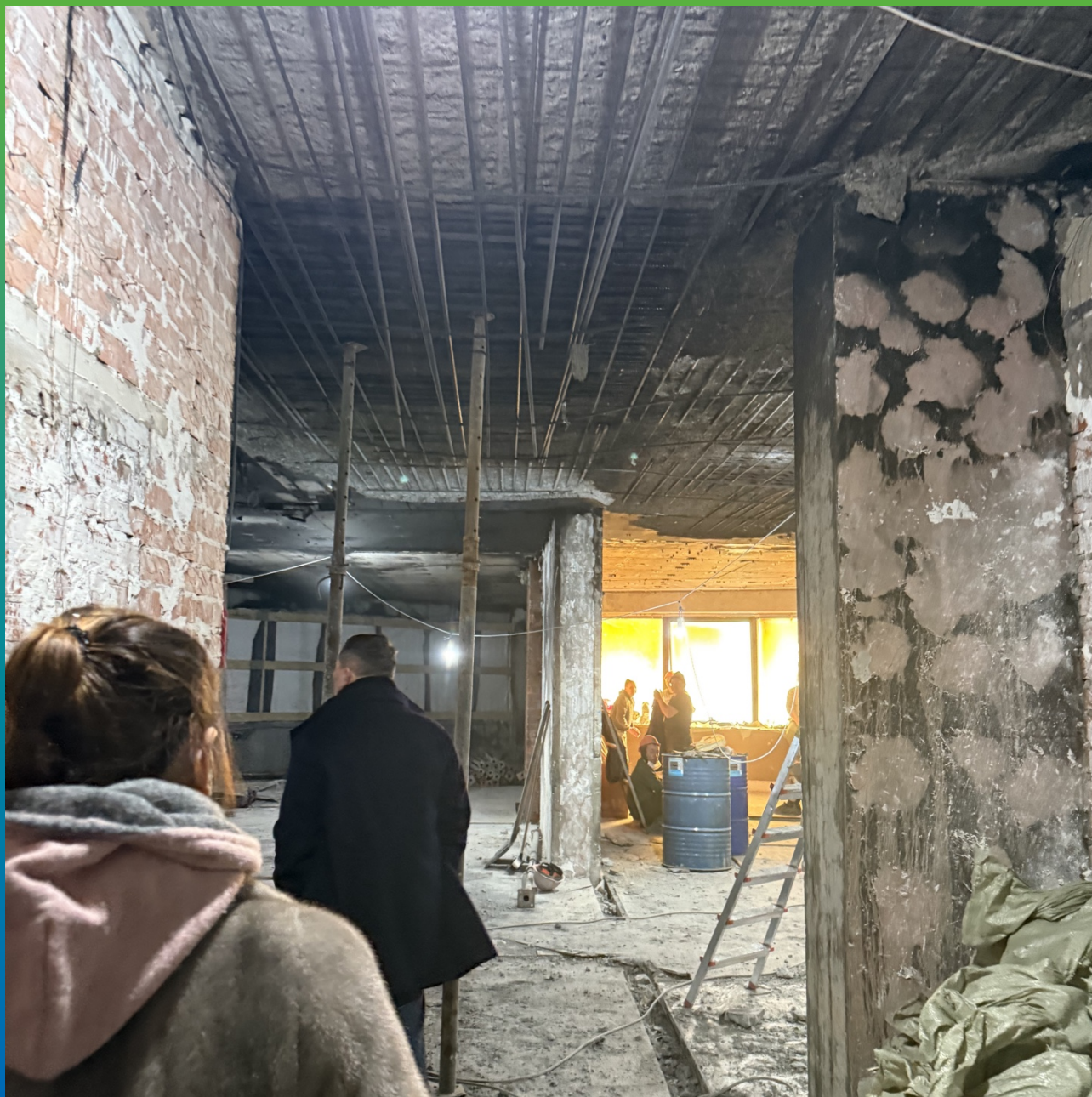
Отслоение бетонной плиты по арматуре