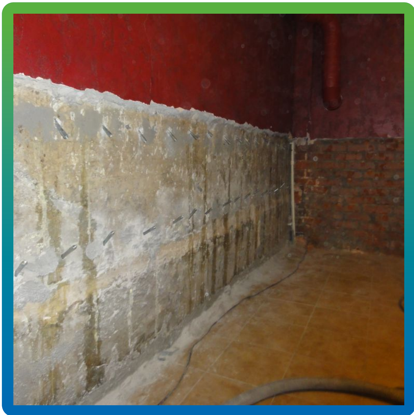
Вид подготовленного участка перед инъектированием