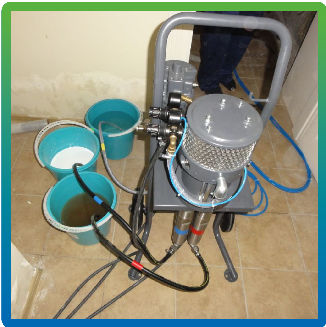
Насос БМ 1425 + Манокрил Гель В + Манокрил Флекс