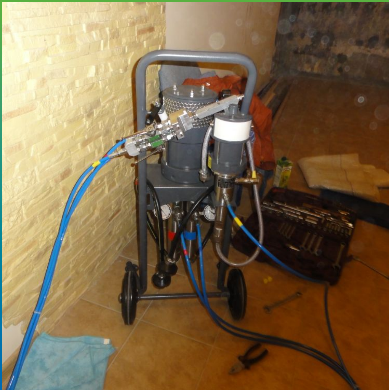
Вид насоса БМ1425 перед началом работ