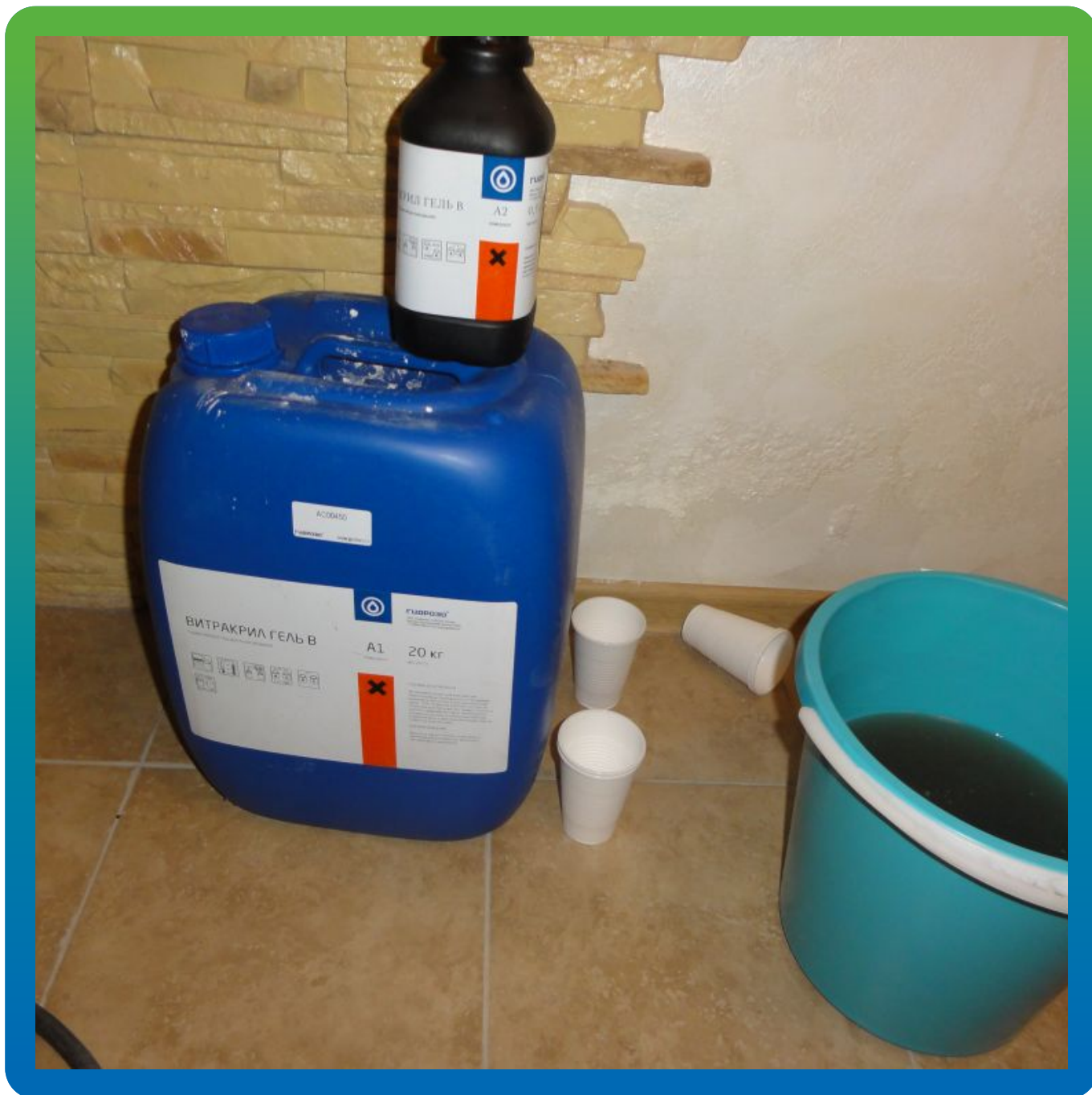
Вид материала на объекте