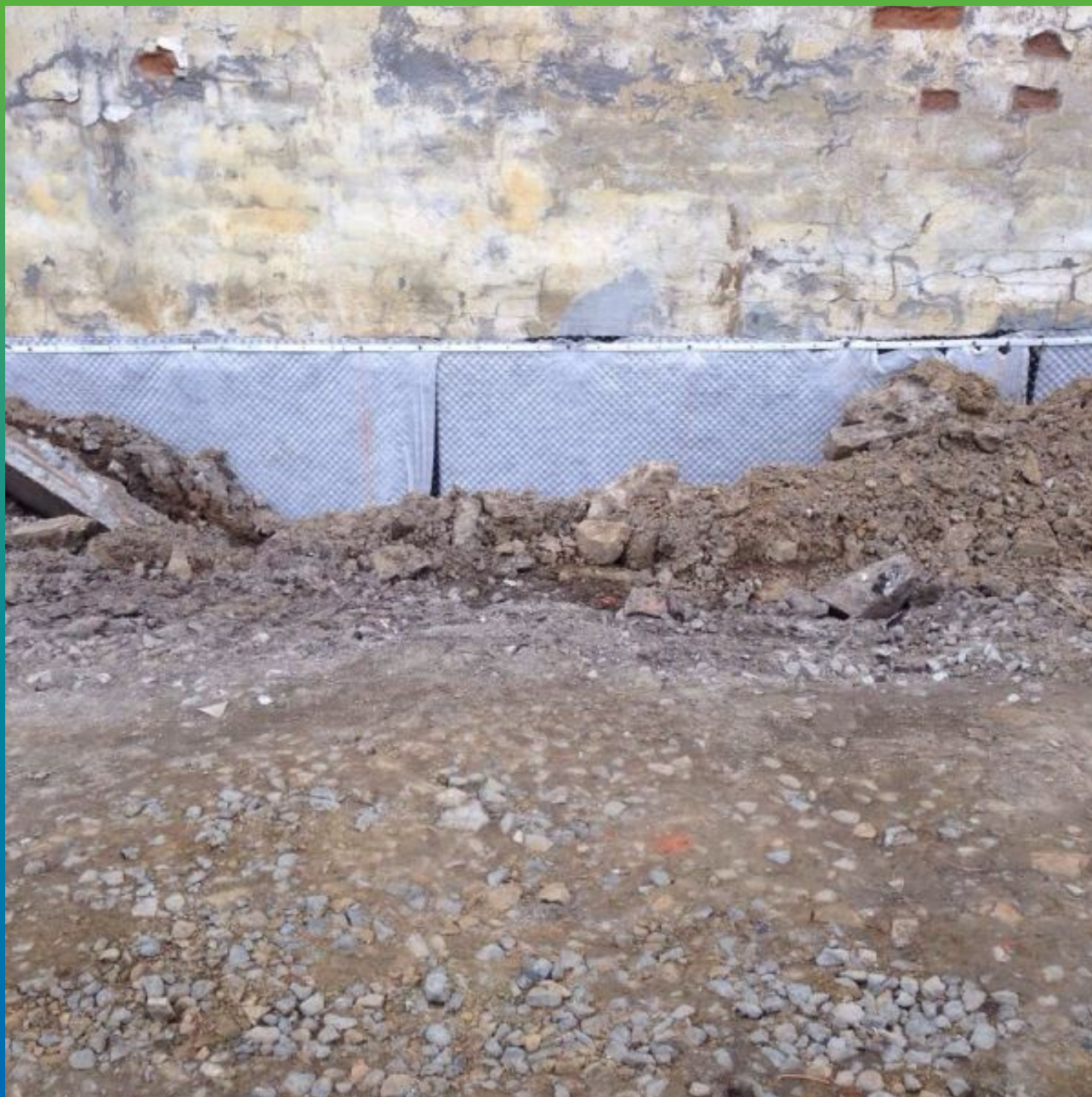
Выполненная обратная засыпка фундаментов