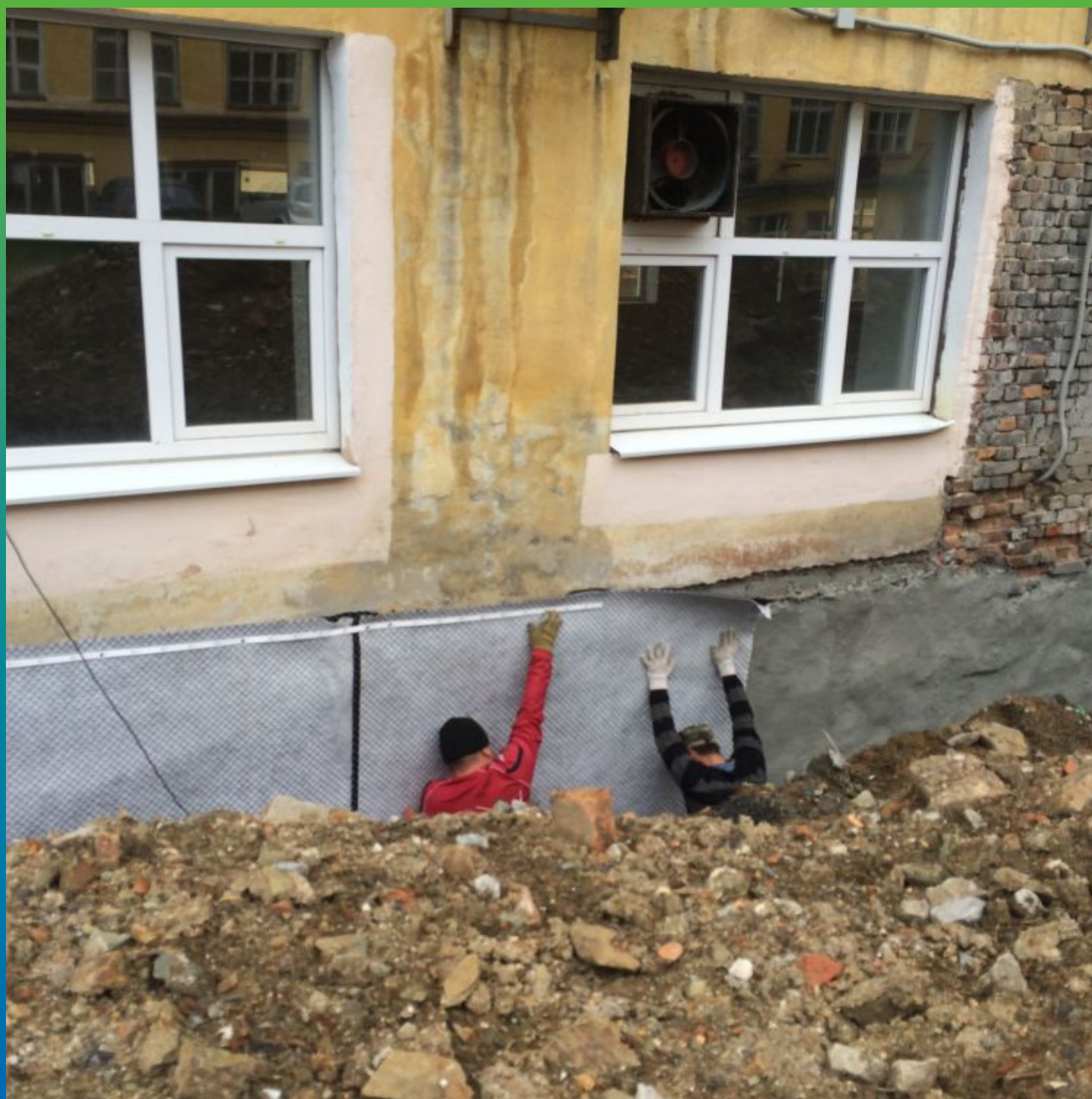
Крепление дренажной защитной мембраны Максдрейн 8 ГТ