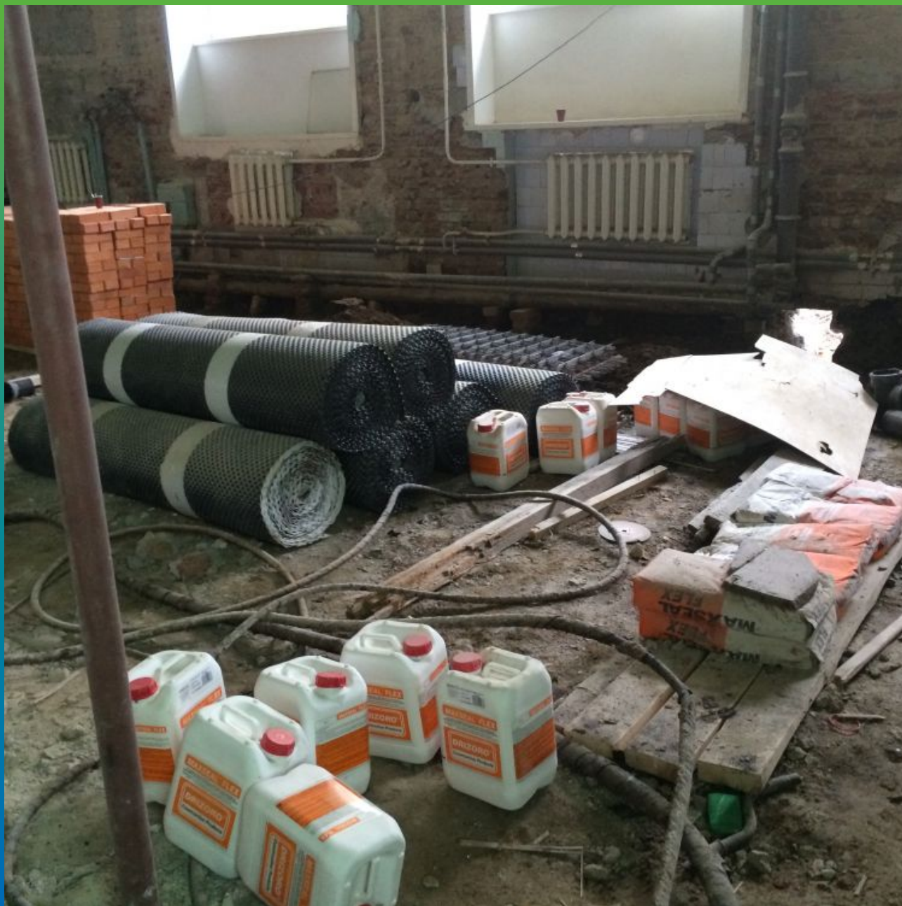
Материалы используемые на строительной площадке