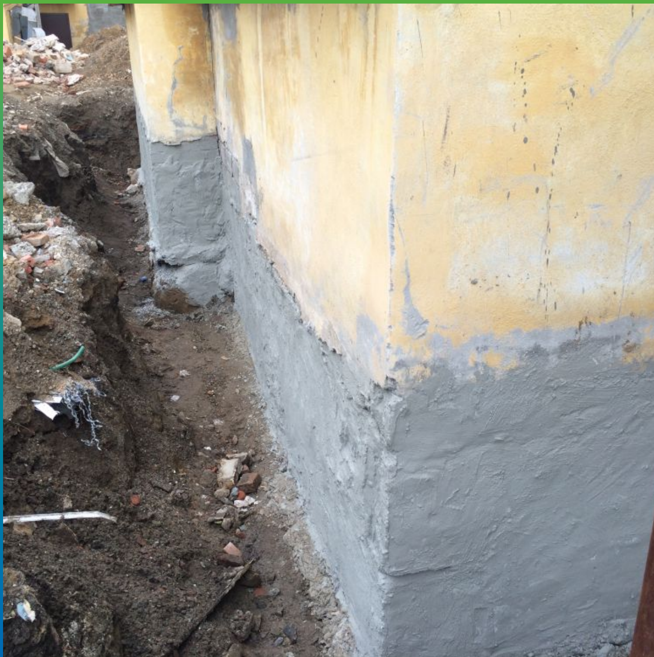
Внешний вид слоя гидроизоляции Максил Флекс