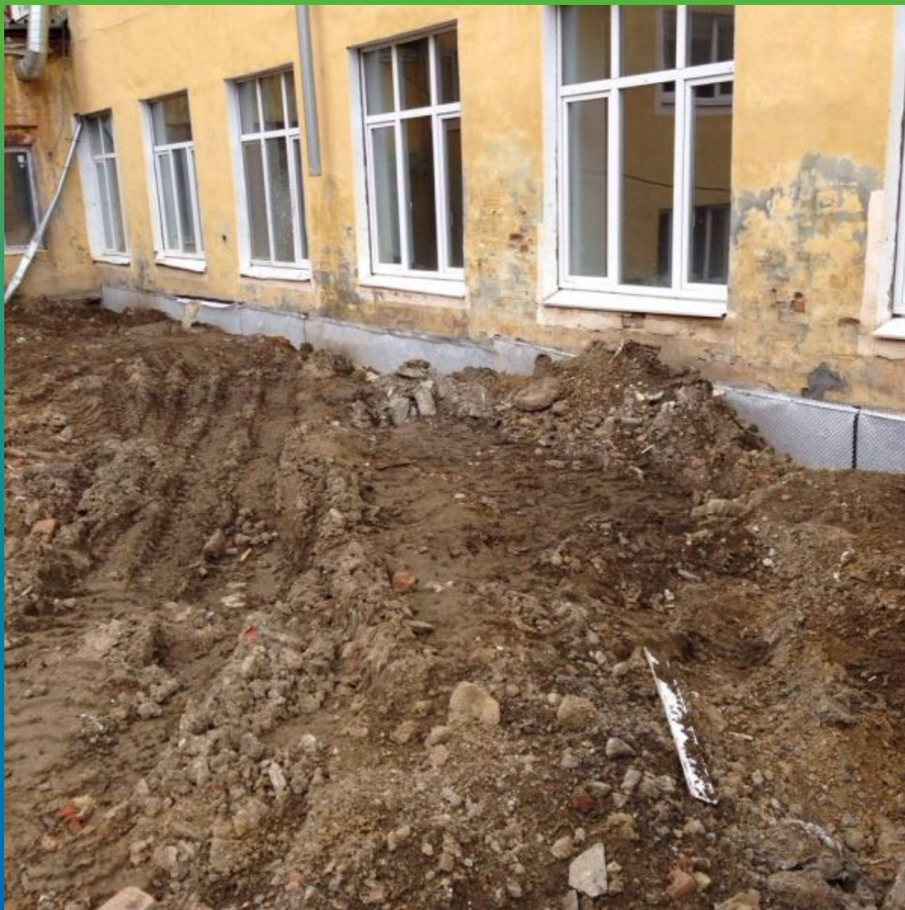
Устройство обратной засыпки фундамента