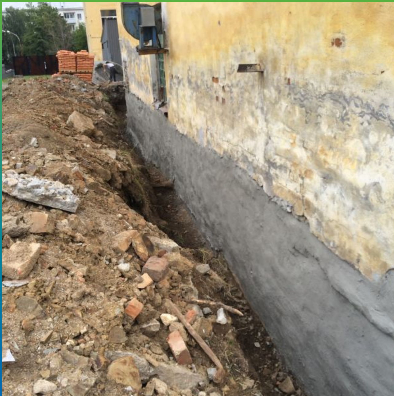
Нанесенное за два слоя гидроизоляционное покрытие Максил Флекс