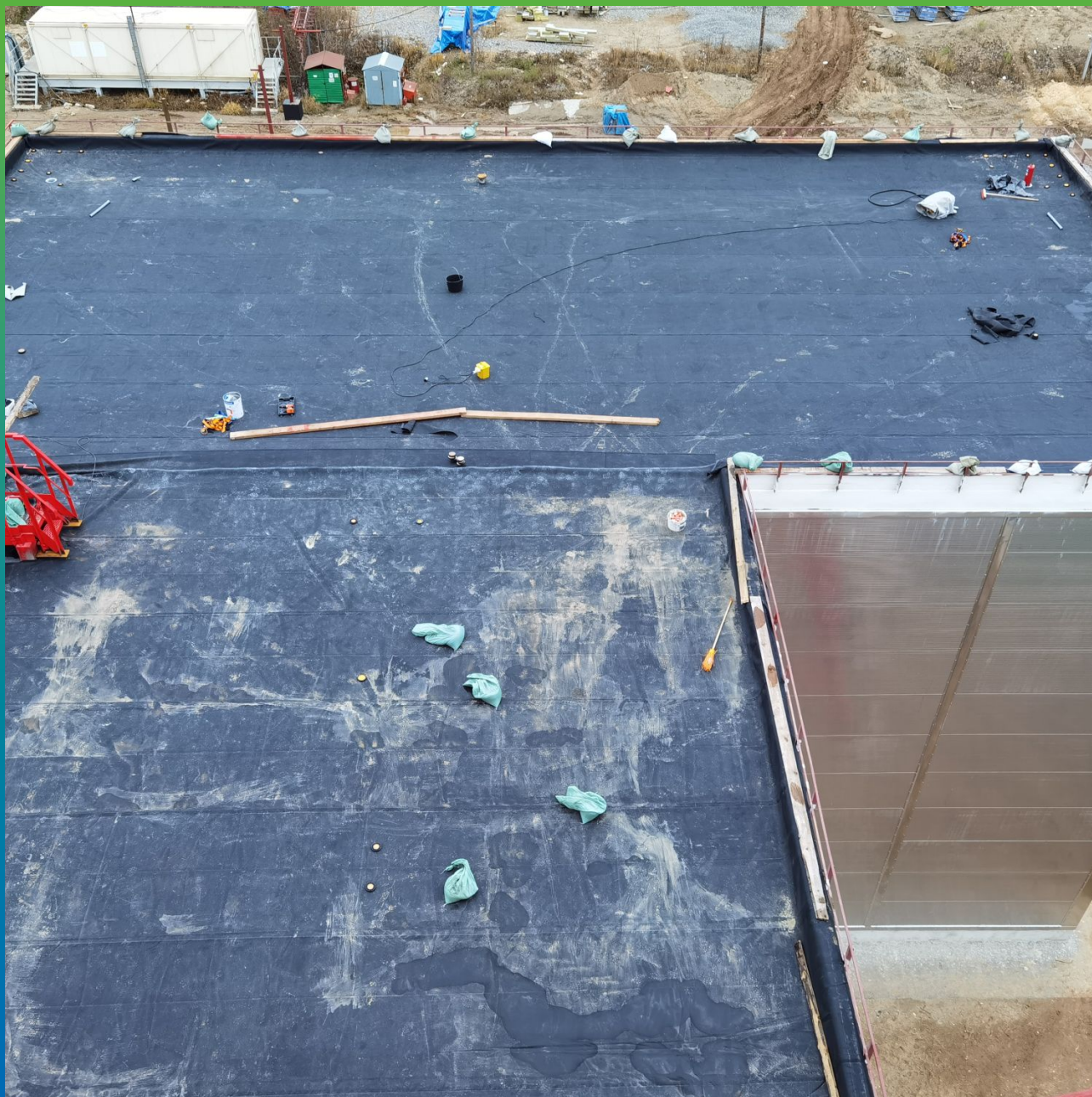
Вид кровли после проведения работ