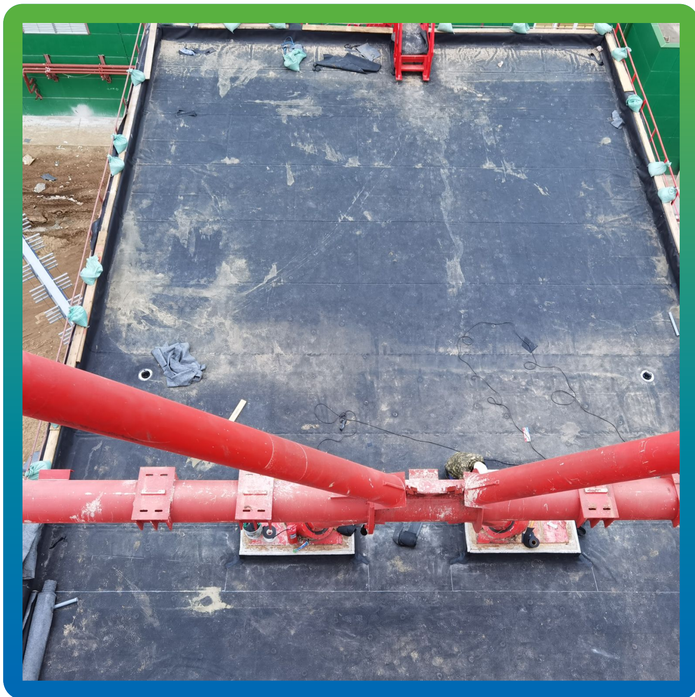
Кровля после проведения работ второй ярус