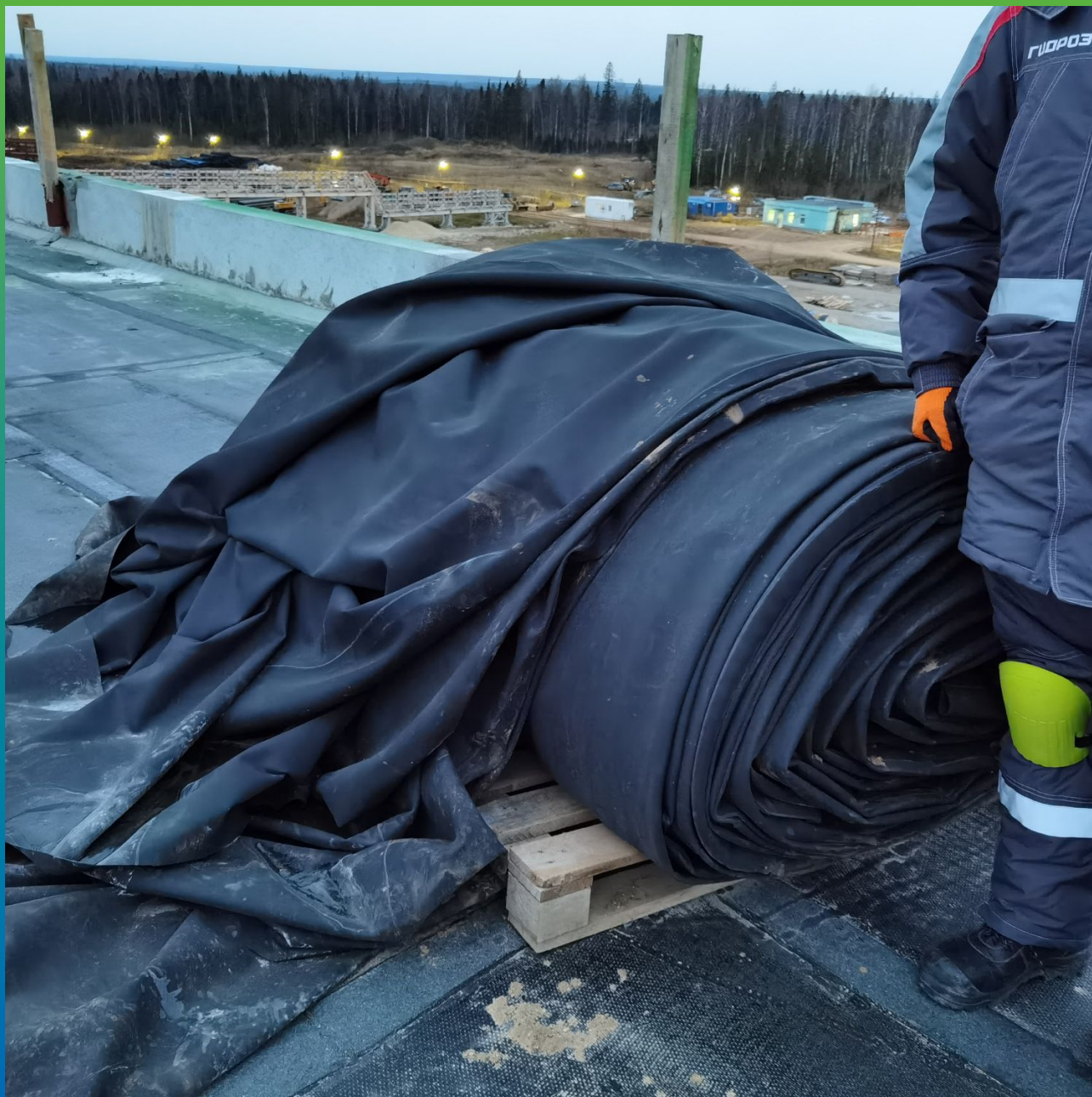
Подъем на кровлю сваренной в карту ЭПДМ-Мембраны Прелести СТ 1,2 мм.