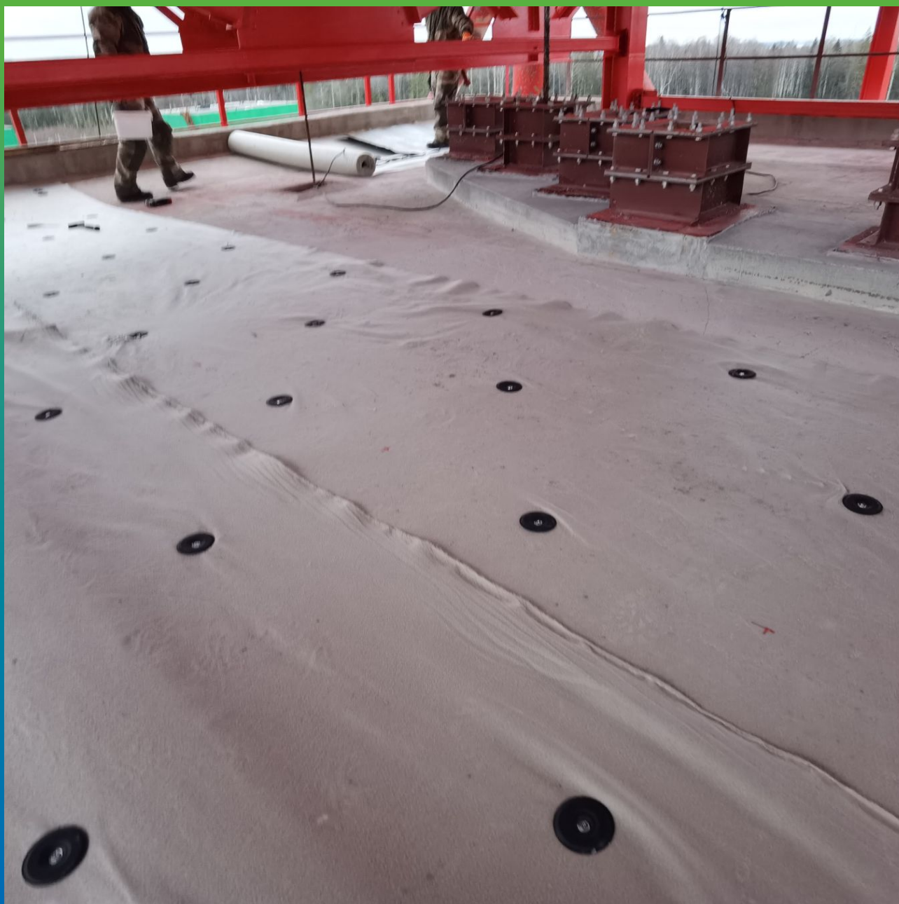
Крепления шайб Центрикс к основанию