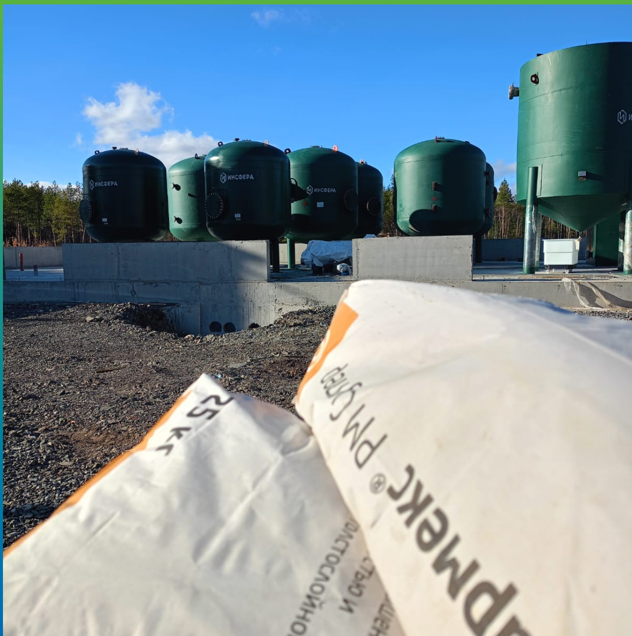
Состав Стармекс РМ Супер на объекте