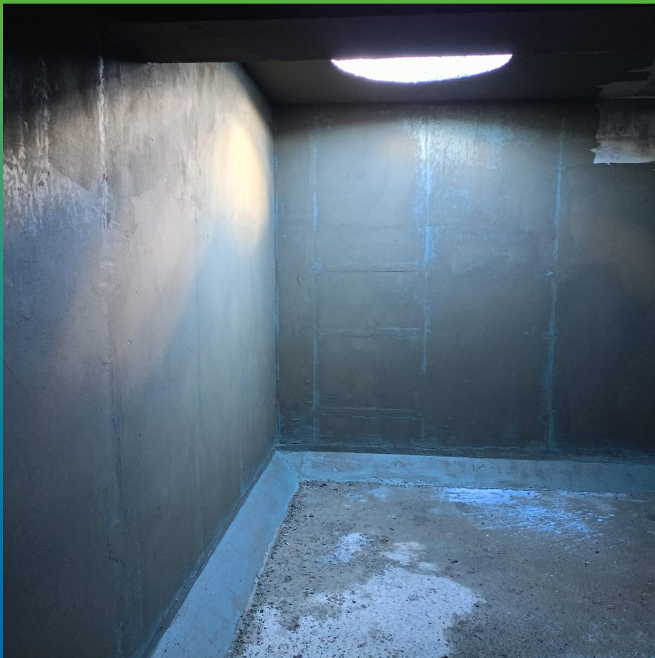
Нанесенный материал Стармекс Эласт общий вид