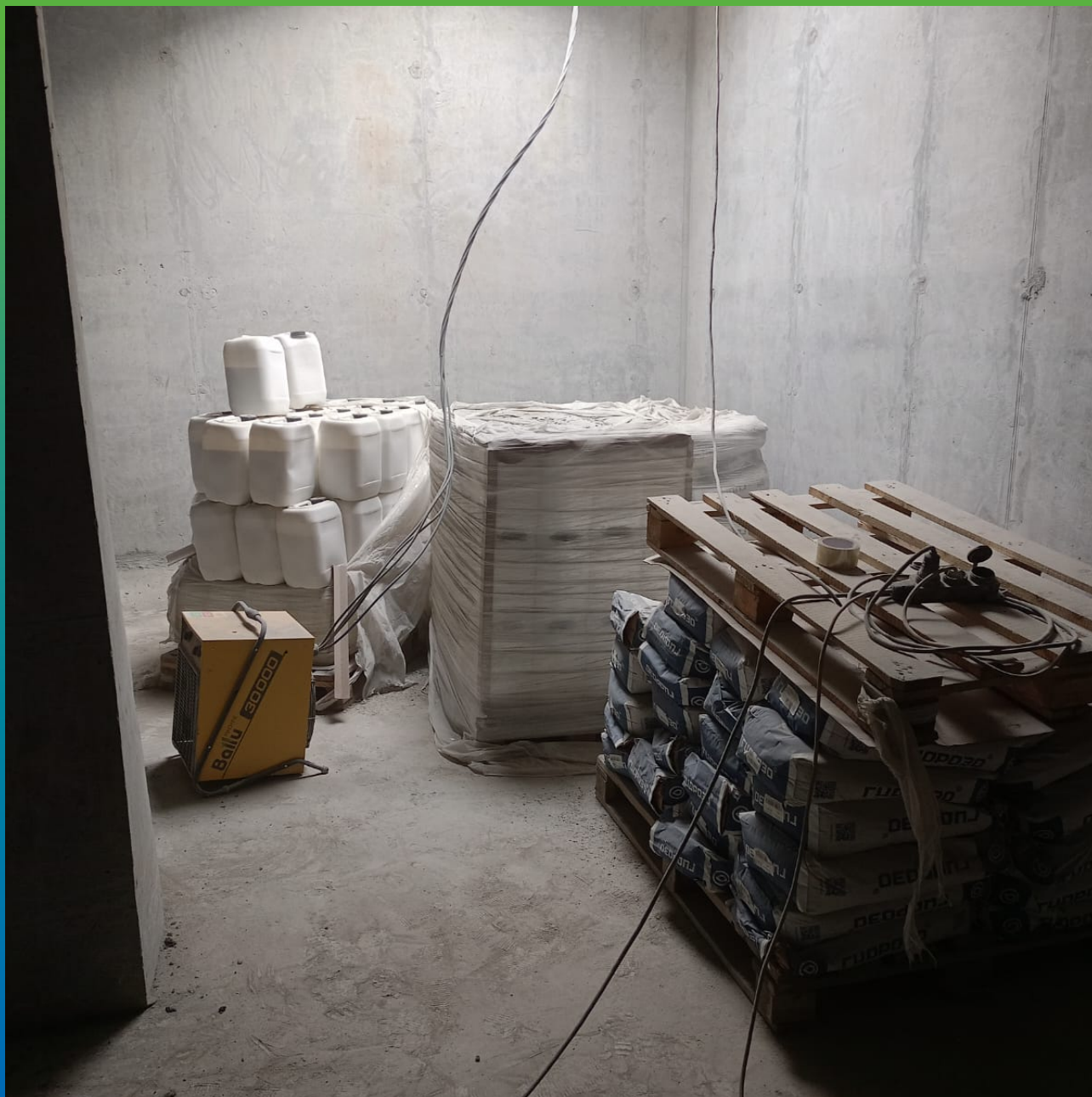
Материал Стармекс Эласт на объекте