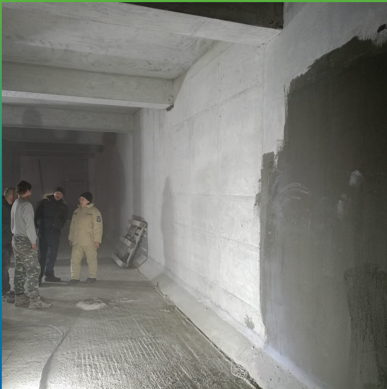
Процесс контроля нанесения материала со стороны стройконтроля