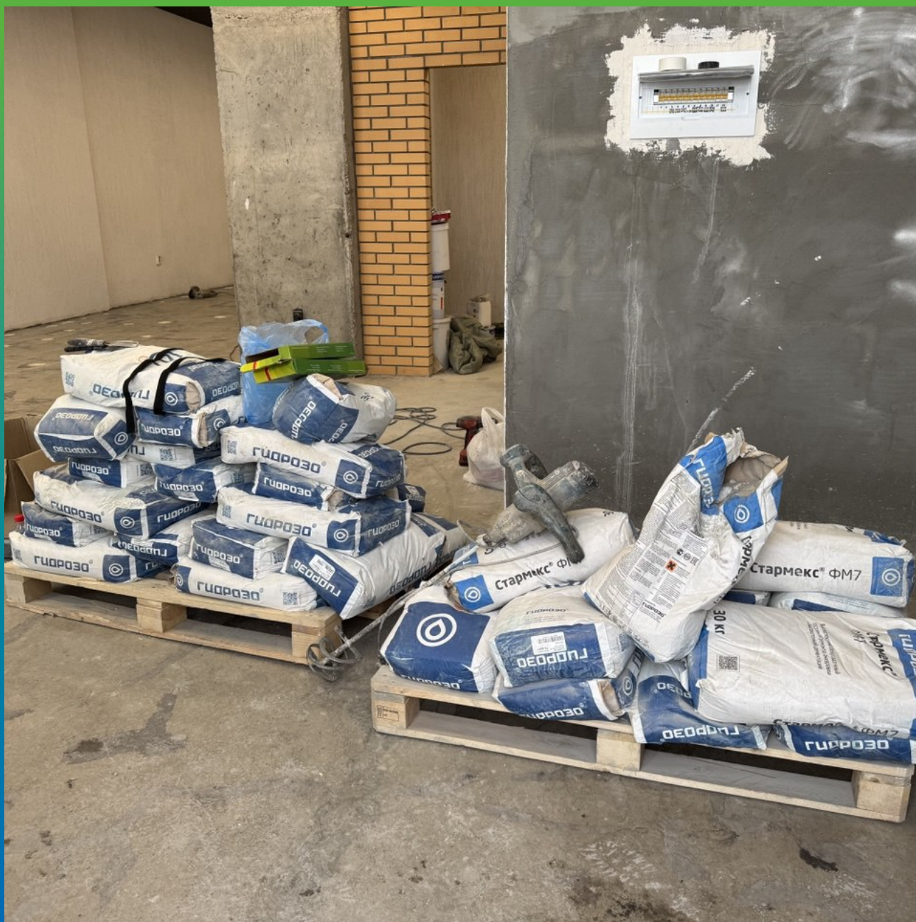
Состав Стармекс ФФ на площадке