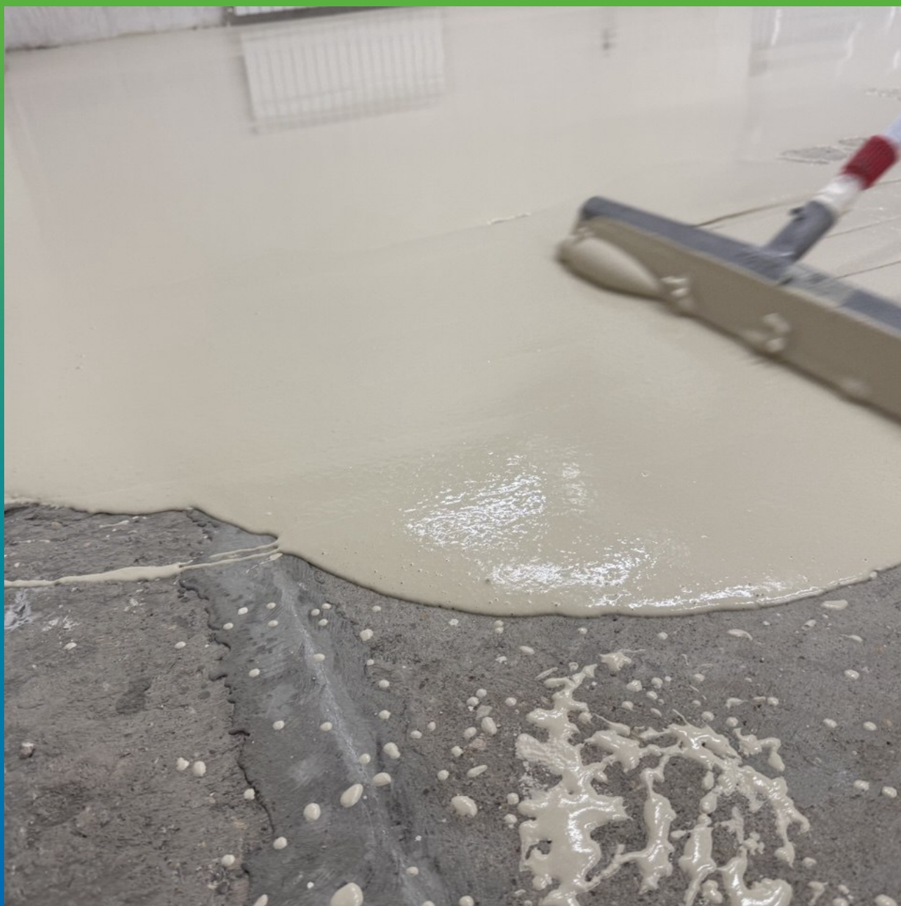
Распределение смеси Стармекс ФФ по площади и устройство толщины при помощи отрегулированной ракели