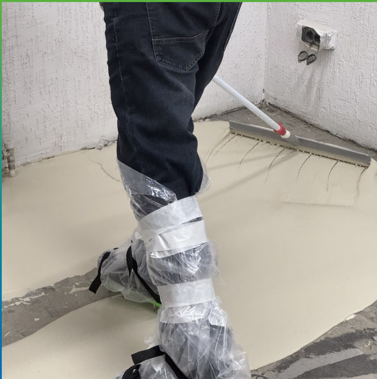
Распределение смеси по площади с контролем толщины. Другой ракурс.