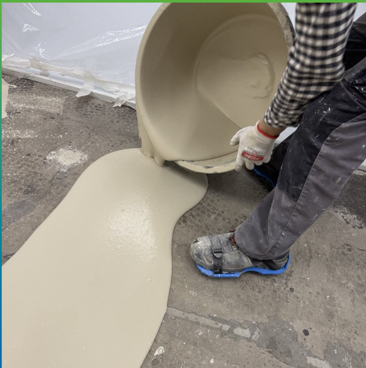
Нанесение смеси Стармекс ФФ на подготовденно основание