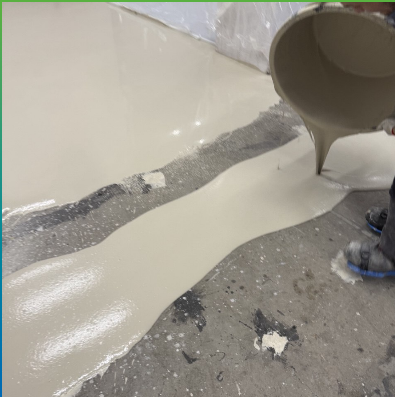
Нанесение очередной порции смеси Стармекс ФФ