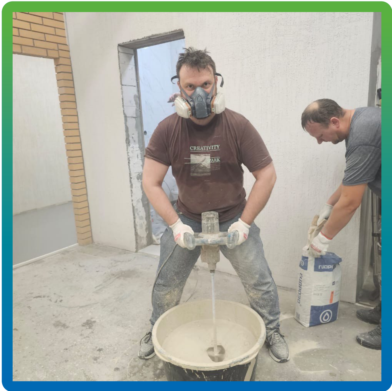
Процесс размешивания состава строительным миксером