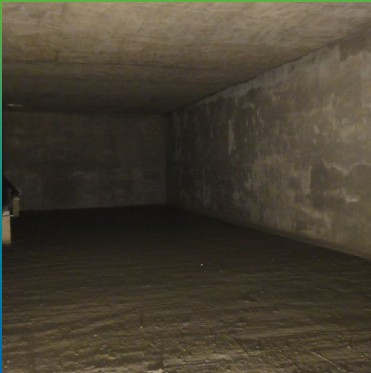
Финальный вид объекта