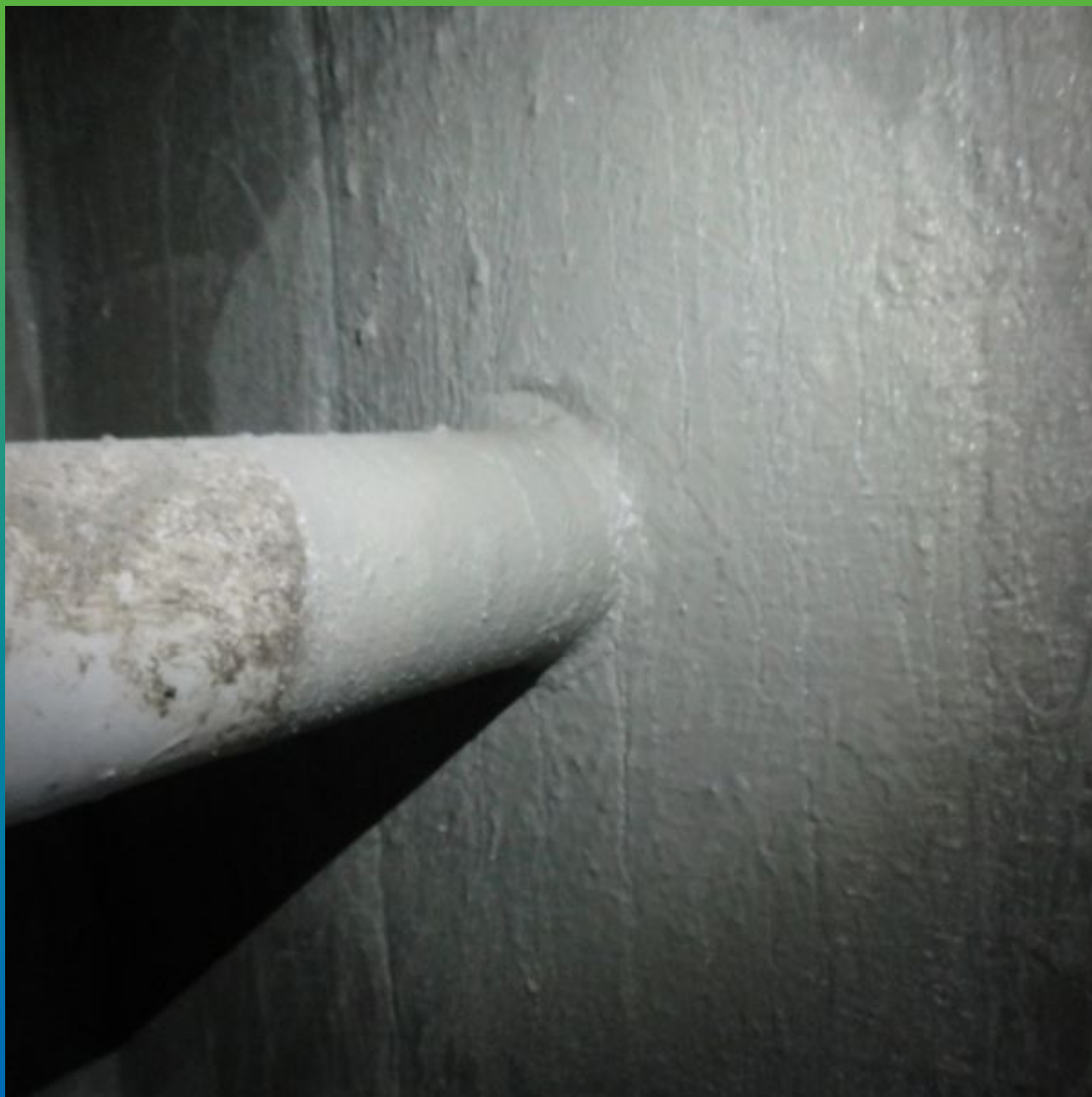
Гидроизоляция ввода/вывода коммуникаций с помощью Макссил Флекс