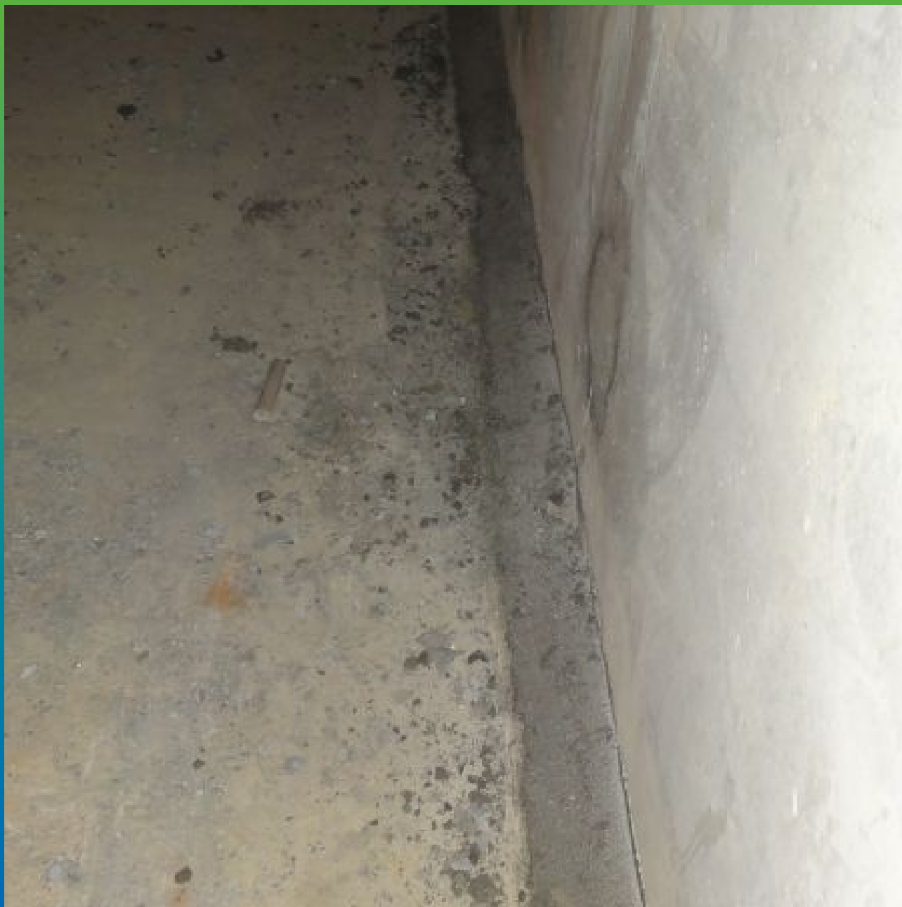
Галтель из Стармекс РМЗ