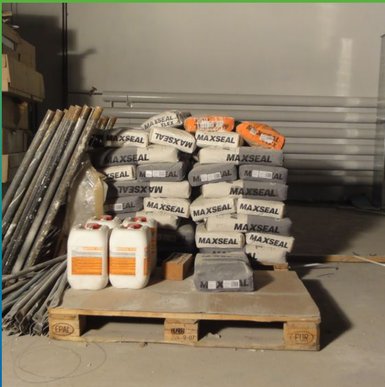
Материалы на объекте