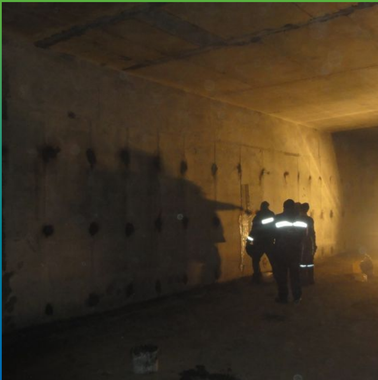
Первоначальный вид объекта