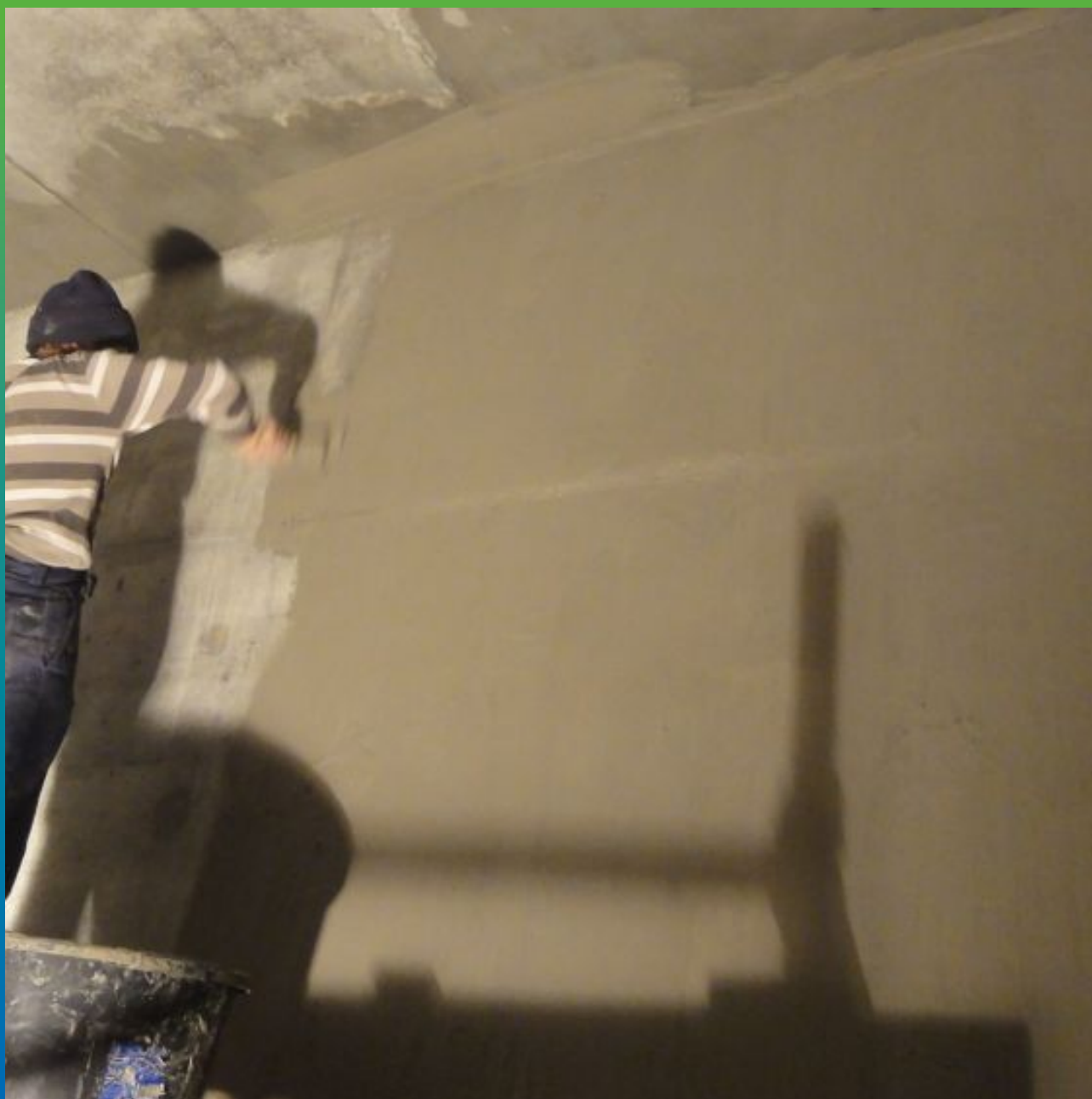
Нанесение Макссил при помощи Стармекс Браш