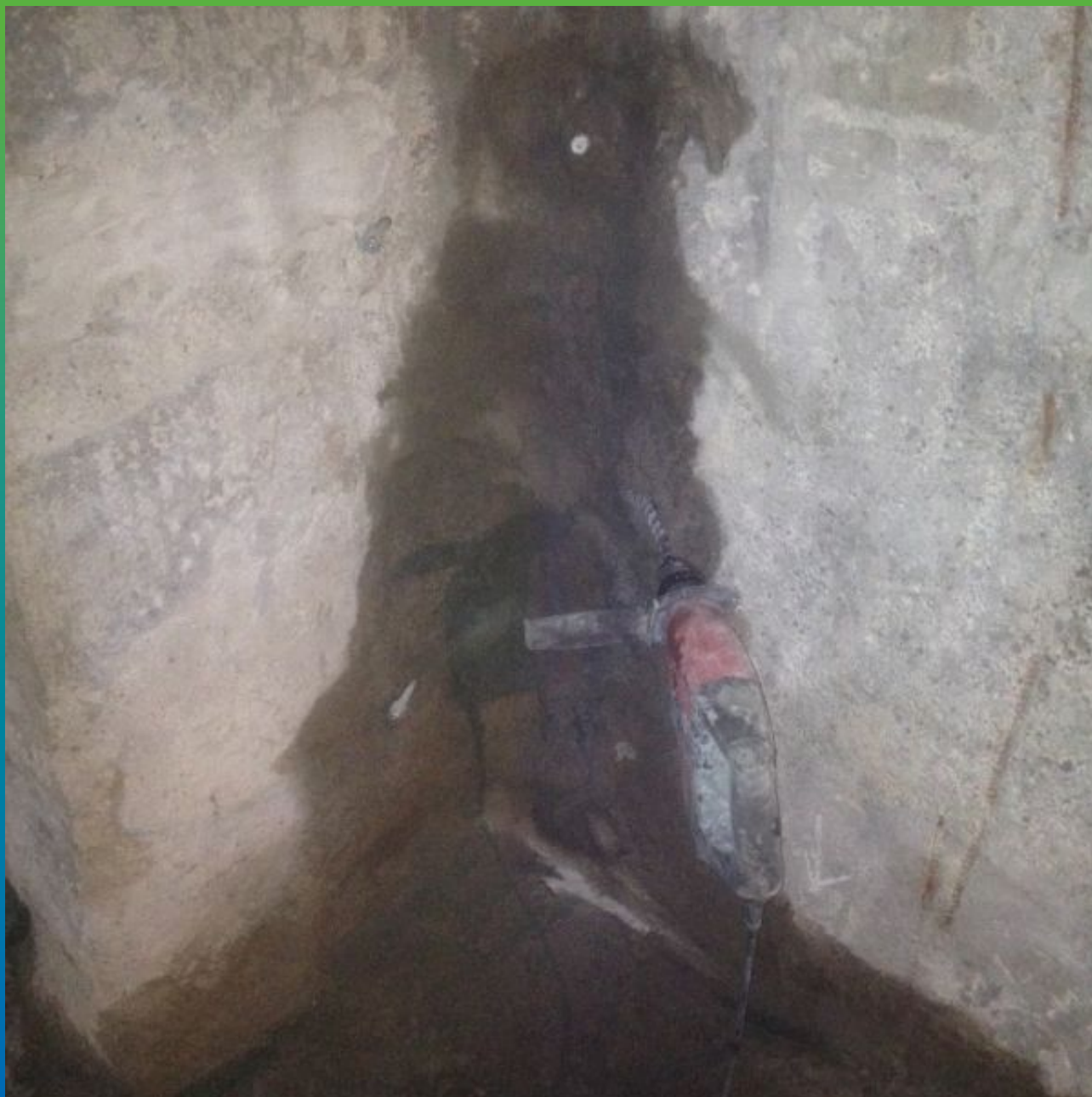
Бурение шпуров под пакера