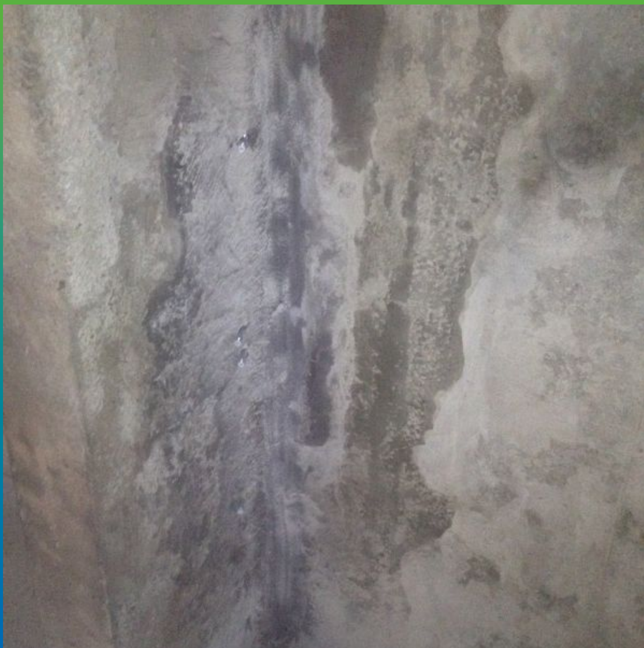
Финальный вид шва