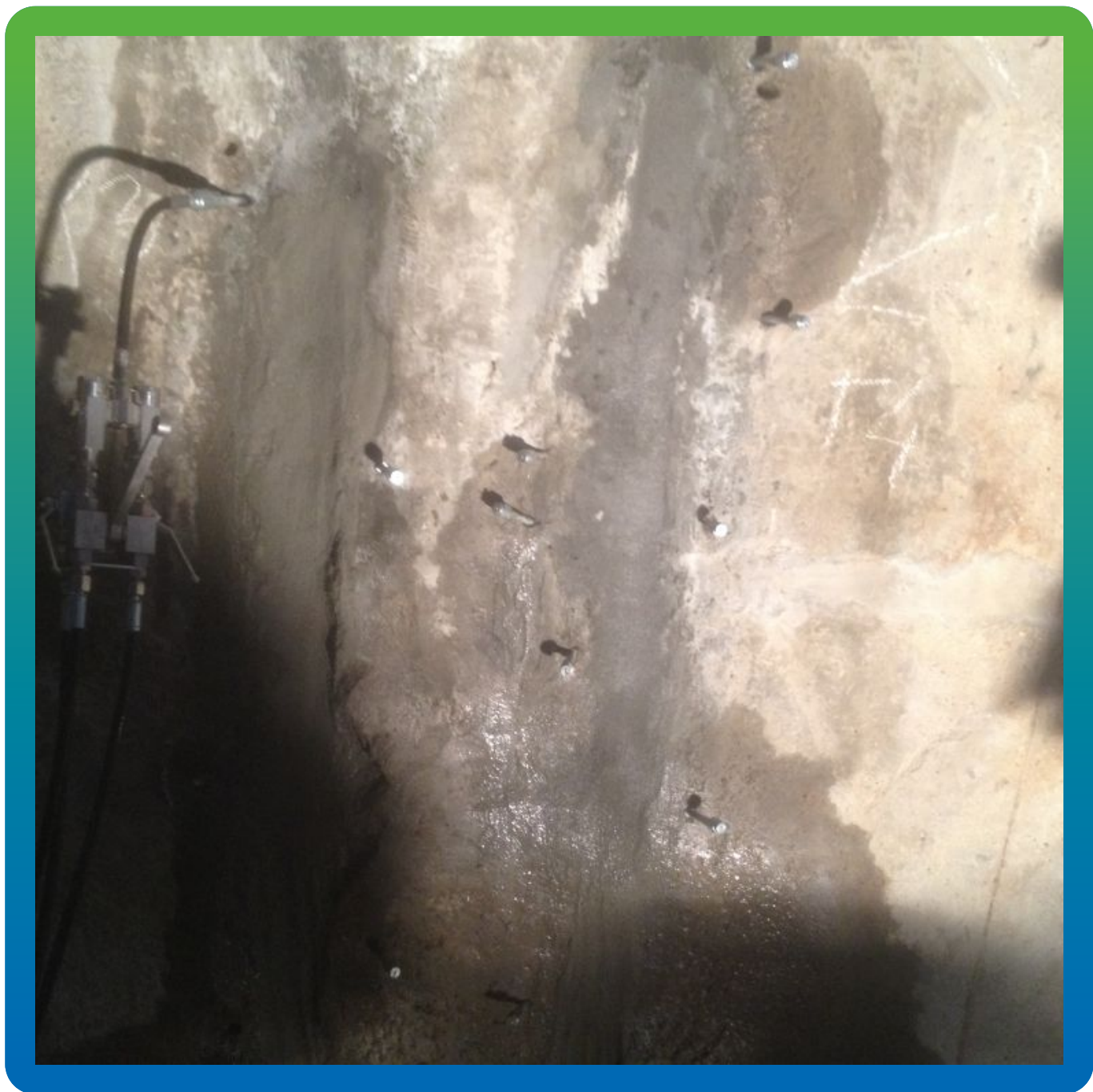
Инъектирование Витракрил Гель в шов с помощью БМ 1412