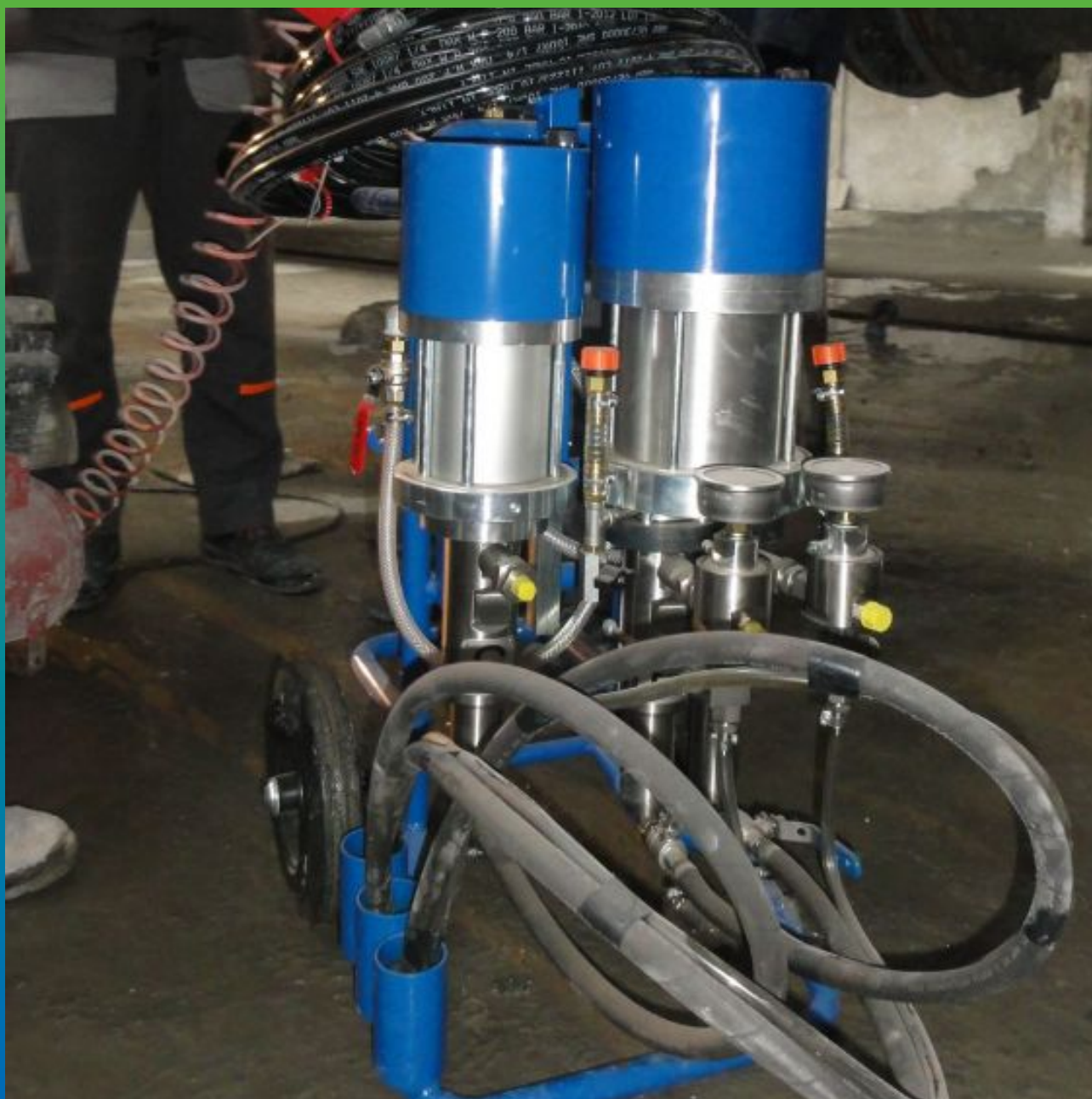
2к насос БМ 1412