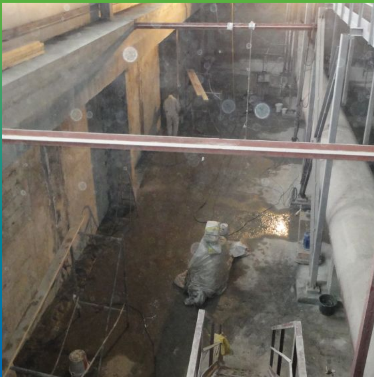
Общий вид объекта - изнутри