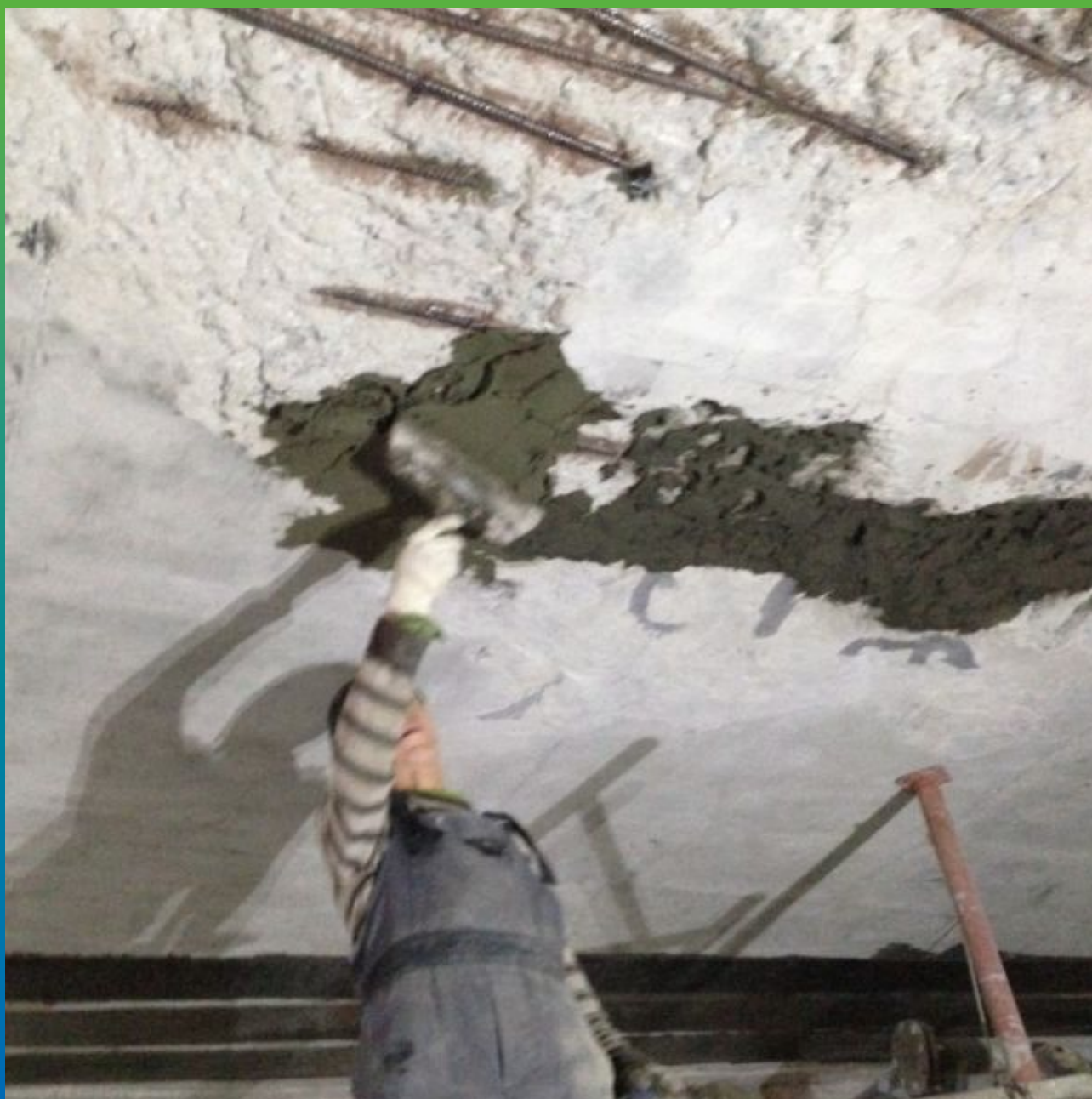
Нанесение ремонтного состава "Максрайт 500" на основание за первый слой.