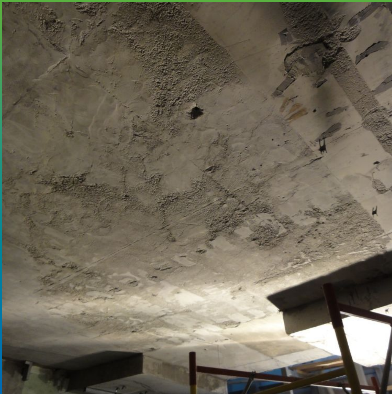
Общий вид участка с дефектом бетона плиты покрытия.