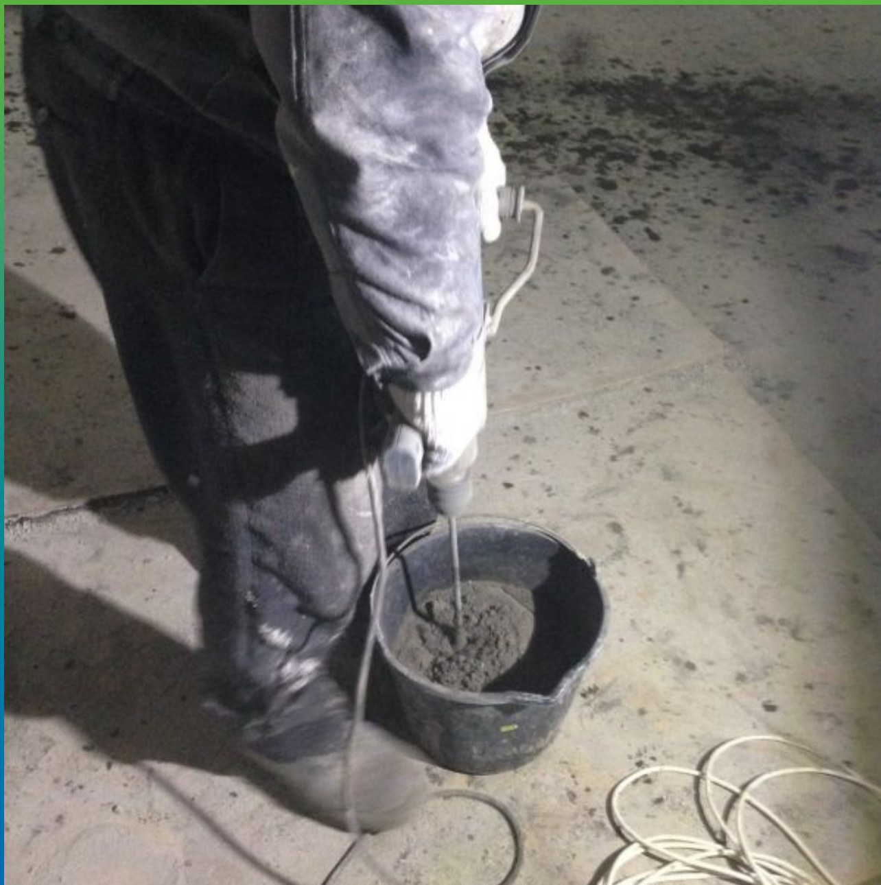
Замешивание ремонтного состава "Максрайт 500" с водой. Подготовка состава.