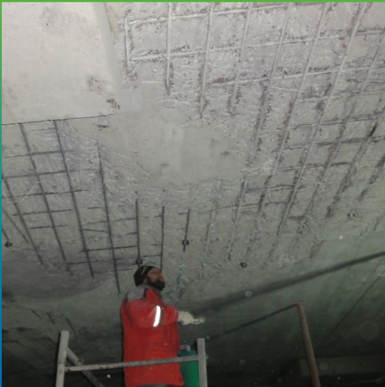
Покрытие оголенной арматуры пассиватором коррозии "Максрест пассив" на второй слой