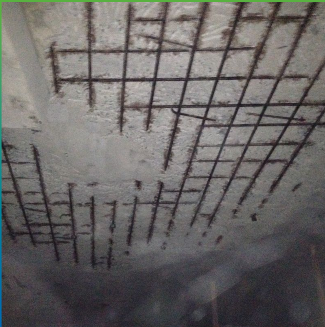
Общий вид подготовленного участка.