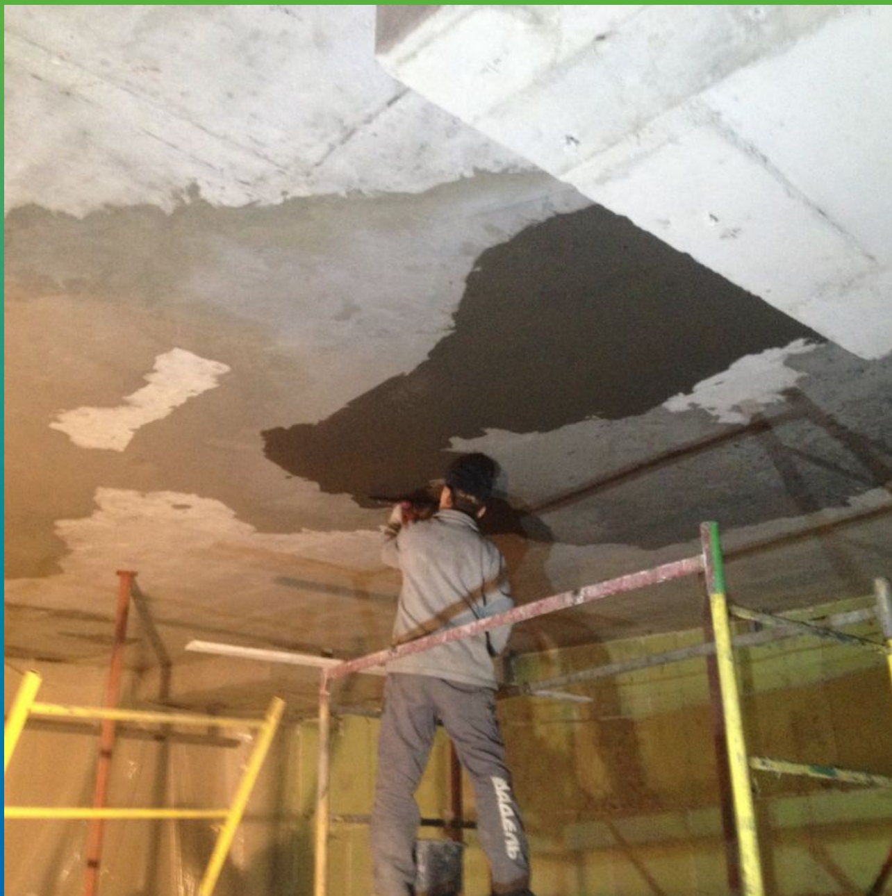
Нанесение финишного слоя ремонтного состава "Максрайт 500". Общий вид.