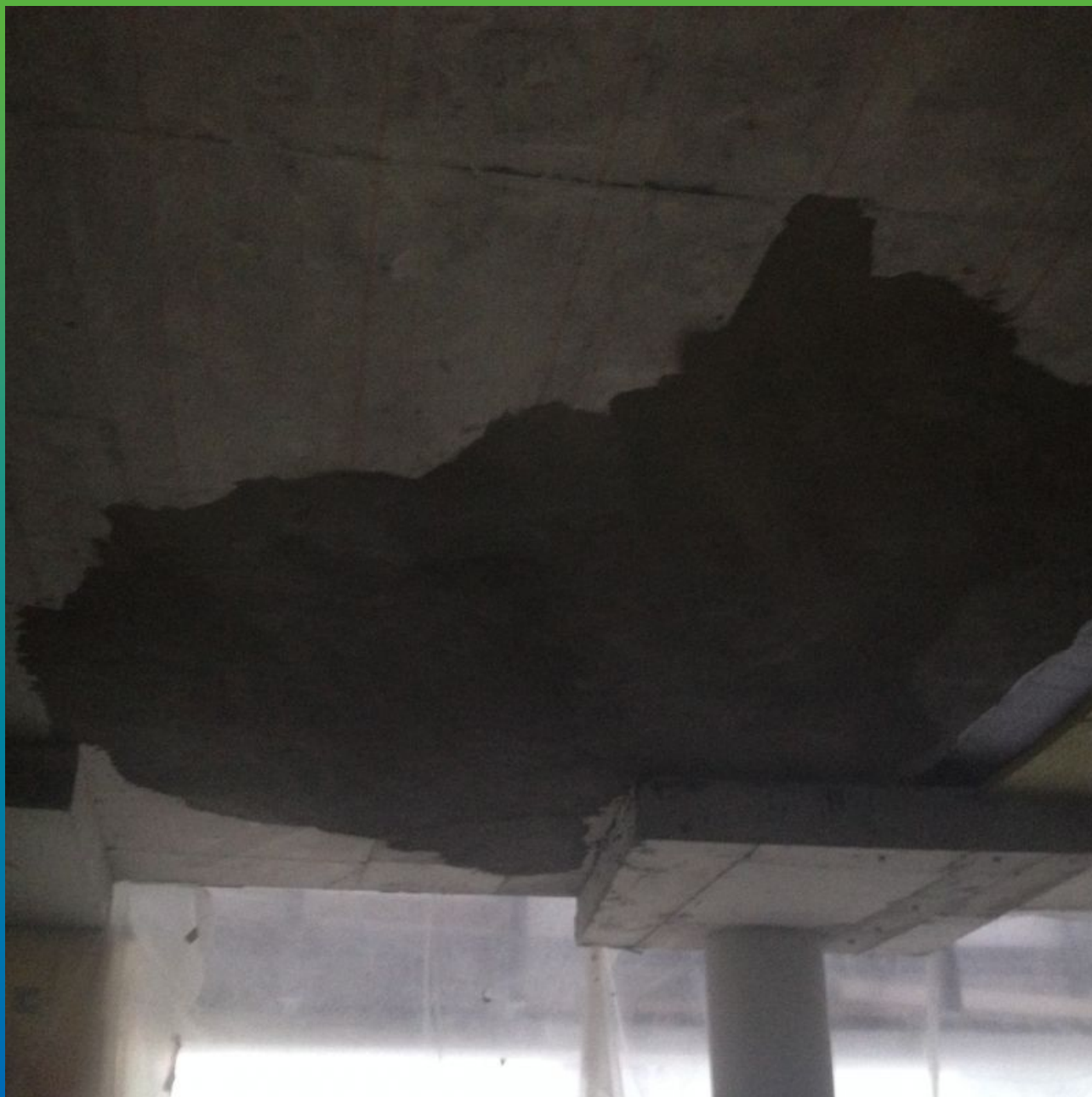
Восстановленный защитный слой ж/б плиты покрытия. Общий вид.