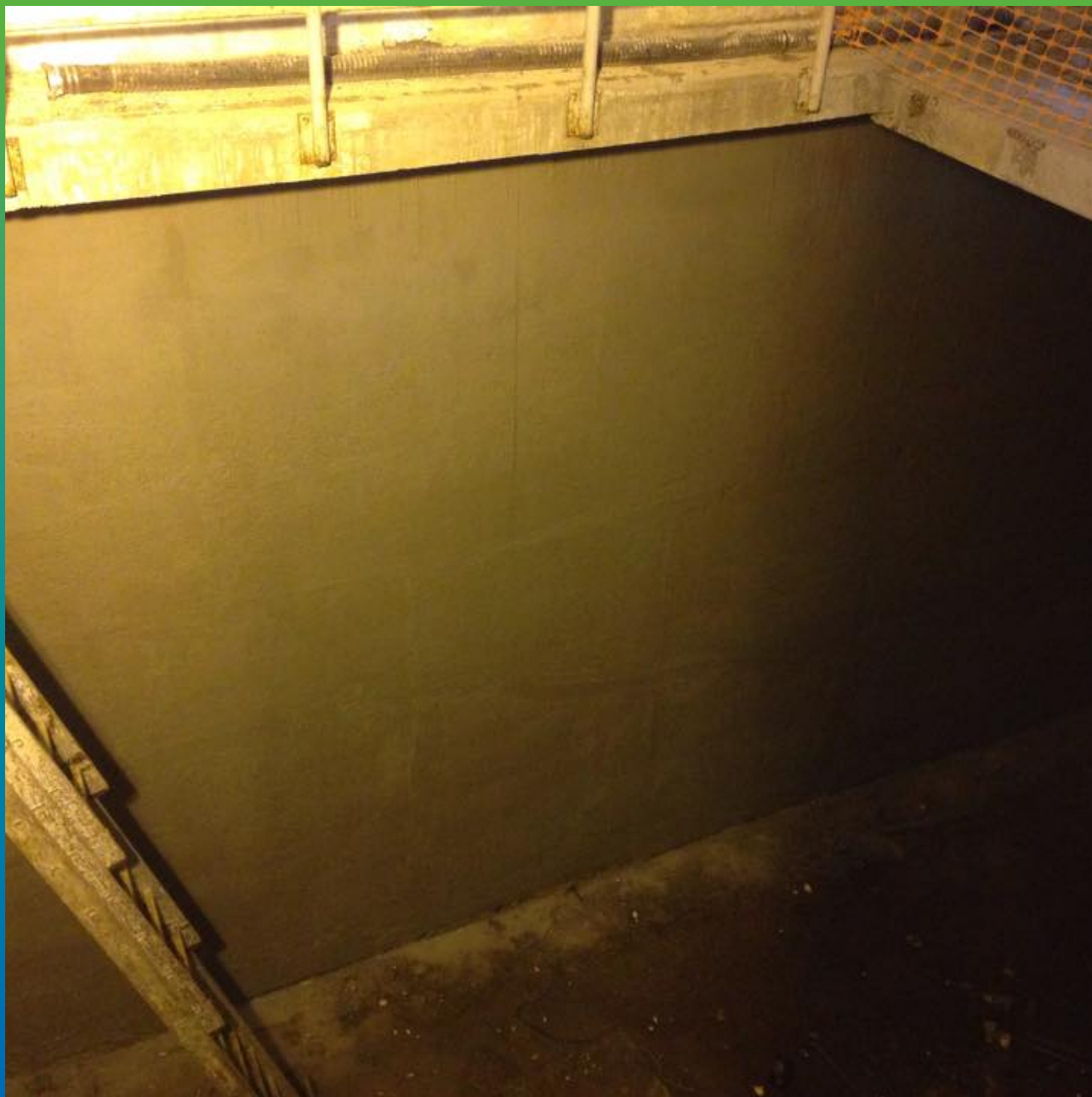
Нанесенная полимер-цементная гидроизоляция "Максил". Общий вид.