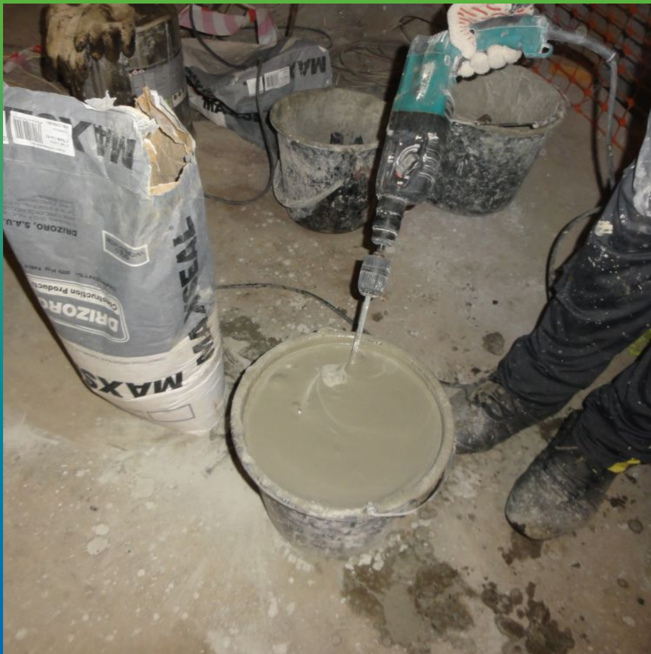
Замешивание обмазочного полимер-цементного состава "Максил" с водой.