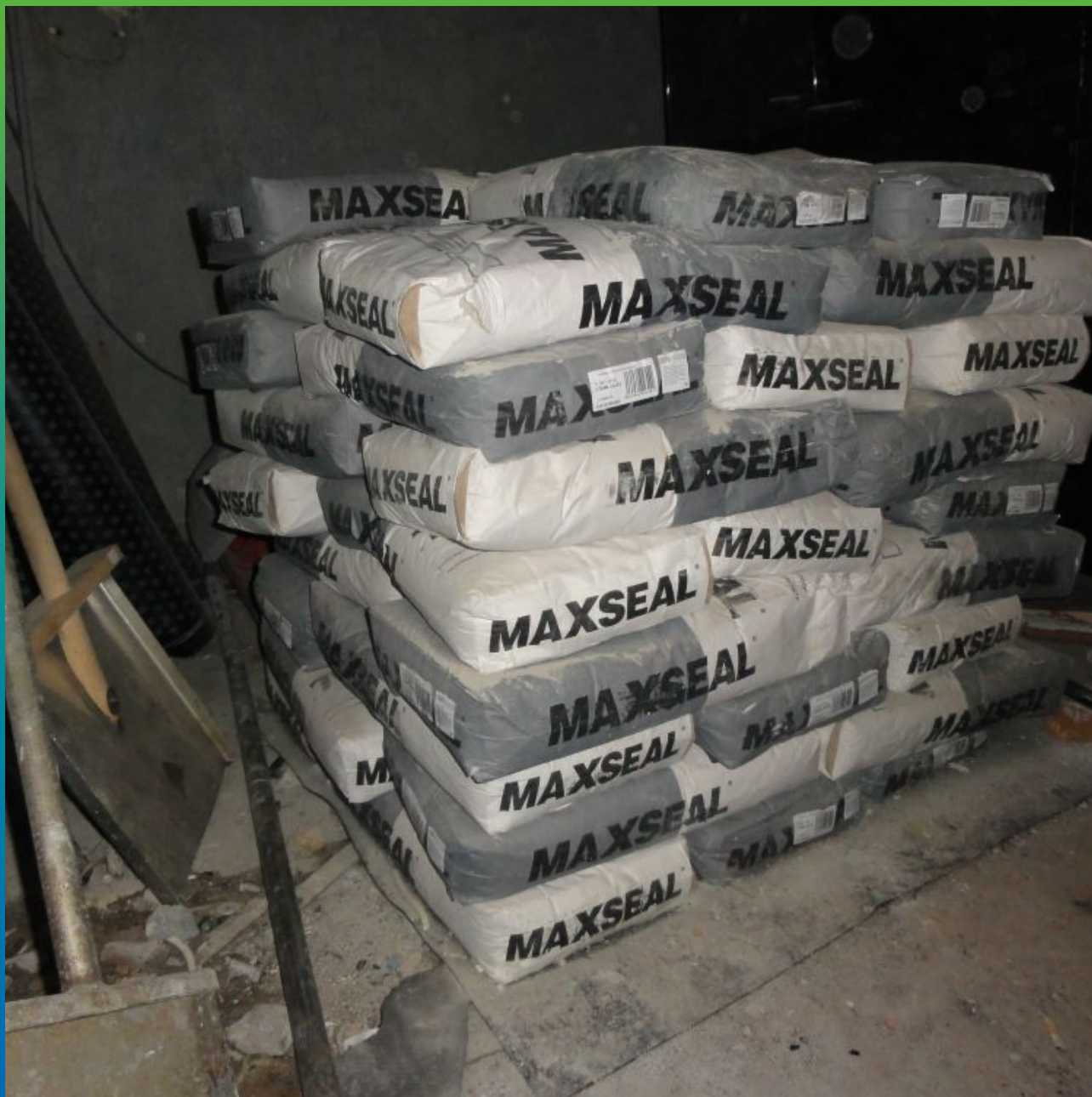
Гидроизоляционный состав "Максил" на участке.