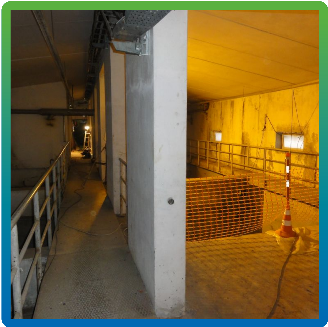
Участок до начала работ. Общий вид.