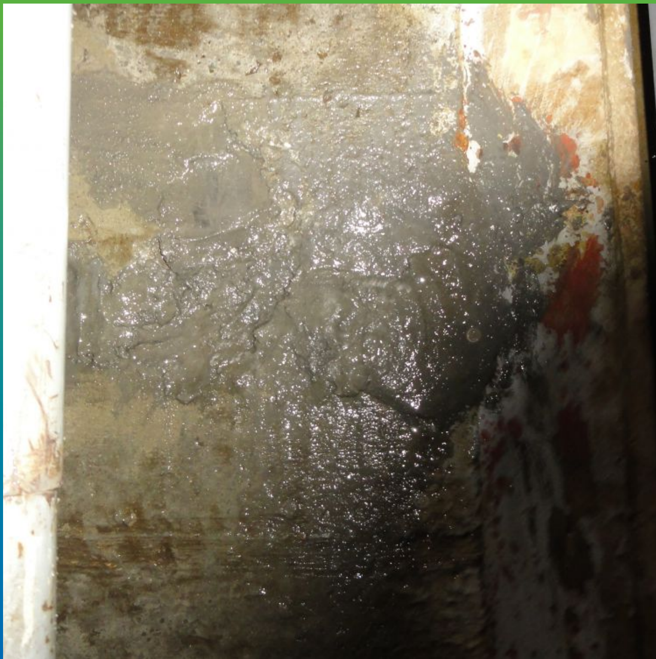
Ликвидированная течь с помощью Максплаг