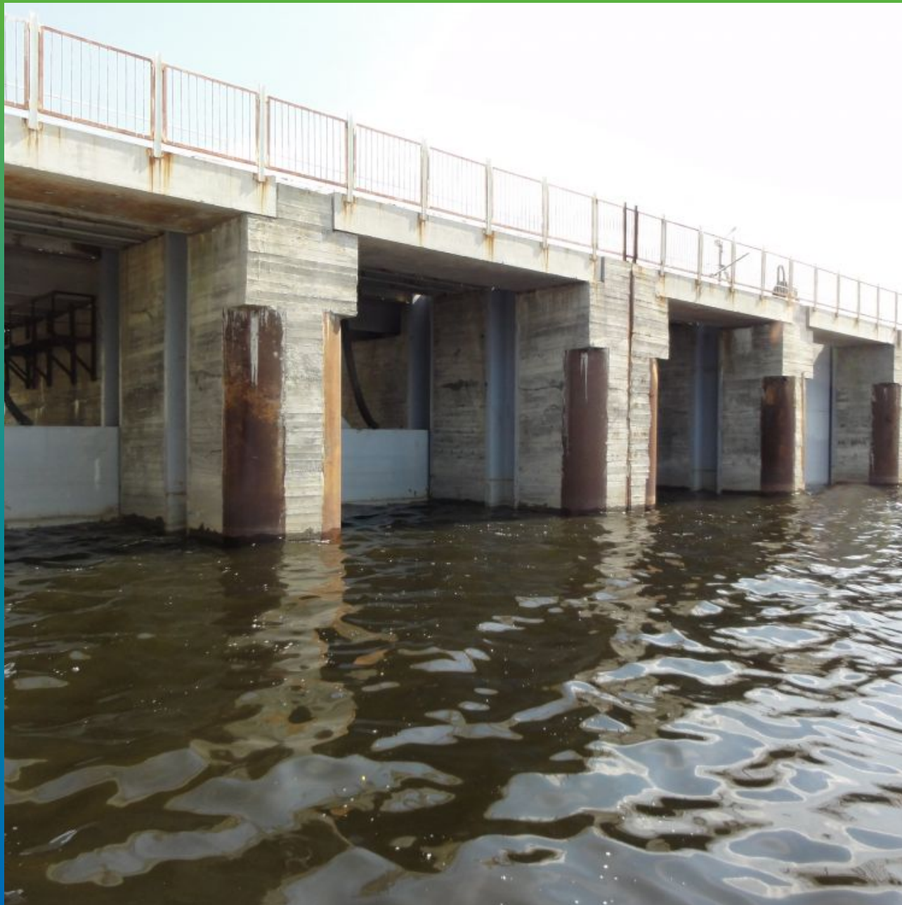
Общий вид объекта