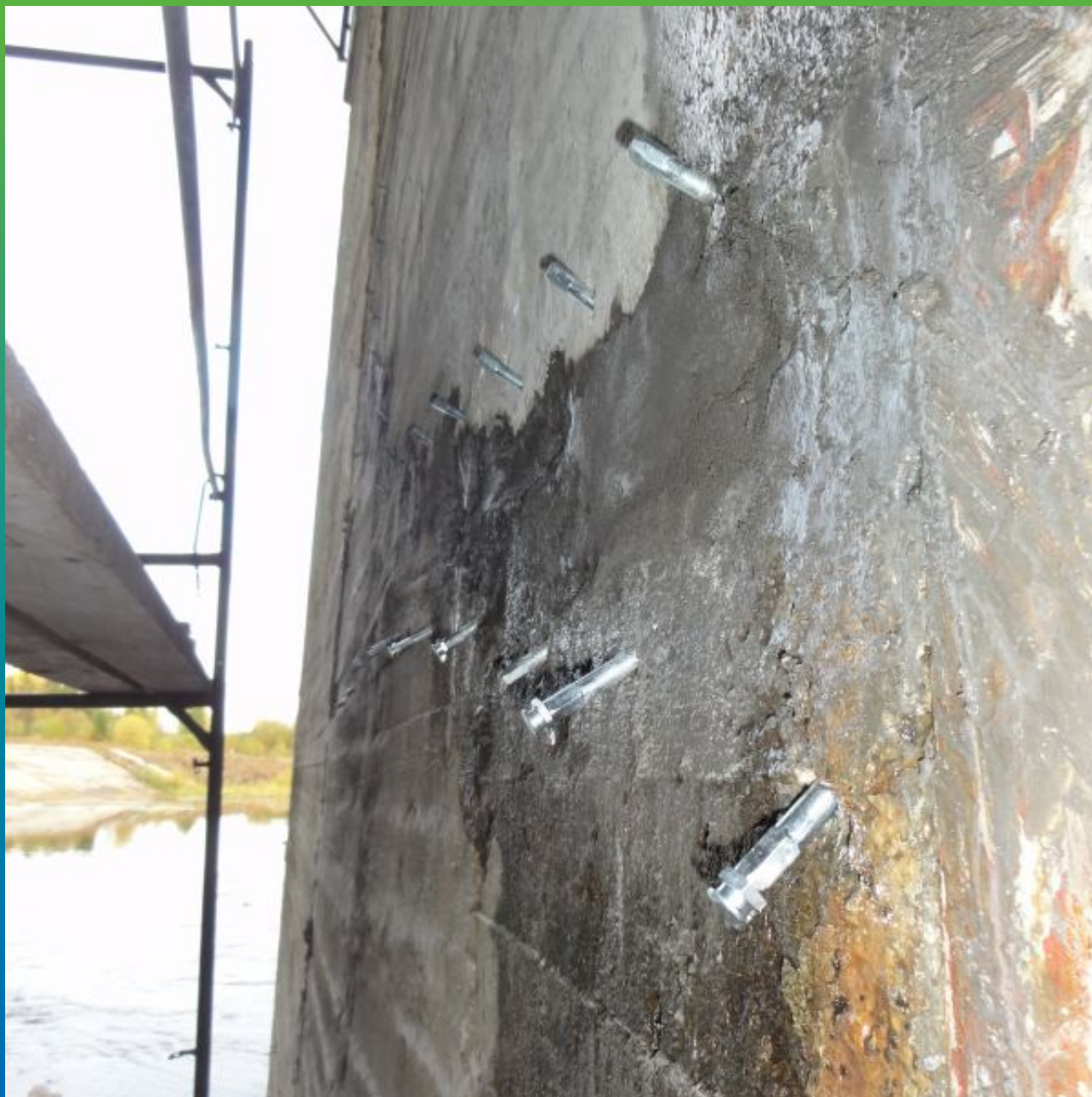
Вид установленных пакеров