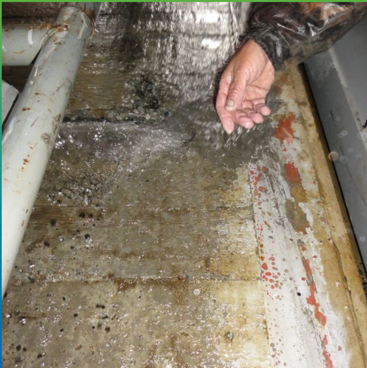
Ликвидация активной течи с помощью Максплаг