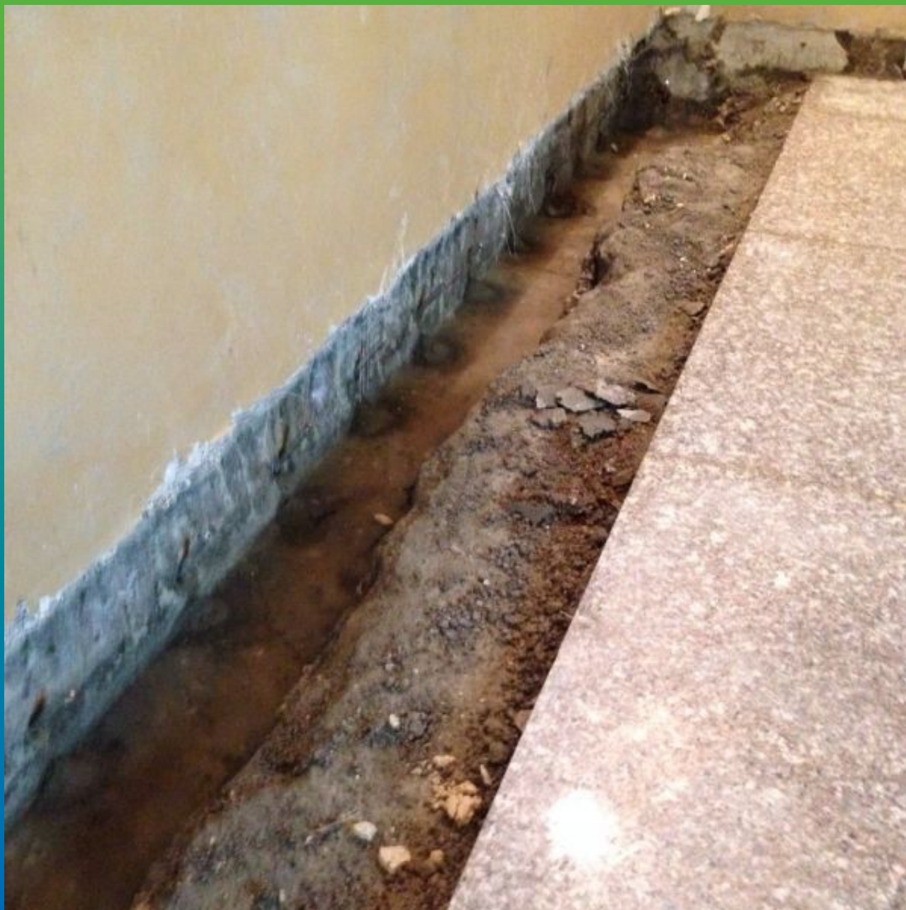
Подготовка поверхности для выполнения работ