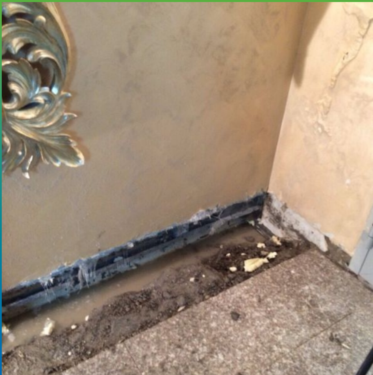
Вскрытие проблемного участка