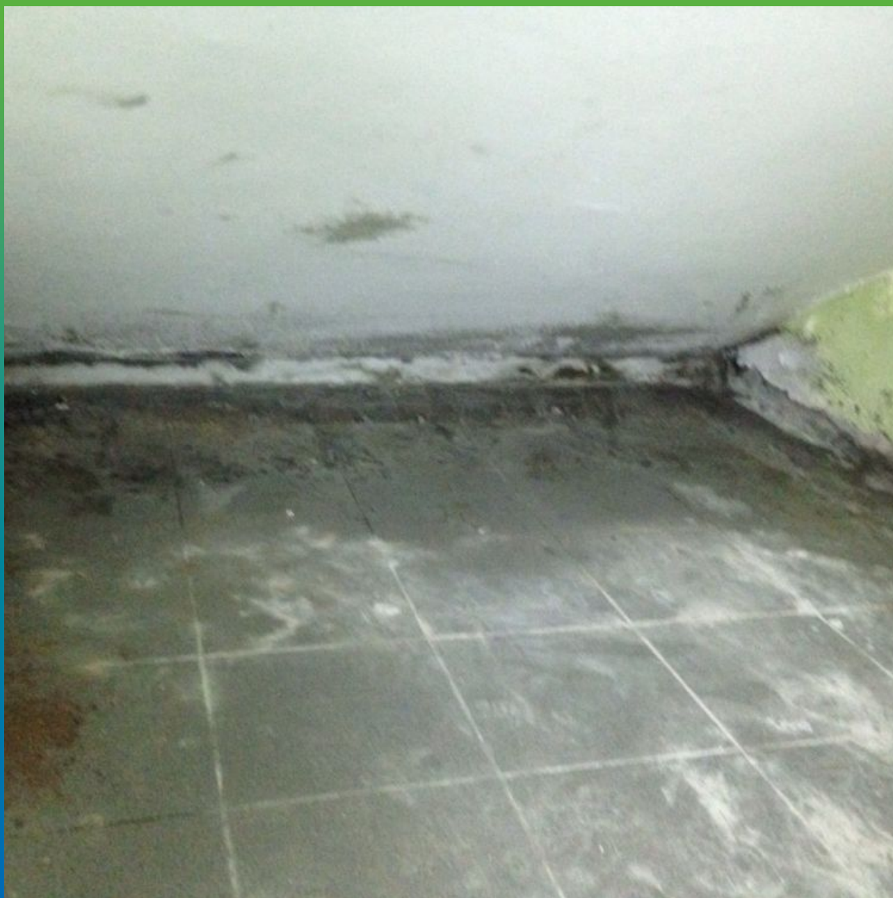
Вода из под лестничного марша