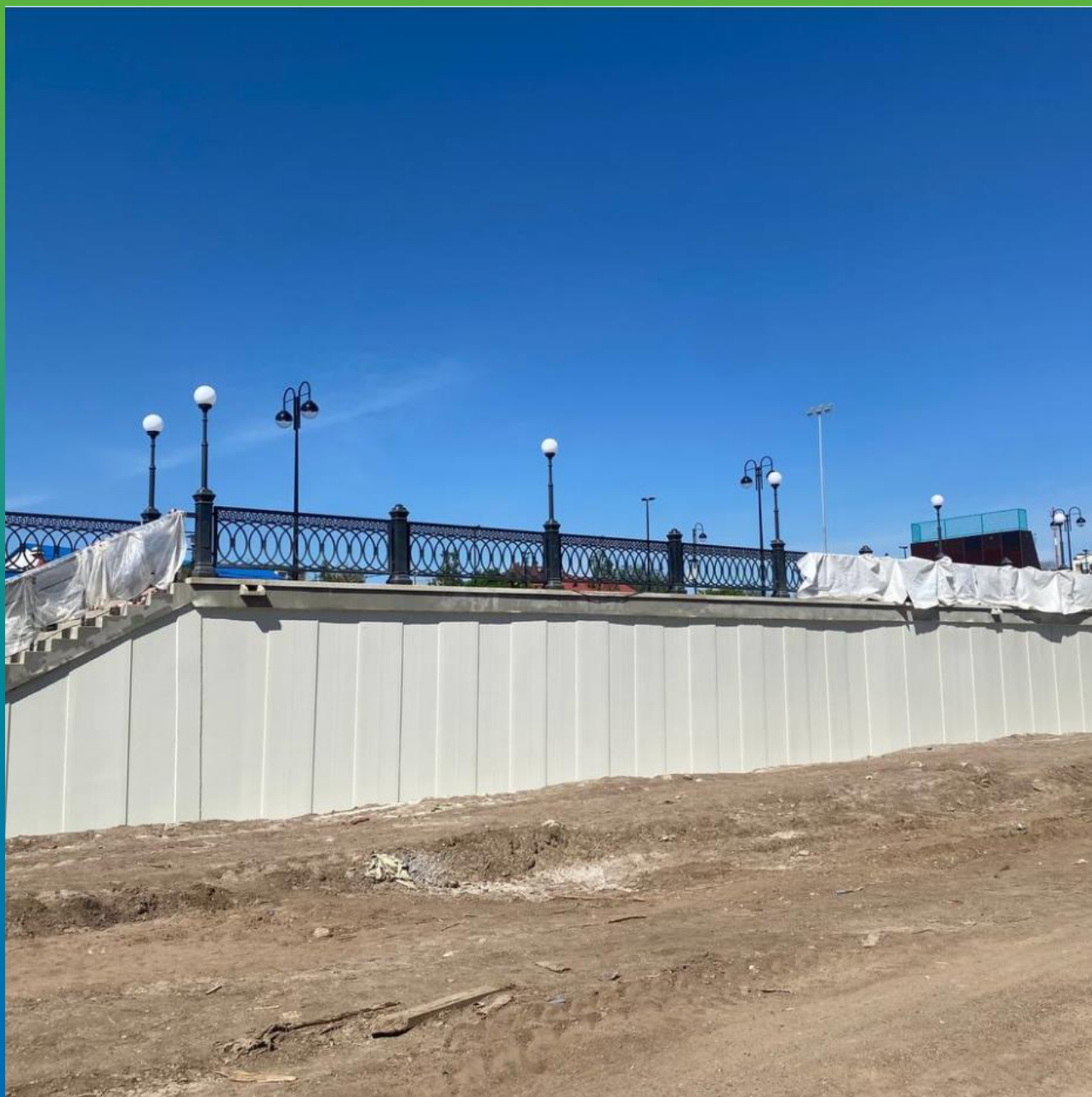
Общий вид системы АКЗ ДенСтоп ПУ 116 + ДенСтоп ЭП 217 + ДенСтоп ПУ 302