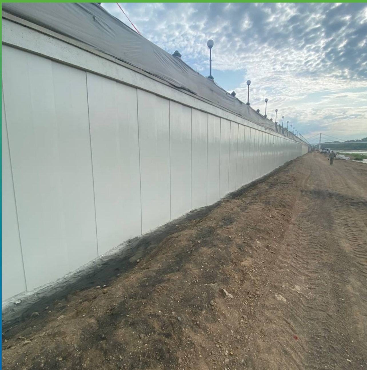
Общий вид системы АКЗ ДенсТоп ПУ 116 + ДенсТоп ЭП 217 + ДенсТоп ПУ 302