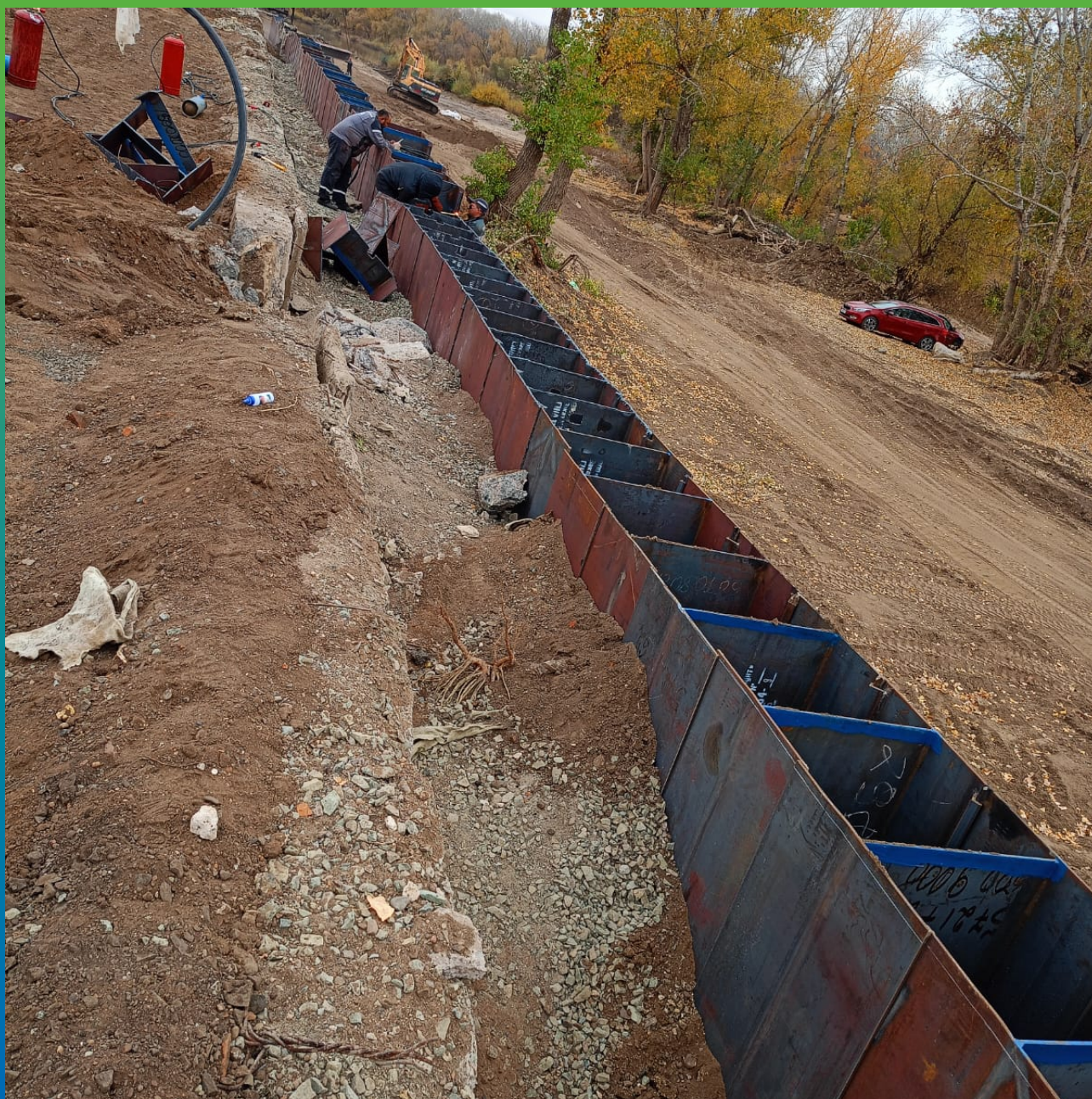
Укрепление набережной реки Шпунтом Ларсена