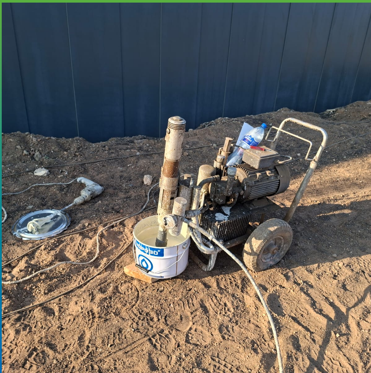
Подготовка оборудования для нанесения грунтовки ДенТоп ЭП 116