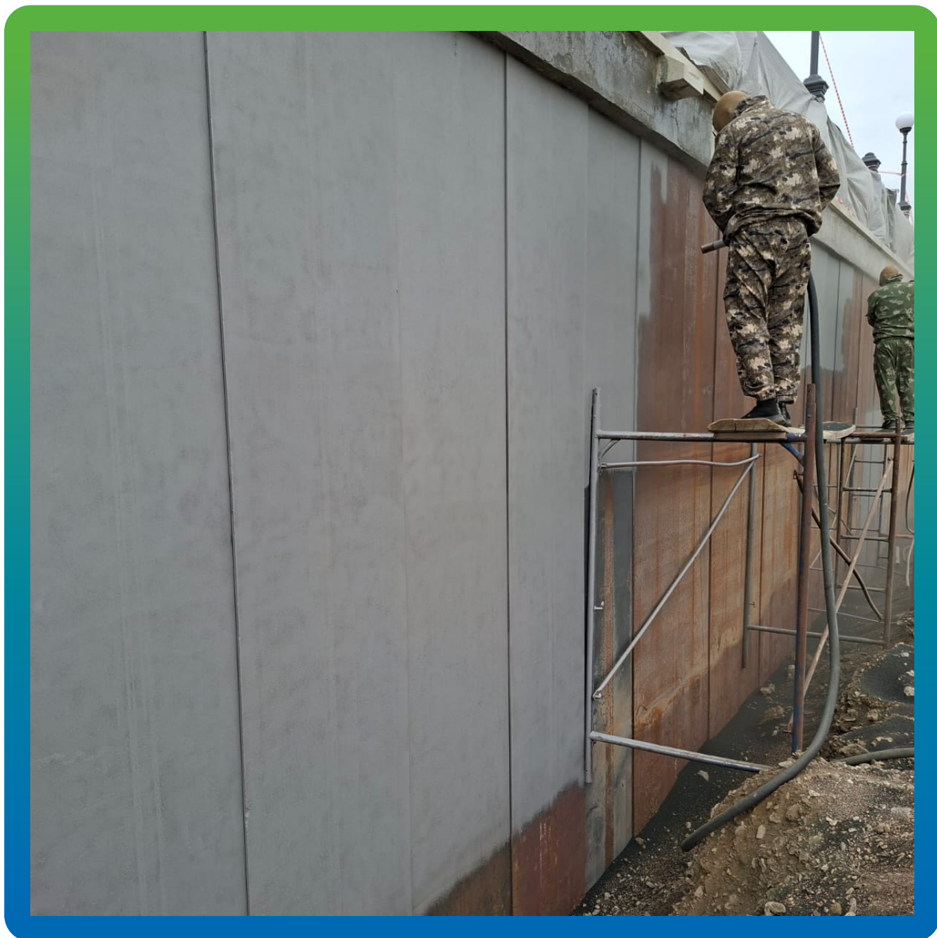
Механическая обработка Шпунта Ларсена