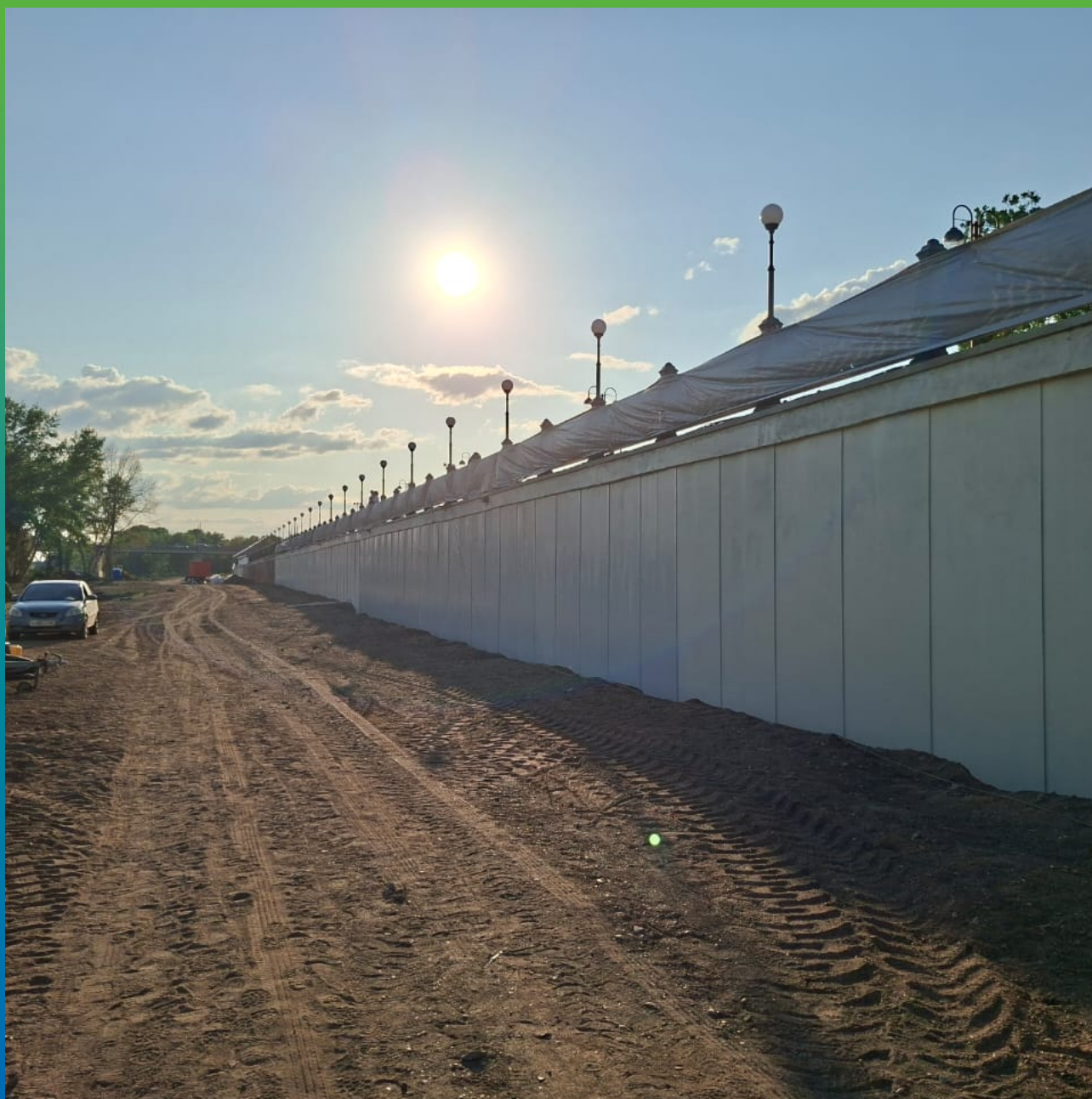
Участок с нанесенной системой АКЗ ДенсТоп ПУ 116 + ДенсТоп ЭП 217 + ДенсТоп ПУ 302