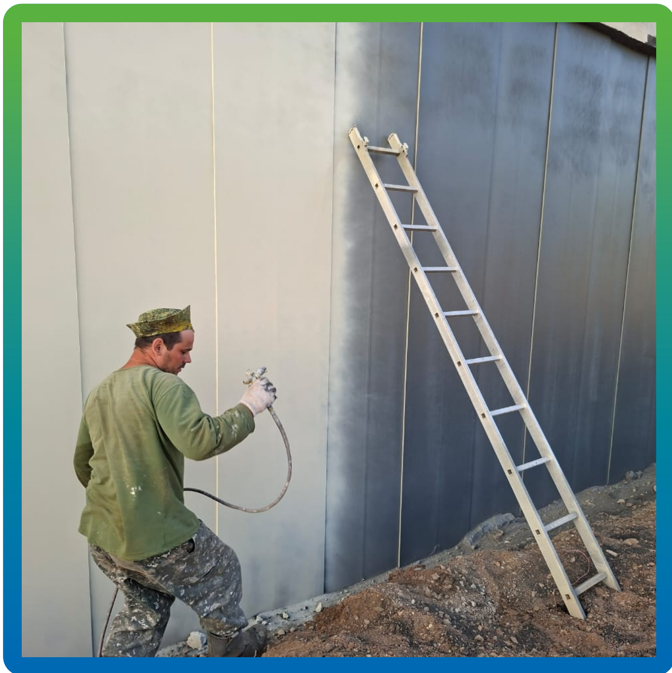
Нанесение промежуточного слоя ДенсТоп ЭП 217