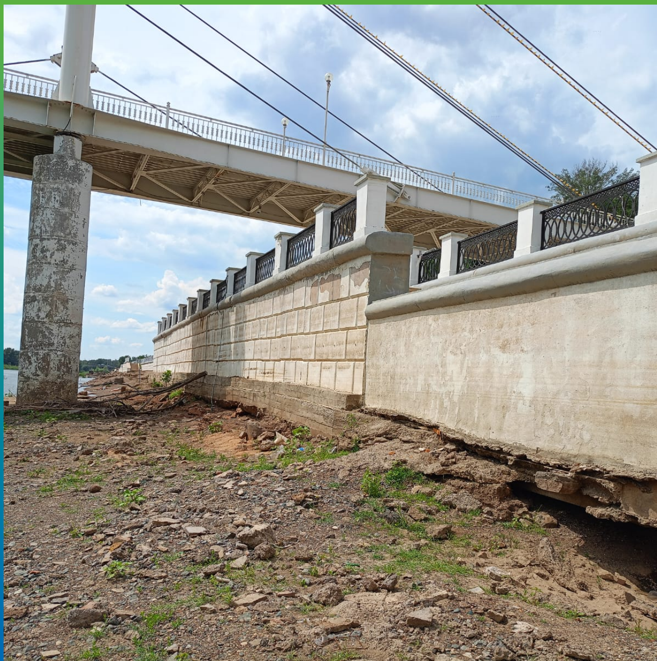
Набережная до момента реконструкции