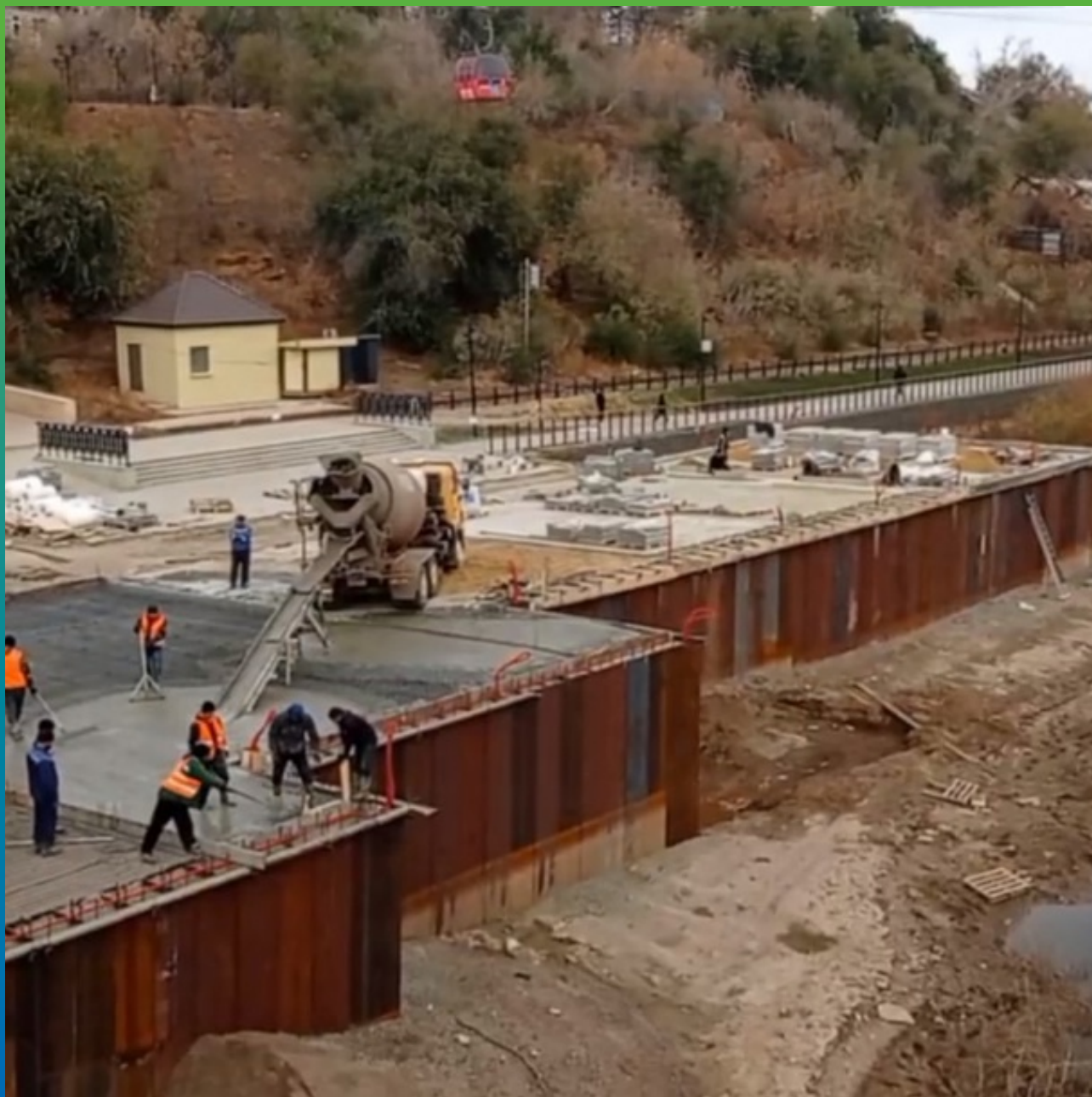
Укрепление набережной реки Шпунтом Ларсена