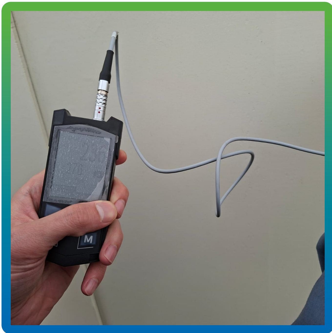
Замеры толщины покрытия системы АКЗ ДенсТоп ПУ 116 + ДенсТоп ЭП 217 + ДенсТоп ПУ 302