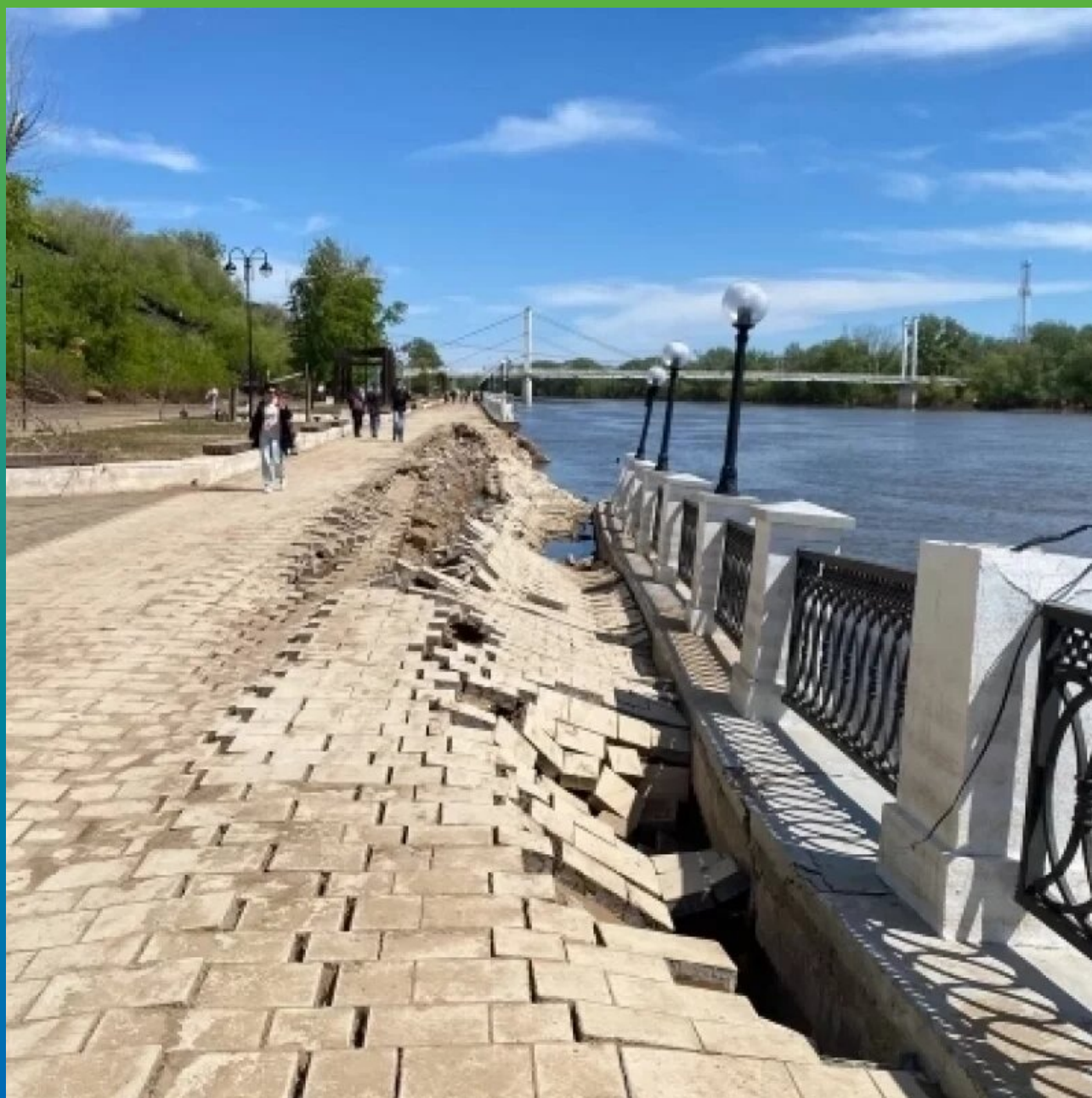
Набережная до момента реконструкции