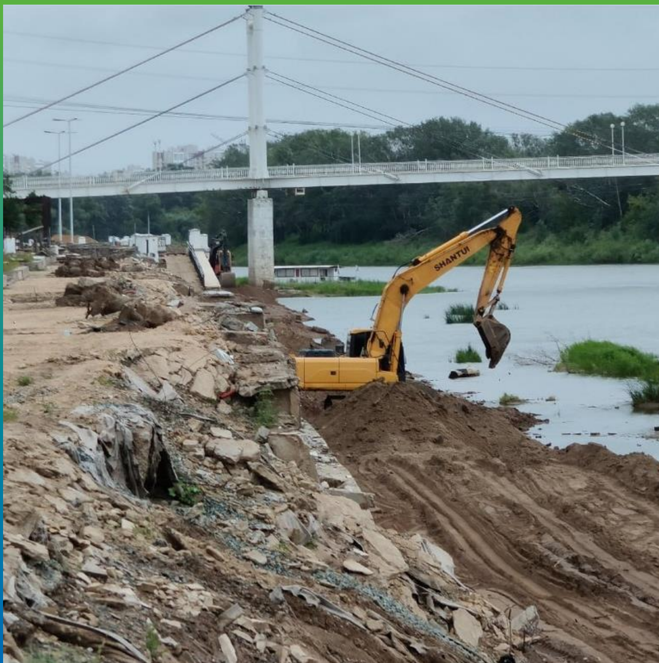
Демонтажные работы набережной