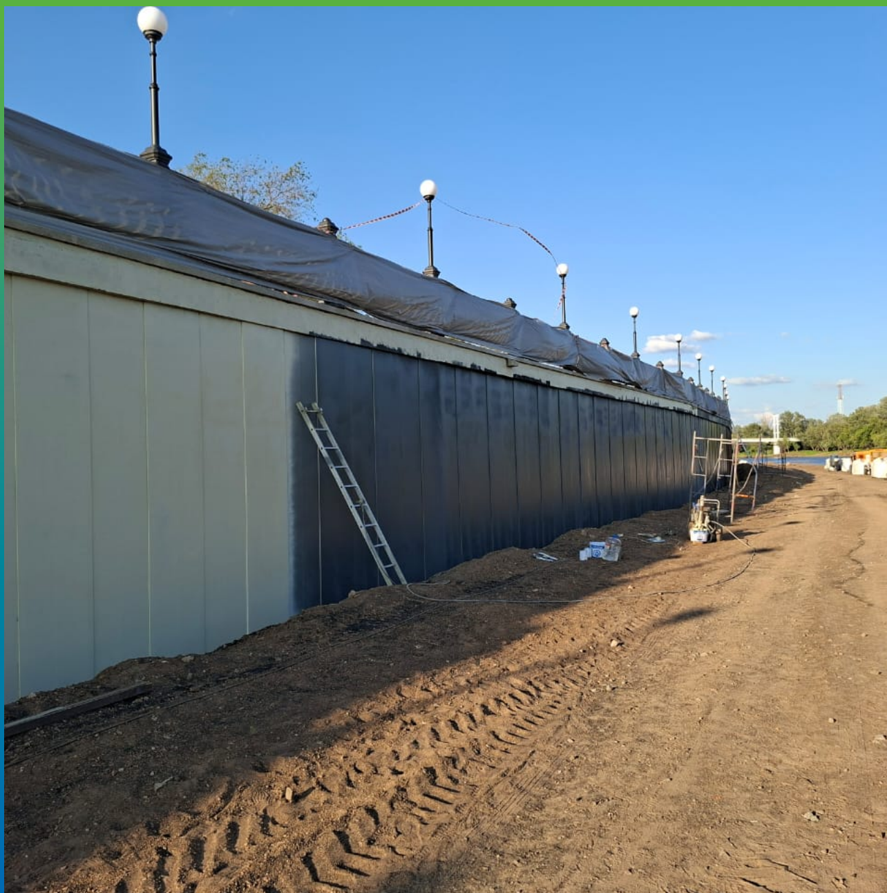
Участок с нанесенной системой АКЗ ДенсТоп ПУ 116 + ДенсТоп ЭП 217 + ДенсТоп ПУ 302