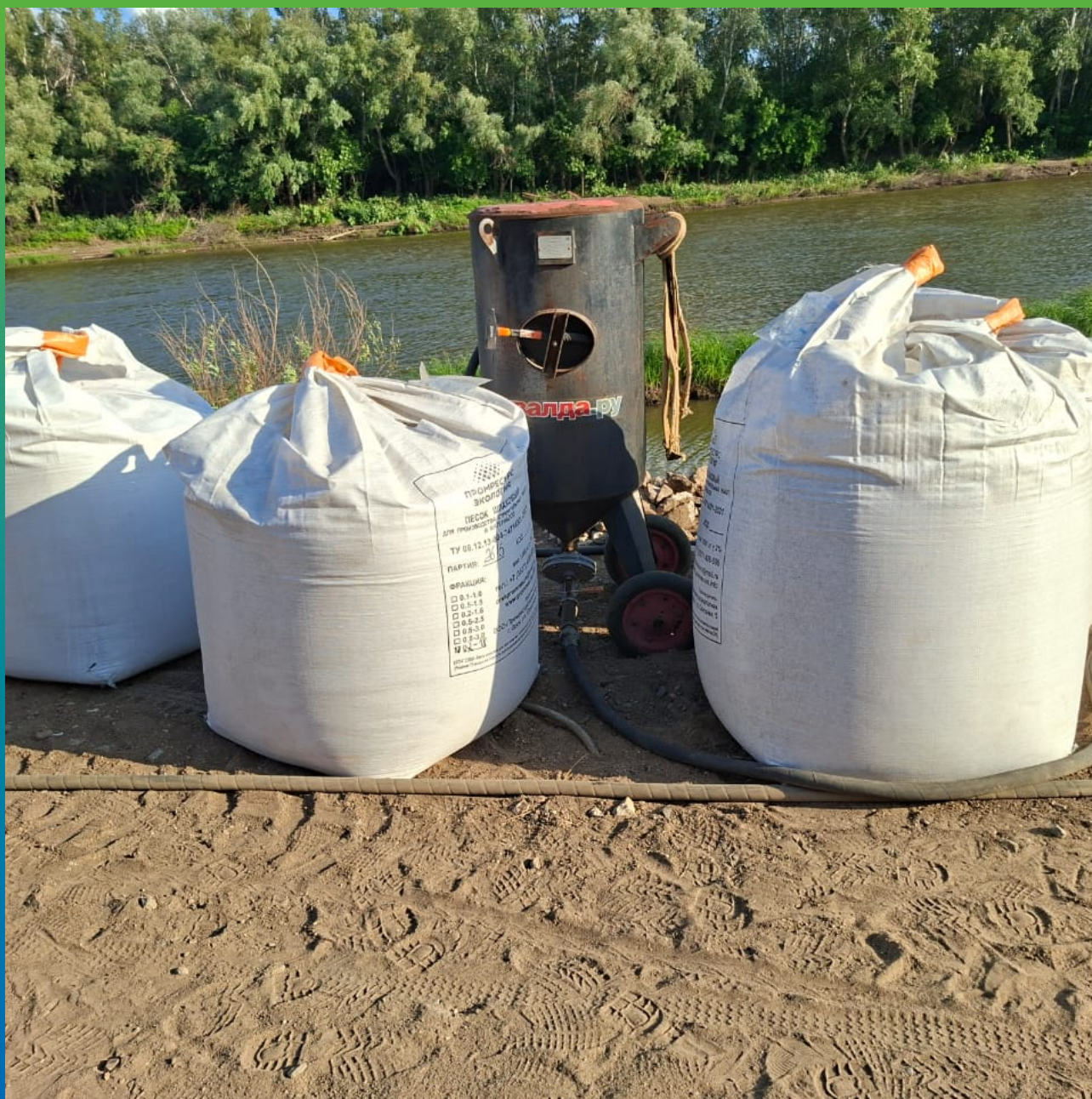
Купершлак для механической обработки металлических поверхностей набережной