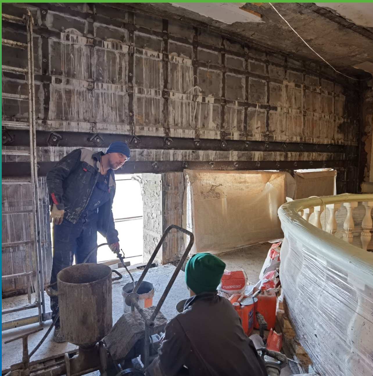
Установка пакеров БМ 2830 и подготовка насоса к работам по инъектированию