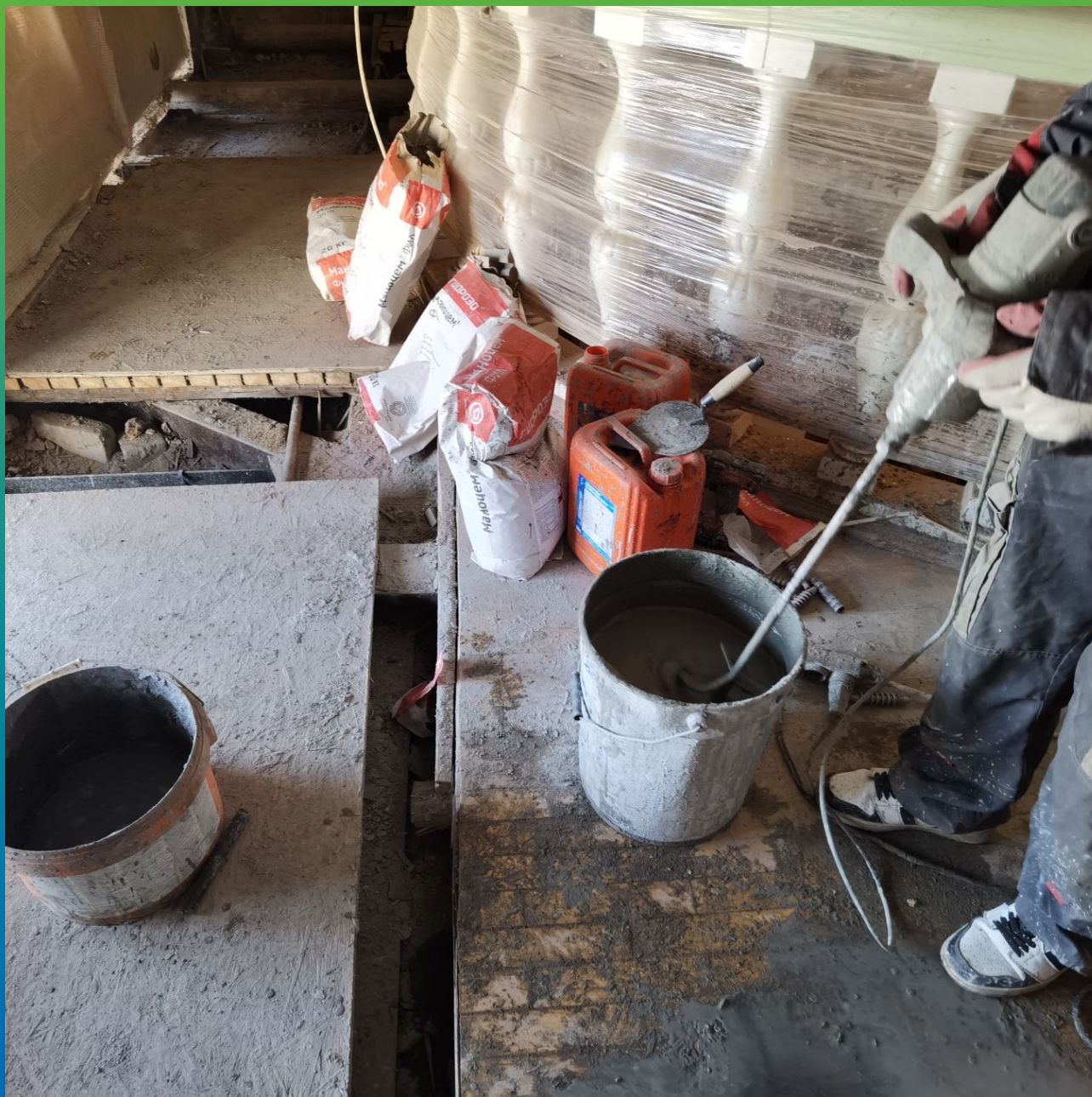
Затворение с водой инъекционного состава Манцем Фил