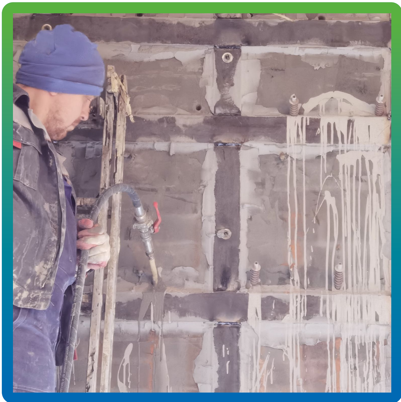
Заполнение пустот и усиление кирпичной кладки составом Маноцем Фил