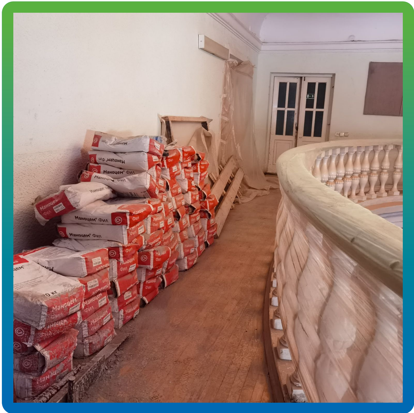
Материалы производства "Гидрозо" на объекте