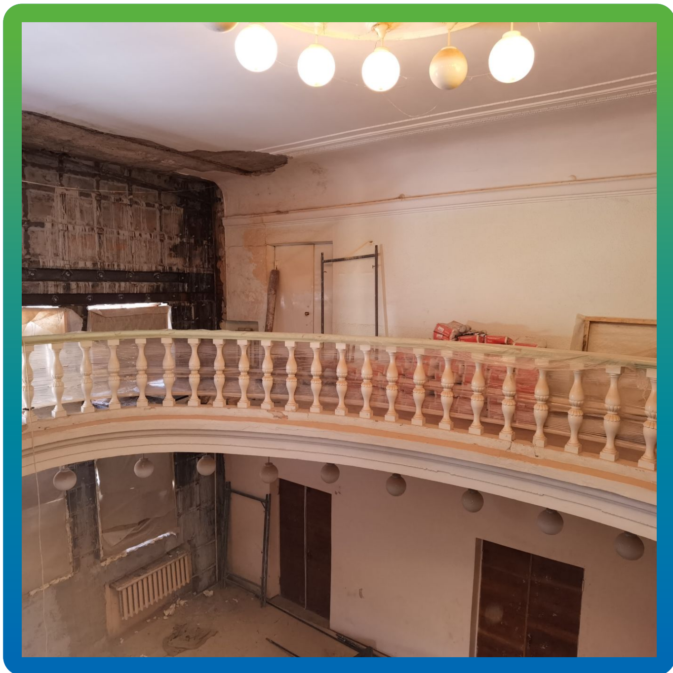
Вид объекта после работ по заполнению пустот и усилению кладки