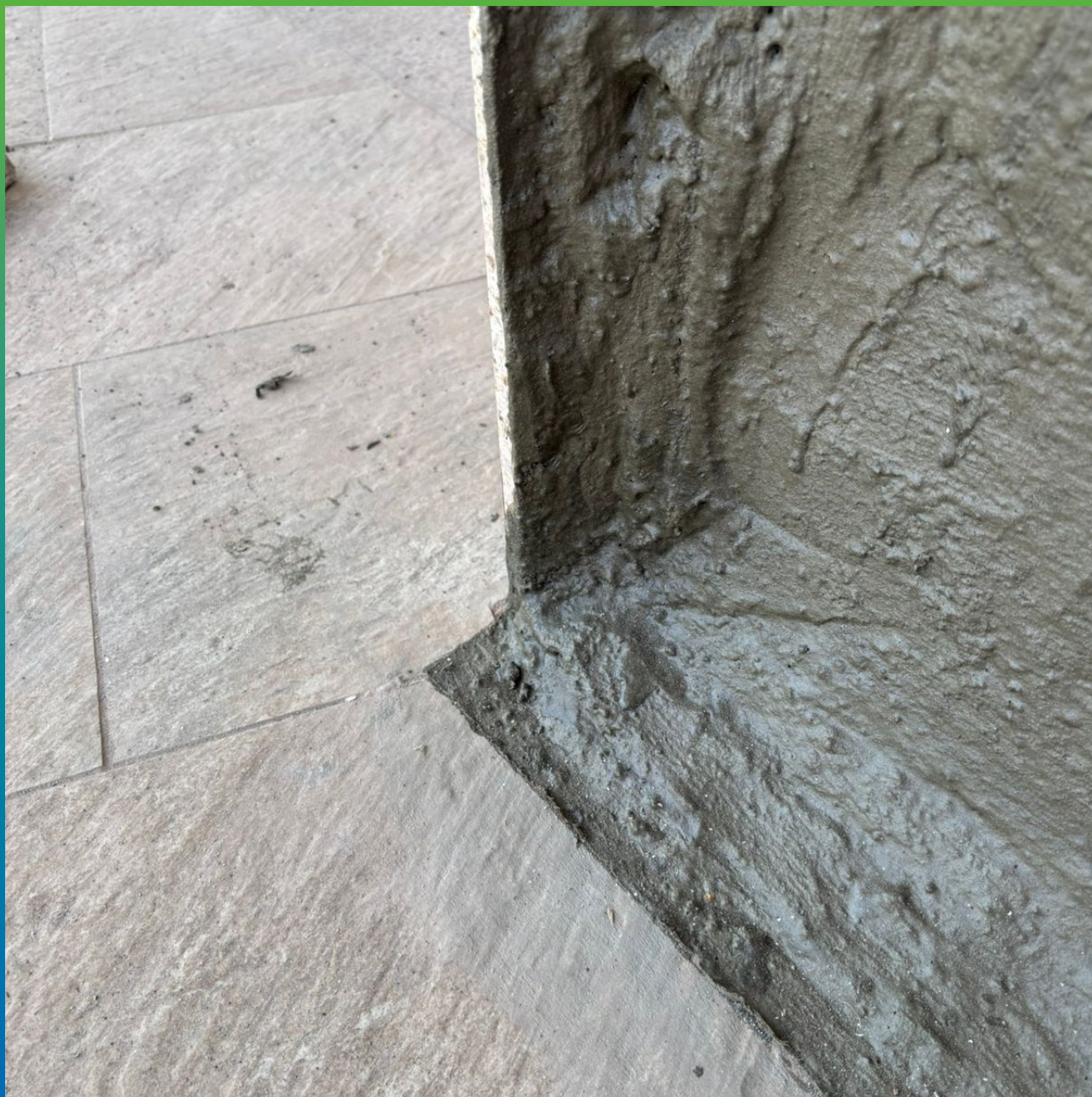
Стармекс Эласт, нанесенный на оштукатуренную поверхность