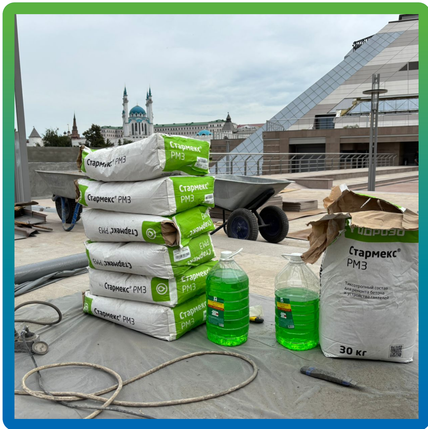
Материал Стармекс РМЗ на объекте