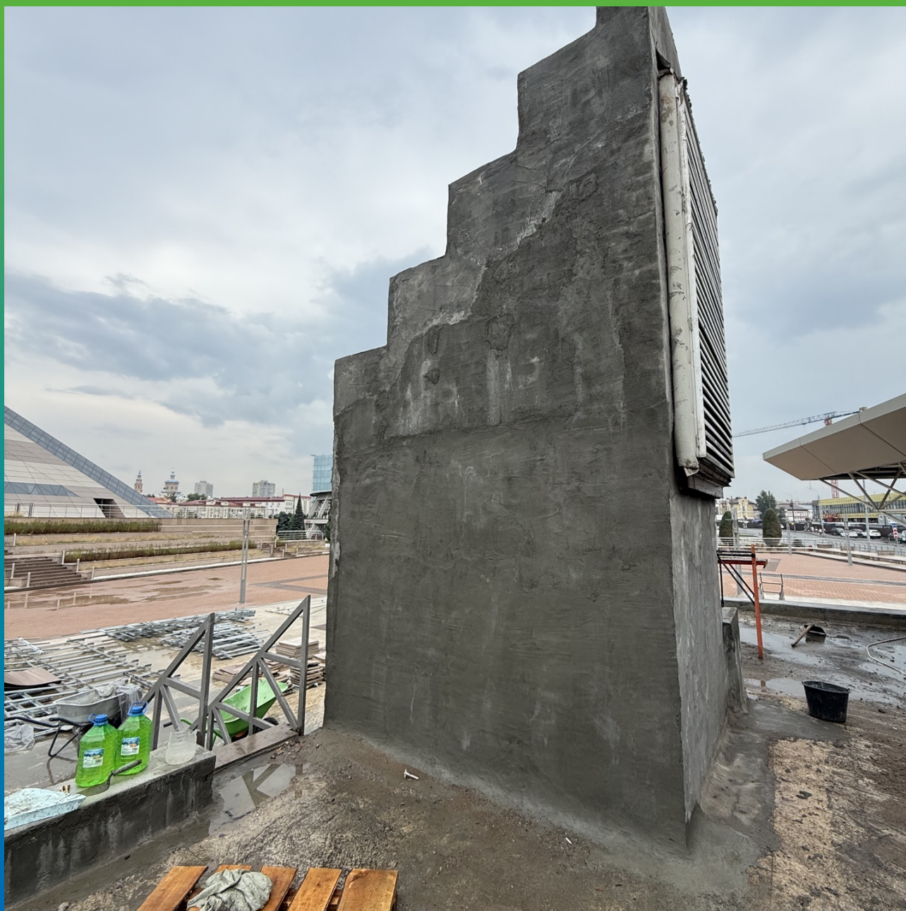
Шахта, оштукатуренная составом Стармекс РМЗ