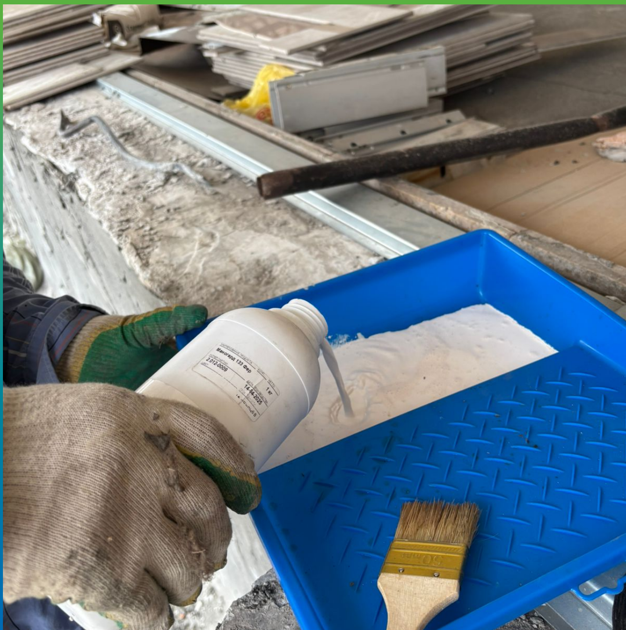
Применение Маногард 133 Фер