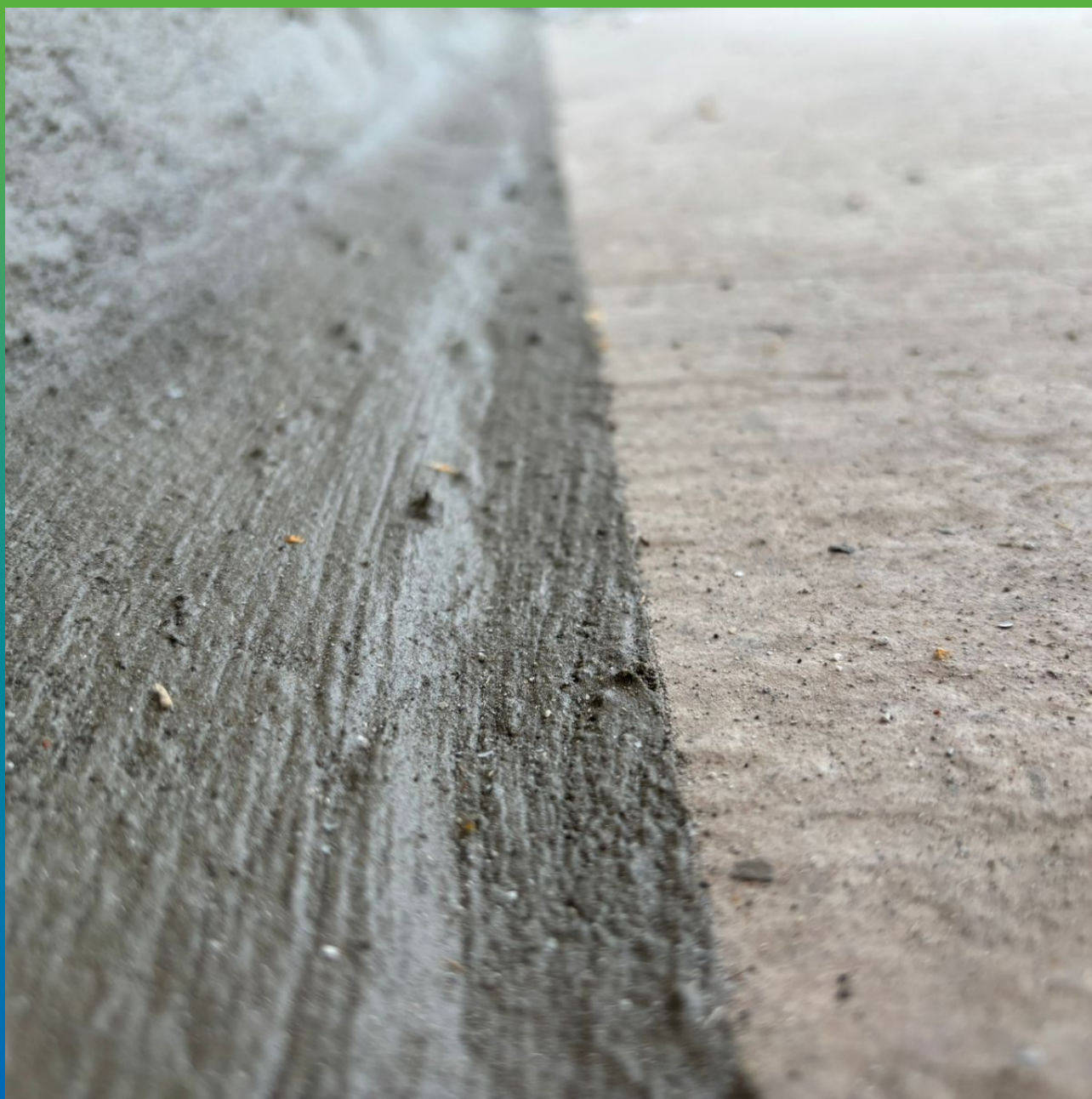
Галтель из Стармекс РМЗ с нанесенным Стармекс Эласт