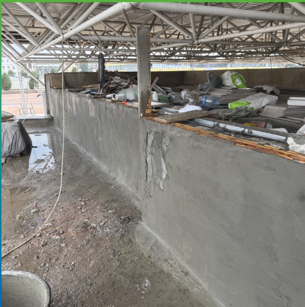
Парапет, оштукатуренный составом Стармекс РМЗ