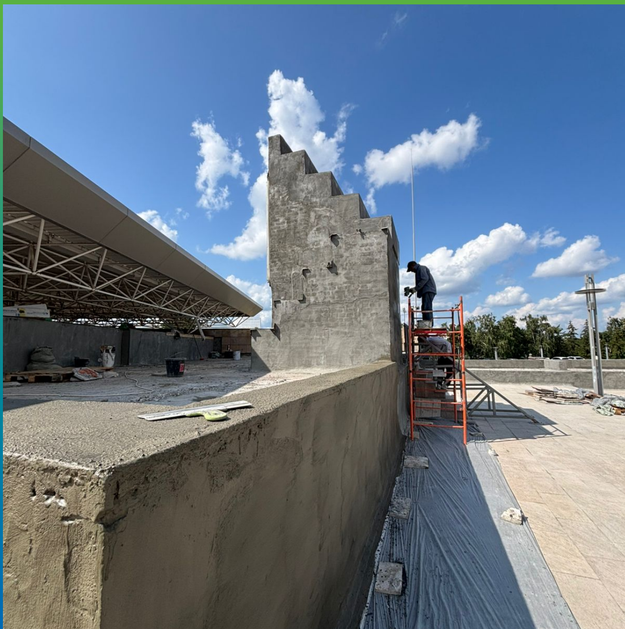
Работы по нанесению Стармекс Эласт