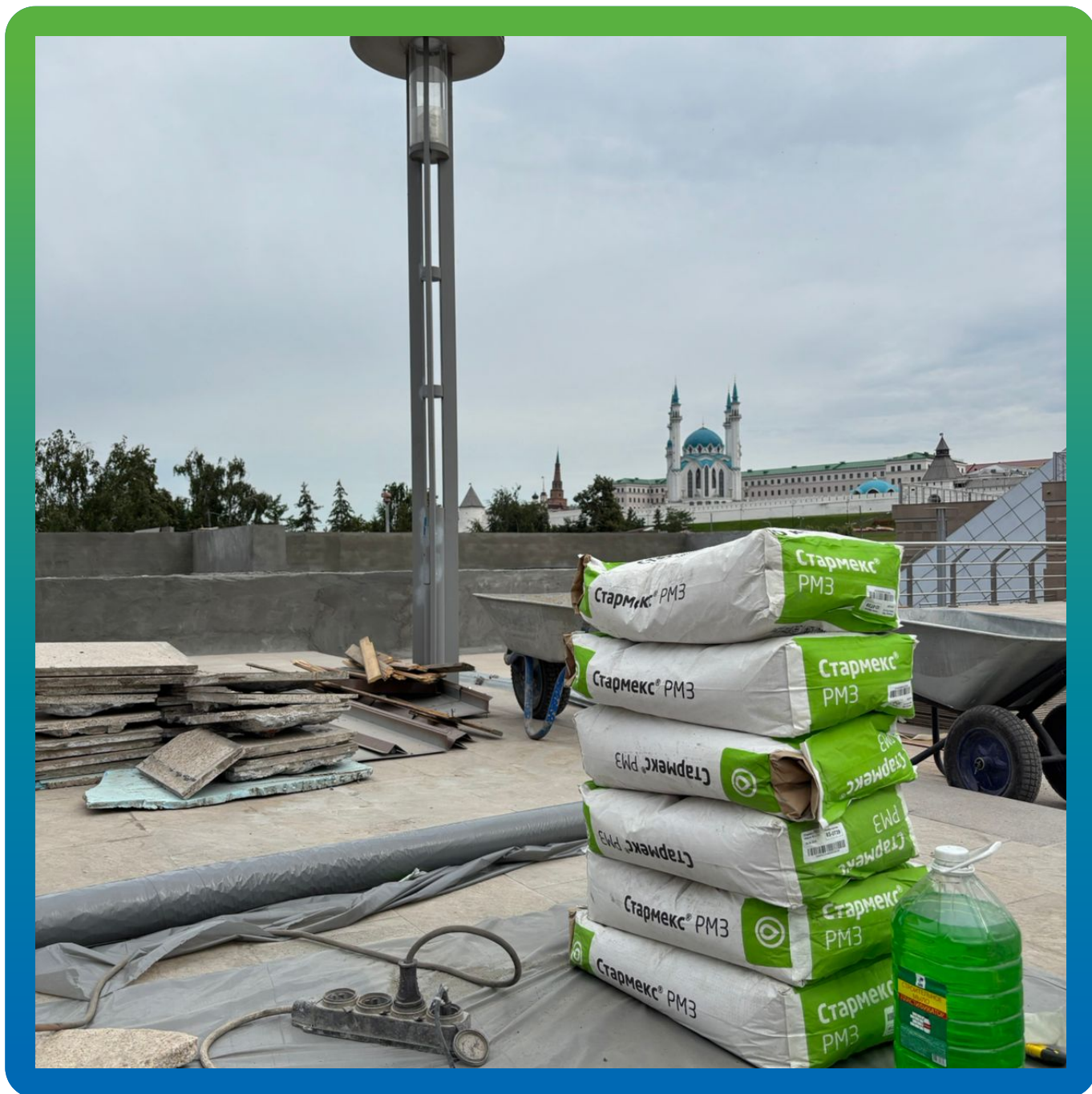
Материал Стармекс РМЗ на объекте