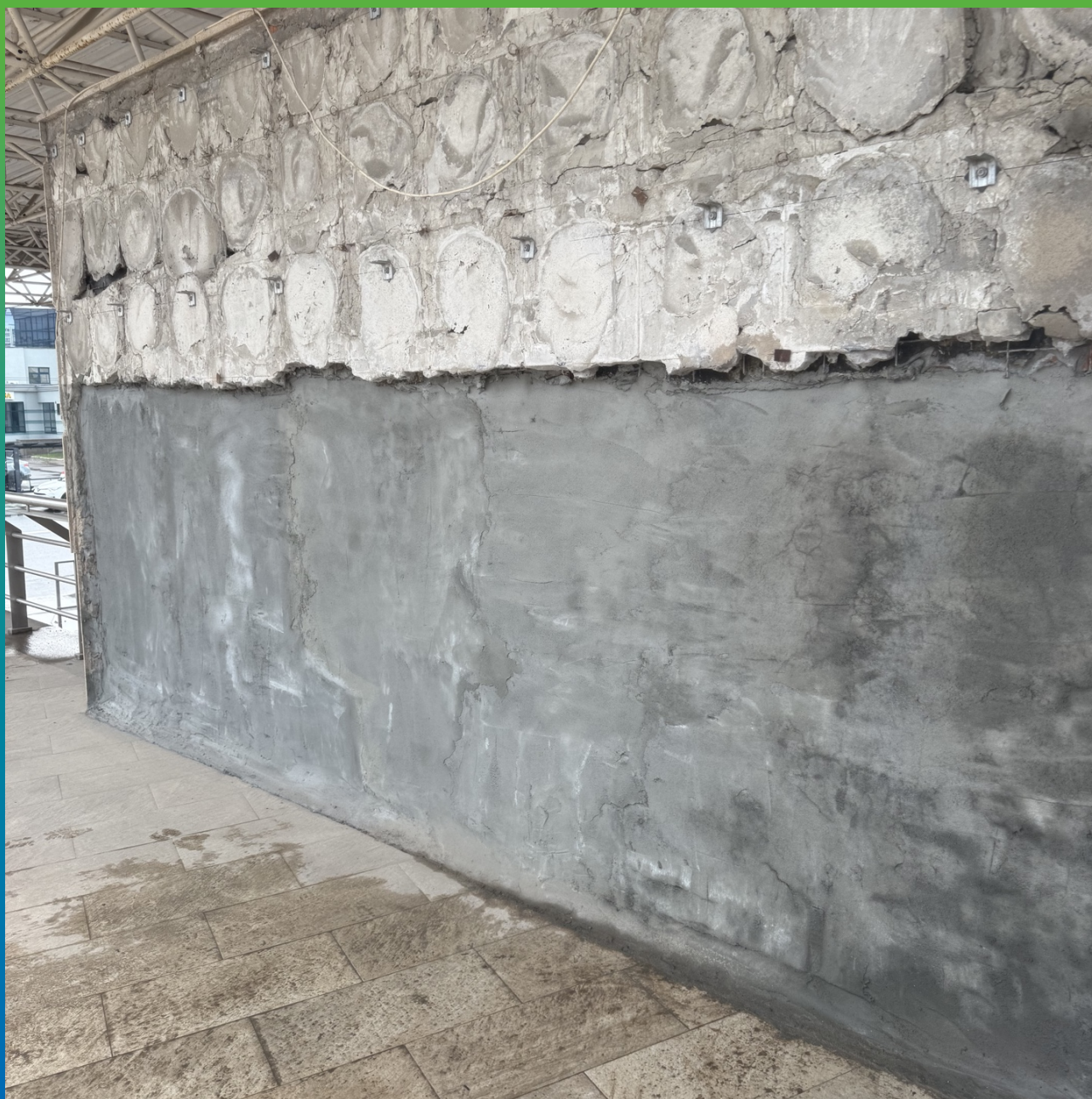
Стенка, оштукатуренная составом Стармекс РМЗ