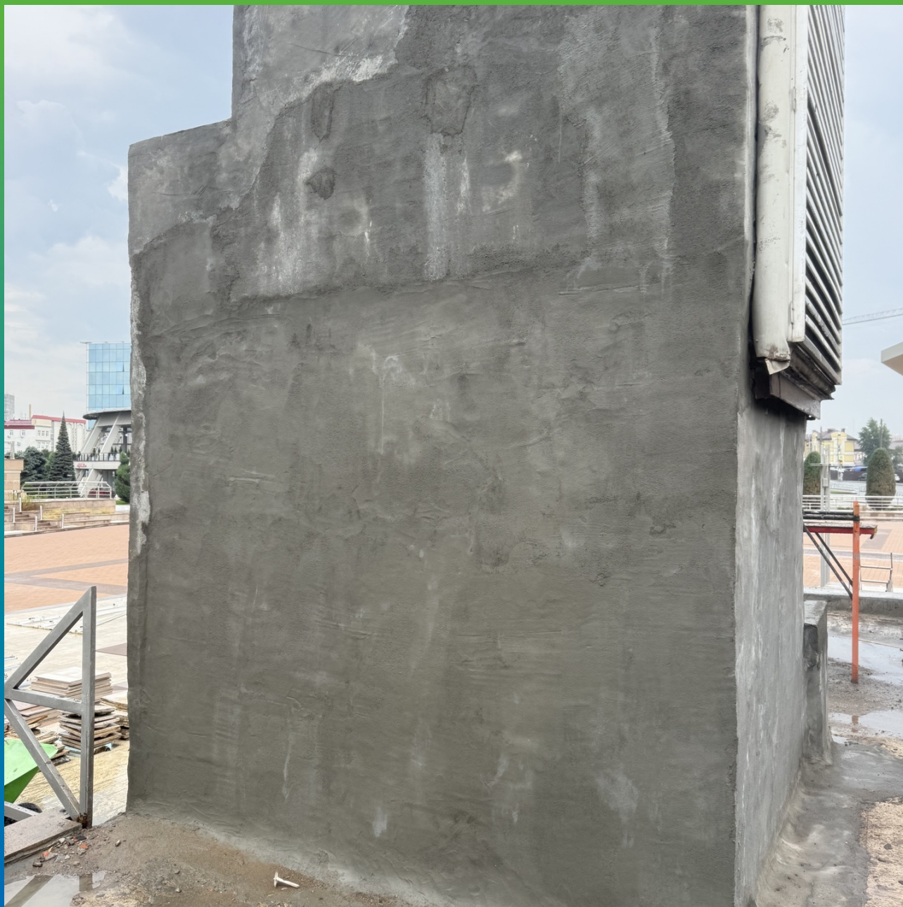
Шахта, оштукатуренная составом Стармекс РМЗ