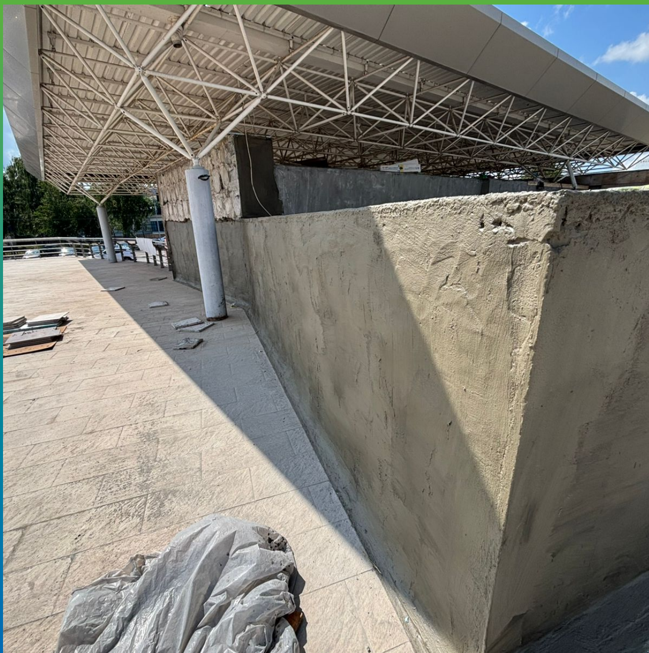
Стармекс Эласт, нанесенный на оштукатуренную поверхность