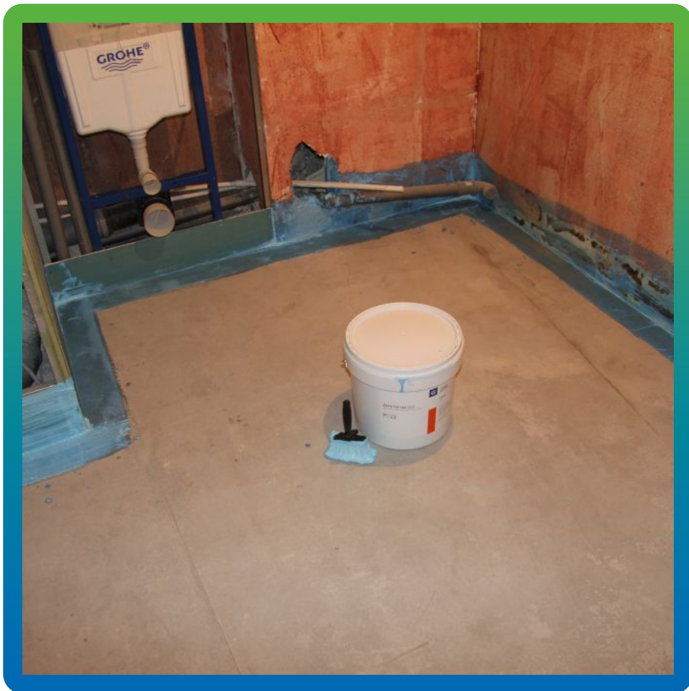
Примыкания «пол-стена» обработанные 20% грунтовочным составом ДенсТоп АК 221.