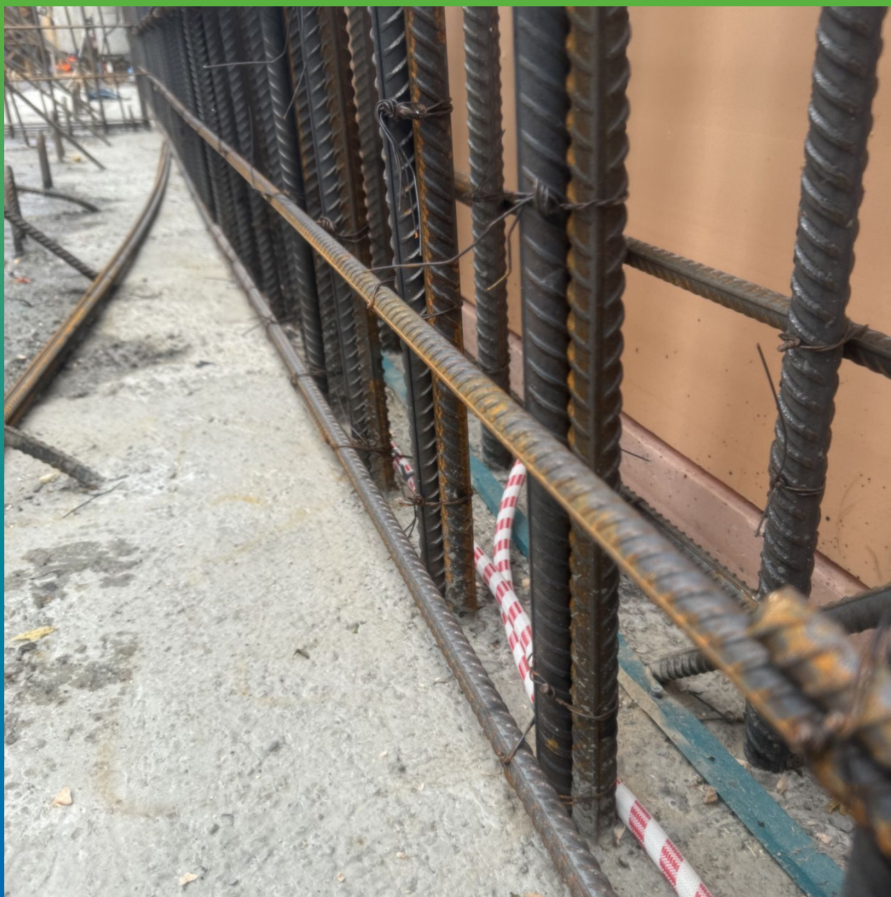
Инжпайп и Манодил Свелл, смонтированные в шов