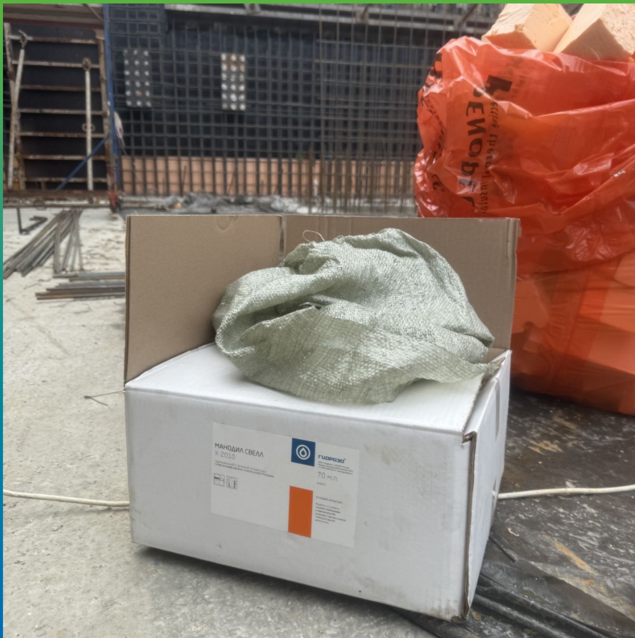
Гидрофильный профиль для швов - Мандил Свелл X2010