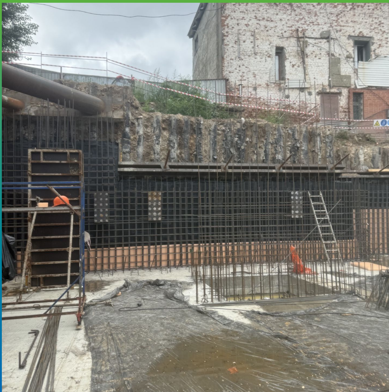
Армокаркас будущих стен