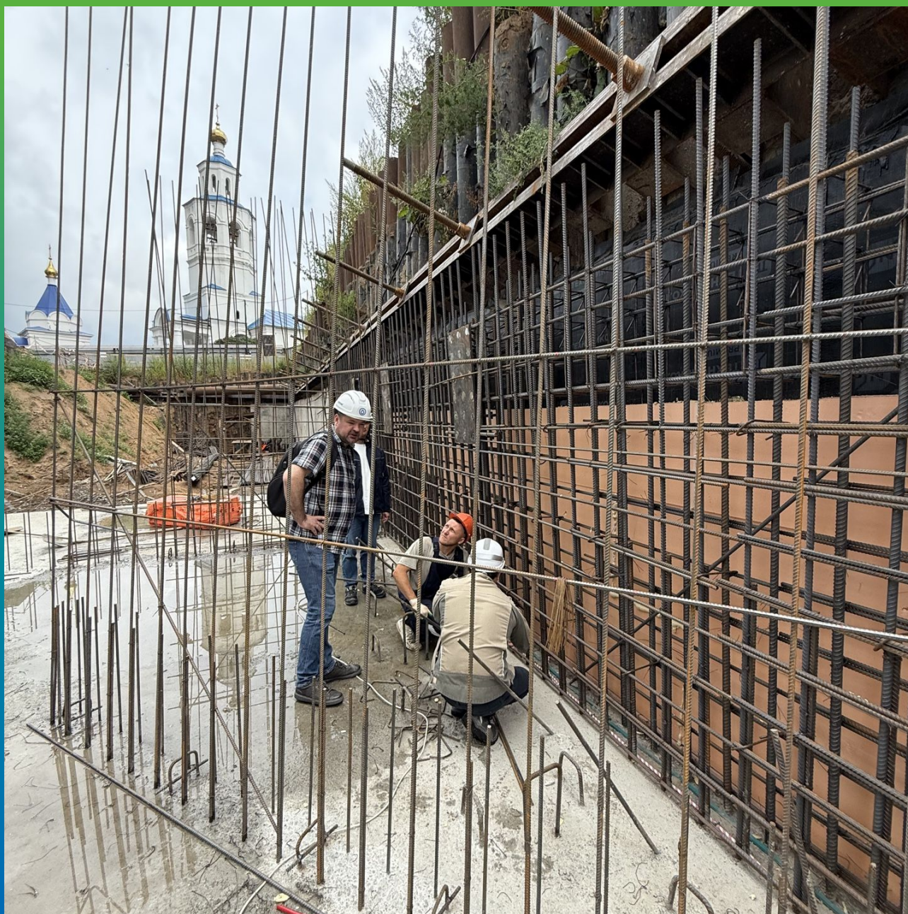
Монтаж профилей Инжпайп и Манодил Свелл