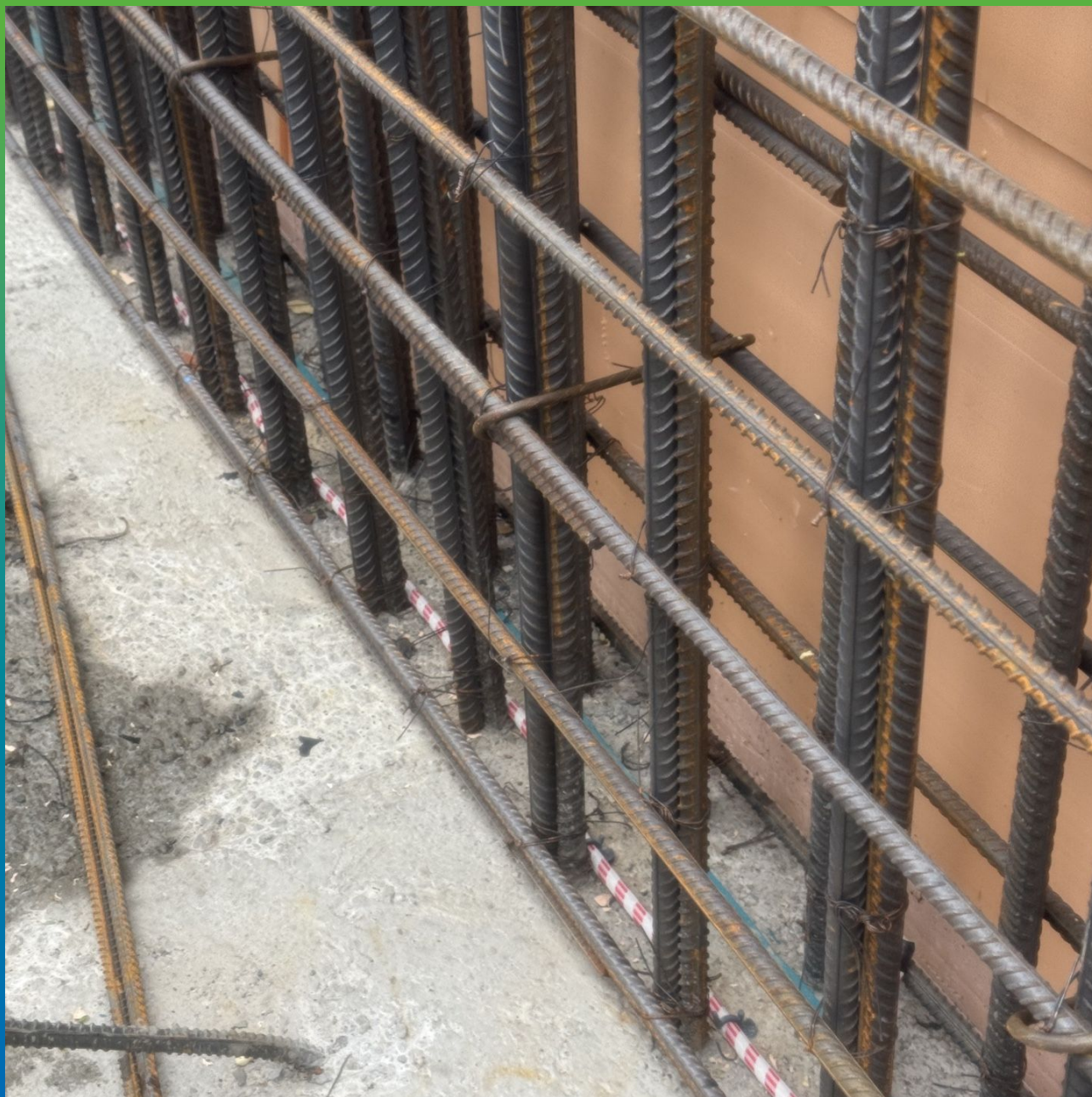
Инжпайп и Манодил Свелл, смонтированные в шов