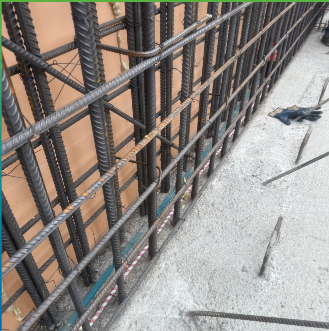
Инжпайп и Манодил Свелл, смонтированные в шов