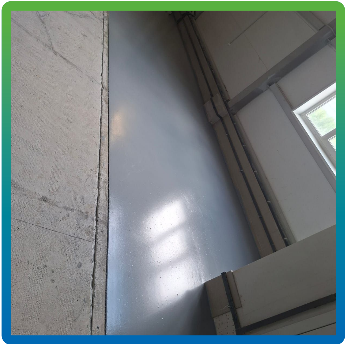
Выполненный участок составом ДенсТоп ПМ 605 Тровел