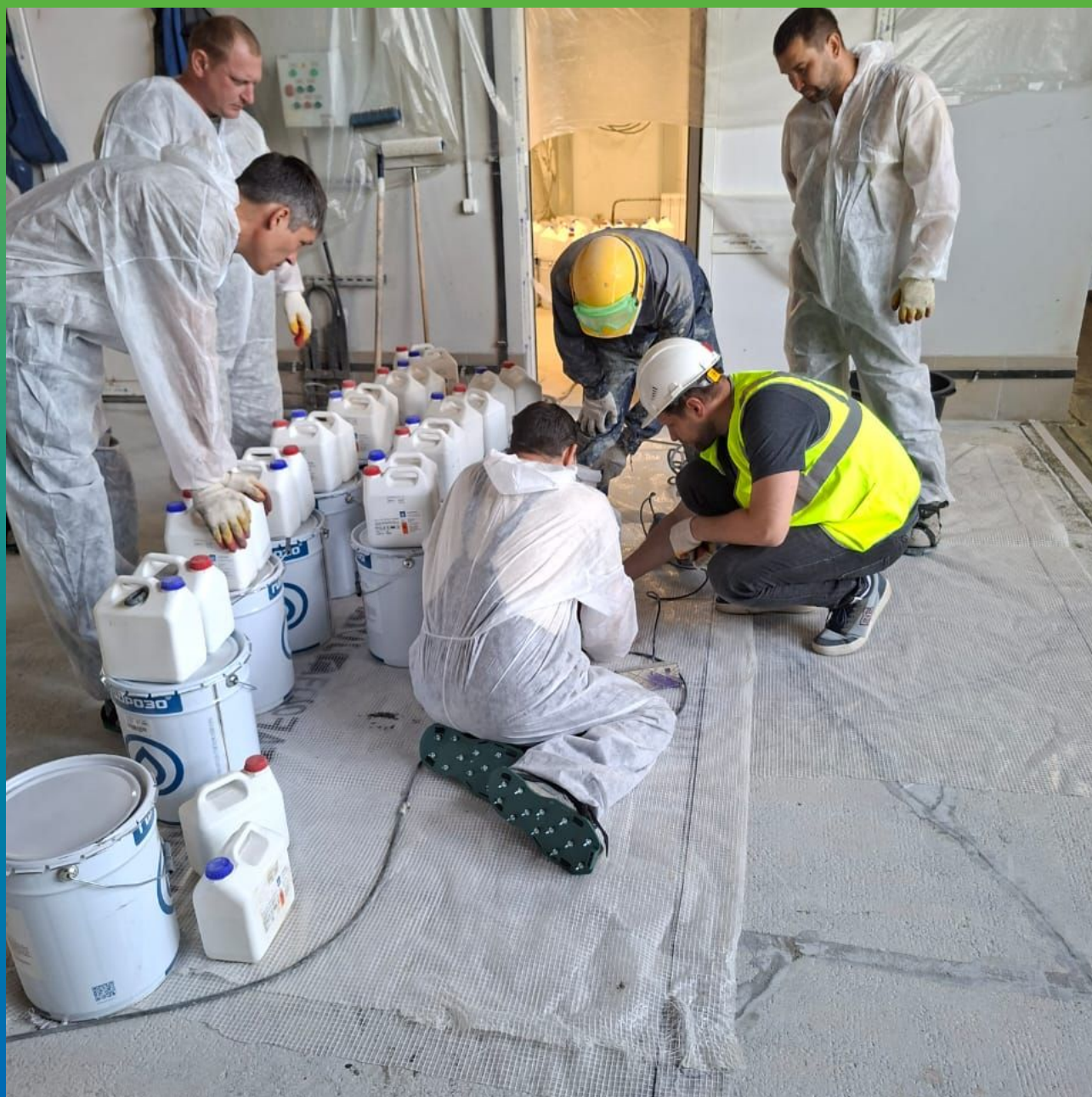
Подготовка и инструктаж перед нанесением покрытия