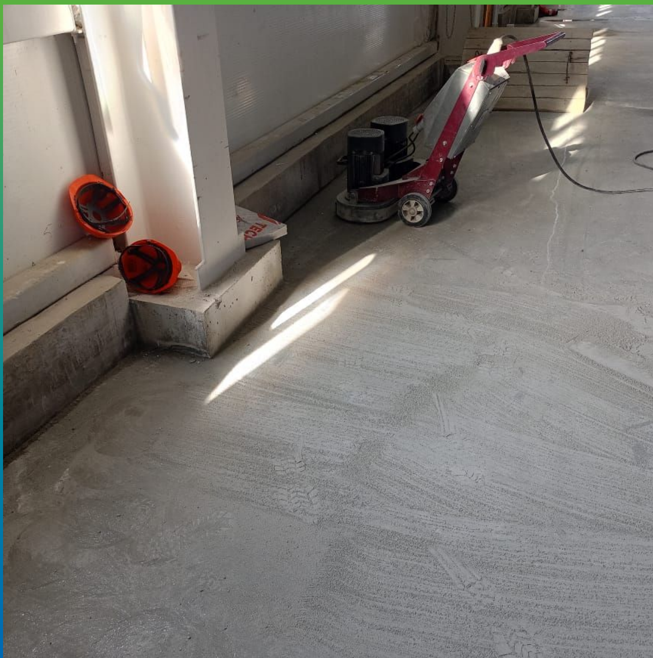
Механическая шлифовка основания перед нанесением химстойкого покрытия