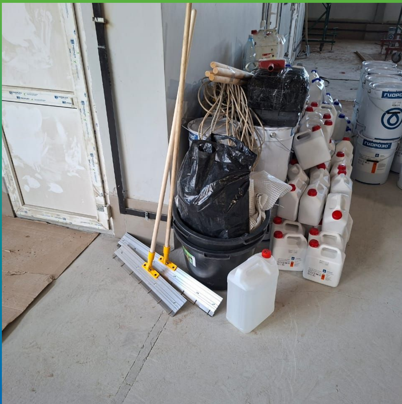
Требуемое оборудование и материалы