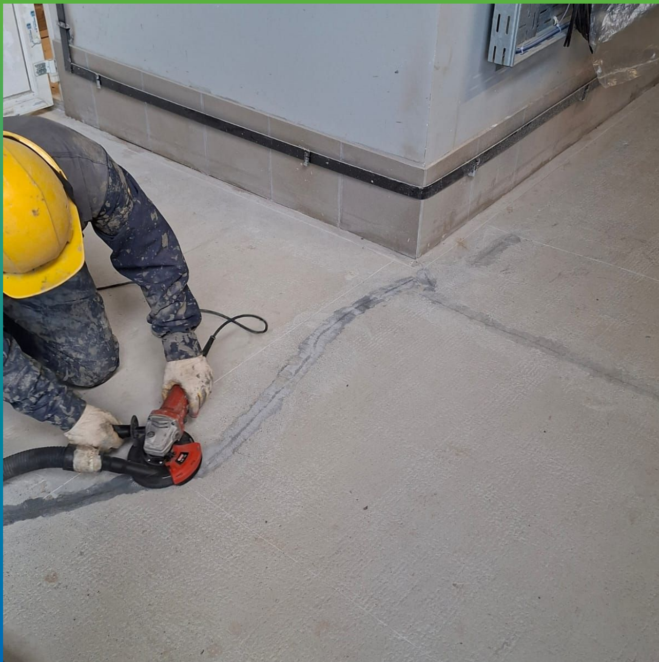
Устранение дефектов составом Манопокс 331