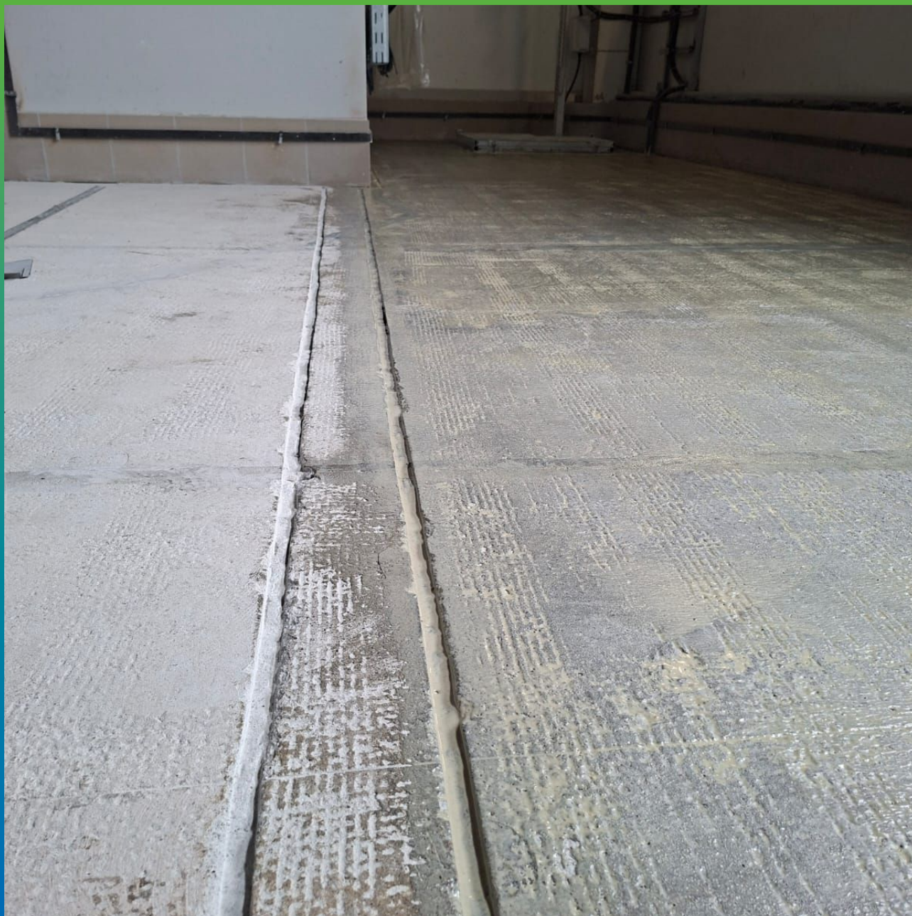
Загрунтованный участок составом ДенсТоп ПМ 600