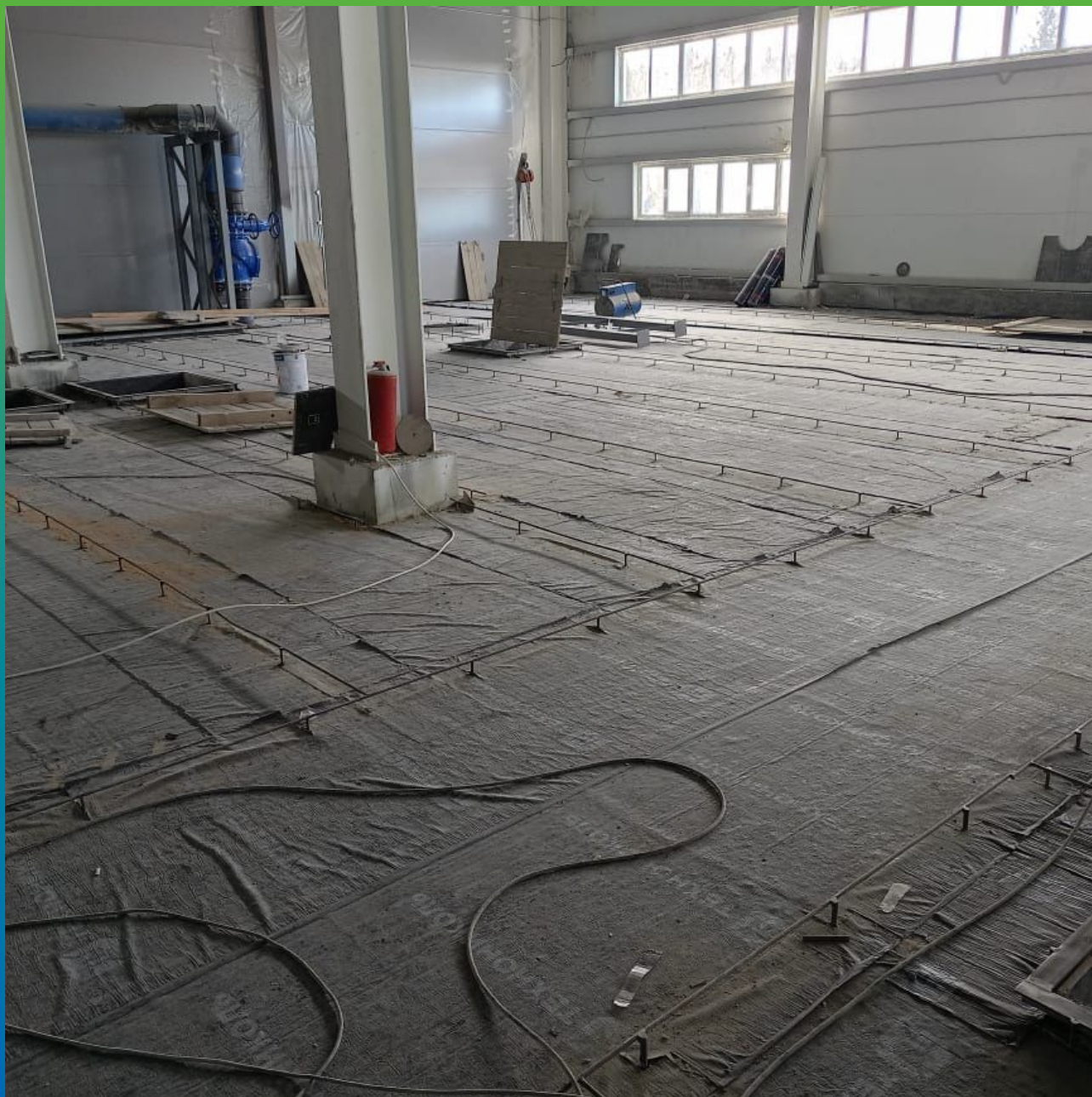
Основание до начала работ по устройству химстойкого покрытия ДенТоп ПМ 605 Тривел