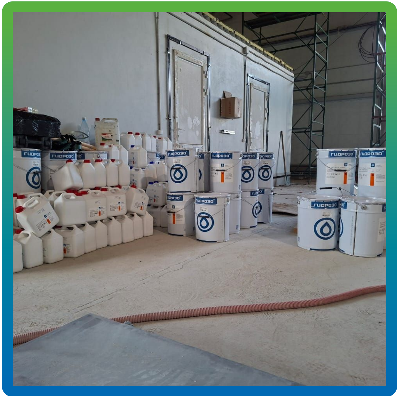
Материалы Гидрозо на объекте