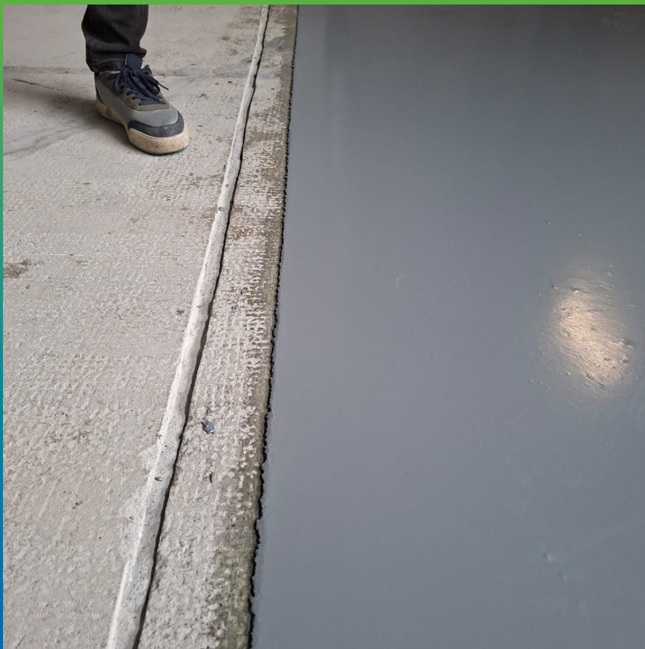
Место примыкания с последующим участком, через устройство анкерного пропила