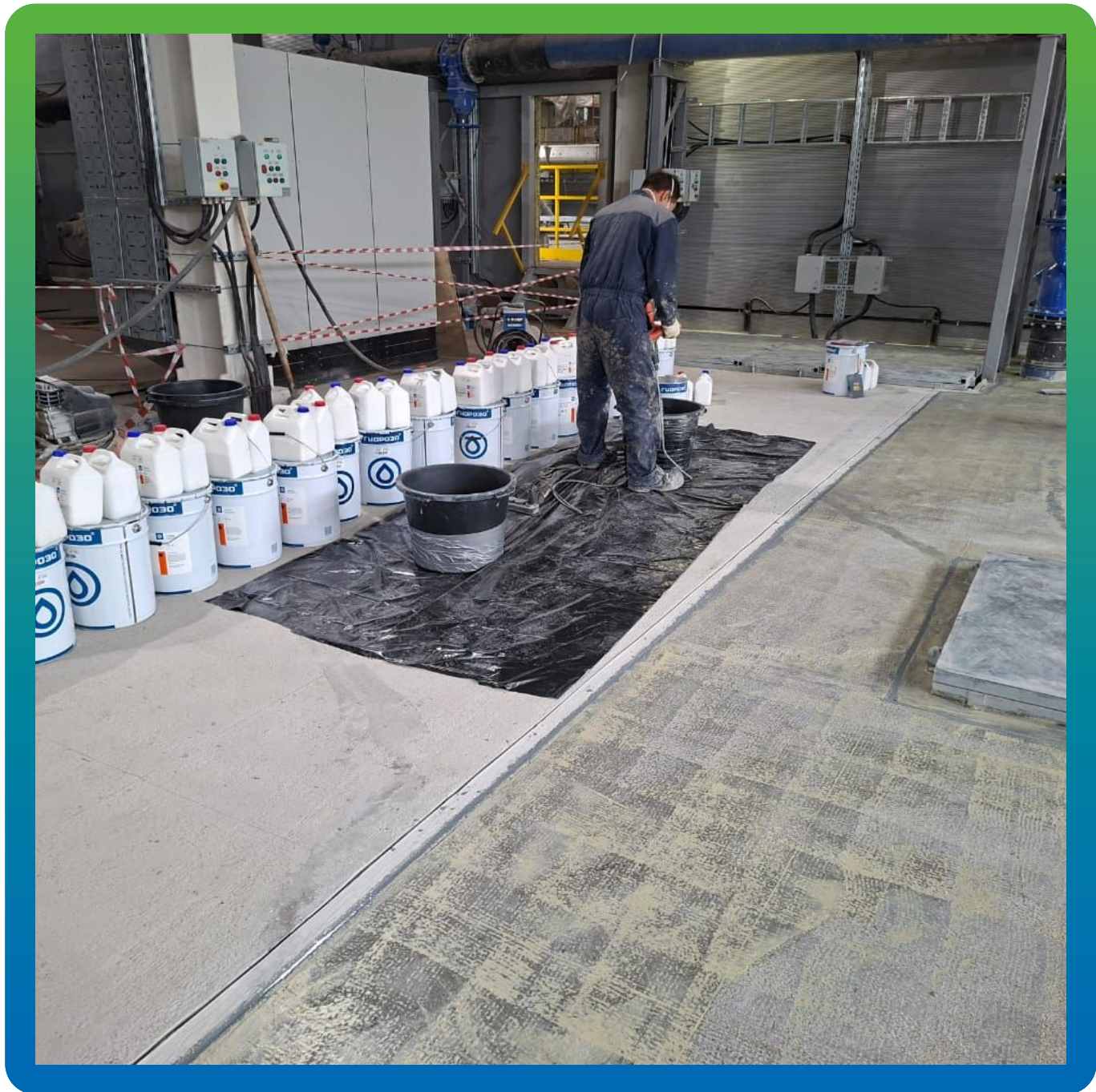
Приготовление состава ДенТоп ПМ 605 Тровел