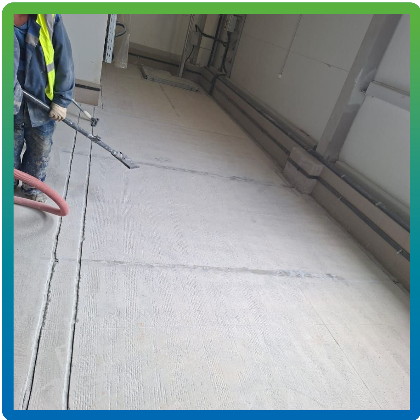
Устройство анкерных пропилов