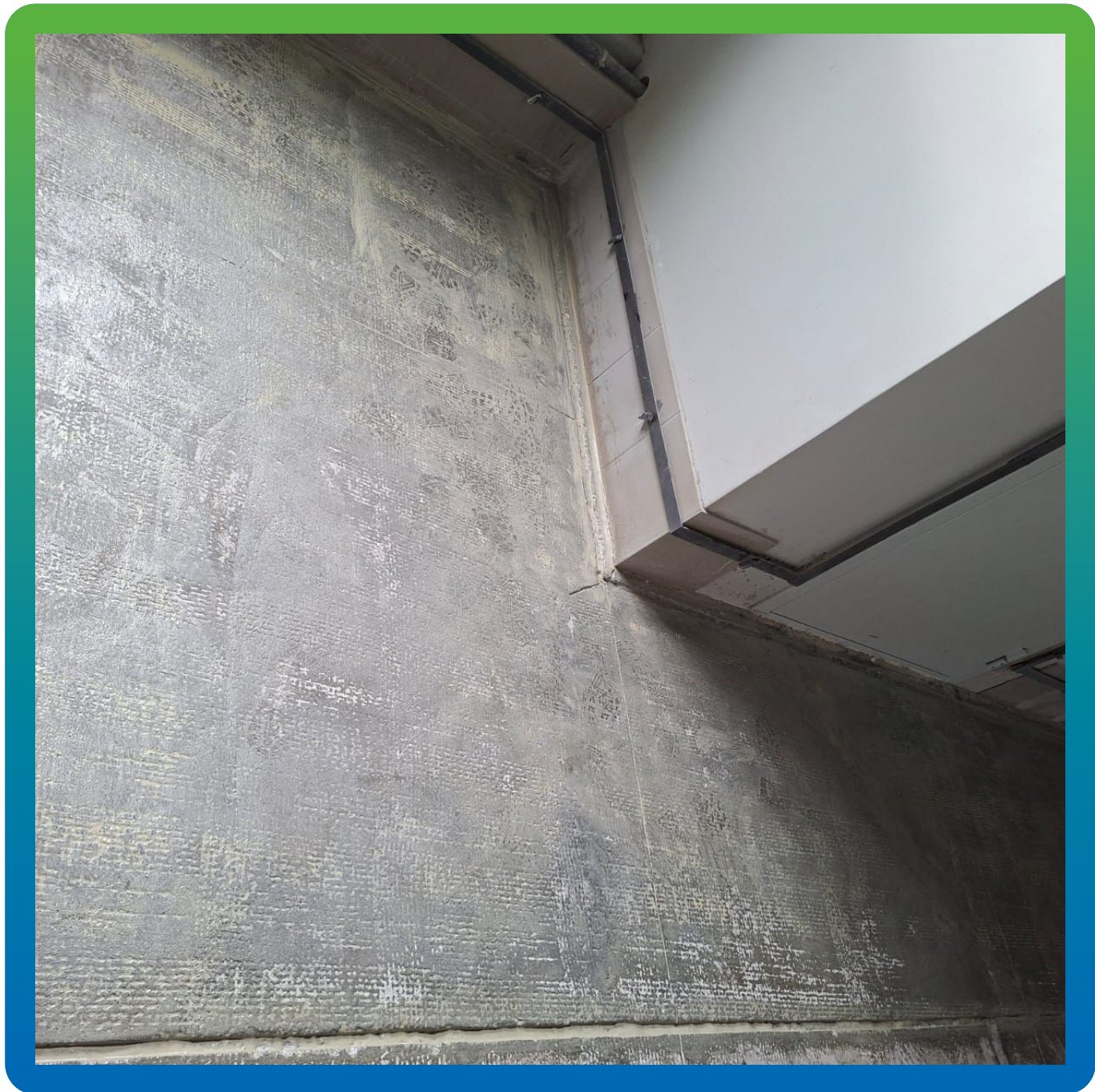
Загрунтованный участок составом ДенсТоп ПМ 600