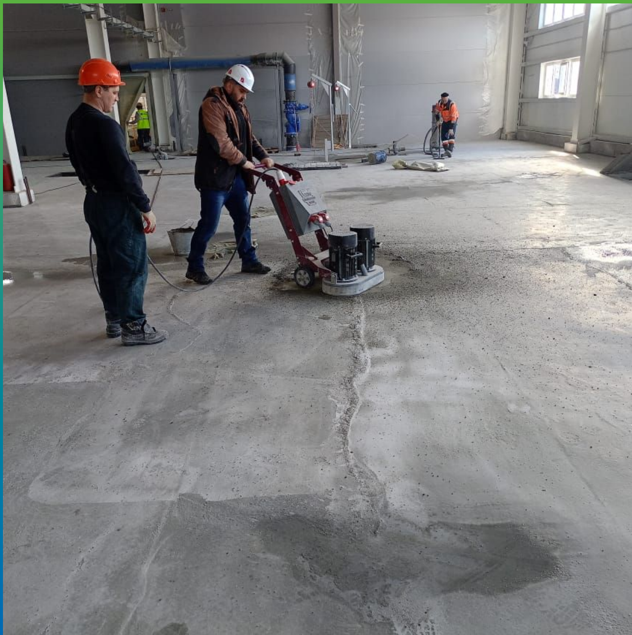
Механическая шлифовка основания перед нанесением химстойкого покрытия