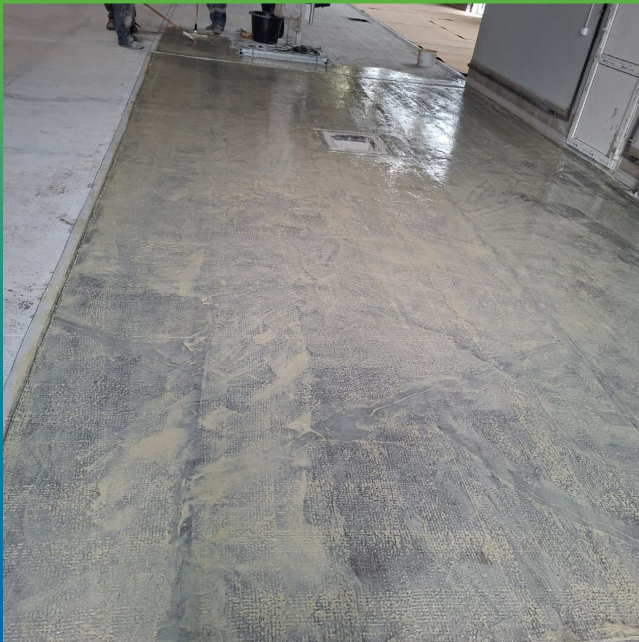
Грунтование следующего участка составом ДенТоп ПМ 600