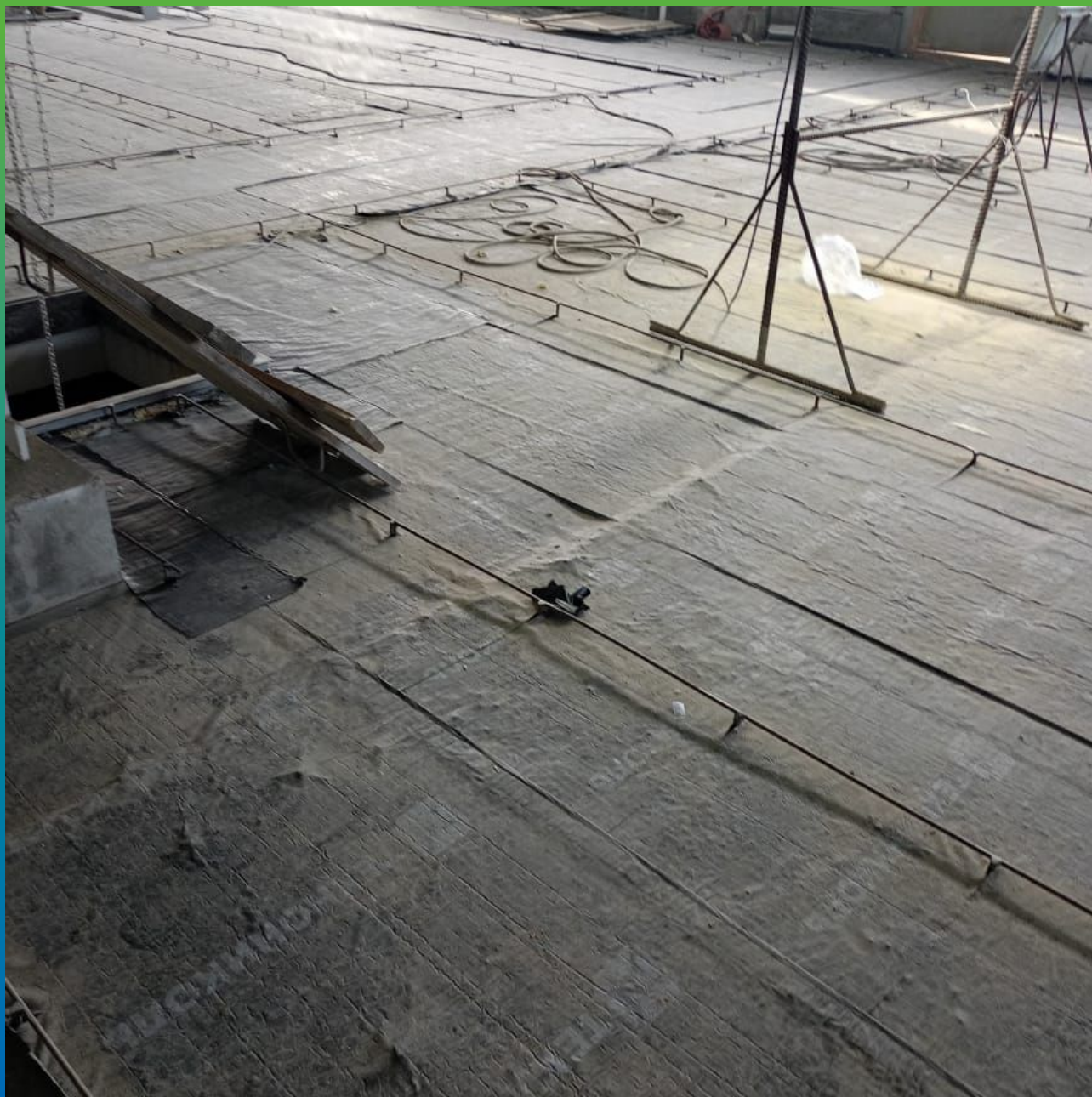
Основание до начала работ по устройству химстойкого покрытия ДенсТоп ПМ 605 Тровел