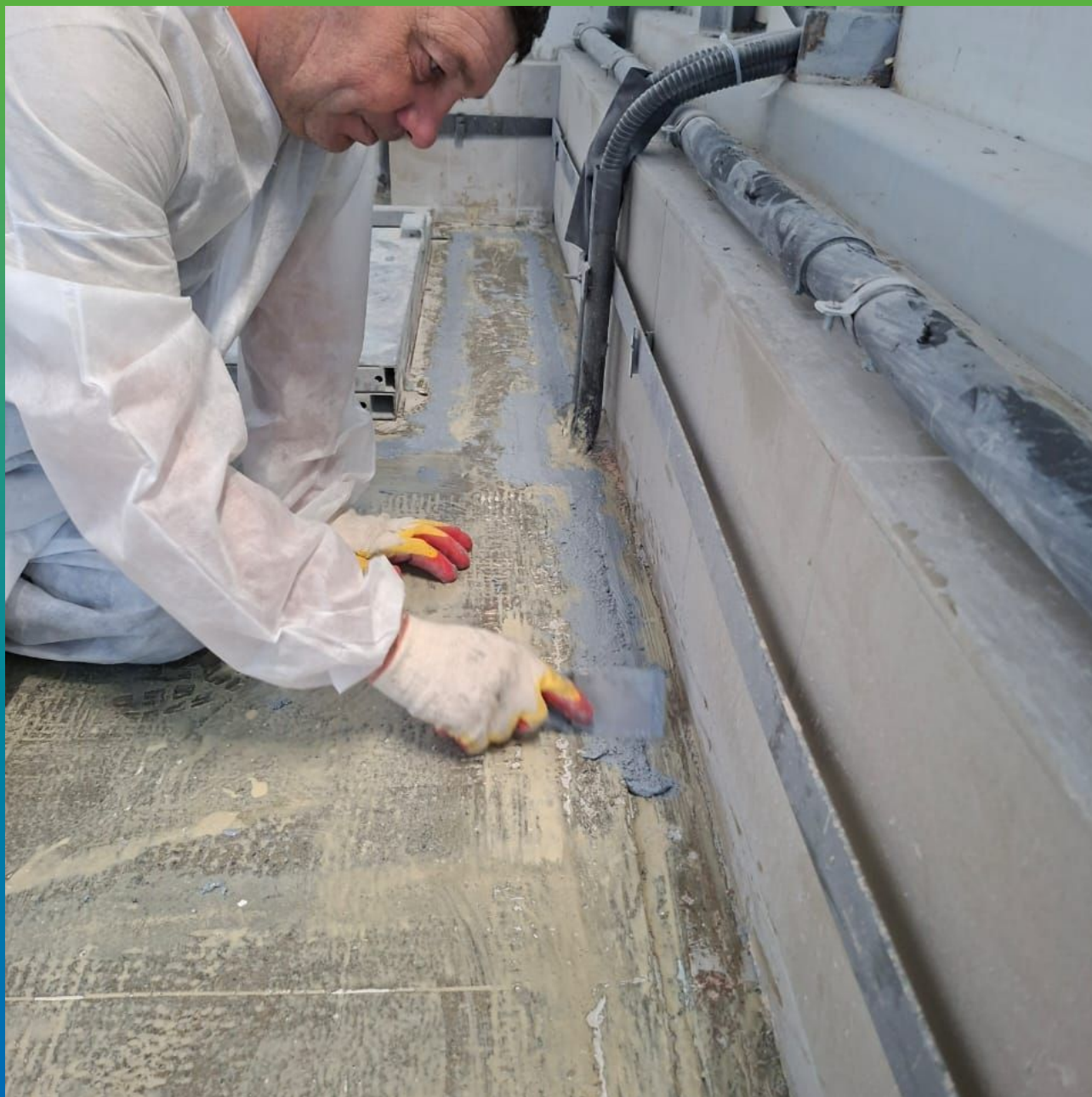
Заполнение анкерного пропила составом ДенТоп ПМ 605 Тровел