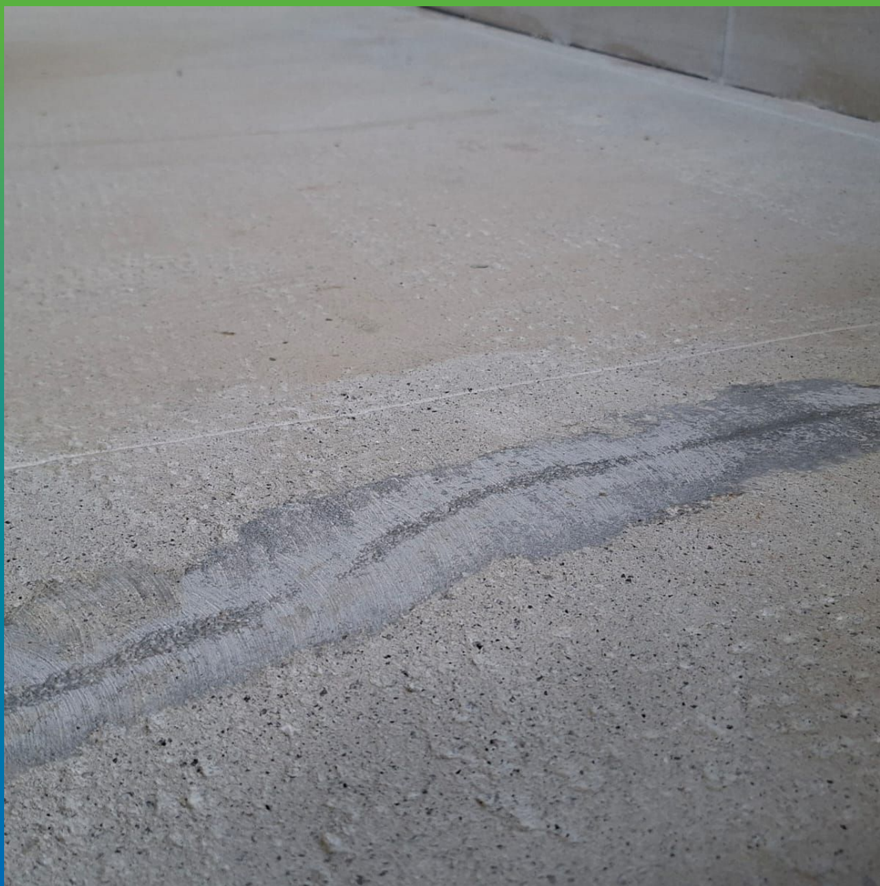
Устранение дефектов составом Манопокс 331