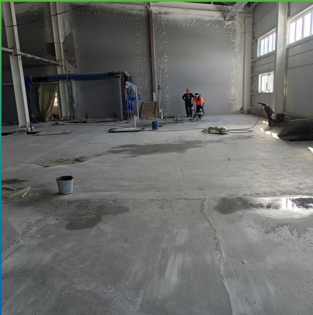
Стяжка из бетона марки М250