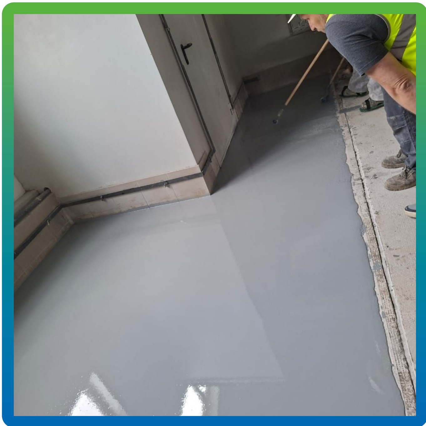
Выполненный участок составом ДенсТоп ПМ 605 Тровел