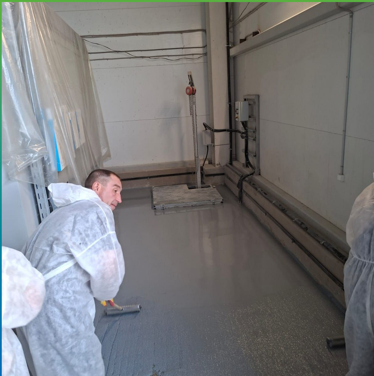
Нанесение состава с последующей прокаткой игольчатым валиком