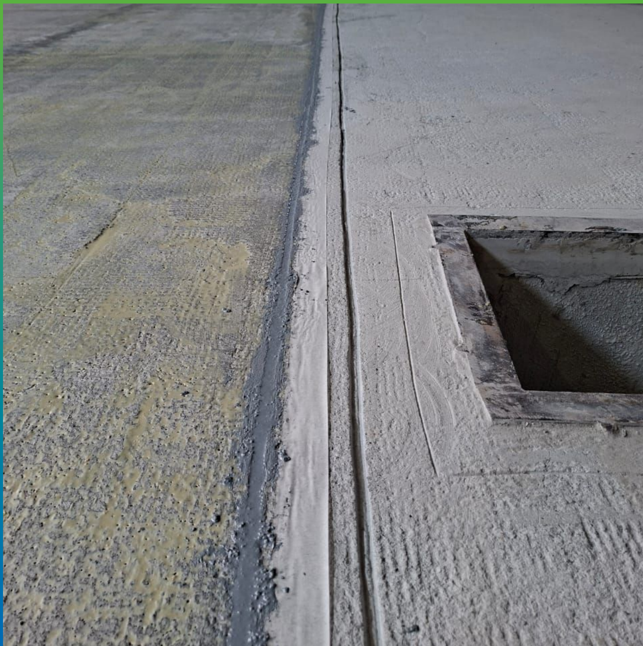
Заполнение анкерного пропила составом ДенсТоп ПМ 605 Тровел