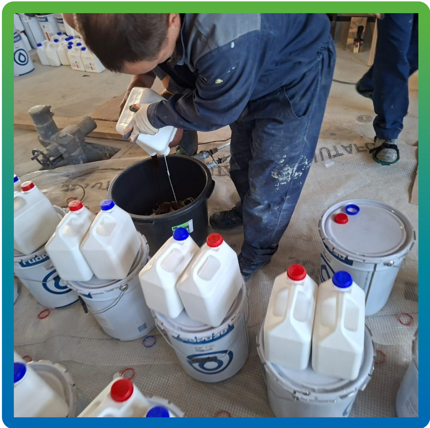
Приготовление состава ДенТоп ПМ 605 Тровел