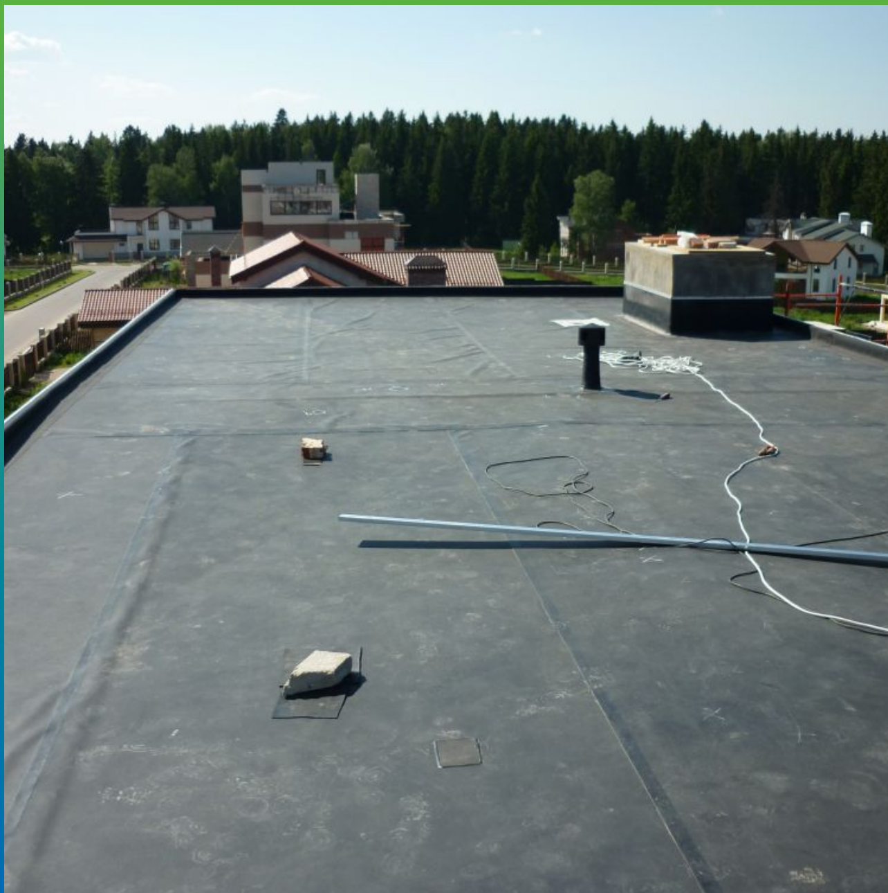
Устройство водоизоляционного ковра из ЭПДМ мембраны Суперсил 2,1 мм