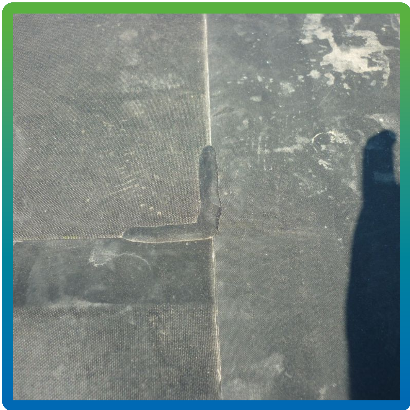
Устройство шва с применением герметика горячего расплава 4 мм