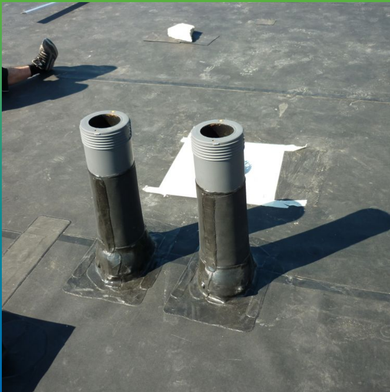
Гидроизоляция элементов кровли с применением Термобонд ТПО 300 мм