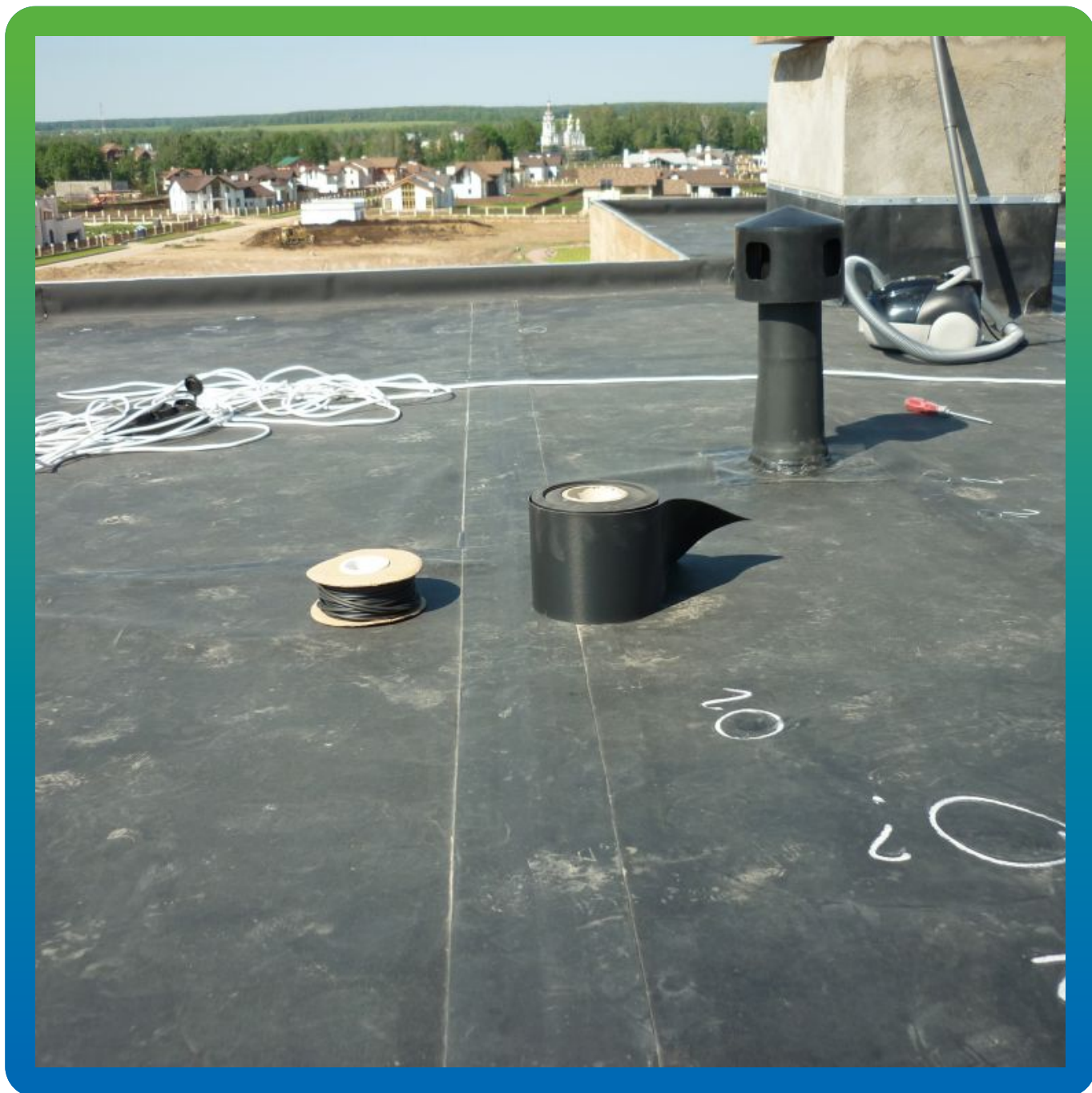
Устройство швов из армированного Термобонда 150 мм x 20 м