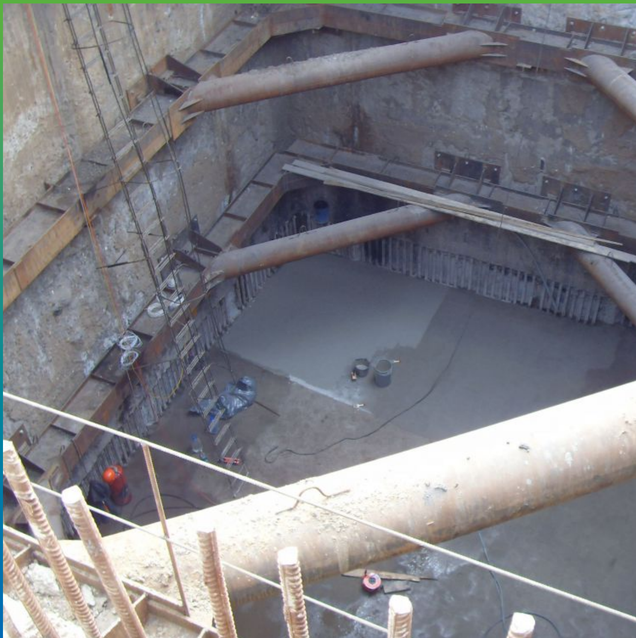
Нанесение Максил Супер