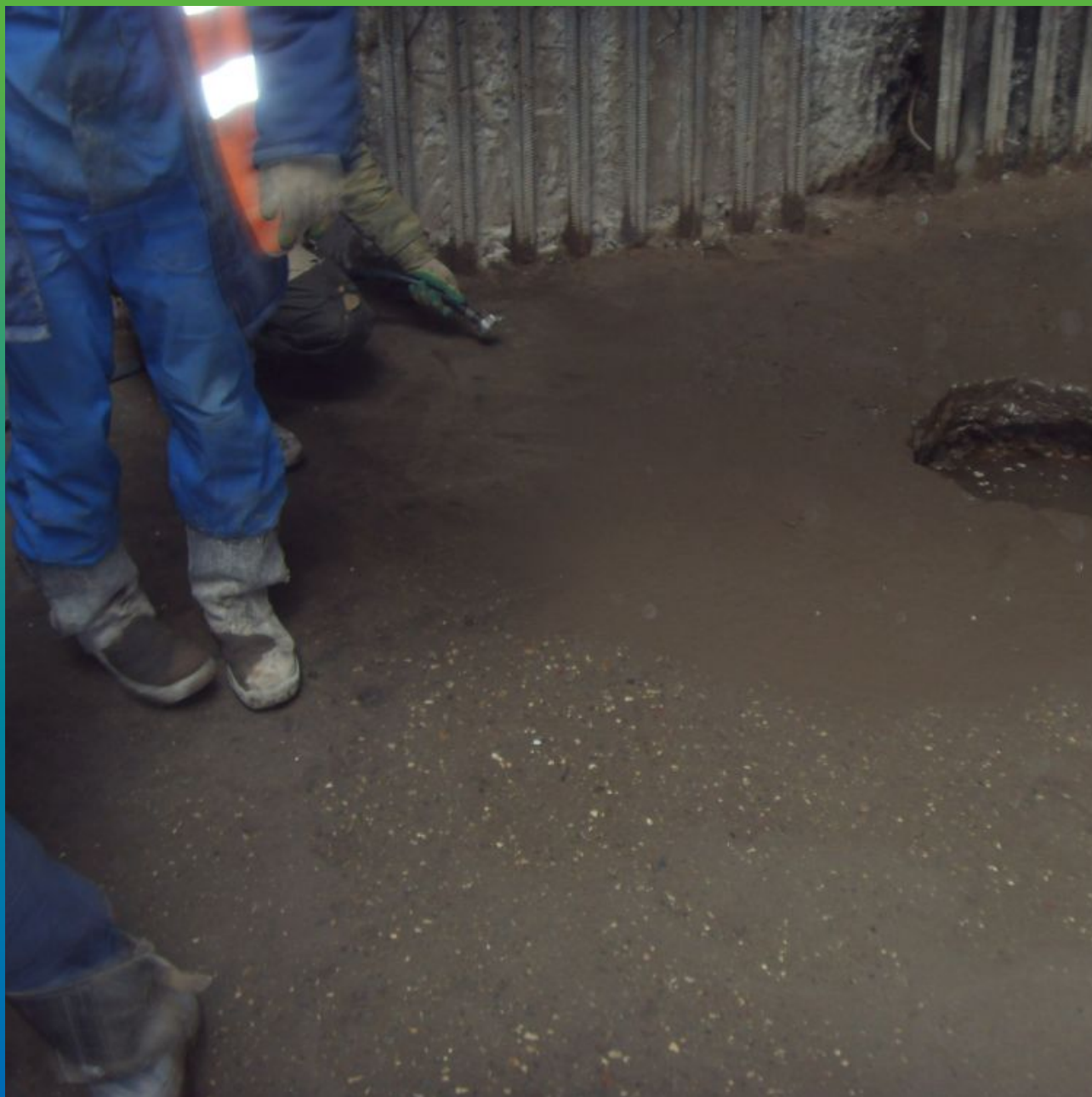
Подготовка основания перед нанесением Макссил Супер