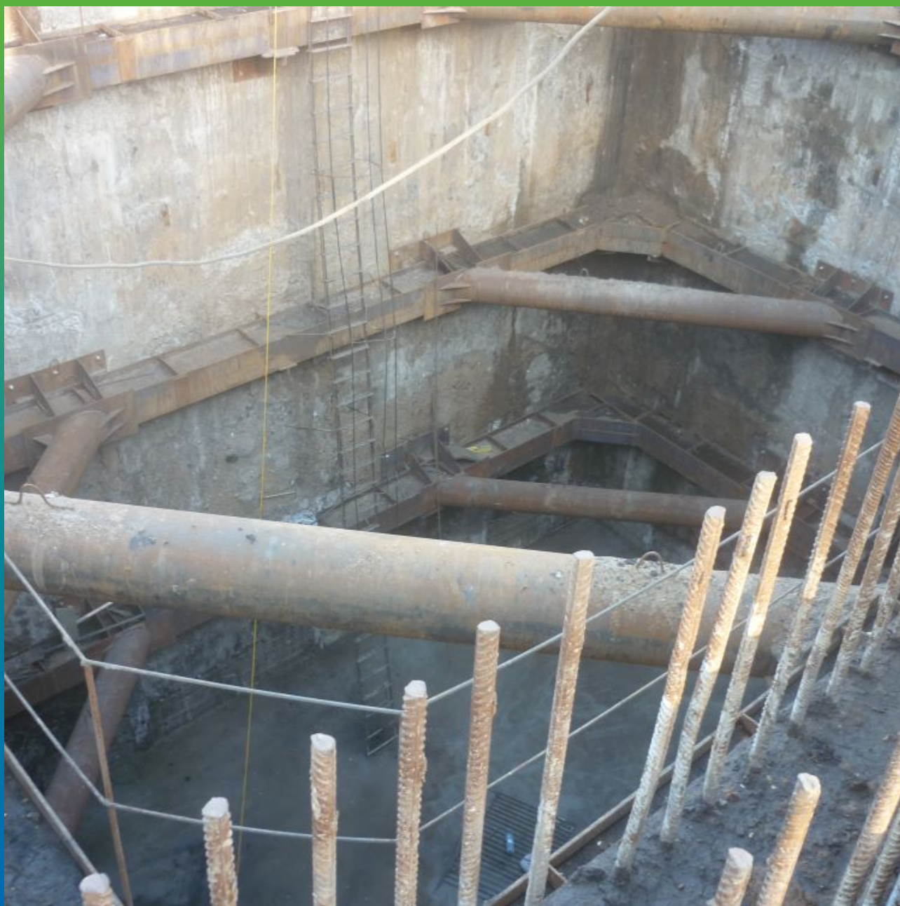
Вид КНС сверху перед нанесением Макссил Супер