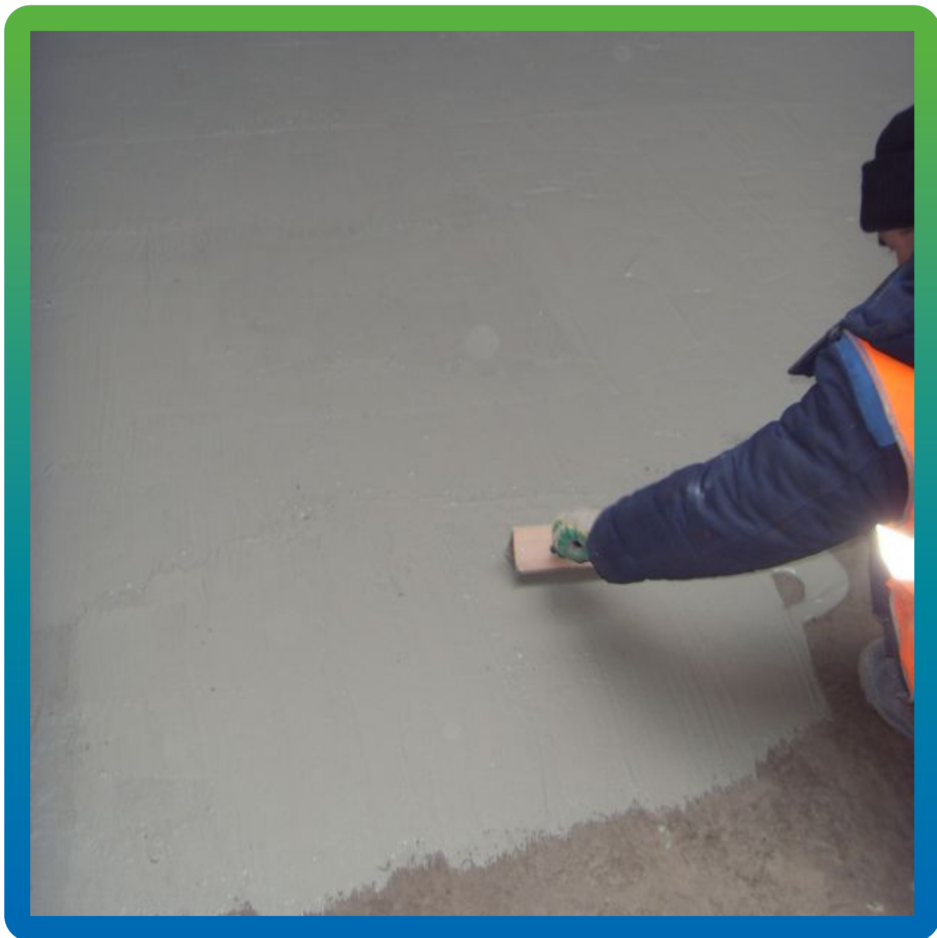
Нанесение Макссил Супер