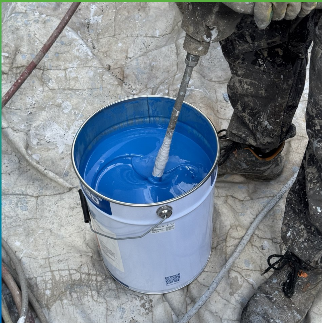
Смешивание компонентов ДенТоп ПУ 302 перед нанесением