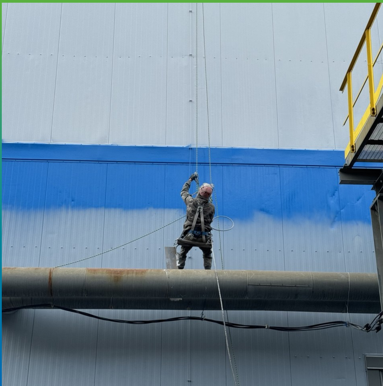
Нанесение финишного состава ДенсТоп ПУ 302