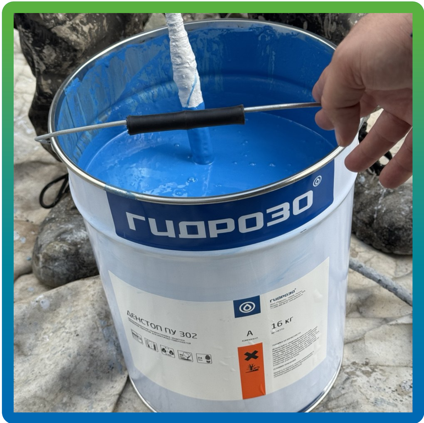
Смешивание компонентов ДенТоп ПУ 302 перед нанесением