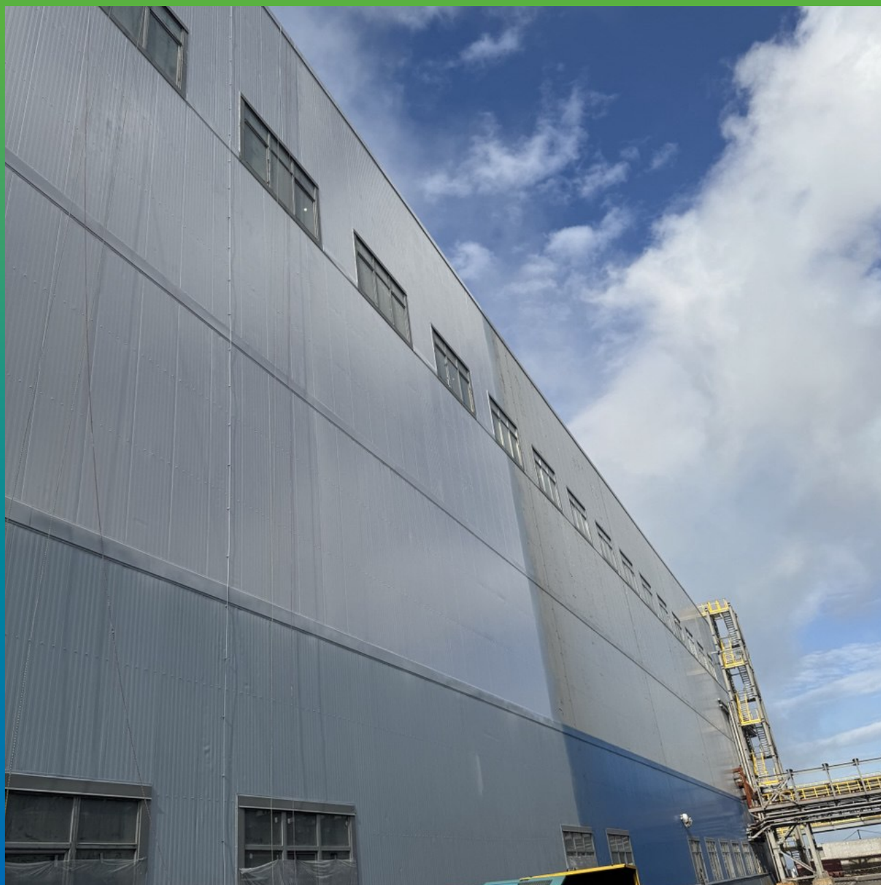
Общий вид объекта с нанесенной системой ДенсТоп ПУ 113 + ДенсТоп ПУ 302