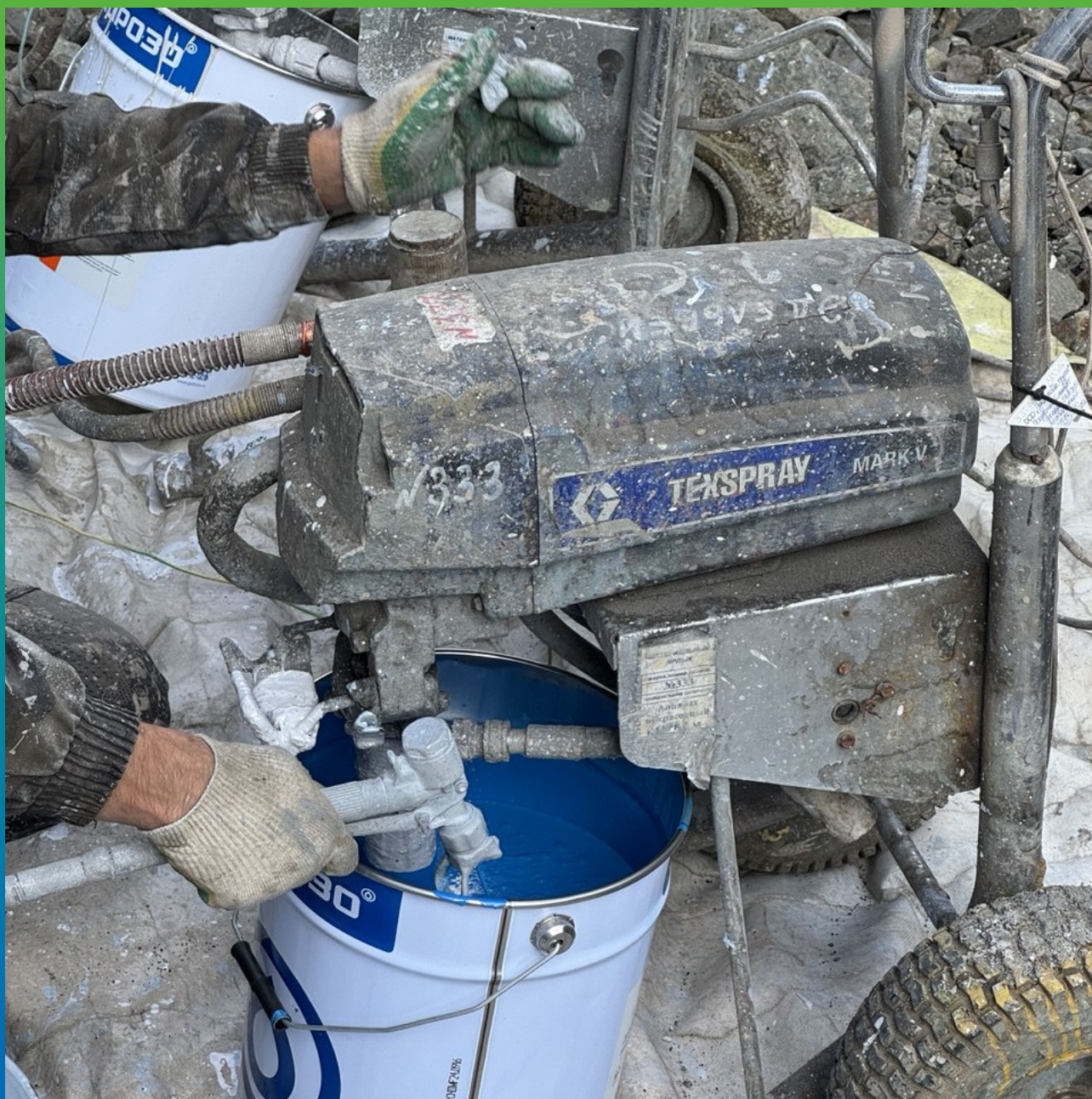
Проерка оборудования и вязкости материала