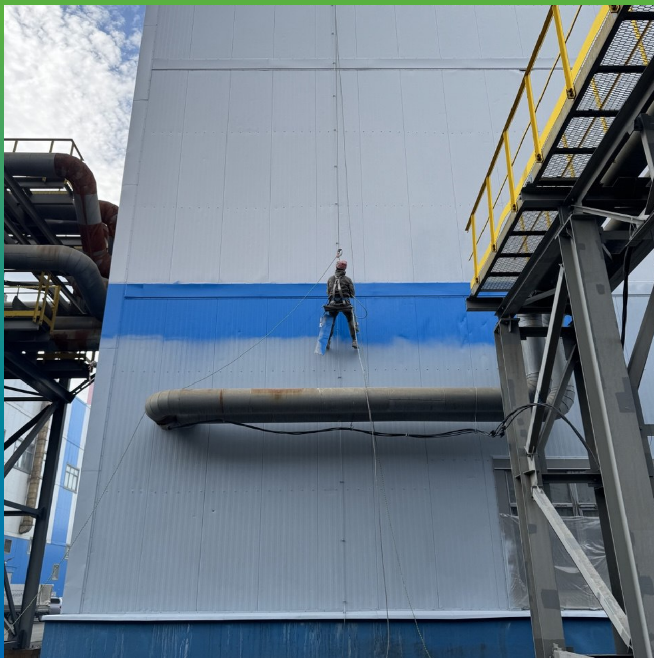
Нанесение финишного состава ДенсТоп ПУ 302