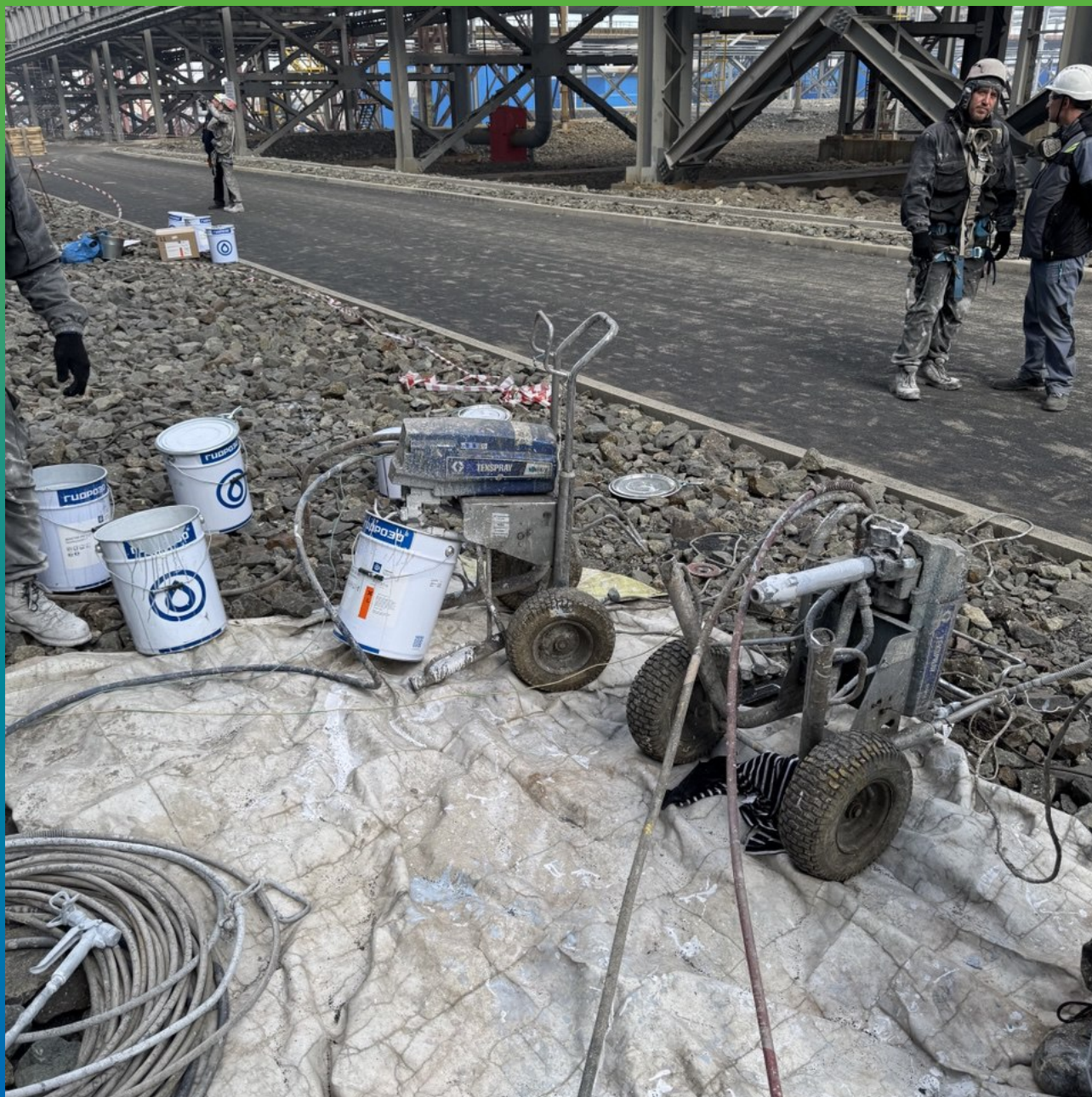
Оборудование для безвоздушного нанесения на объекте