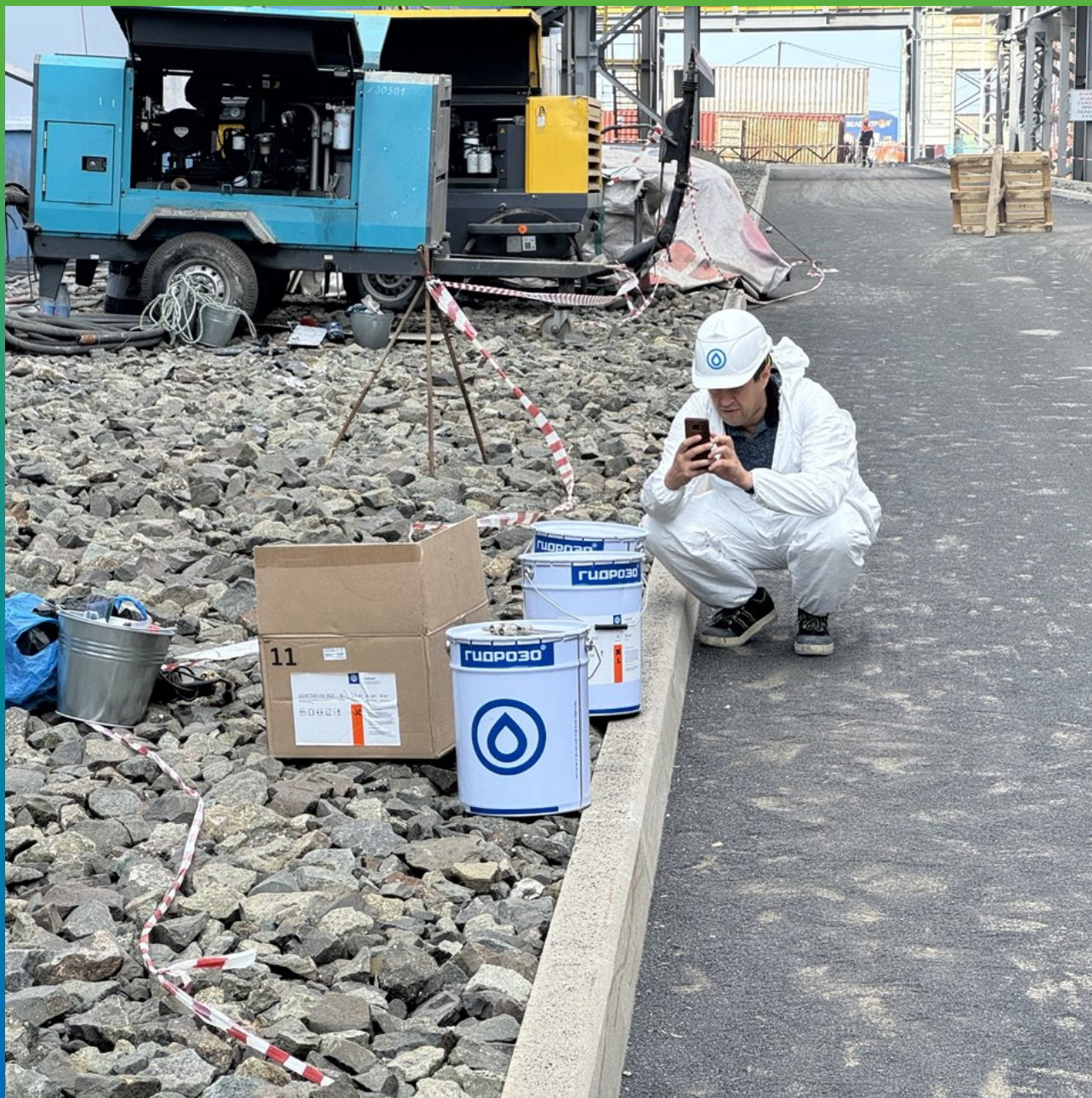
Материалы на объекте ДенТоп ПУ 113, ДенТоп ПУ 302