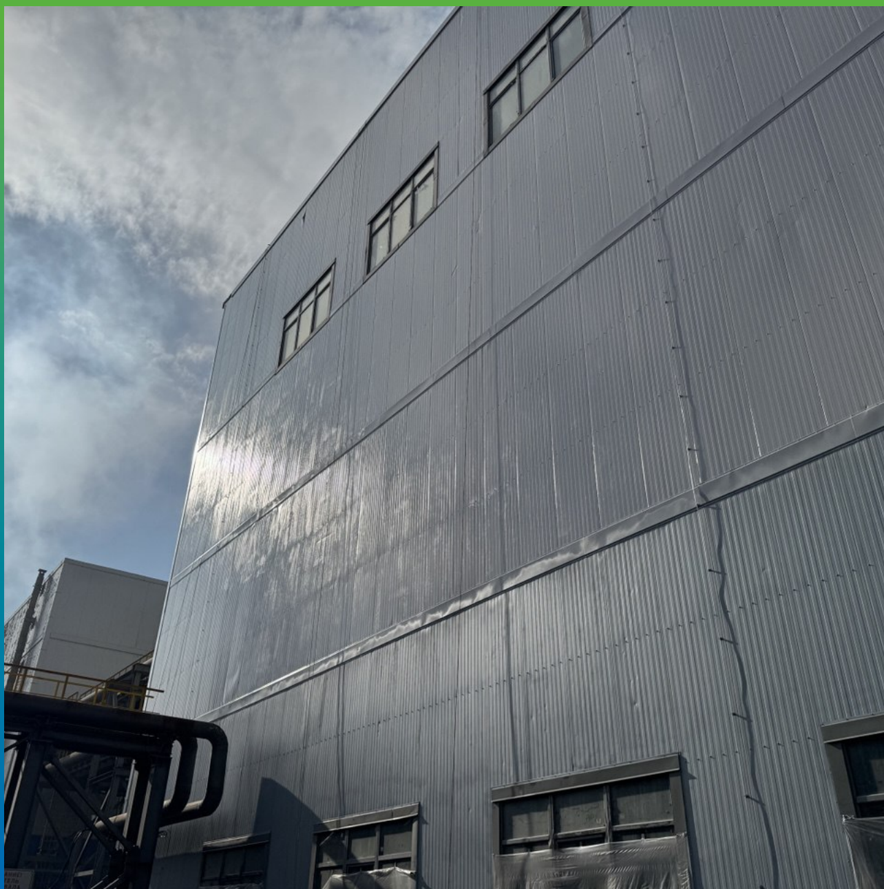
Общий вид объекта с нанесенной системой ДенсТоп ПУ 113 + ДенсТоп ПУ 302