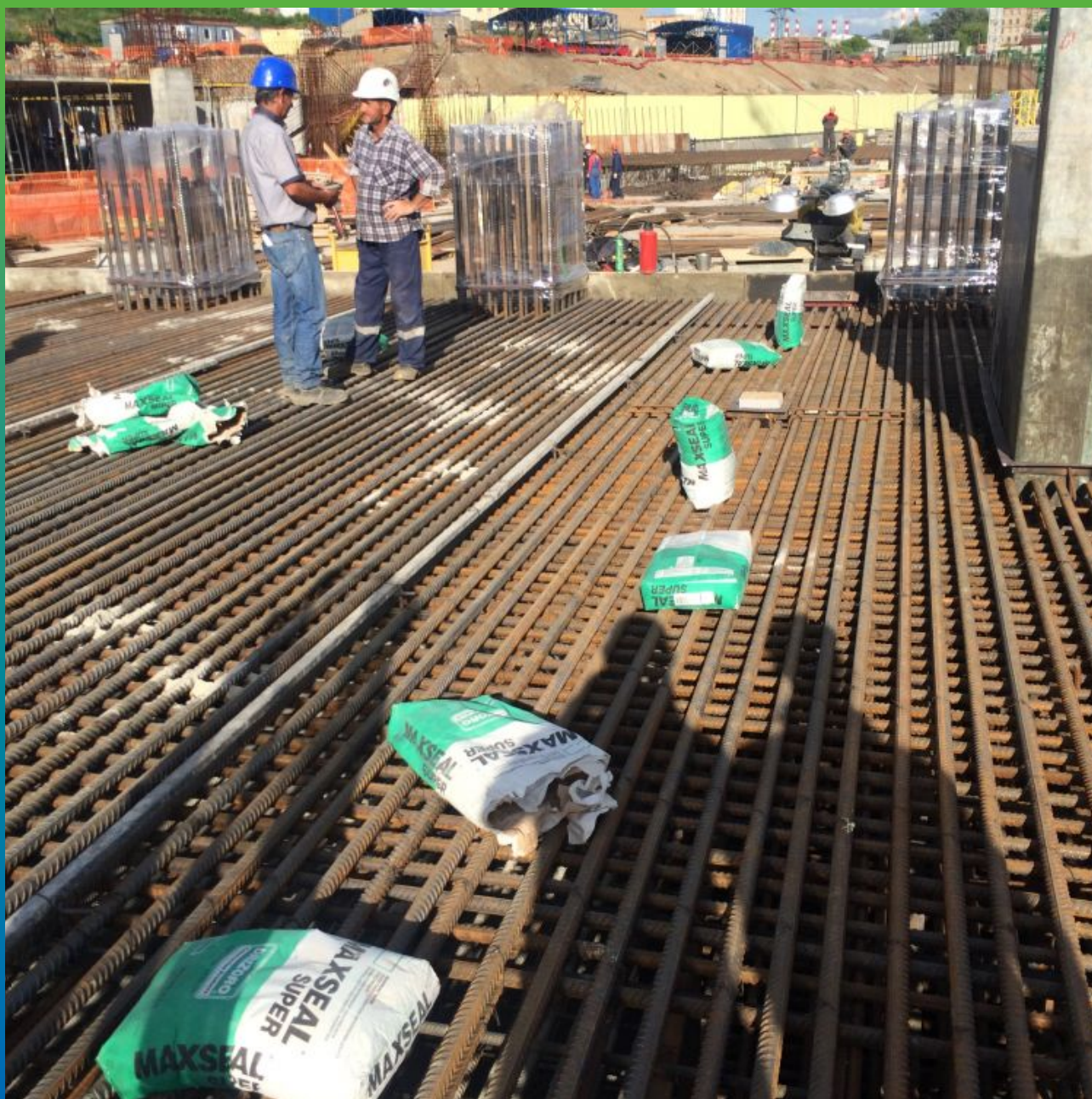
Распределение мешков Макссил Супер по арматуре, один мешок на 10 кв.м