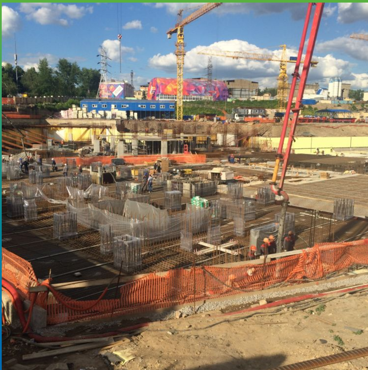
Общий вид при отливке плиты