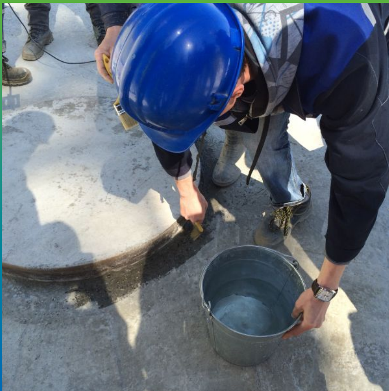
Смачивание поверхности перед нанесением гидроизоляции