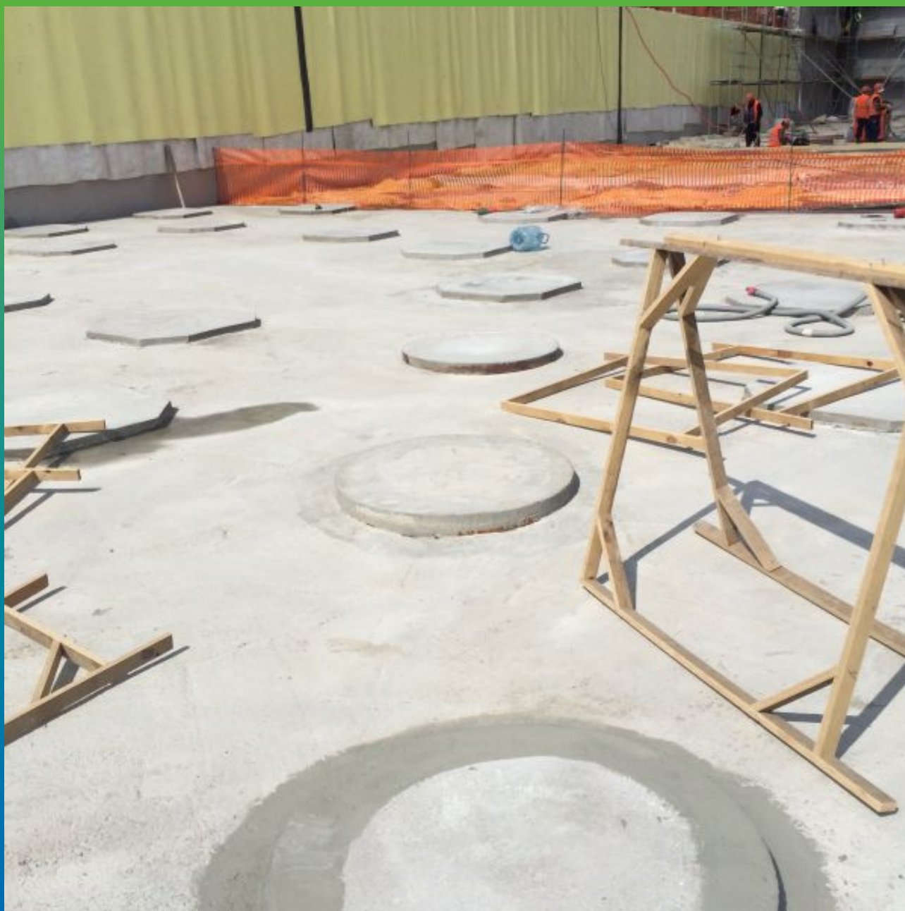
Оголовок сваи, обмазанный по примыканию эластичной гидроизоляцией Максил Флекс