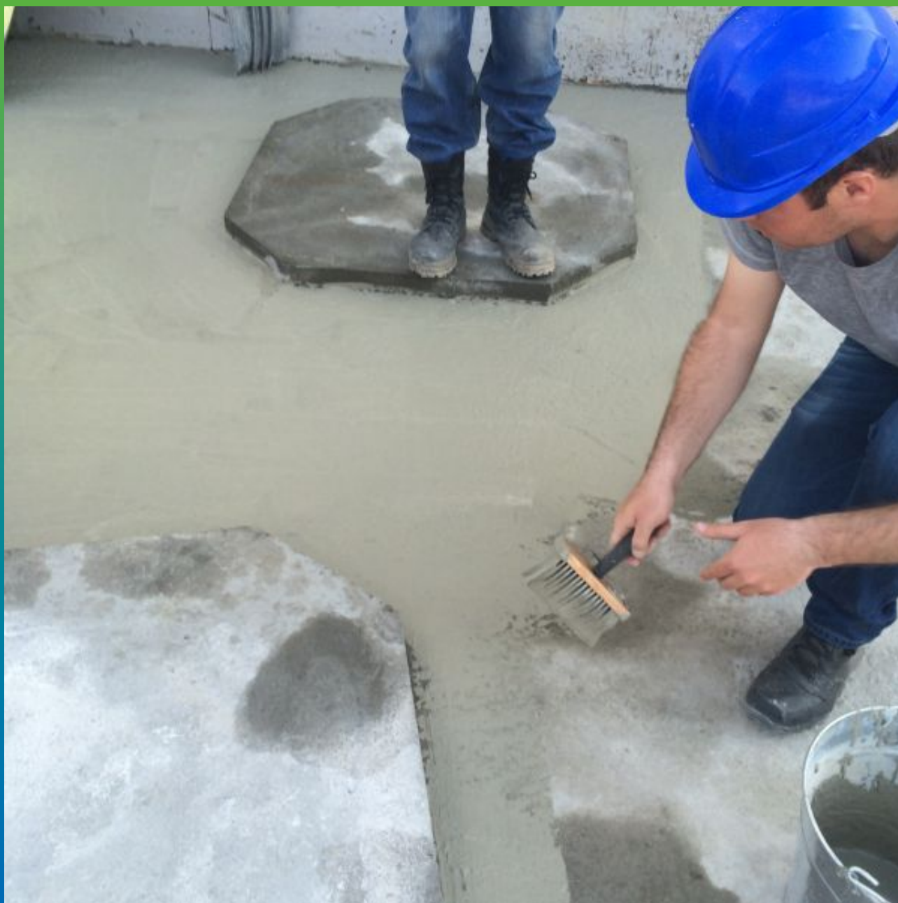
Нанесение площадной гидроизоляции Максил Супер