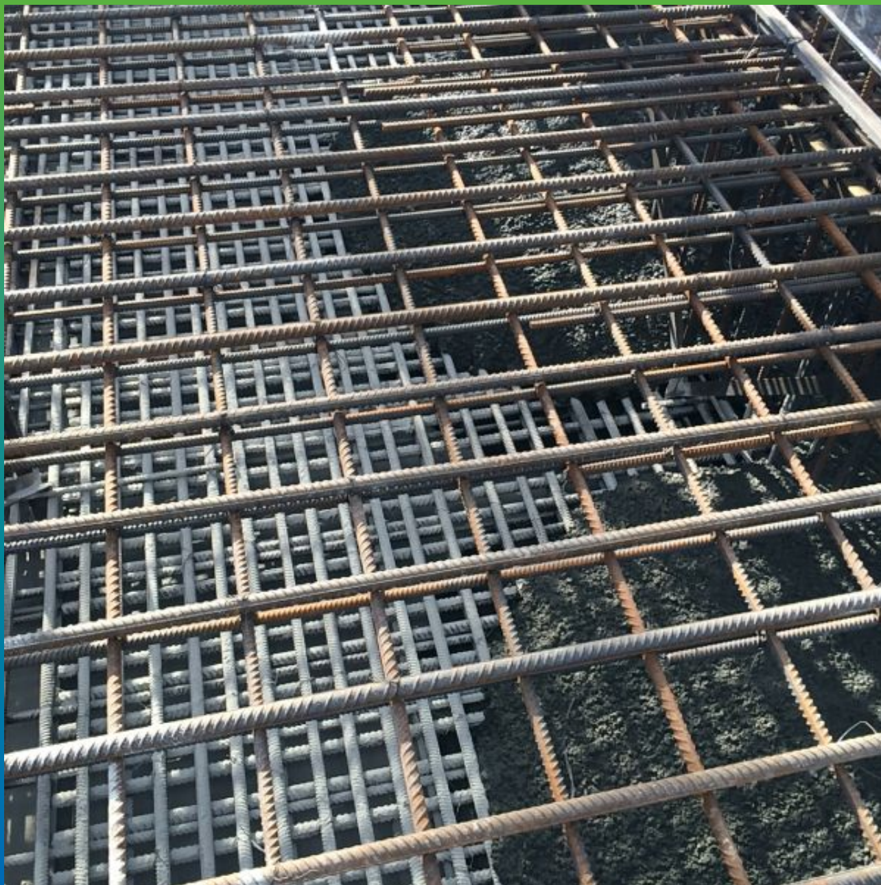
Отливка плиты по гидроизоляции осмотического действия Максил Супер