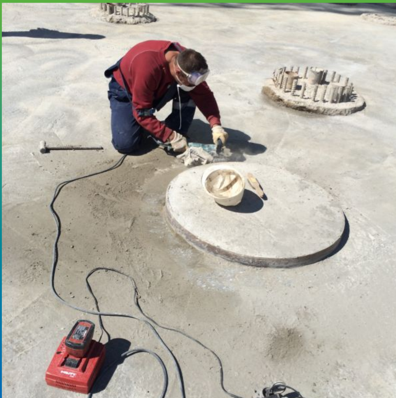
Подготовка поверхности перед нанесением гидроизоляции