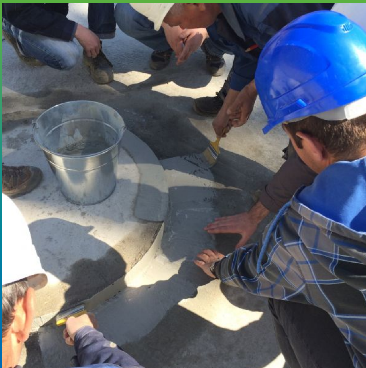
Нанесение эластичной гидроизоляции Максил Флекс в местах примыкания сваи и бетонной подготовки