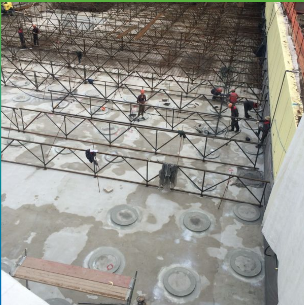
Бетонная подготовка обмазанная Макссил Супер и Макссил Флекс, монтаж арматуры