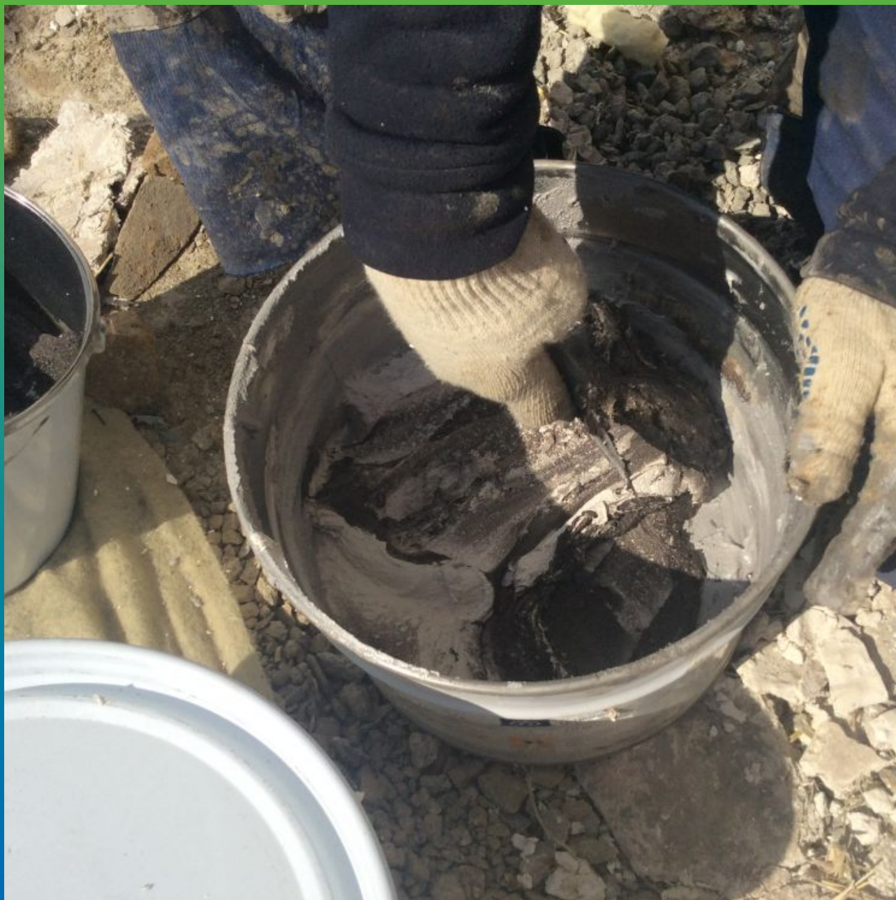
Затворение Манопокс 331