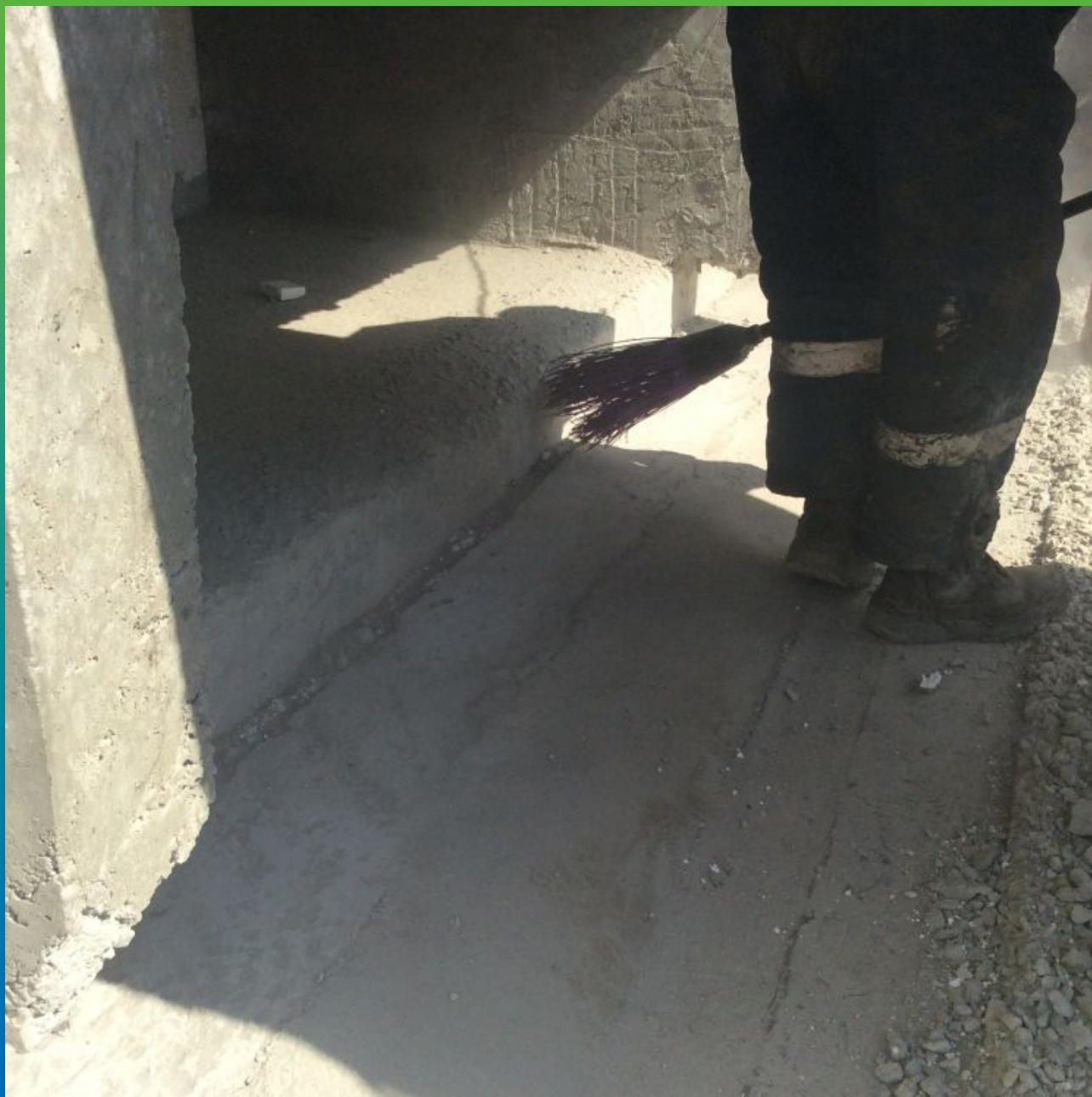
Прочистка шва - обеспыливание