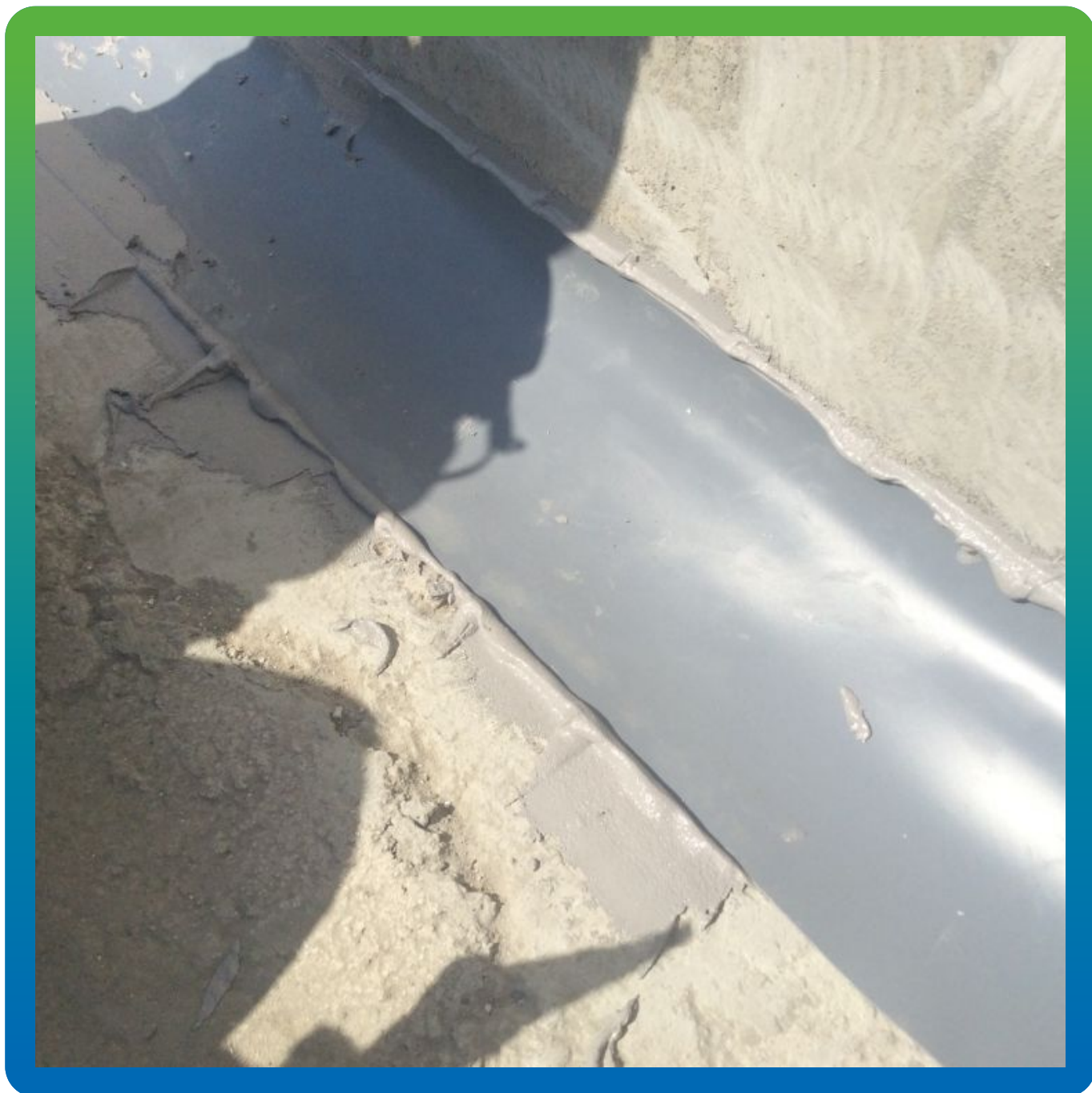
Вид смонтированной ленты Манодил Про