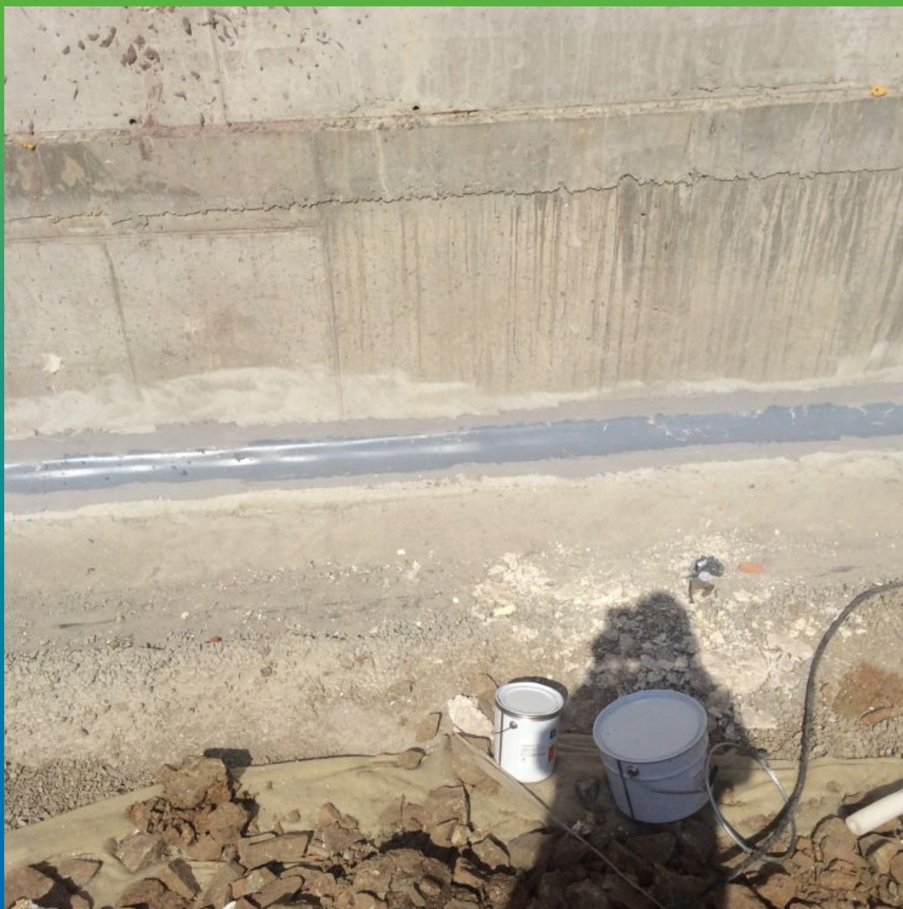
Финальный вид шва