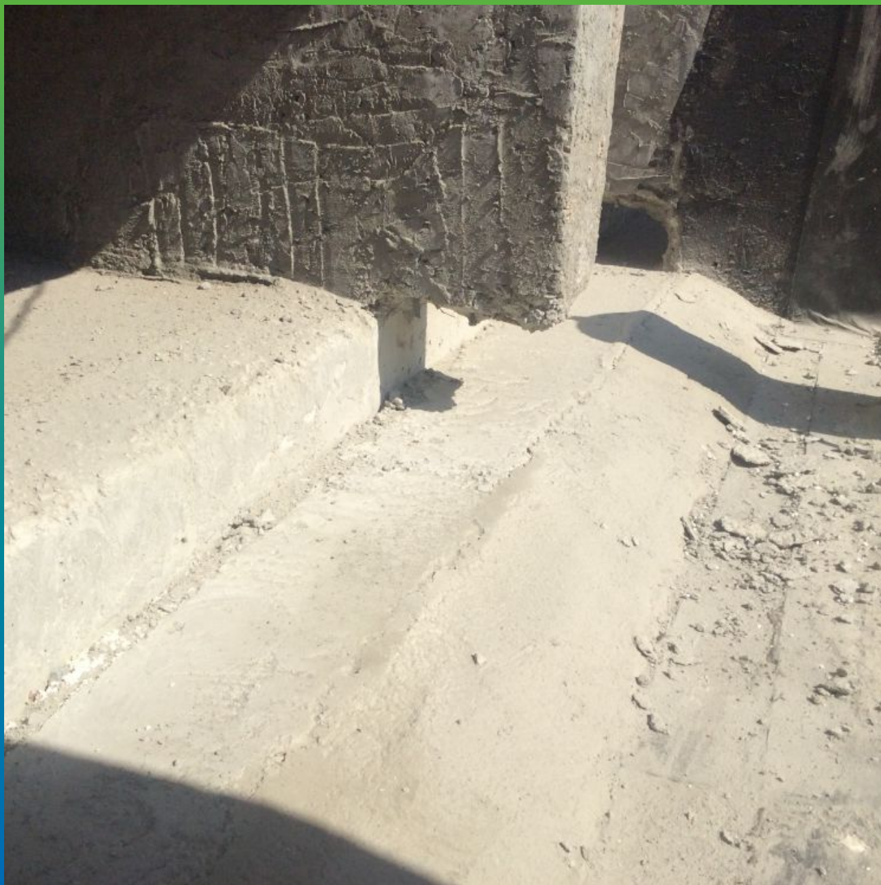
Первоначальный вид шва