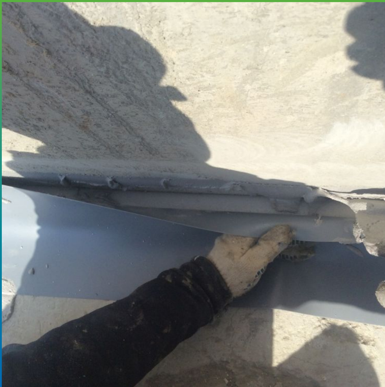
Монтаж ленты Манодил Про на Манопокс 331