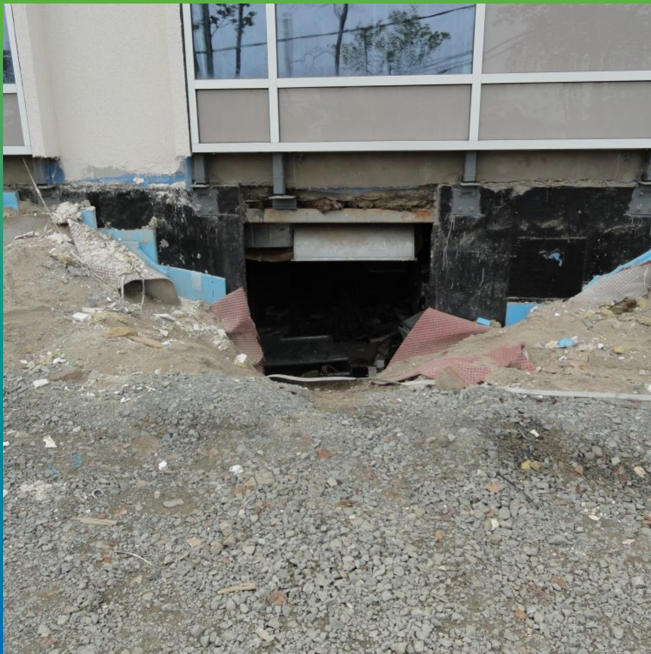
Профилированная мембрана Максдрейн П8 ГТ на объекте