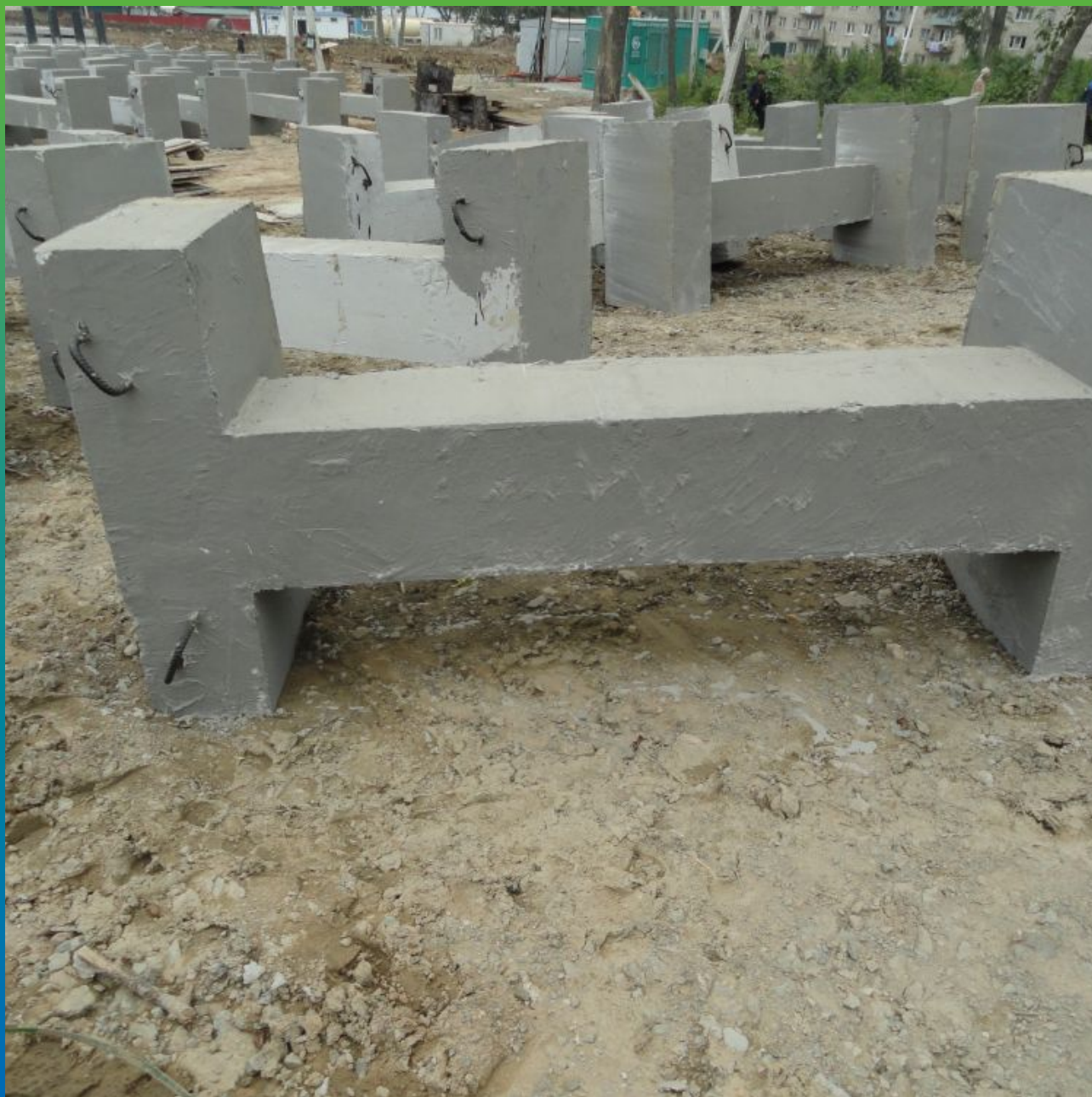
Морские пригрузки, гидроизолированные составом Максил Супер в 2 слоя