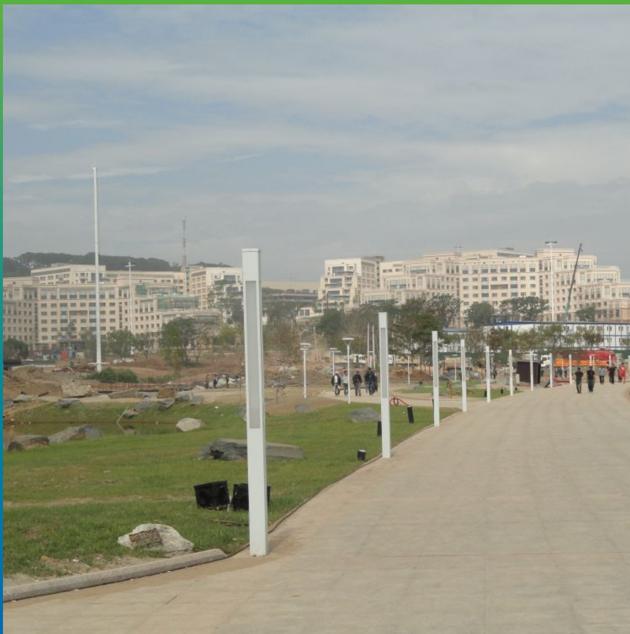
Вид на строящиеся корпуса