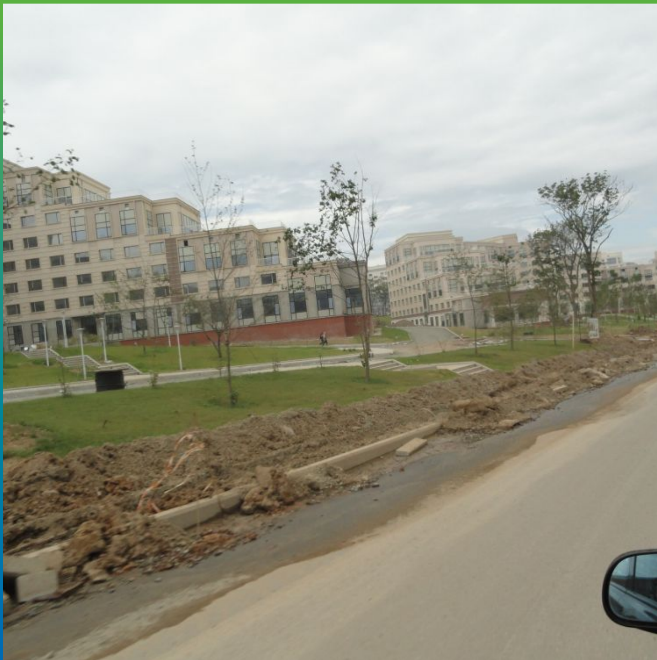
Построенные корпуса, этап благоустройства