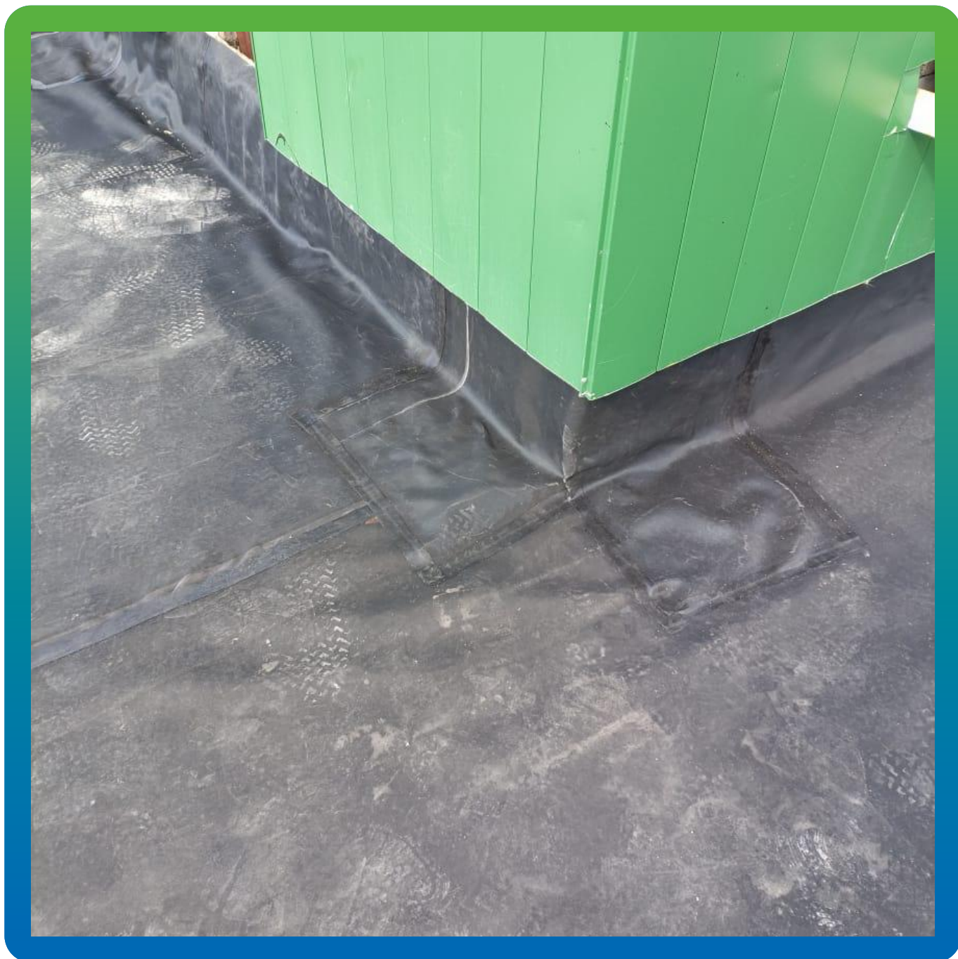
Монтаж примыканий на Манодил Бонд Ф