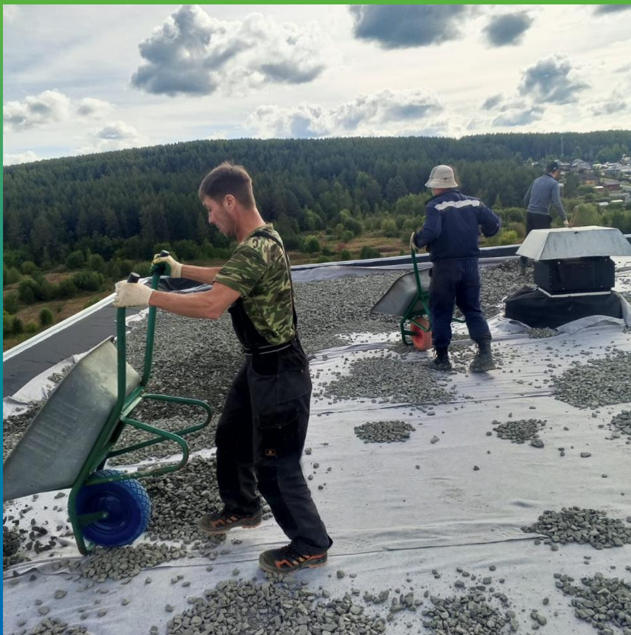
Присыпка ЭПДМ мембраны Преласты СТ балластом в виде щебня