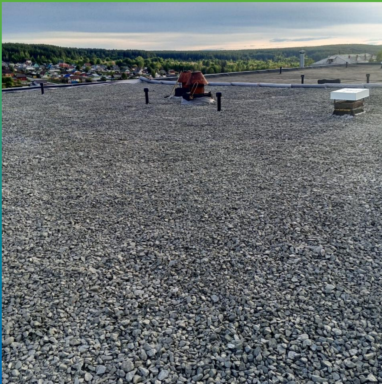
Вид кровли после монтажа ЭПДМ мембраны и присыпки балластом