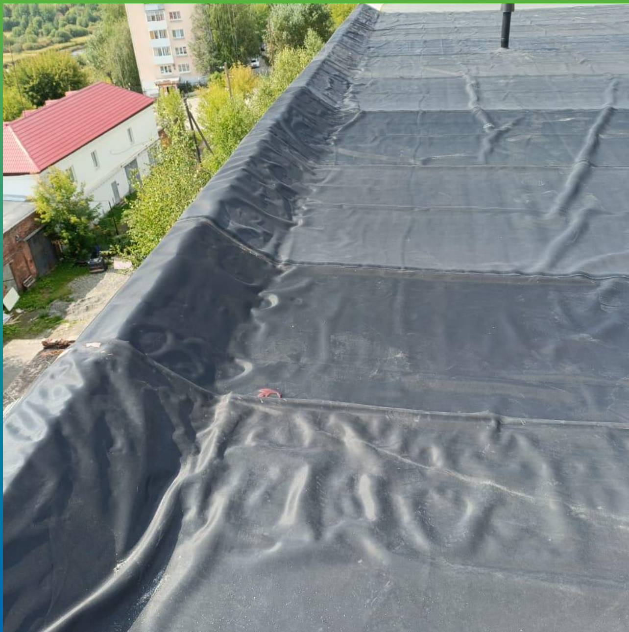
Монтаж ЭПДМ мембраны Прелести СТ