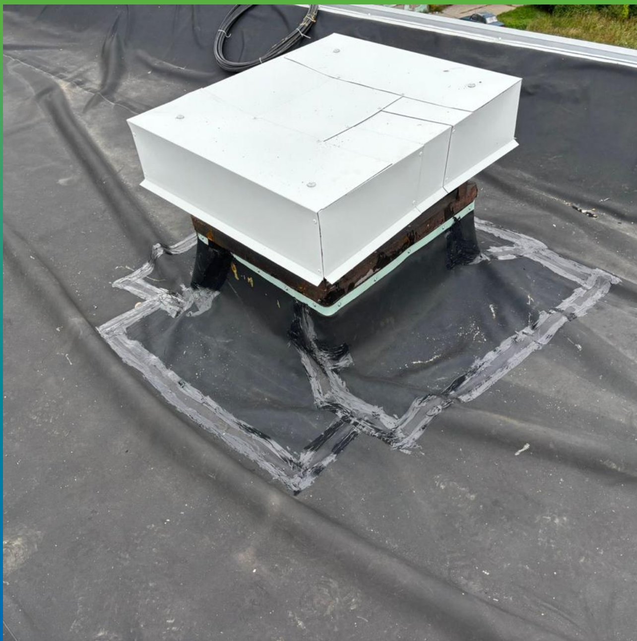
Монтаж элементов кровли на Манодил Бонд Ф