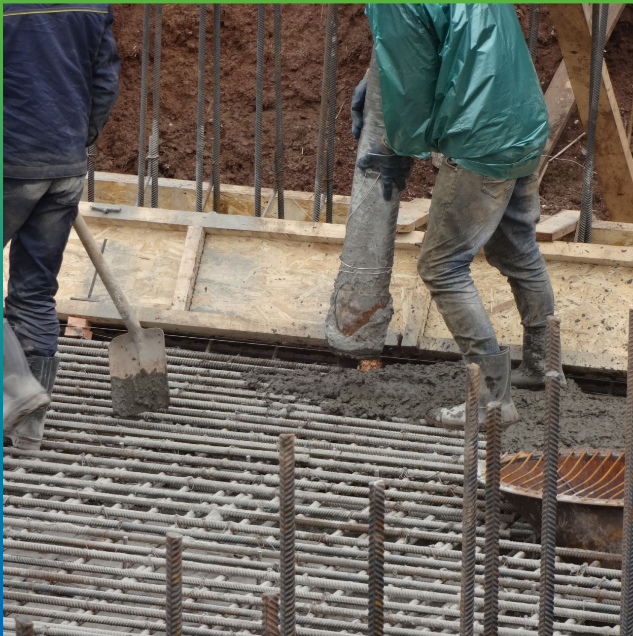
Приемка бетона на объекте