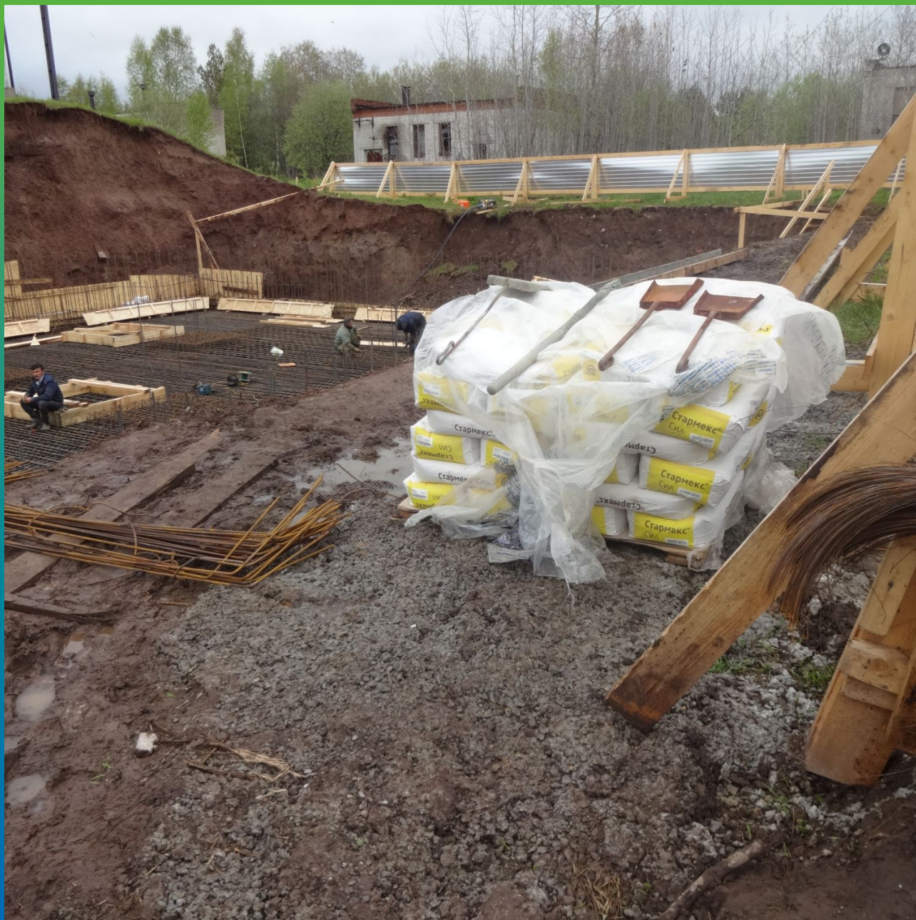
Подготовка к нанесению методом просыпки материала Стармекс Сил