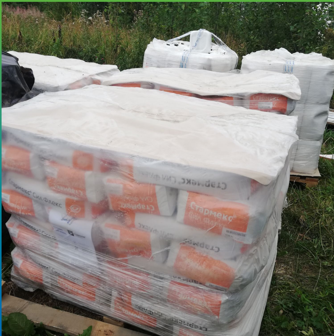
Материалы производства ООО "ГИДРОЗО" на объекте