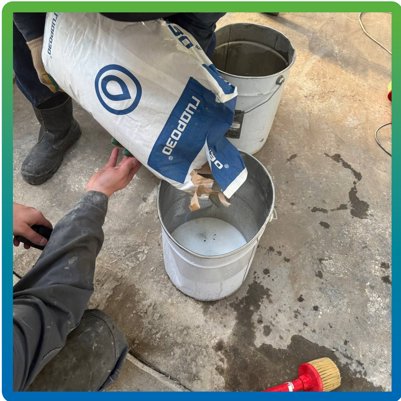
Смешивание компонентов эластичной гидроизоляции Стармекс Эласт