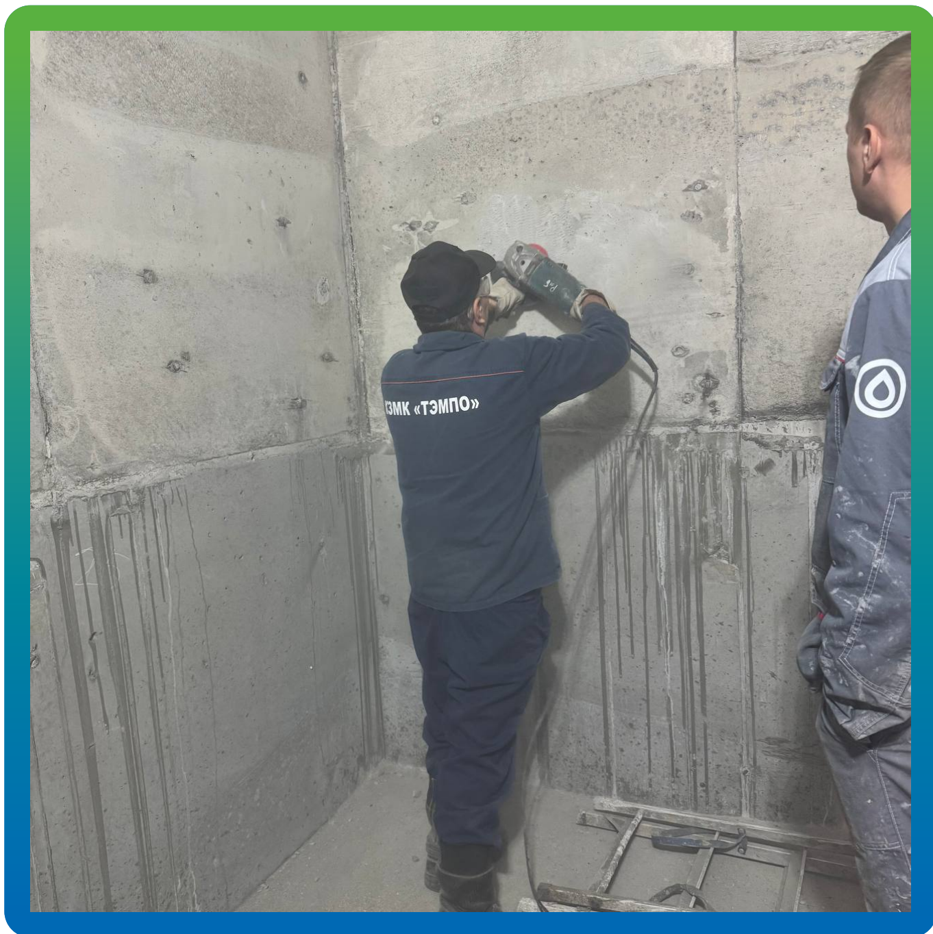
Подготовка поверхности основания