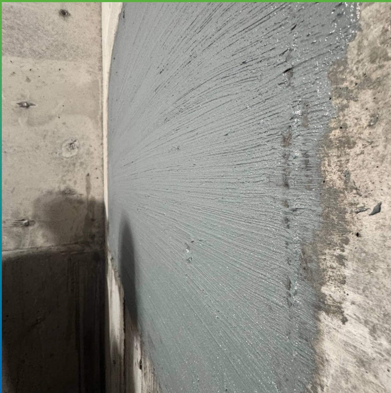
Внешний вид сразу после нанесения материала Стармекс Эласт