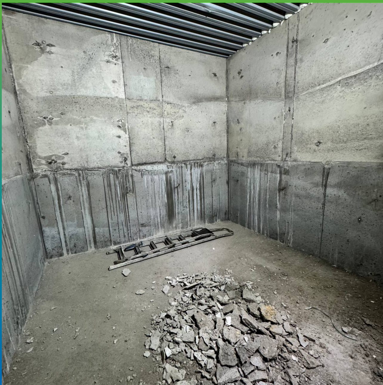
Заглубленная часть здания, требующая гидроизоляции