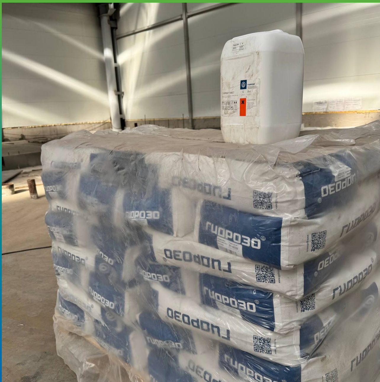
Материал производства "Гидрозо" на объекте