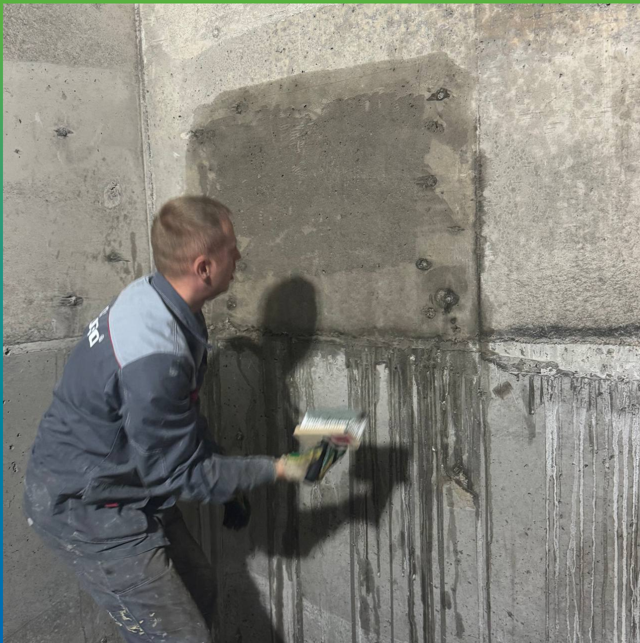
Увлажнение основания перед нанесением гидроизоляции