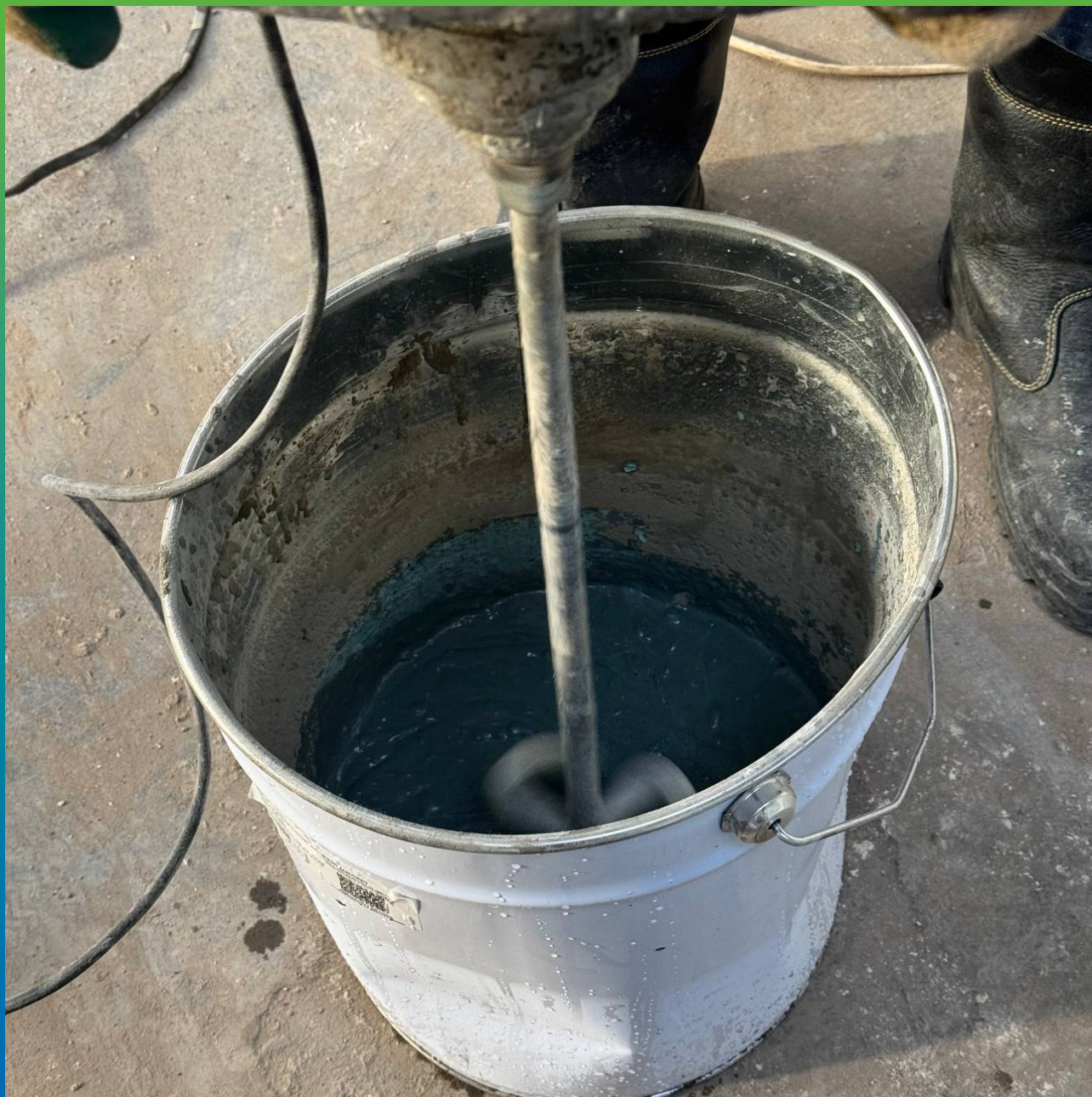
Подготовка к нанесению Стармекс Эласт